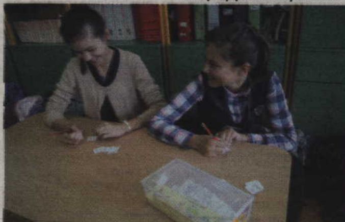
Swoich młodszych kolegów sprawdzały uczennice klasy VI.