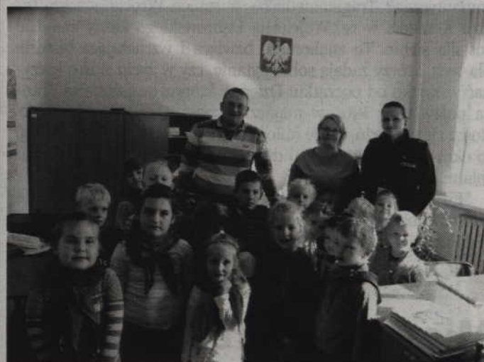
Przedstawiciele odwiedziły kwidzyńską Komendę Policji.