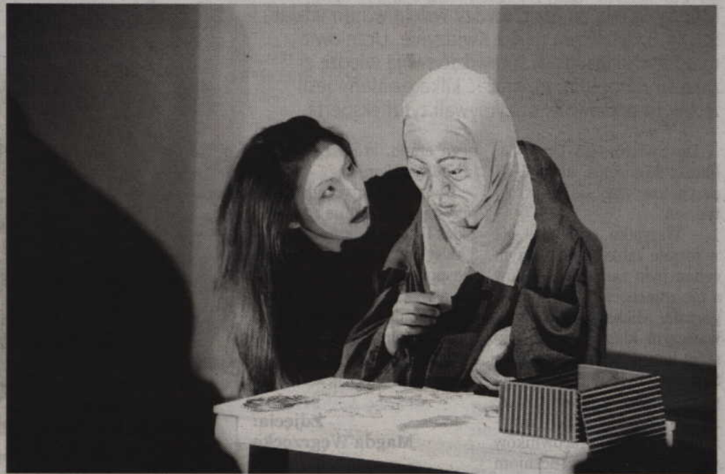
Japońsko-brytyjski spektakl „Urashima Taro” w wykonaniu Rouge28 Theatre zakończył tegoroczny 8. Międzynarodowy 12. Festiwal „Animo” w Kwidzynie.

W baśniowej scenerii rozgrywała się z kolei historia przyjaźni słonia, który chciał urosnąć i kwiatka o raczej narcystycznych skłonnościach. Do tego motylek zadający mnóstwo dziwnych pytań, oryginalna wręcz fauna i flora z dżungli rodem, świnia nie