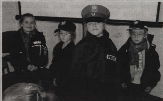
Jedną z atrakcji była możliwość przymiarki policyjnych mundurów.