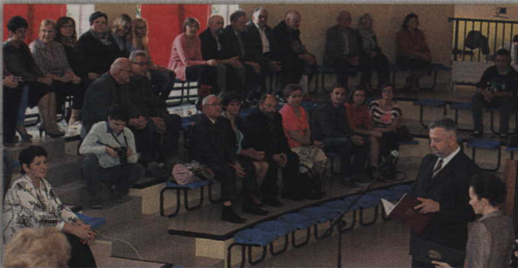
Uroczystości oficjalne odbyły się w szkolnym amfiteatrze.