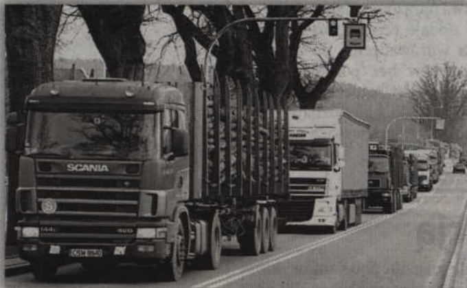
Wybudowanie obwodnicy Kwidzyna ma przede wszystkim zniwelować ruch samochodów ciężarowych na ulicach miasta.

-Na mapie planowanych obwodnic, które powstaną