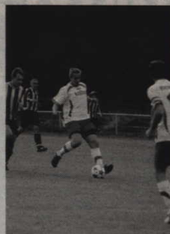
Piłkarze Rodła II Global Kwidzyn przegrali z Victorią Kaliska aż 1:5.