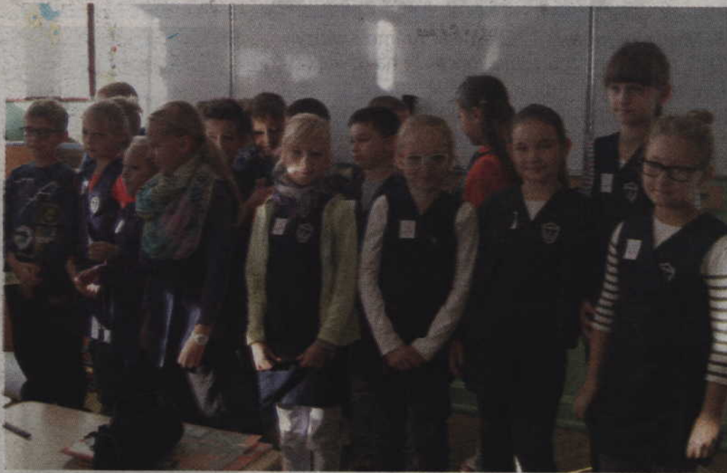
Klasa III e pobiła rekord jeśli chodzi o ekspertów z tabliczki mnożenia.