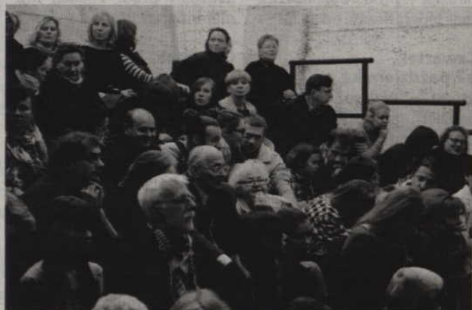
Przez pięć dni festiwalowych widzowie obejrzeni dziewięć spektakli, 1 koncert oraz trzy projekcje filmowe.