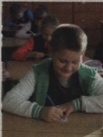
On chyba znał poprawne odpowiedzi...