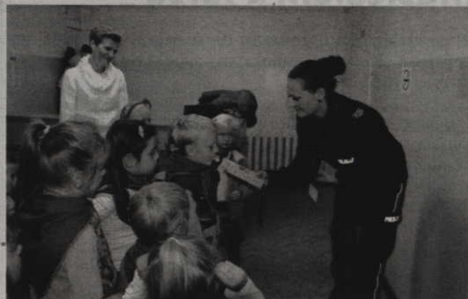
Maluchy podczas badania na alkomacie.