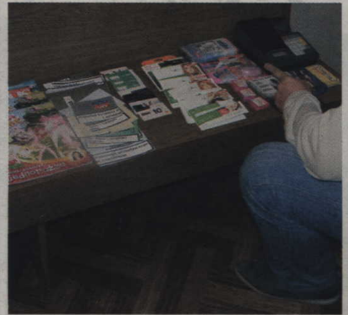
Skradzione rzeczy znalezione w domach zatrzymanych nastolatków.

- Jak ustalili funkcjonariusze do włamania doszło nad ranem, a łupem sprawców padły, m.in. tytoń, papierosy, karty do telefonów komórkowych, gumy do żucia oraz kasa fiskalna - wyjaśnia Bożena Schab, rzecznik prasowy Komendy Powiatowej Policji w Kwidzynie. - Pokrzywdzona strata oszacowała na prawie 10 tysięcy złotych.