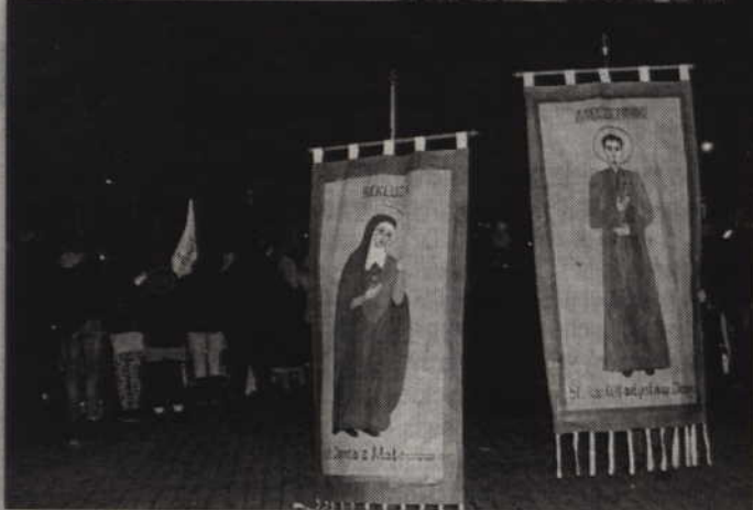
W kwidzyńskim orszaku nie zabrakło wspomnień bł. Doroty oraz bł. ks. Demskiego.