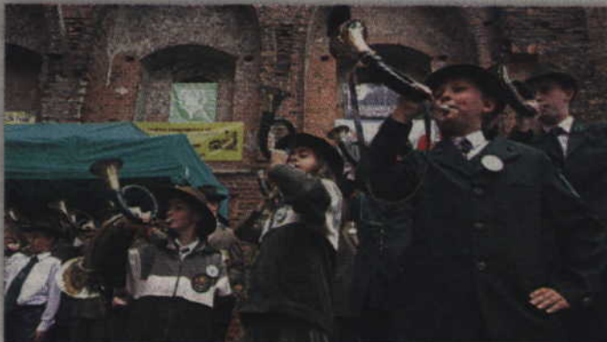
Tegoroczne uroczystości hubertusowskie odbędą się na dziedzińcu kwidzyńskiego zamku.

Starosta Kwidzyński oraz Powiatowa Rada Łowiecka zaprasza na powiatowe uroczystości Hubertusa 2013. Świętowanie sympatyków łowiectwa odbędzie się w niedzielę, 10 listopada na dziedzińcu zamkowym w Kwidzynie. Organizatorem Hubertusa 2013 jest natomiast kwidzyńskie Koło Łowieckie „Knieja”.