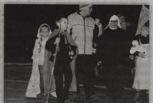
Barwny korowód zakończył swoją drogę w kościele pw. św. Jana Ewangelisty.