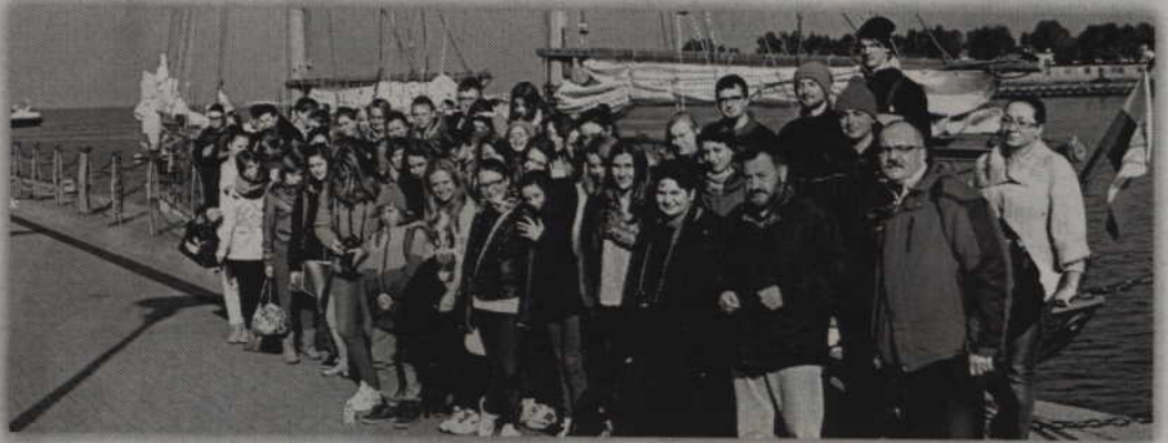
Gimnazjaliści z Wandowa przed żaglowcem „General Zaruski”.

Zatoce Gdańskiej na żaglowcu „General Zaruski” - dodają opiekunowie grupy. - Uczniowie podzielili na wachty odpowiadali za podnoszenie żagli. Z zaciekawieniem wysłuchali