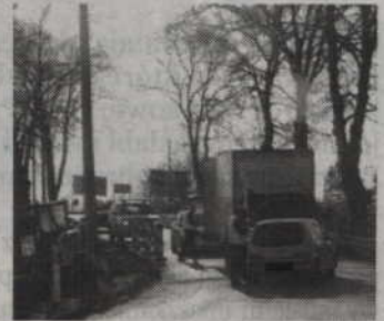
Do zderzenia dwóch aut doszło na ul. Wojska Polskiego w Prabutach.

Mundurowi zabezpieczyli miejsce zdarzenia, wykonali