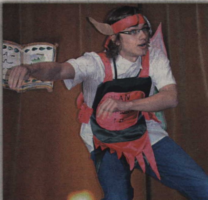
Układ choreograficzny też miał znaczenie.