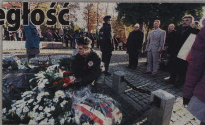
Uroczystości rocznicowe rozpoczną się od złożenia kwiatów na Grobie Nieznanego Żołnierza.

Przewodniczący Rady Powiatu Kwidzyńskiego oraz Starosta Kwidzyński zapraszają wszystkich mieszkańców na uroczyste obchody 95. rocznicy odzyskania przez Polskę niepodległości. Obchody tradycyjnie już rozpoczną się od spotkania na Skwerze Kombatantów przy ul. Warszawskiej (poniedziałek, 11 listopada).