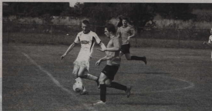
Porażka 11:0 pozostanie chyba niechlubnym rekordem Wisły.