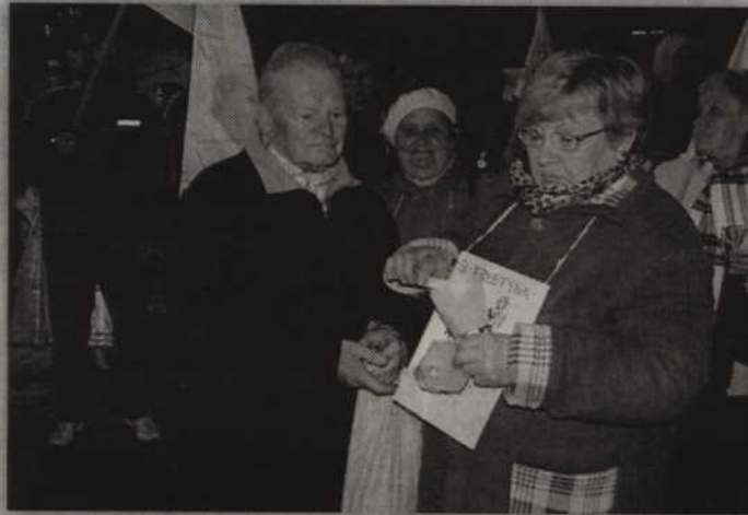
Uczestnicy marszu przygotowali m.in. wizerunki swoich patronów.

II Korowód Świętych i Błogosławionych rozpoczął się od mszy świętej z relikwiami świętych sprawowanej w kościele pw. Św. Trójcy w Kwidzynie. Po nabożeństwie, na placu przed kościołem, wierni obejrzeli pokaz fireshow, a następnie radosny korowód przeszedł ulicami miasta do katedry. Tam marsz zakończył się litanią do Wszystkich Świętych oraz rozstrzygnięciem konkursu na najlepsze przebranie za świętych patronów. (fox)