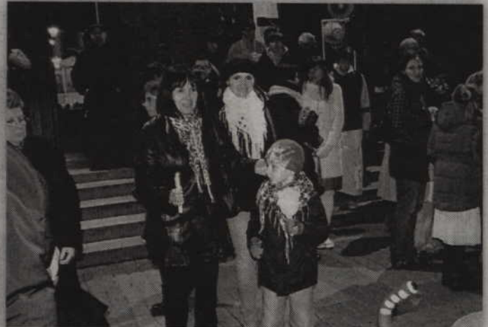
Nie zabrakło również świec i lampionów.