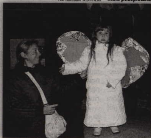
Wśród uczestników marszu pojawił się również anioł.