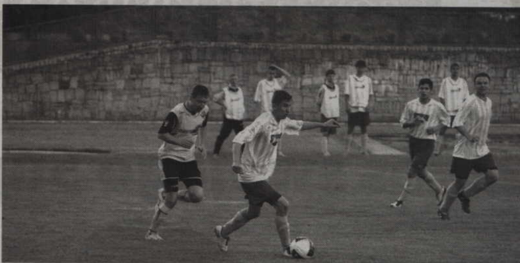
Wygrana nad Nowym Stawem jest już 8 zwycięstwem Rodła w tym sezonie.

-Stworzyliśmy sobie kilka naprawdę fajnych akcji i żał, że byliśmy tak nieskuteczni - mówi trener Rodła. - Wynik