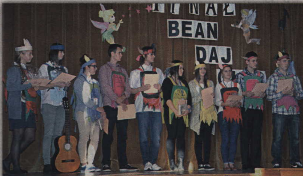
Pierwszoklasiści z I LO prezentowali swoje liczne talenty podczas konkursu pod hasłem "Bean, daj głos."