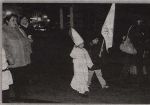
Efektowne przebranie jednego z uczestników marszu.