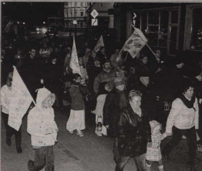
Uczestnicy II Korowodu Świętych i Błogosławionych.