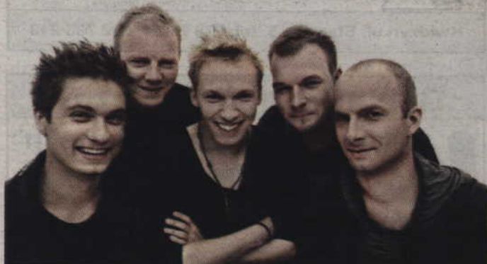
Grupa LemON, zwycięzca telewizyjnego show Must Be The Music, 29 listopada zagrają w Kwidzynie.

Bijąca rekordy popularności grupa LemON w listopadzie odwiedzi Kwidzyn. Zespół wystąpi 29 listopada o godz. 20 w hali widowisko-sportowej przy ul. Wiejskiej. Bilety na koncert (40 zł) można kupić w kasach teatru lub hali oraz za pośrednictwem portali www.kupbilecik.pl lub www.biletyna.pl .