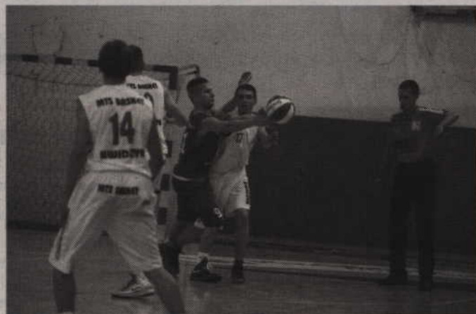
Porażka w Gdańsku jest trzecim przegrany meczem Basketu w tym sezonie.

Koszykarze gdańskiej Politechniki wprost rozbili w pył drużynę MTS Basket. Kwidzynie ulegli bowiem gospodarzom aż 102:38 nawiązując walkę właściwie tylko w drugiej kwarcie tego spotkania. Po trzech rozegranych kolejkach rozgrywek o awans do II ligi mężczyzn Basket z trzema porażkami na koncie plasuje się na VII pozycji.