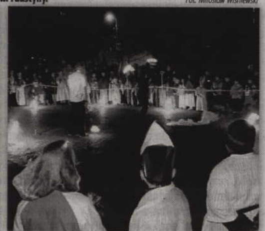
Pokaz fireshow zaprezentowano na placu przed kościołem Św. Trójcy.