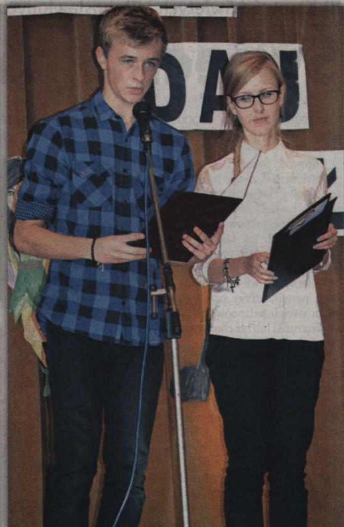
Młodszych kolegów oceniali tegoroczni maturzyści.

Elfy na korytarzach I Liceum Ogólnokształcącego, czyli o tradycji która przetrwała ponad 70 lat!