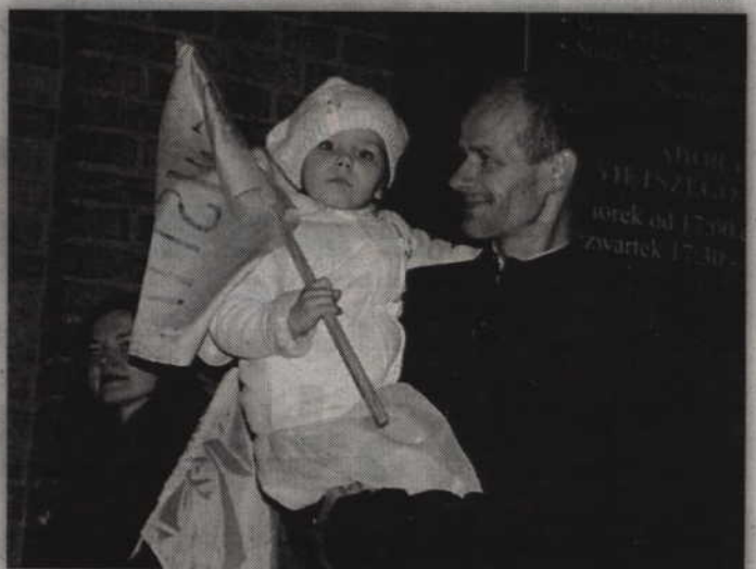
Mała podopieczna św. Faustyny.