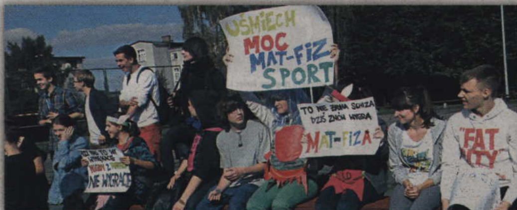
Raz na scenie, raz na boisku - bean nie ma łatwego życia.