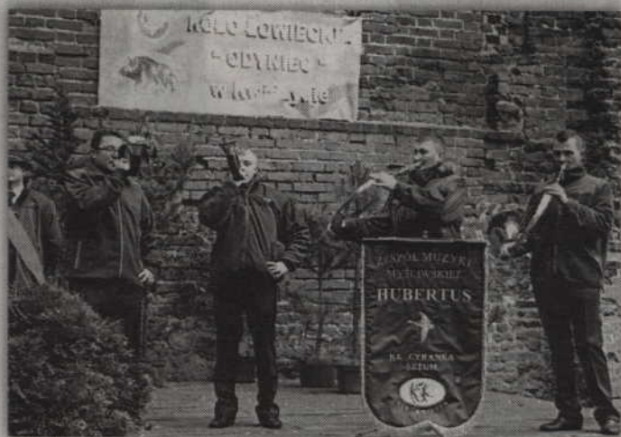
O oprawę muzyczną spotkania zadbał Zespół Muzyki Myśliwskiej „Hubertus”.

Medale „Za Zasługi dla Łowiectwa Elbląskiego Okręgu