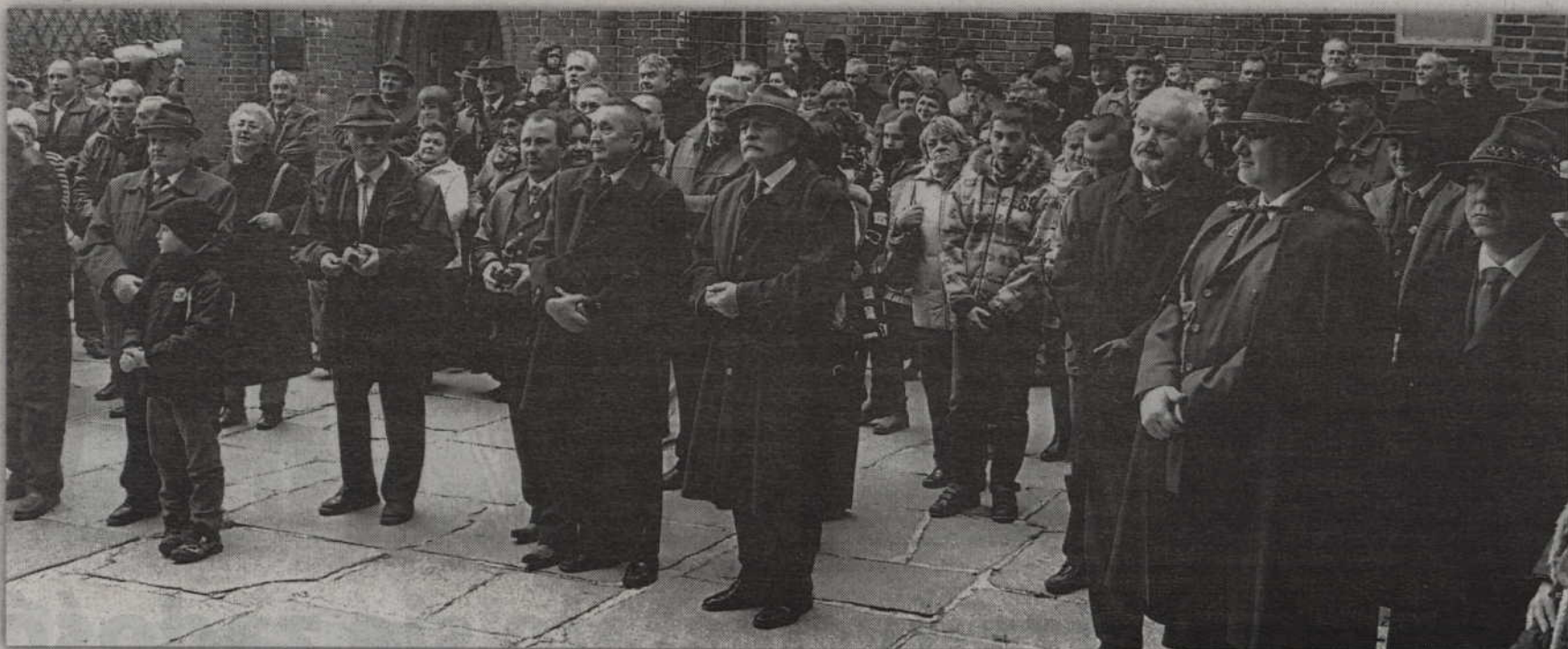
Oficjalne uroczystości hubertusowskie odbyły się na dziedzińcu zamkowym.