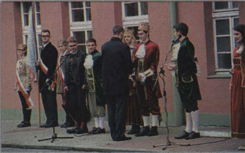
Kwidyn Wielki przyjmuje insygnia władzy.