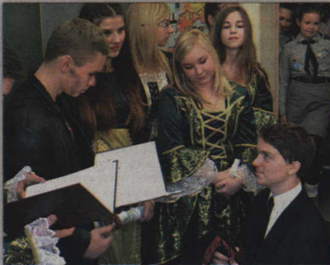
Asinus sprawdza wiedzę beanów. Tu pomóc może tylko "Modlitwa do Asinusa".

- Okres tak zwanego beañstwa w I LO sięga czasów, gdy w tym samym budynku funkcjonowało w latach 1937-1939 Polskie Gimnazjum. Przed wojną wypracowano tradycje i obrzędy, które są teraz pieczołowicie kultywowane. Udział w przygotowaniu świty biorą po raz pierwszy, zaś drugi rok jestem opiekunem Samorządu Szkolnego. W tym roku zajęłam się przygotowaniem świty do uroczystego apelu, podczas którego dyrektor szkoły Ma-