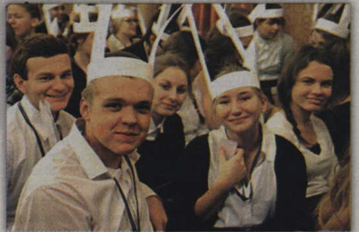
Beanem fajnie być, tylko te uszy... Uczniowie klasy pierwszej oczekujący na chrzest.

niem, które rozgrywa się w murach szkoły w godzinach popołudniowych; tak też było i tym razem: wieczorna frekwencja widzów ciekawych tegorocznego kabaretu w wykonaniu maturzystów świadczyła o niesłabnącym zainteresowaniu tą formą rozrywki. Całości dopeł-