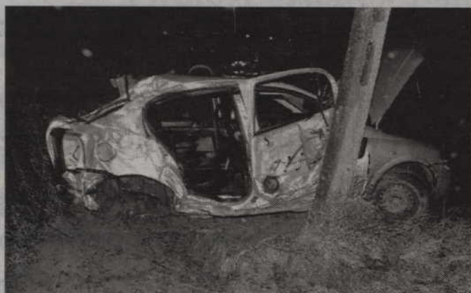
W wyniku obrażeń śmierć na miejscu poniósł 18-letni pasażer astry. Kierowca i drugi pasażer, z ogólnymi obrażeniami ciała, trafili do szpitala.

Osiemnastoletni pasażer zginął na miejscu, a dwóch innych jadących autem trafiło do szpitala, w wyniku wypadku do jakiego doszło w Trumiejkach (gm. Prabuty). Kierujący opłem astra stracił bowiem panowanie nad pojazdem i uderzył w drzewo, a następnie w stęp energetyczny. Policja bada wszystkiego okoliczności tego zdarzenia.