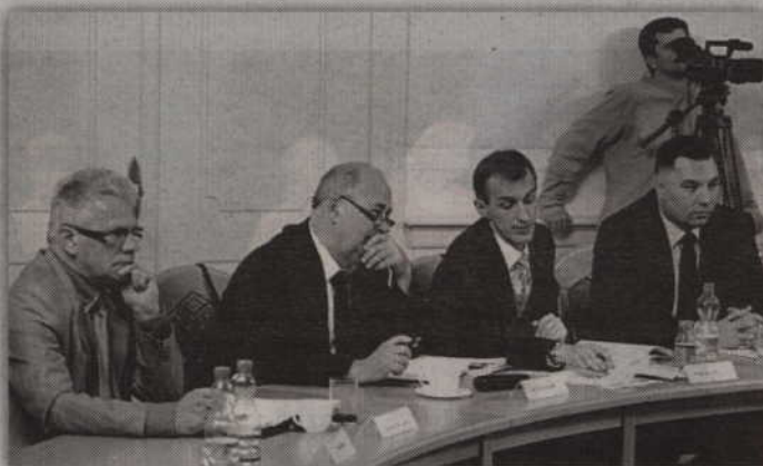
Radni opozycji zagłosowali przeciwko podwyżkom podatku od nieruchomości.