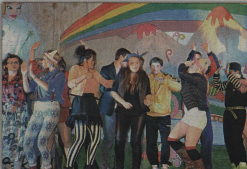
Kabaret roztańczony i rozśpiewany.