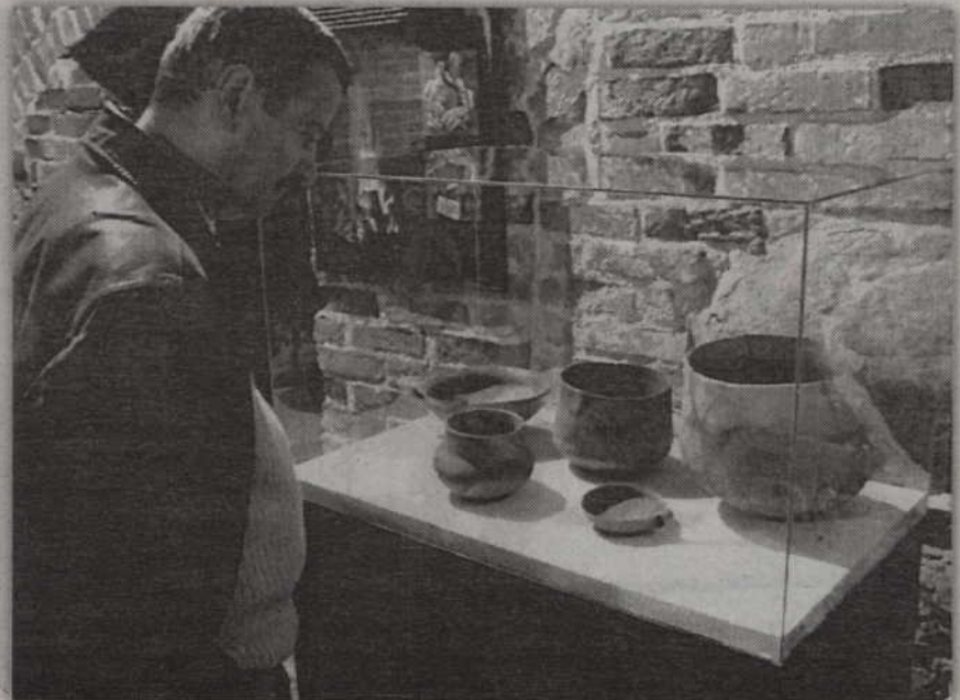
Na wystawie zaprezentowano przede wszystkim popielnice czyli naczynia, do których składowano szczątki zmarłych.