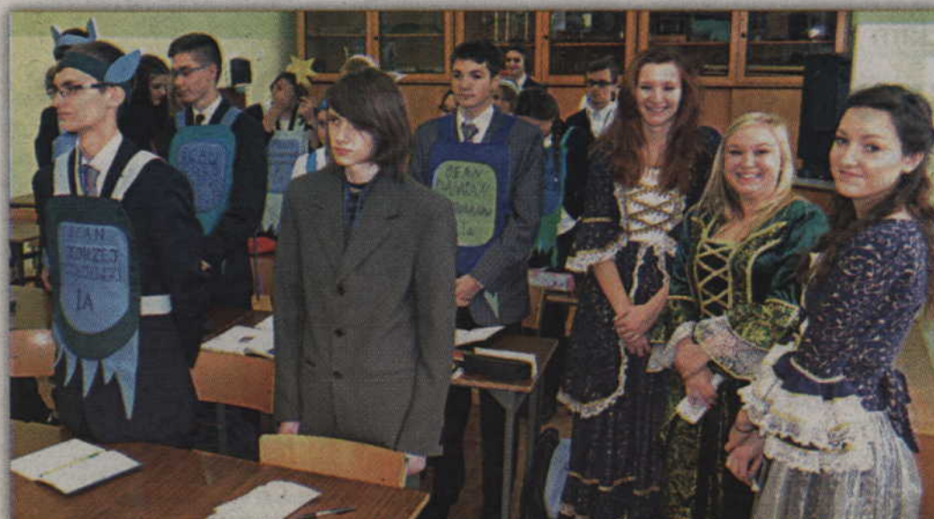
Świta w towarzystwie beanów, którzy nie zostali jeszcze ochrzczeni.