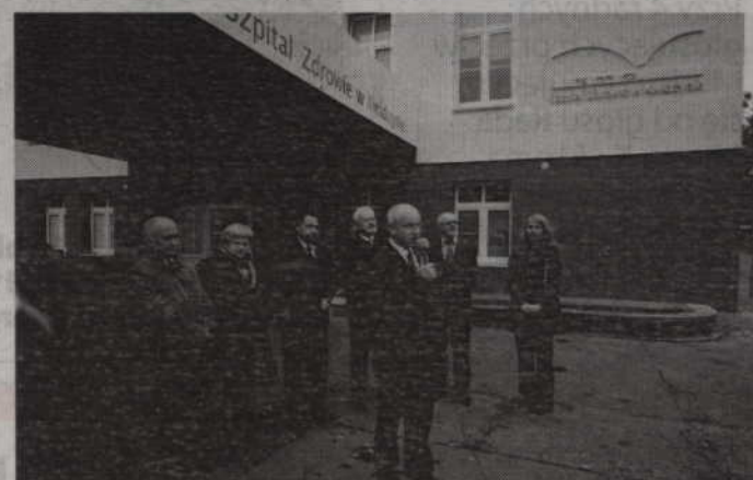
Bezpłatne badania RTG klatki piersiowej to wspólne przedsięwzięcie Starostwa i szpitala w Kwidzynie.

Badania wykonywane będą w Zakładzie Diagnostyki Obrazowej „Zdrowie” znajdującym się przy ul. Hallera w Kwidzynie. Po badaniu radiologicznym każdy pacjent otrzyma zdjęcia na nośniku cyfrowym wraz z opisem. W przypadku stwierdzenia nieprawidłowo-