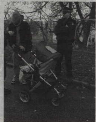
Pijany rodzic został zatrzymany przez kwidzińską Straż Miejską.

Jeśli okaże się, że mieszkaniec Kwidzyna swoim zachowaniem mógł doprowadzić do zagrożenia życia i zdrowia dziecka, może mu grozić nawet do 5 lat pozbawienia wolności. - Każdy sygnał o pijanych rodzicach opiekujących się dziećmi jest błyskawicznie sprawdzany przez policjantów - dodaje rzecznik KPP Kwidzyn. - Gdy tylko się potwierdzają, najmłodszy natychmiast otaczani są troskliwą opieką, zaś wobec dorosłych wyciągane są konsekwencje.