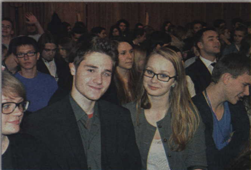
Na uroczystość chrztu beanów przybyli także absolwenci szkoły.