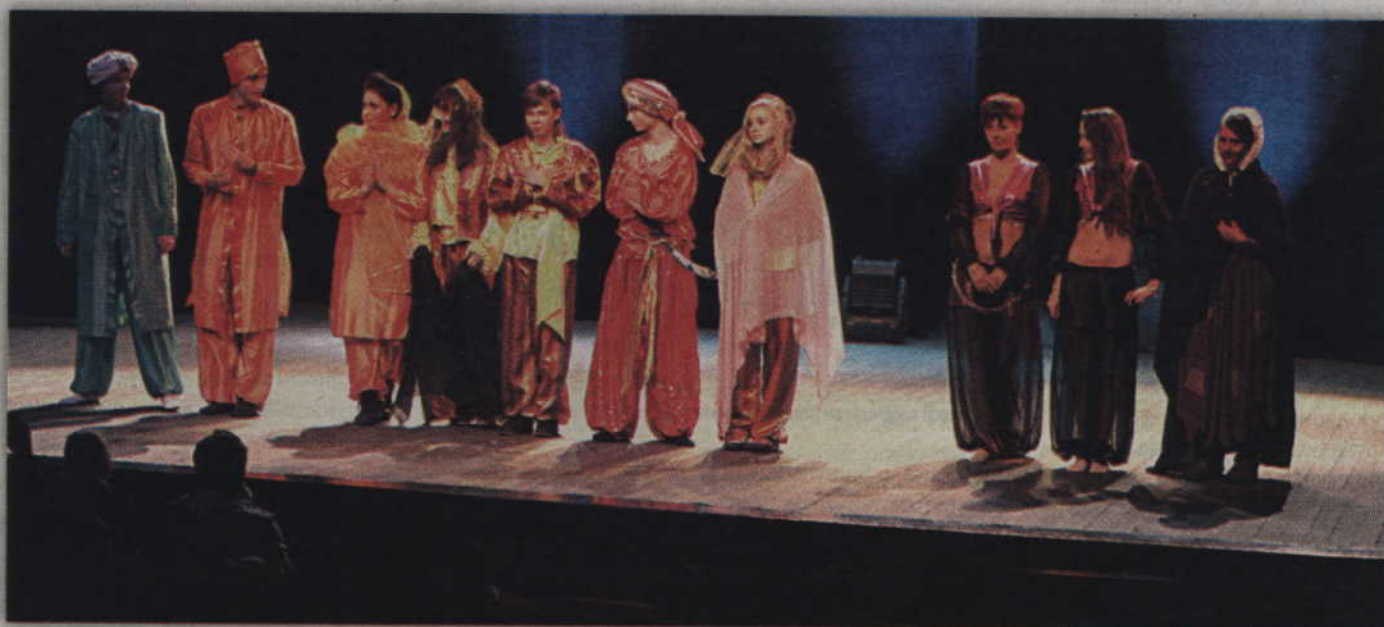
XXIII Teatralia rozpoczną się w najbliższy poniedziałek w kwidzyńskim teatrze.