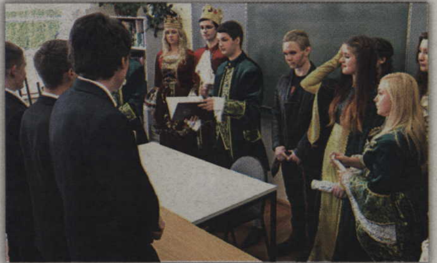
Historia szkoły jest długa, można więc długo odpytywać.

Święto Szkoły i chrzest beanów w I Liceum Ogólnokształcącym w Kwidzynie