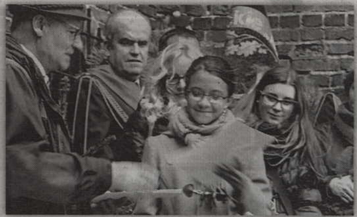
Uczniowie Społecznego Gimnazjum w Kwidzynie zwyciężyli w konkursie gimnazjalnym, w kategorii wiedzy.

- Prace przygotowane przez dzieci oglądać można w izbie myśliwskiej - mówi M. Wojtynowski. - Uczniowie włożyli w nie naprawdę bardzo dużo starań. Dzięki nim widzimy też jak postrzegają las i co jeszcze trzeba zrobić, aby usprawnić informacje o łowiectwie przekazywane w