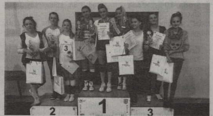
Zwycięzcy w kategorii dziewcząt rocznika 1998-2000. Na najwyższym podium Siatkareczki z Kwidzyna.

W kategorii chłopców rocznika 2001 i młodsze rywalizowało 9 drużyn, które podzielono na trzy grupy eliminacyjne. Po rozegraniu spotkań systemem każdy z każdym, trzy najlepsze drużyny trafiły do grupy finałowej. W niej PSP 6 II Starogard Gdański uległ PSP 6 I Starogard Gdański 14:25, SP Tychnowy przegrał z PSP 6 I