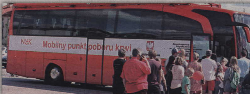
Podczas akcji „Zbieramy krew dla Polski” mieszkańcy Kwidzyna oddali prawie 8 litrów krwi.