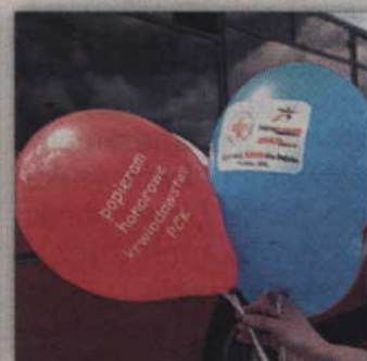
Akcja „Zbieramy krew dla Polski” to wspólne przedsięwzięcie Grupy Muszkieterów i Polskiego Czerwonego Krzyża.

wego PCK w Kwidzynie. – Warto podkreślić, że z roku na rok jest coraz więcej chętnych aby oddawać krew. W ubiegłym roku 10 osób oddało 4,5 litra krwi. W tym roku liczba ta jest prawie dwukrotnie większa, bo oddano prawie 8 litrów. Nawet po zamknięciu listy nadal zgłaszali się kolejni zainteresowani. W sumie było ich ponad 60 osób, ale niestety, byliśmy ograniczeni czasowo i nie mogliśmy ich już przyjąć.