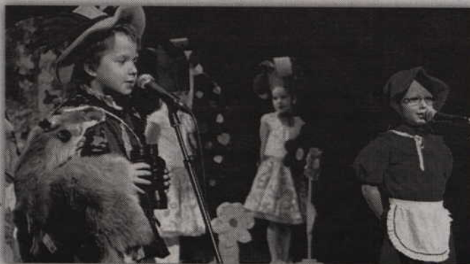
W weekend scena kwidzyńskiego teatru będzie należała do przedszkolaków. Występy najmłodszych zakończą tegoroczne Teatralia.