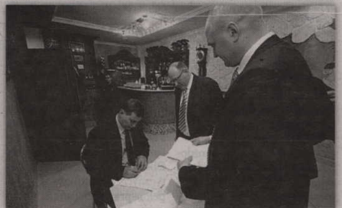
Komisja skrutacyjna liczy oddane głosy.