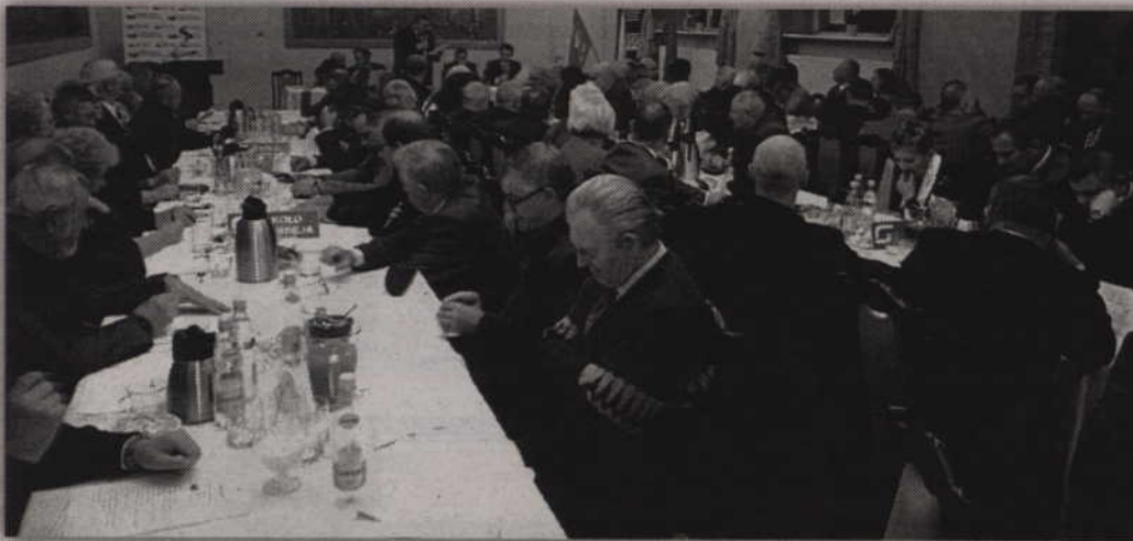
Delegaci powiatowi SLD spotkali się w kwidzyńskiej Restauracji "Miła".