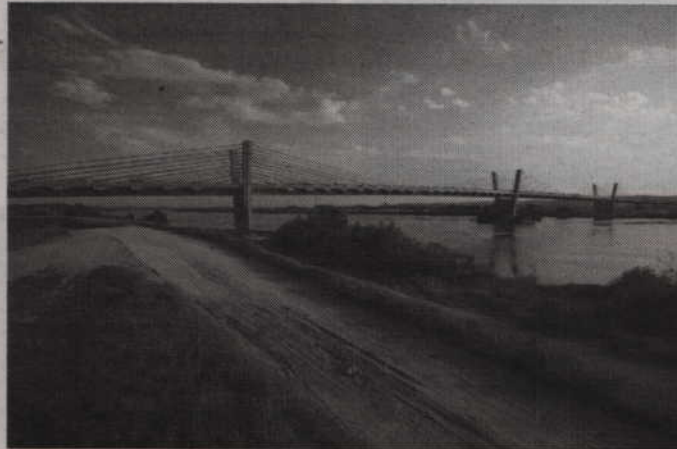
Most na Wiśle w Lipiankach łączy w swojej konstrukcji cechy mostu podwieszanego i mostu belkowego.

- Budowa mostu typu extradosed o tej skali to pionierska realizacja na skale europejską, a nawet światową – czytamy na stronie wykonawcy. - Dotychczas takie obiekty o porównywalnej rozpiętości przeszły w Japonii oraz Szwajcarii. Most typu extradosed łączy w sobie cechy mostu pod-