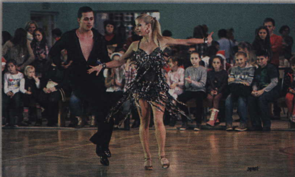
Pokazy tańca towarzyskiego w wykonaniu par KKT „Progress”.

- Za jedyne 2 zł można było wygrać m.in. słodycze, pluszowe misie, stroiki świąteczne, ale także strzyżenie czy doładowanie do telefonu – mówi Sylwia Kłos z Rady Rodziców. – Każdy los był pełen, więc chętnych nie brakowało.