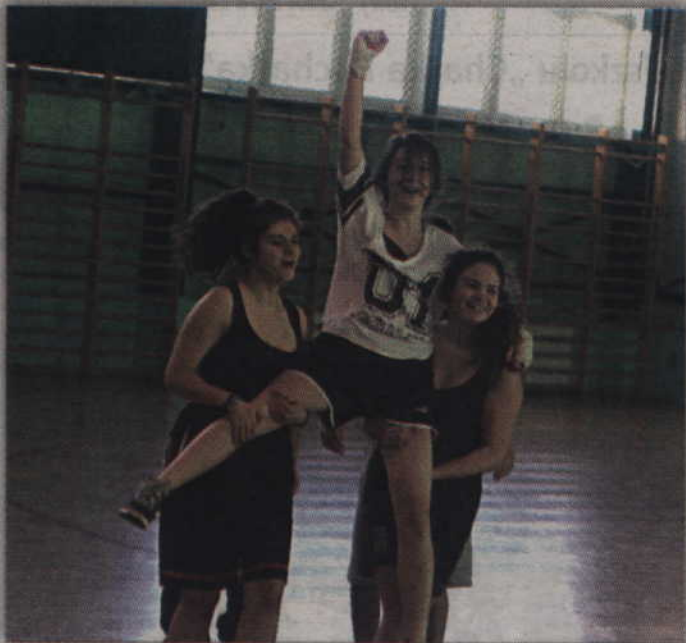
Nietypowy finał pokazów tanecznych „Loud Street Dance”.