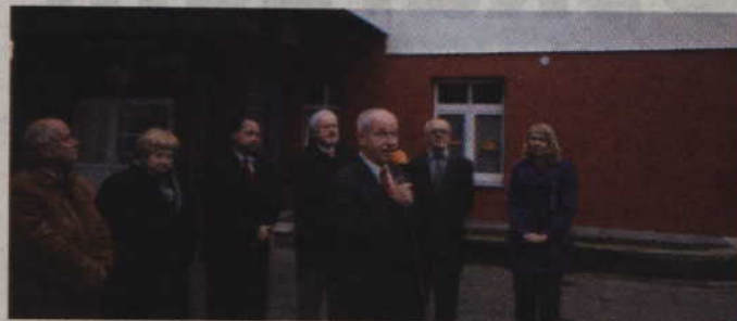
Szef NFZ w Gdańsku zapowiedział, że podczas przyznawania kontraktów preferowane będą ośrodki posiadające pełną ofertę leczenia. W podobnym tonie wypowiada się również nowy właściciel kwidzyńskiego szpitala, który zamierza postawić na rozwój poradni.