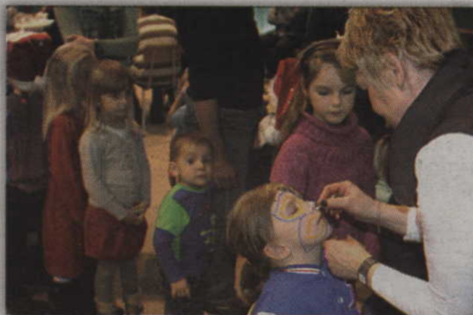
Do malowania twarzy maluchy ustawiły się w długą kolejkę.