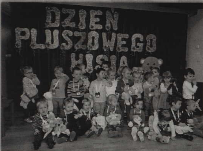
Na koniec imprezy na sztyl każdego malucha zawieszony medal przyjaciela pluszowego misia.

Przybyły miękkie i puchate, duże i małe, te brązowe, z łatką i bez - pluszowe misie. Maluchy z Przedszkola „Chatka Puchatka” wspólnie uczęły święto najwspanialszej zabawki, przytulanki, pocieszanki i najwierniejszego przyjaciela każdego dziecka. Każde z nich tego dnia przyniosło również swojego ukochanego pluszaka do przedszkola.