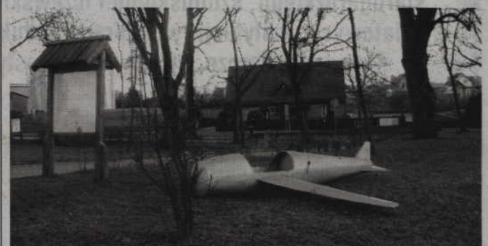
Stałym monitoringiem objęty będzie m.in. gardejski Park Małego Księcia.

Stadion, amfiteatr, Park Małego Księcia, a także tereny wokół ośrodka zdrowia i ośrodka pomocy społecznej znajdują się w obiektywach kamer. Już za kilka dni najważniejsze gardejskie miejsca będą bowiem na stałe monitorowane. Widok oka kamery na pewno odstraszy potencjalnych wandalów. Co jednak mają na to powiedzieć zakochane pary, które często na miejsce romantycznych spotkań wybierają np. amfiteatr nad jeziorem? Spotkanie w zasięgu wzroku przysłowiowego „Wielkiego Brata” nie każdemu może być na rękę.