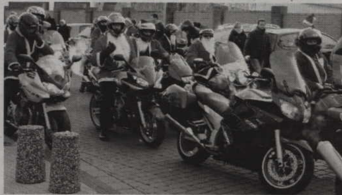
Kwidzyńscy motocykliści już po raz czwarty zbierają w ten sposób pieniądze dla potrzebujących.

dzieci oraz najbardziej potrzebne produkty. Poza tym udało nam się również zakupić dwa komputery do dwóch świetlic środowiskowych. W tym roku zbieramy natomiast pieniądze dla czterech świetlic środowiskowych z Kwidzyna. Chcemy zebrać pieniądze, aby wyposażyć te świetlice w odpowiedni sprzęt komputerowy oraz w to co jest w tych miejscach najbardziej potrzebne. Na pewno z zebranych pieniędzy zrobimy również świąteczne paczki dla dzieci - dodaje wiceprezes stowarzyszenia motokwidzyn.pl.