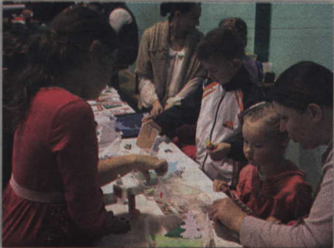
Za symboliczną złotówkę chętni mogli własnoręcznie wykonać kartkę świąteczną.