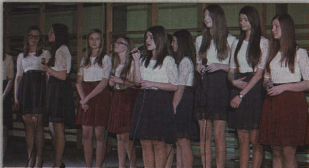
Głównym punktem wieczoru był koncert zespołu „Fantazja”.