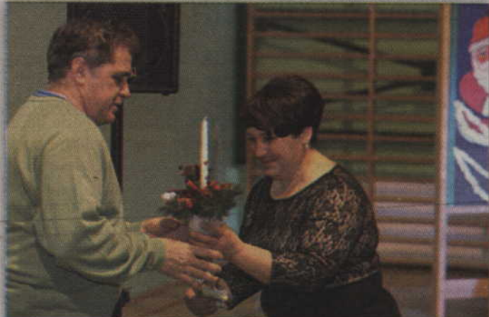
Najdroższy stroik podczas licytacji sprzedany został za 200 zł.