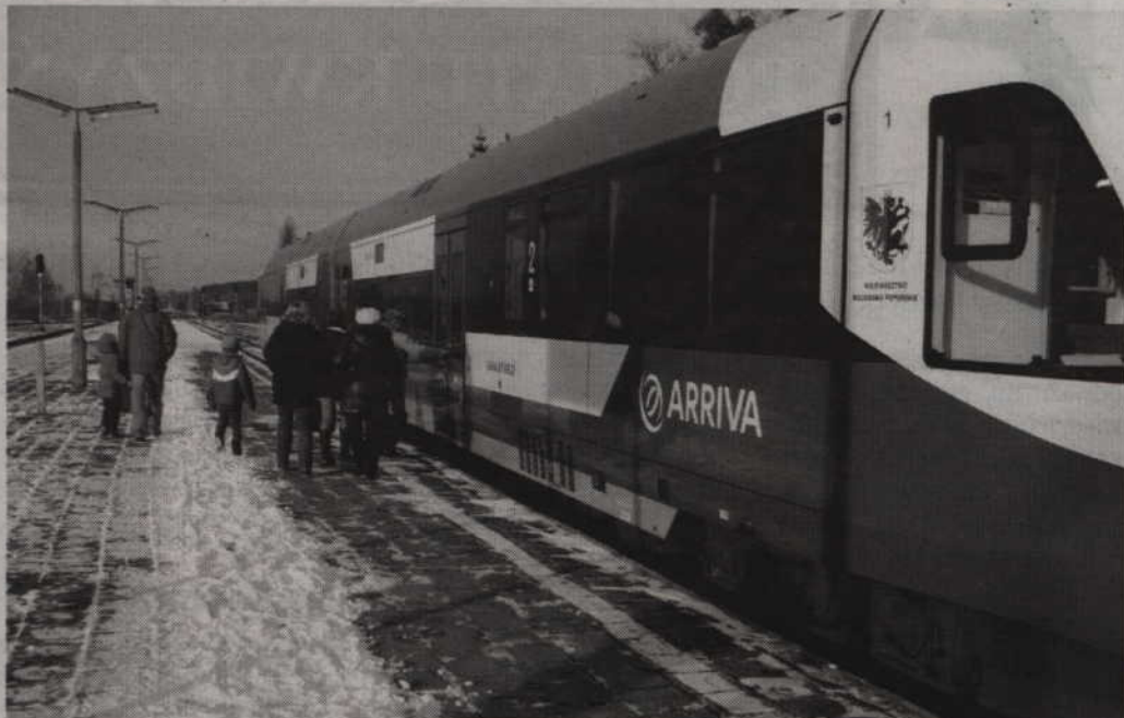
Szynobus Arrivy czekał na pasażerów pociągu relacji Kwidzyn – Gardeja. Niestety pociąg Przewozów Regionalnych nie dojechał na miejsce, a pasażerowie musieli trafić do Gardei własnym transportem.

-Wczoraj pociąg jechał do Torunia, a dziś już nie. Nasi kolejarze zrobili sobie chyba wolne. Moja córka, która studiuje w Toruniu zawsze o tej porze jeździła na uczelnię. Podobno jeszcze tak samo ma być w przyszłą niedzielę. Mam tylko nadzieję, że to wszystko szybko się unormuje. Sprawdzaliśmy wcześniej czy już jest nowy rozkład jazdy Arrivy, ale nie mogliśmy go znaleźć. Dobrze, że dziś jest w miarę ładny dzień, bo tu nawet nie ma gdzie się schować, wszystko