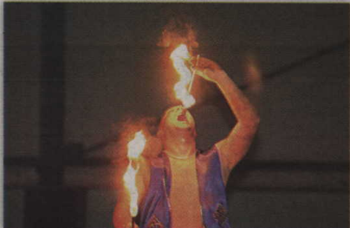
Efektowny pokaz połykania ognia zakończył tegoroczną imprezę mikołajkową w Sądlinkach.