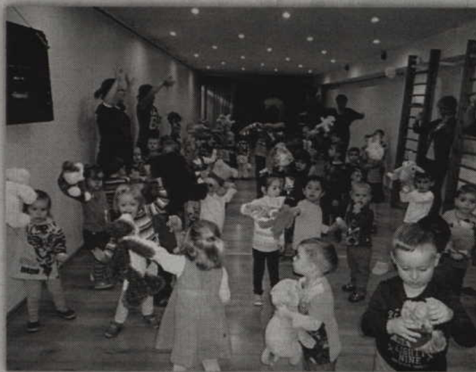
Wspólna zabawa przedszkolaków z pluszakami.

Taniec z pluszakami Po krótkiej lekcji historii dzieci udały się wspólnie z pluszakami do sali gimnastycznej, w której czekała na nie moc atrakcji. Hasłem przewodnim zabawy był okrzyk „Dziś w