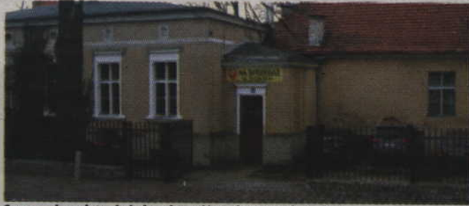
Samorząd powiatu zbył nieruchomość za ok. 460 tysięcy złotych.