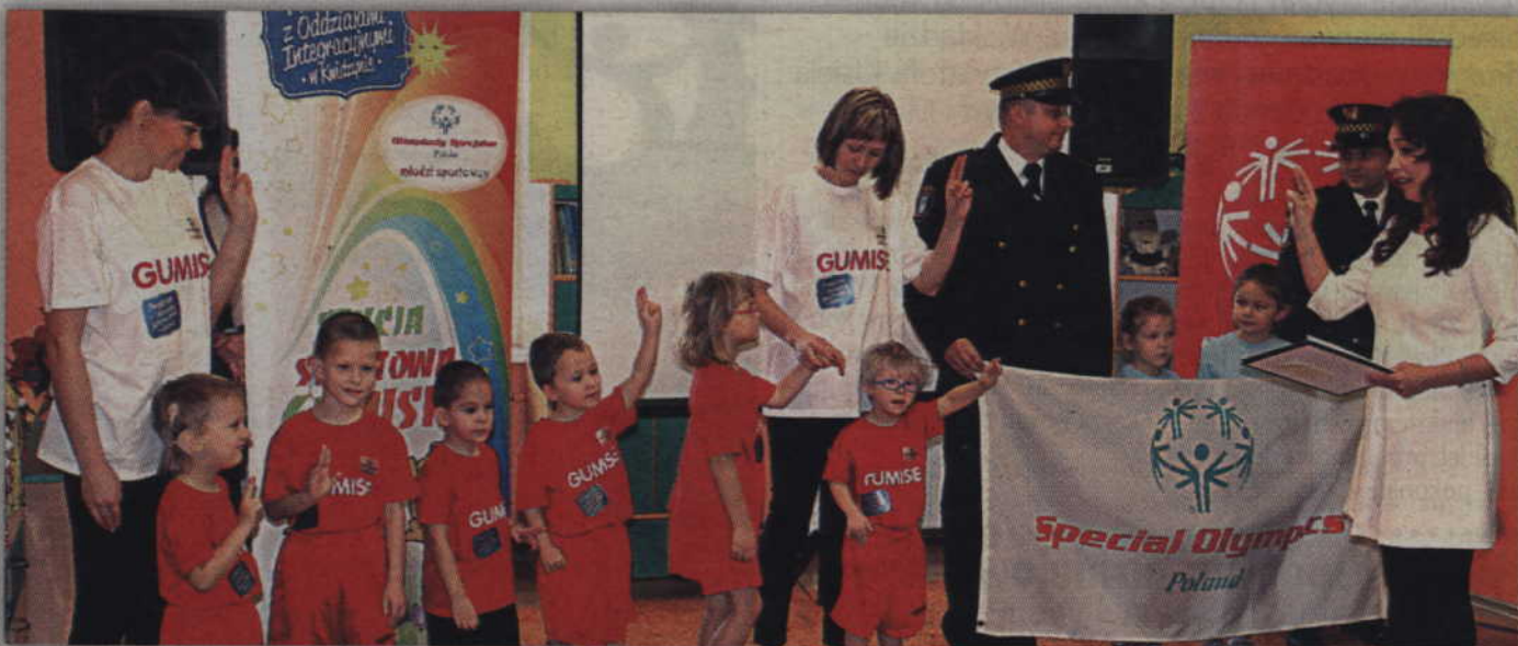
Klub Olimpiad Specjalnych Polska Pomorskie „Gumisie” powstał w Przedszkolu z Oddziałami Integracyjnymi w Kwidzynie.

- Czujemy się dumni włączeniem naszych dzieci w ten ciekawy program. Do klubu „Gumisie” włączone zostały dzieci z niepełnosprawnością intelektualną, które poprzez wzmoczone ćwiczenia fizyczne będą mogły rozwijać się intensywnie zarówno pod względem ruchowym, poznawczym i społecznym. Jeszcze w tym roku szkolnym poszerzona zostanie oferta przedszkola, aby zintensyfikować korzyści działania klubu. Dzieci będą uczestniczyć w zajęciach w pływalni miejskiej. Zwiększona zostanie ilość godzin hipoterapii. Chcemy także włączyć rodziny dzieci z niepełnosprawnością intelektualną do działania w ramach Pro-