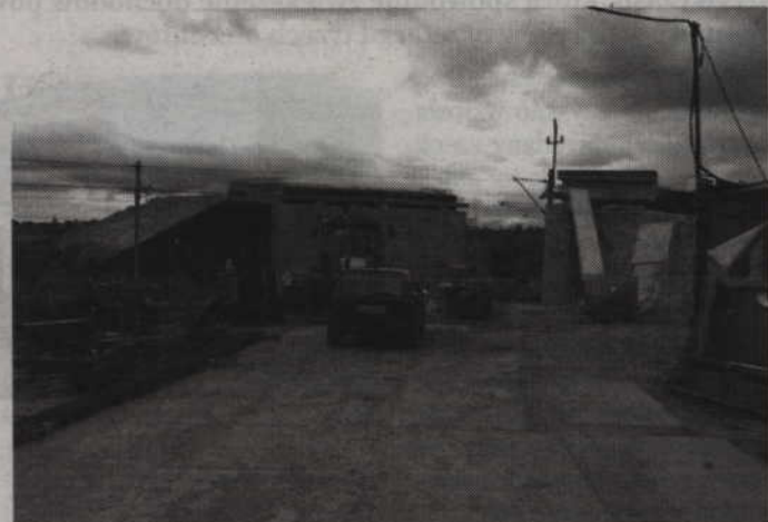
Asfalt na budowanym wiadukcie najprawdopodobniej położony zostanie dopiero na wiosnę.

- Nie zgadzam się z opinią, że w porę nie dostrzeżliśmy problemu, bo drogi zostały zniszczone w ciągu kilku godzin. Mogę zapew-