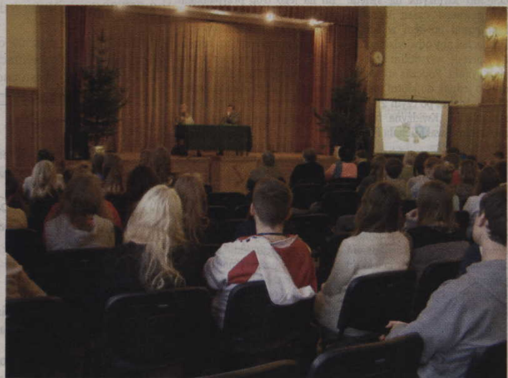
Spotkanie z pisarką odbyło się w Sali Rodła I LO w Kwidzynie.