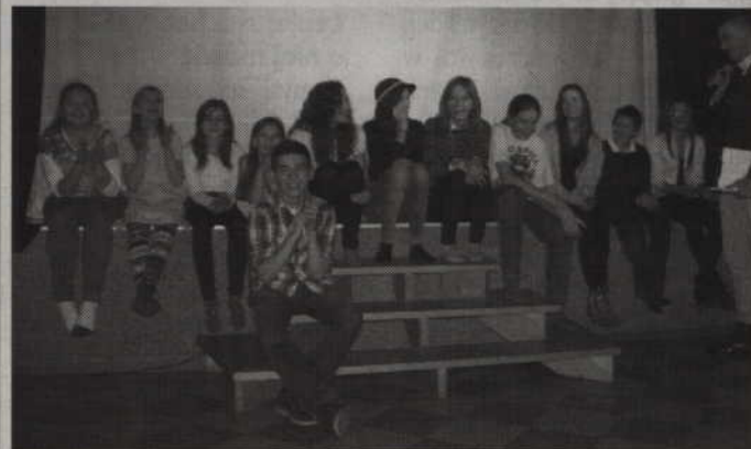
Grupa Teatralna z Rakowca.

Świąteczny szal zakupów jest już za nami. Duchowe przeżycia związane z narodzinami Jezusa Chrystusa też są wspomnieniem, a kiedy świąteczna atmosfera powoli przemija, bardzo często pojawiają się słowa: święta, święta i po świętach. Czy jednak w tak szybkim tempie przeżywania świąt nie tracimy ich prawdziwej magii? Właśnie o całkowicie przeciwnym spojrzeniu na święta Bożego Narodzenia postanowili opowiedzieć członkowie grupy teatralnej z Rakowca w przedstawieniu o przewrotnym tytule „Wieczór Wigilijny”.