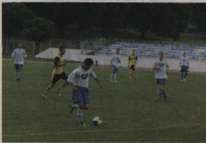
Piłkarze Rodła rozpoczną przygotowania już od najbliższego piątku.

Podczas przygotowań piłkarze rozegrają osiem meczy kontrolnych, a także wyjadą na tygodniowy obóz przygotowawczy. Pierwszy sparing kwidzynianie rozegrają już 18 stycznia z Polonią Gdańsk, a sprawdzanie formy zakończy starcie z Pomezianą Malbork zaplanowane na 8 marca.