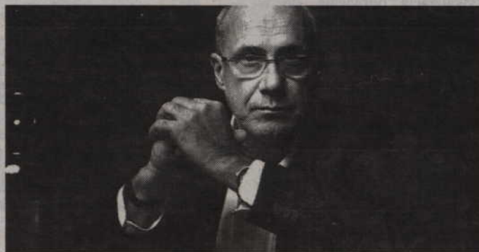
17 stycznia na scenie Kwidzyńskiego Centrum Kultury wystąpi Piotr Machalica.

- Wybrałem utwory, z któ- rymi się identyfikuje: o życiu, uczuciach, tęsknotach, samot- ności, szczęściu i nieszczęściu,