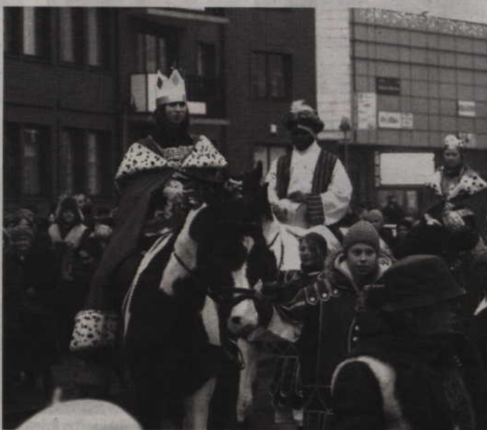
Barwny orszak Trzech Króli ponownie przejdzie ulicami Kwidzyna.

Orszak Trzech Króli wyruszy o godzinie 13.30 z placu Jana Pawła II. Następnie wierni przejdą ulicami miasta, aby zakończyć swój przemarsz na placu przed kościołem Świętej Trójcy. Organizatorzy zachęcają zarówno dorosłych, jak i dzieci do przygotowania efektownych strojów jasełkowych (pasterzy, aniołów, diabłów, księżniczek, królów,