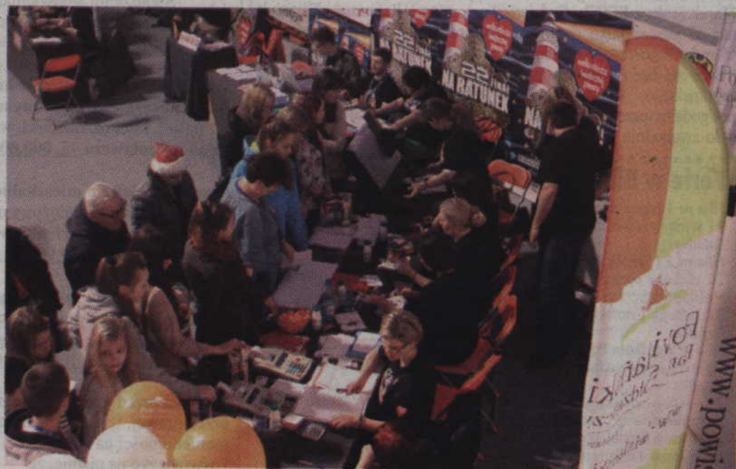
Panie z Powiślańskiego Banku Spółdzielczego skrupulatnie rozliczały wszystkich wolontariuszy.