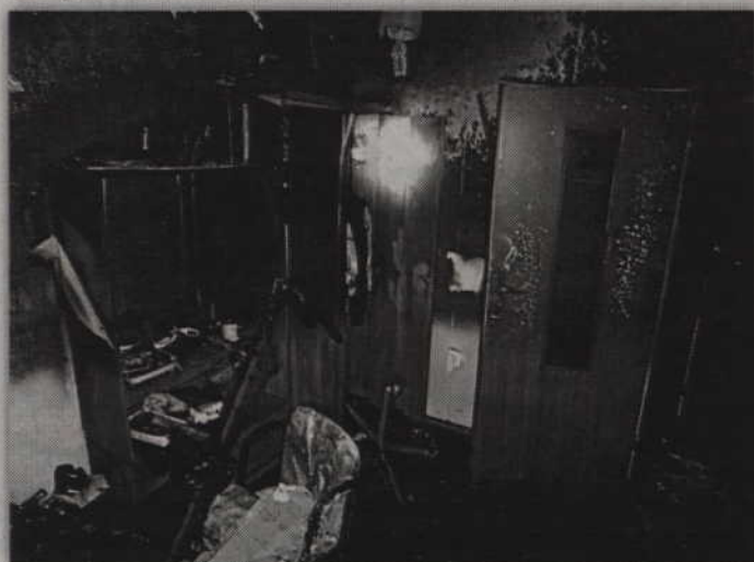
Pożar wybuchł w mieszkaniu znajdującym się na IV piętrze bloku przy ul. Polnej.

Na ok. 100 tys. zł oszacowano straty powstałe w wyniku pożaru jaki w niedzielę (12 stycznia) wybuchł w bloku przy ul. Polnej. Ogień pojawił się w mieszkaniu, znajdującym się na czwartym piętrze budynku. Na szczęście nikt nie ucierpiał.