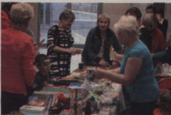
Stoisko Stowarzyszenia 50+ kusiło wszystkich przygotowanymi potrawami.