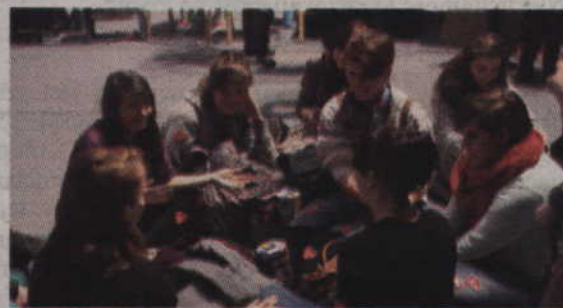
Wolontariusze w kolejce do rozliczenia swoich puszek.