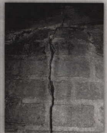
Widoczne pęknięcia na jednym z filarów mostu.

Według ekspertyzy, wykonanej przez specjalistyczną firmę z Gdańska, pęknięcia nie są groźne i z mostu można swobodnie korzystać. Aby powstrzymać dalsze pęknięcie filara eksperci zlecili jednak wykonanie spe-