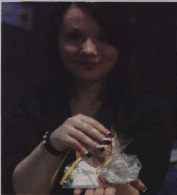
Gipsowe aniołki można było kupić za 2 zł.