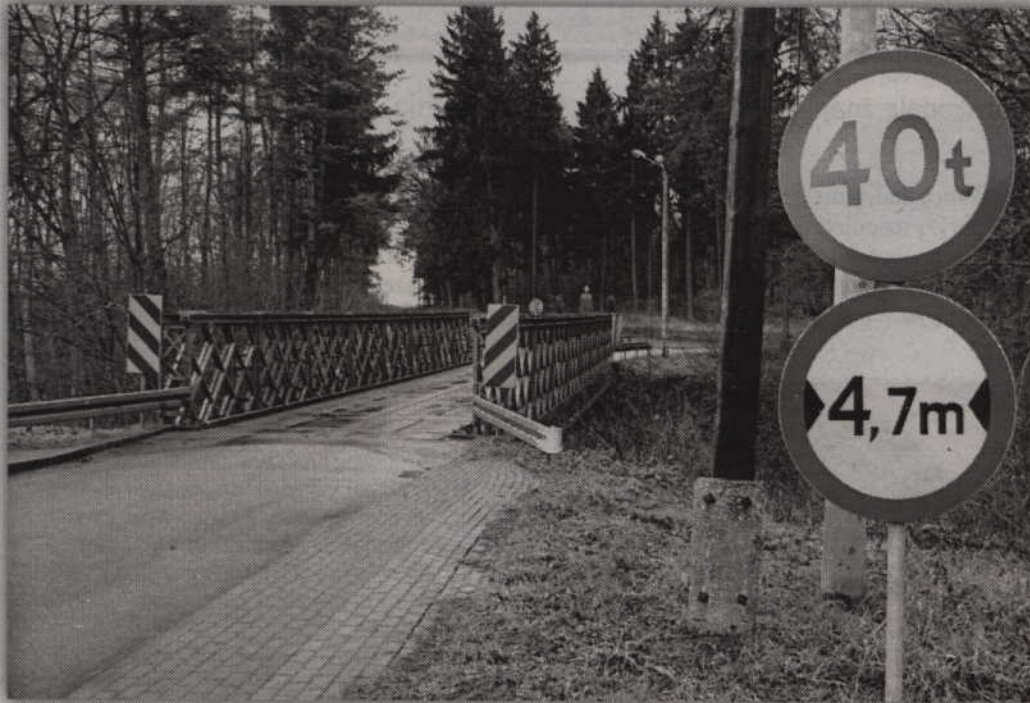
Most we Wracławku to jedyna droga łącząca wieś ze światem.