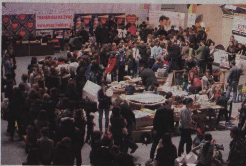
Tłumy wolontariuszy w kolejce do rozliczeń.