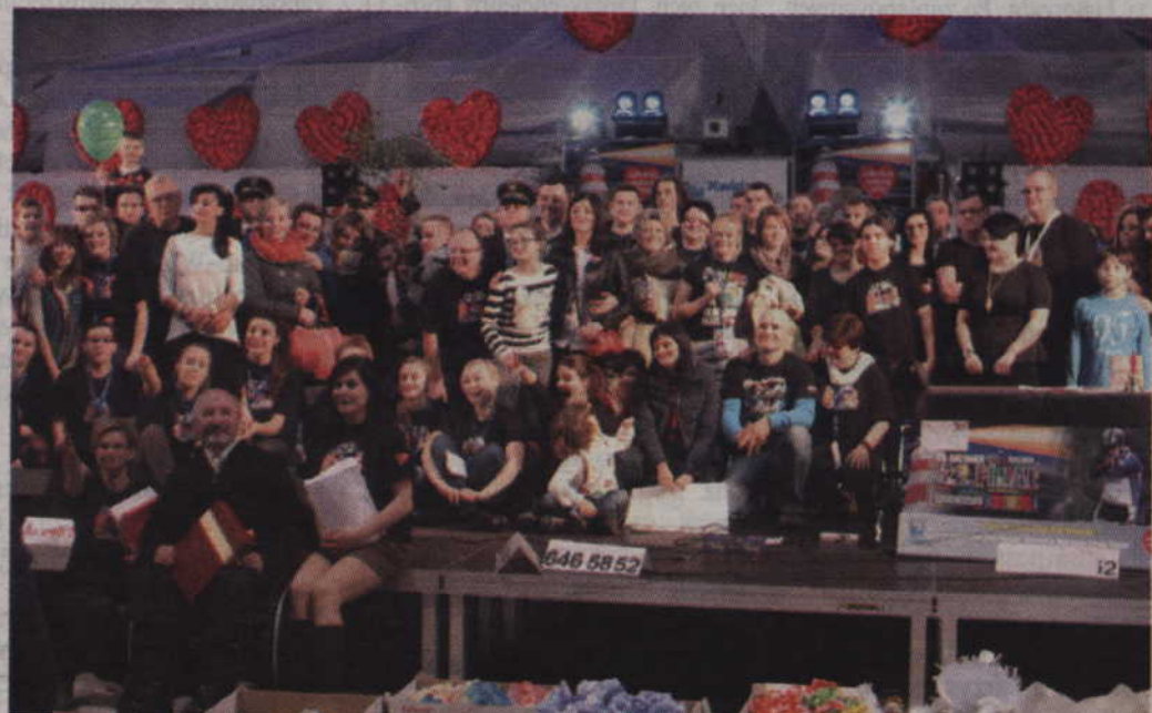
Wspólne zdjęcie uczestników 22 kwidzyńskiego finału Orkiestry.