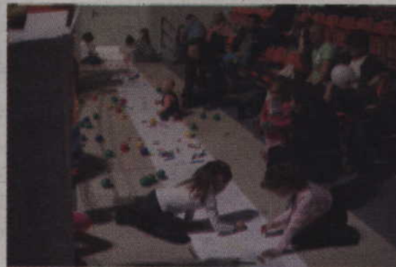
Dzieci podczas tworzenia wspólnej pracy.