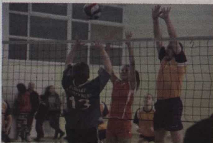
W meczu siatkówki Rada Miasta pokonała Radę Powiatu 3:1.