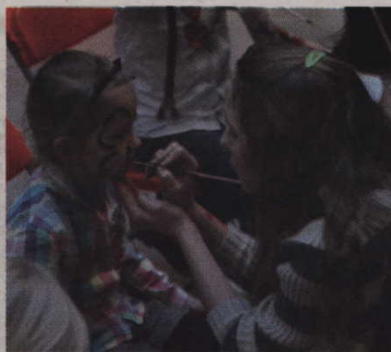
Skoro pojawiły się dzieci, nie mogło zabraknąć też malowania twarzy.