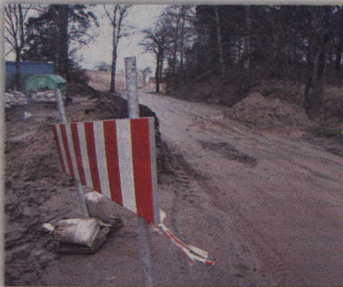
Zamknięty odcinek drogi nr 522 został udrożniony dla mieszkańców.

Początkowo wymieniony odcinek drogi miał być zamknięty do 8 grudnia. Później jednak przesunięto jego otwarcie na koniec grudnia, jednak i ten termin nie został dotrzymany. Dopiero początek stycznia zakończył kłopoty sporej grupy mieszkańców gminy Prabuty. Przy korzystaniu z otwartego odcinka drogi należy jednak zachować ostrożność, bowiem nie zakończyła się jeszcze budowa linii kolejowej i drogą nadal porusza się ciężki sprzęt. (RB)