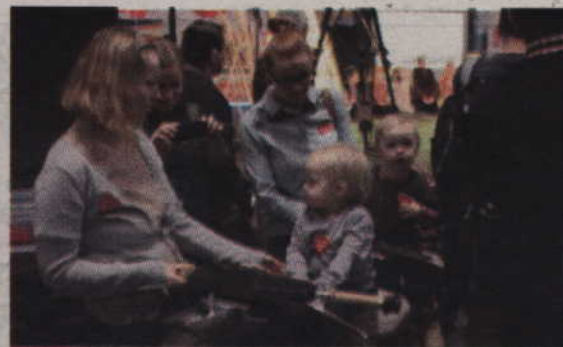
Każdy chciał mieć zdjęcie na filmowym motocyklu.