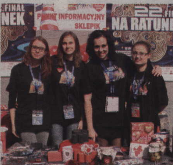
Wolontariusze sprzedający gadzety WOŚP.