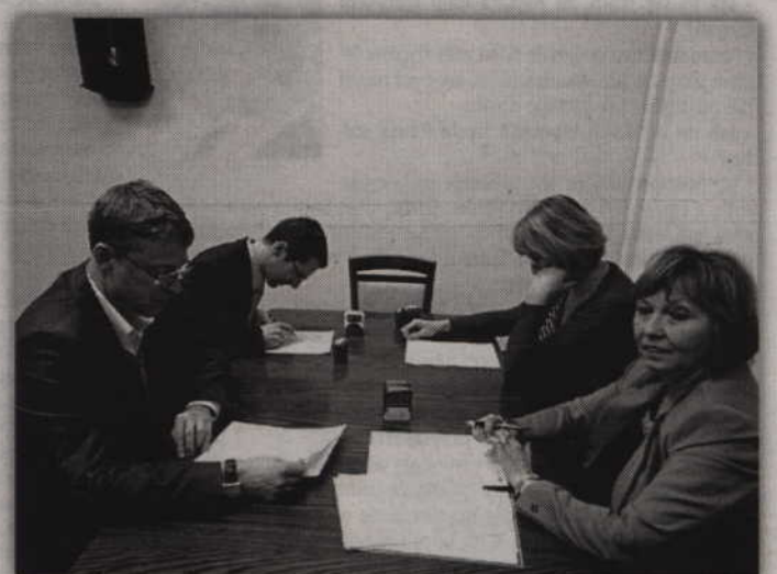
Prabucki samorząd przekazał dotację dla szpitala.

-Współpraca ze Szpitalem Specjalistycznym w Prabutach jest dla nas przykładem modelowej współpracy lokalnego samorządu ze służbą zdrowia. Do problemów ochrony zdrowia nie podchodzimy jak nie do swojego zadania, chociaż szpital podlega Urzędowi Marszałkowskiemu. Wprost przeciwnie, szpital działa w naszej gminie, zatrudnia mieszkańców z gminy i co najważniejsze,