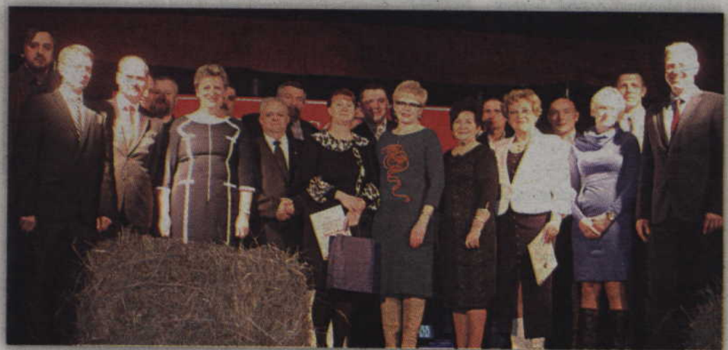
Wspólne zdjęcie uczestników II edycji plebiscytu na SuperSołtysa powiatu kwidzyńskiego.

– Bez sołtysa ani rusz – zgadzam się z tym stwierdzeniem. Dzięki takim ludziom jak sołtysi gminy mogą się rozwijać, a wój-