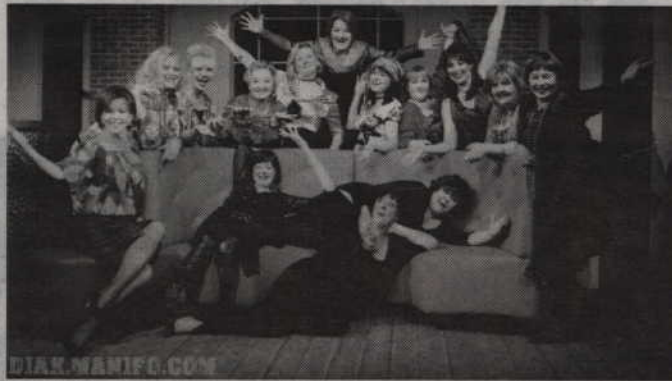
W spektaklu zamiennie występuje 16 aktorek.

Ponad 1800 przedstawień „Klimakterium... i już” w ciągu 6 lat od premiery wyraźnie pokazuje, że