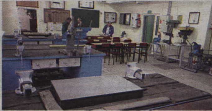
Powiat zamierza ocieplić m.in. budynek Centrum Kształcenia Zawodowego i Ustawicznego w Kwidzynie.