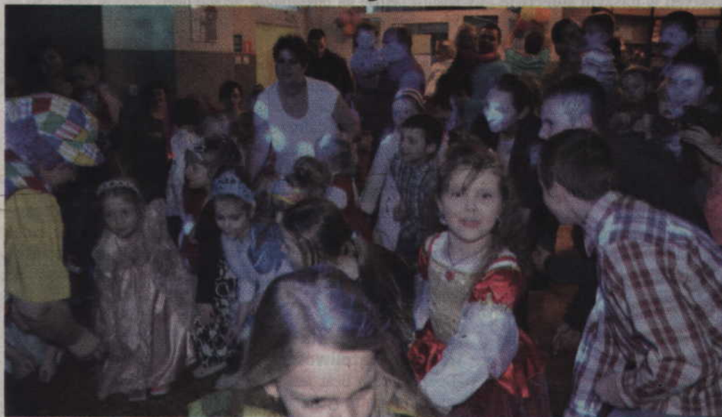
Ponad 50 dzieci wzięło udział w balu karnawałowym w Marezie.