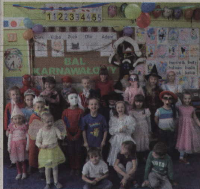
Gardejskie przedszkolaki podczas balu karnawałowego.

W udekorowanych salach dzieci z Przedszkola w Gardei bawiły się na balu karnawałowym.