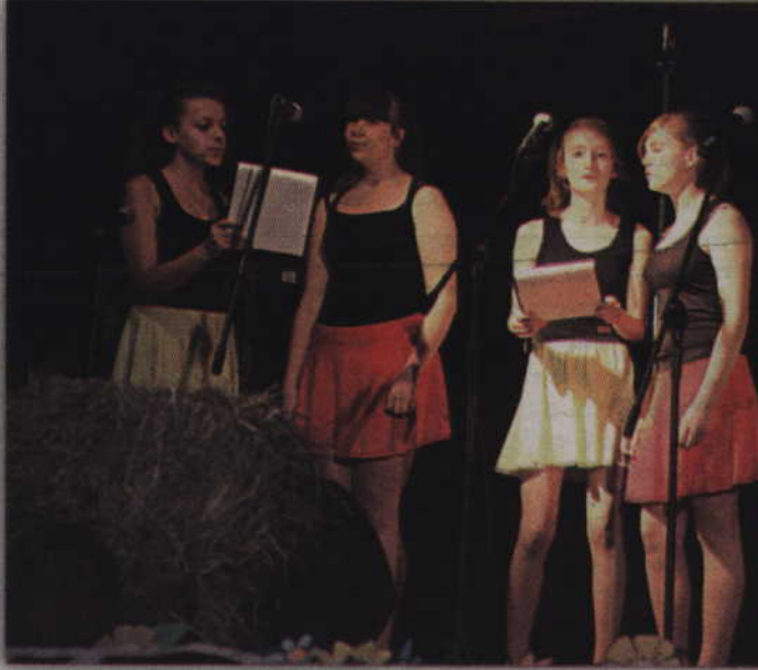
Na scenie zespół wokalny Prabuckiego Centrum Kultury i Sportu.