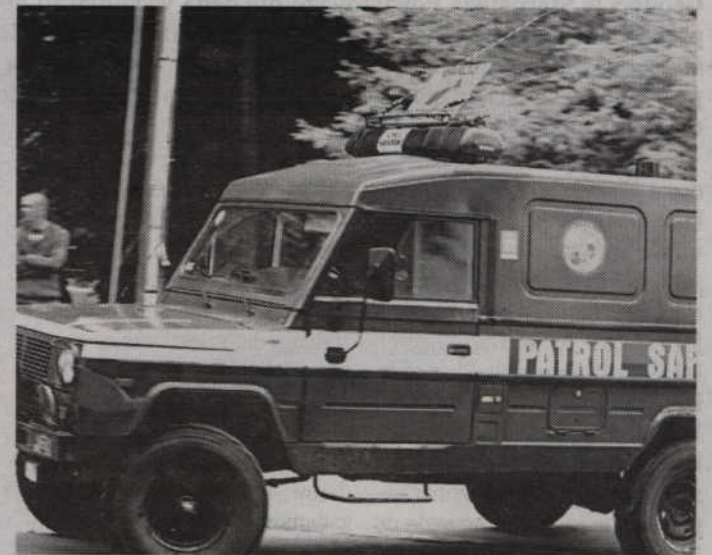
Niewybuch zabezpieczyli i wywieźli saperzy z Chełmna.