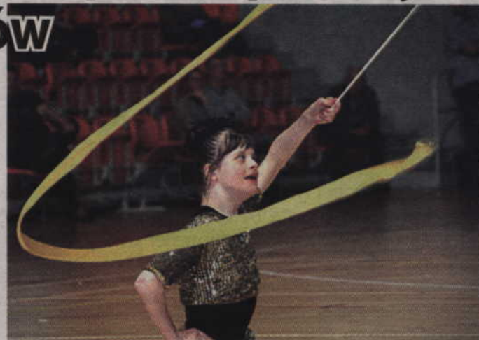
W hali przy ul. Wiejskiej odbędzie się rywalizacja niepełnosprawni sportowcy z całego Pomorza.

-Celem imprezy jest popularyzacja tenisa stołowego i gimnastyki jako dyscyplin, które mogą uprawiać osoby z niepełnosprawnością intelektualną. To także podsumowanie efektów pracy szkoleniowej. W przypadku gimnastyki konkurencje zostały dobrane tak, aby stworzyć możliwość startu zawodnikom o różnych możliwościach. Konkurencje rozgrywane są w czterech poziomach trudności. Niepeł-