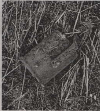
Granat znajdował się na terenie jednej z posesji przy ul. Chopina w Prabutach.