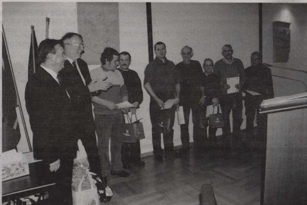
Nagrodzeni Honorowi Dawcy Krwi.