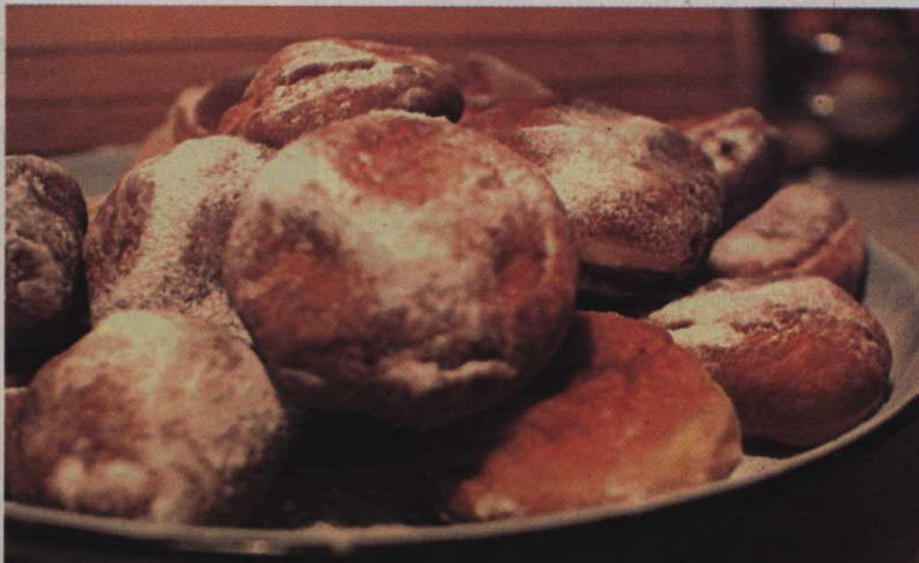
Czytelników „Kuriera” zapraszamy na pączki już od godziny 10.00.

„Powiedział Bartek, że dziś Tłusty Czwartek, a Bartkova uwierzyła, dobrych pączków nasmażyła” – to staropolskie przysłowie znają chyba wszyscy. Według przesądów jeśli ktoś nie zje w ten dzień ani jednego pączka, to w dalszym życiu nie będzie mu się wiodło. Dlatego w Tłusty Czwartek zapraszamy naszych Czytelników na pączki. Każdy kto przyjdzie do redakcji „Kuriera Kwidzyńskiego” (ul. Chopina 26, II piętro) z aktualnym wydaniem gazety otrzyma słodkości z Piekarni „Rochna”. Zapraszamy wszystkich chętnych już od godziny 10.00!