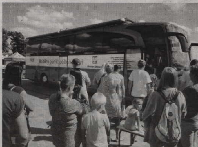
Doroczna akcja poboru krwi „Krew dla Polski” to jedna z wielu akcji organizowanych przez Polski Czerwony Krzyż.