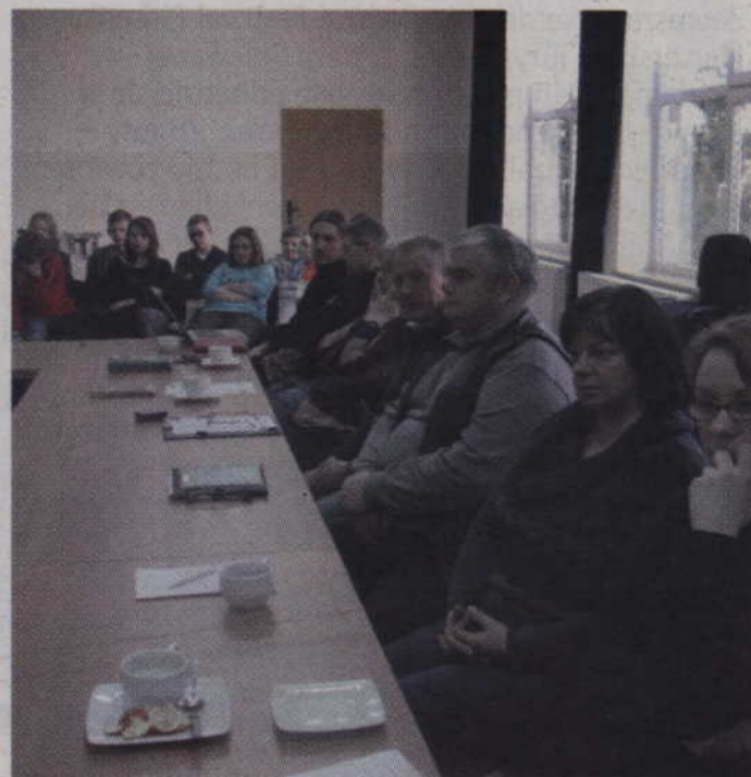
W szkoleniu wzięli udział leśnicy, nauczyciele, sołtysi i pracownicy urzędu.

-Szkolenie w Gardei było okazją do omówienia przede wszystkim zasad pielęgnacji drzew jak również bezpieczeństwa w otoczeniu drzew. Te dwie rzeczy są ze sobą ściśle powiązane. Jeśli nie pielęgnowaliśmy drzew wcześniej albo robiliśmy to źle, to w okresie dojrzalym drzewo jest bardzo często osłabione, a nawet dochodzi do obumierania. Najwięcej drzew obumiera przy drogach, ale ma to związek wręcz z ekstremalnymi warun-