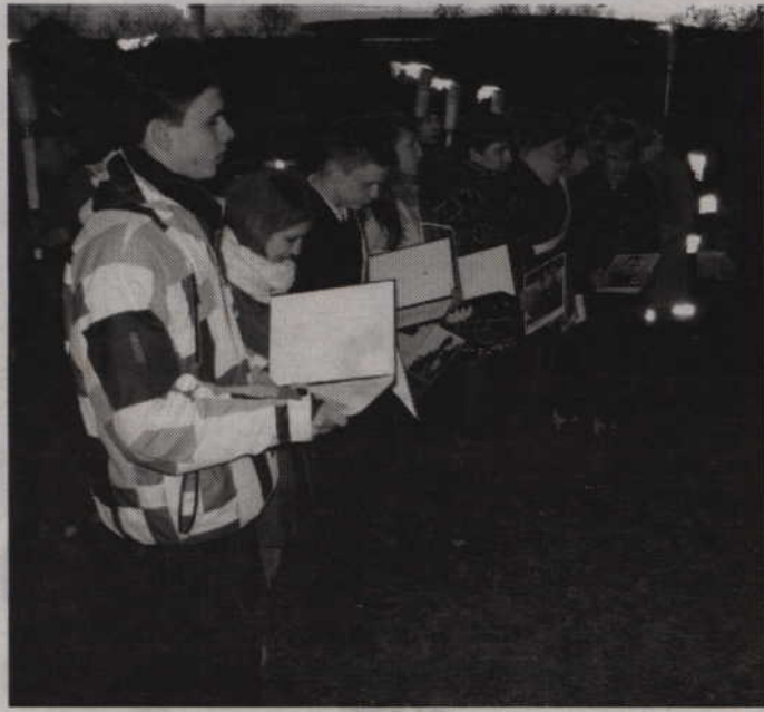
W ubiegłym roku gardejscy gimnazjaliści przygotowali uroczysty Apel Poległych.

-Narodowy Dzień Pamięci Żołnierzy Wyklętych przywraca bojownikom o wolną Polskę