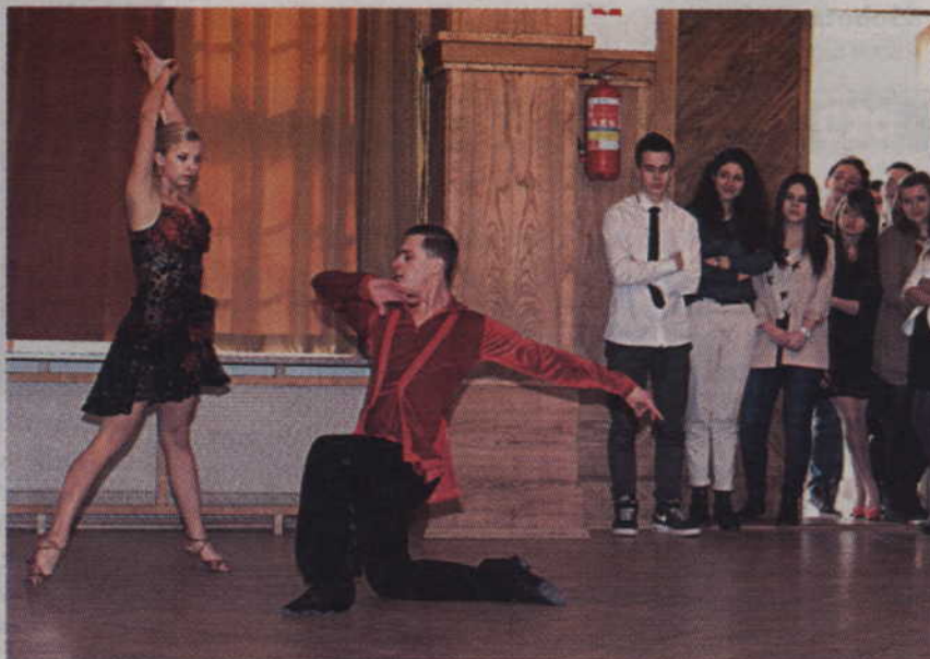
Pasodoble w wykonaniu licealistów.