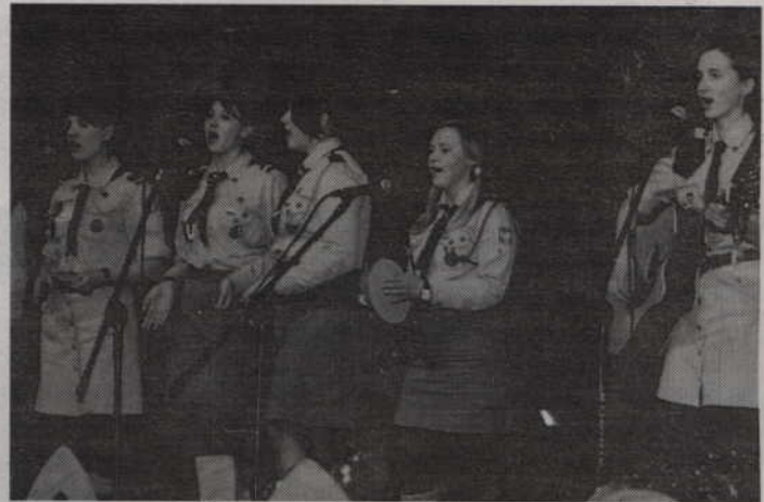
„Szałamaja” to od lat wielkie święto braci harcerskiej.

Tradycyjnie nie zabraknie również grup obserwatorów, które rokrocznie chętnie przyjeżdżają do Kwidzyna. W tym roku będzie to ponad 300 osób! Wśród gości pojawią się m.in. harcerze z Warszawy, Wrocławia, Gdańska, Słupska, Lęborka, Helu, Ustki, Tczewa, Malborka, Rumii oraz oczywiście z Kwidzyna.