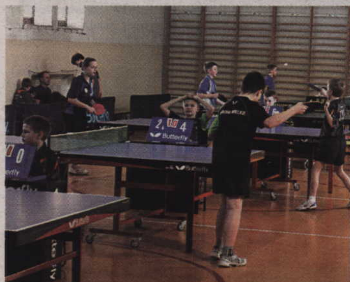
Turniej Grand Prix Kwidzyna odbędzie się w Sali gimnastycznej Zespołu Szkół Ponadgimnazjalnych nr 1.

Sekcja tenisa stołowego MTS Kwidzyn, Międzyszkolny Ośrodek Sportowy w Kwidzynie, Zespół Szkół Ponadgimnazjalnych nr 1 w Kwidzynie oraz SKS „Kibic” Otłowiec zapraszają na XVIII Grand Prix Kwidzyna w tenisie stołowym dla młodzieży szkolnej. Rozgrywki odbędą się dziś, w środę – 26 lutego, w sali gimnastycznej ZSP nr 1 (wejście od ul. Piłsudskiego).