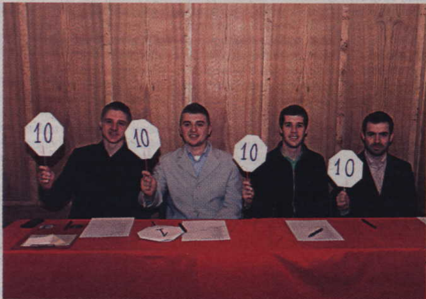
Ocena godna mistrzów.