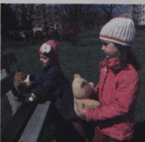
Pluszami zostawiane były w różnych miejscach, m.in. na ławkach.