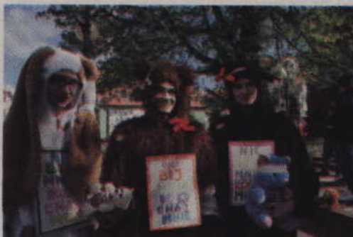
Z tej okazji młodzież z kwidzyńskich szkół przebrała się w futrzaki.