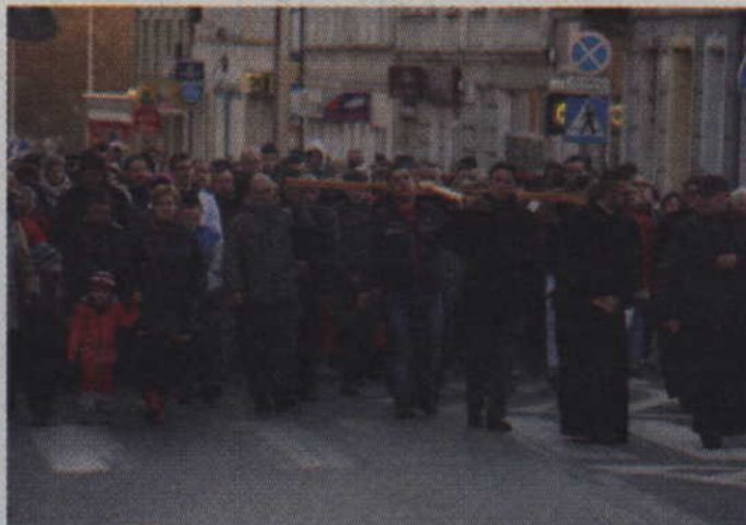
Droga Krzyżowa po raz kolejny połączyła dwie kwidzińskie parafie.

Parafianie kościoła Św. Trójcy i kościoła konkatedralnego po raz kolejny połączyli się we wspólnej modlitwie. Tym razem w Wielką Środę na ulicach miasta odbyła się uroczysta Droga Krzyżowa.