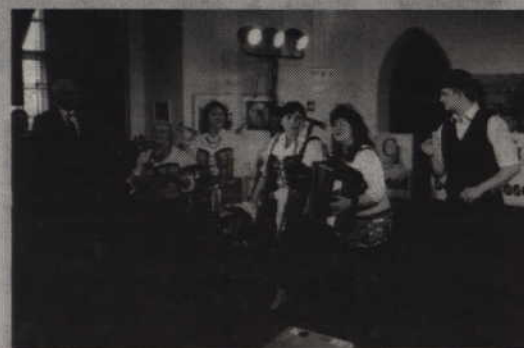
Zespół Cyganeczki z Cygan