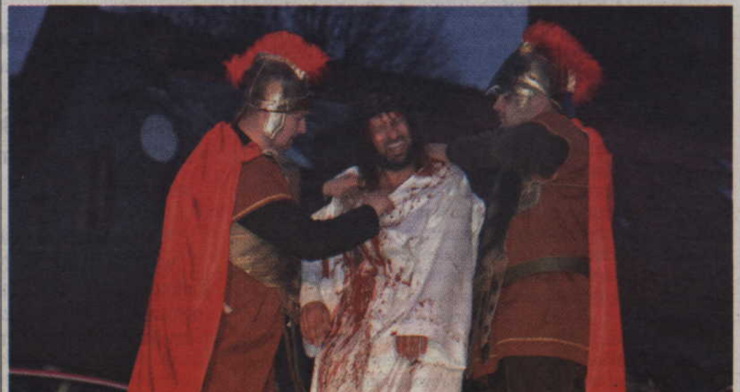
Chrystus odziany z szat przez żołnierzy.