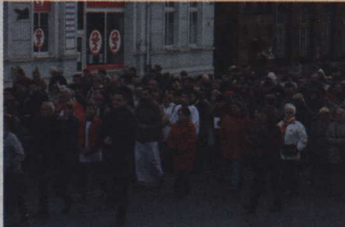
We wspólnej modlitwie uczestniczyli wierni z kościoła Św. Jana Ewangelisty oraz wierni z kościoła Św. Trójcy.