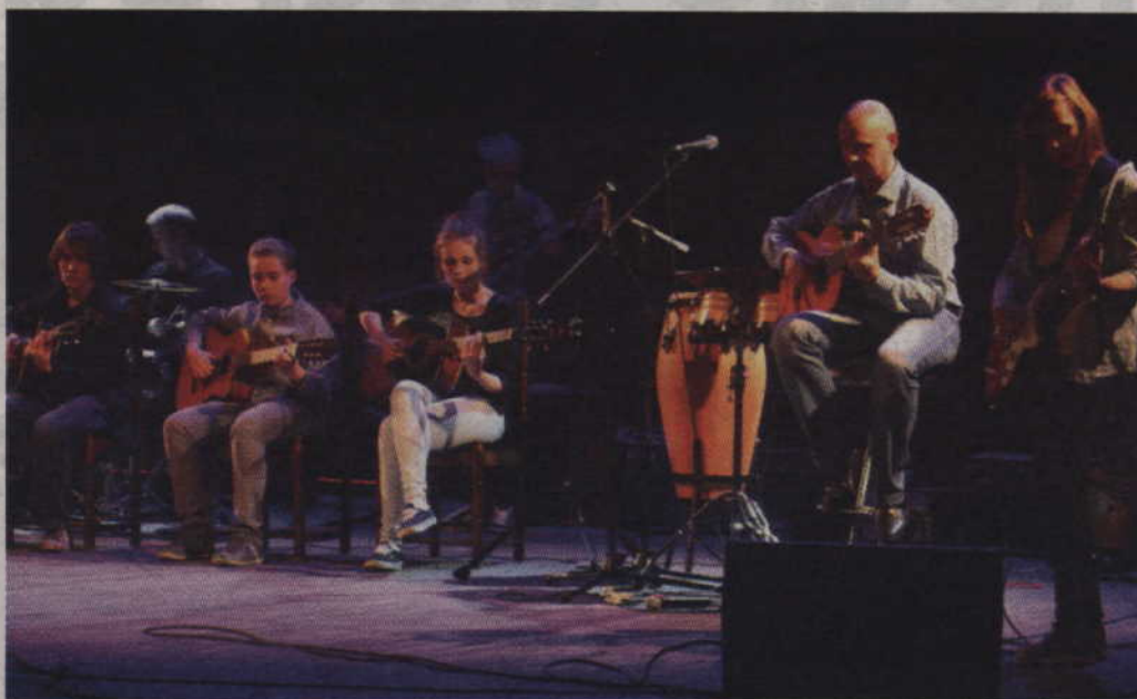
Mała Orkiestra Gitarowa podczas występu w kwidzyńskim Teatrze.