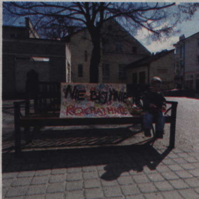
„Nie bij mnie, Kochaj mnie” – takie hasło przyświecało zorganizowanej akcji.