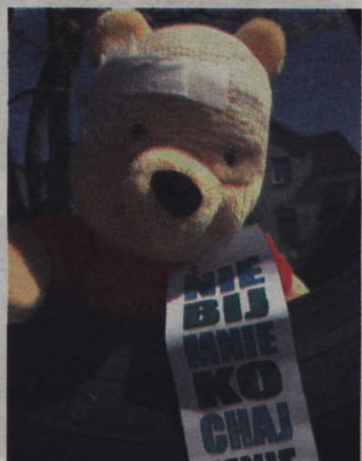
Takie misie można było spotkać w wielu miejscach.