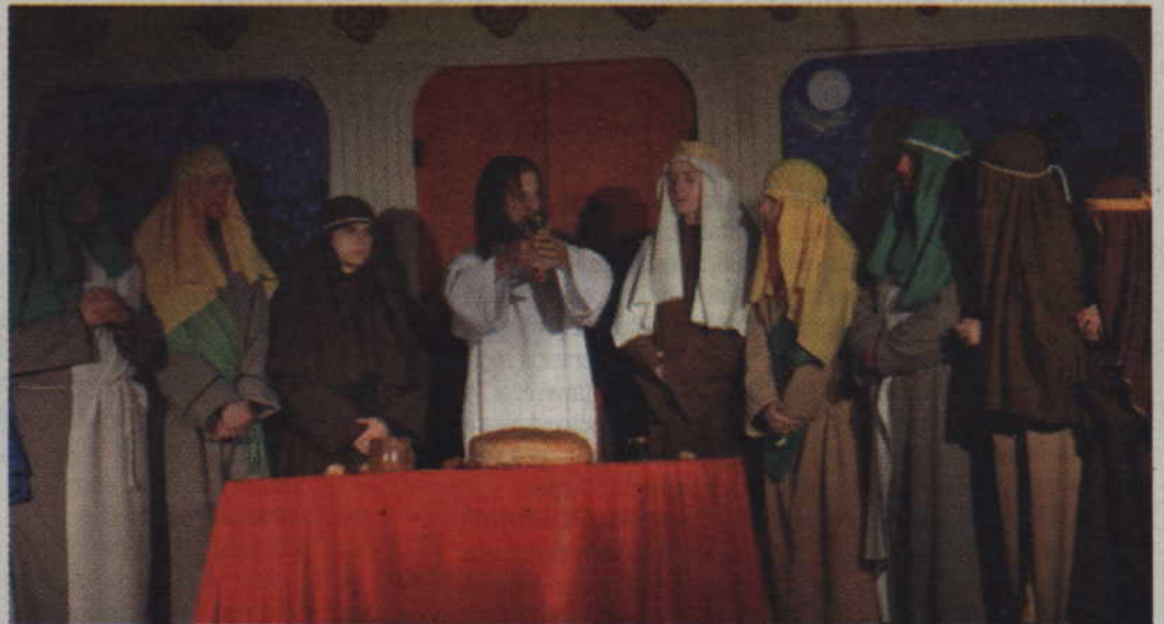
Misterium Męki Pańskiej wystawiono w Prabutach po raz pierwszy.