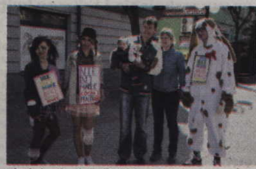
Mieszkańcy chętnie brali udział w happeningu zorganizowanym na kwidzyńskim deptaku.