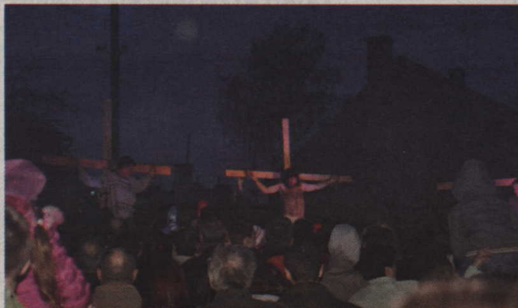
Wierni zgromadzeni wokół wystawionych trzech krzyży.