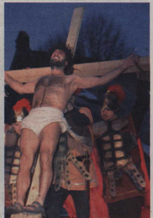
Żołnierze podnoszą krzyż z ukrzyżowanym Jezusem.