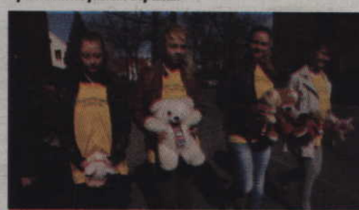
Wolontariusze z Zespołu Szkół Gimnazjalnych w Kwidzynie.