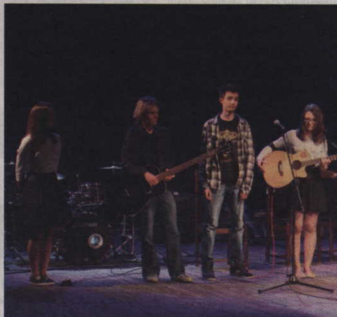
Na scenie prezentują się członkowie Projektu „i”.