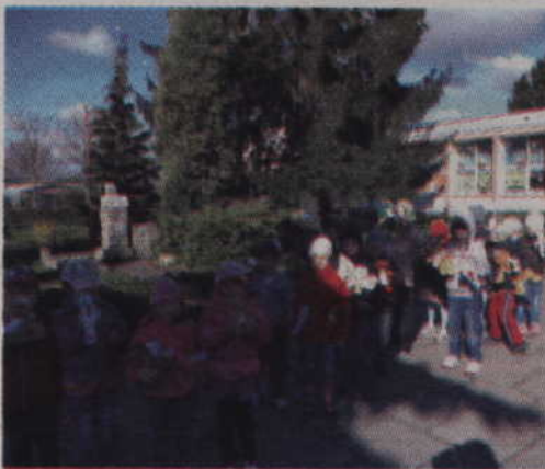
Przedszkolaki z Gardei również przyłączyły się do organizowanej akcji.