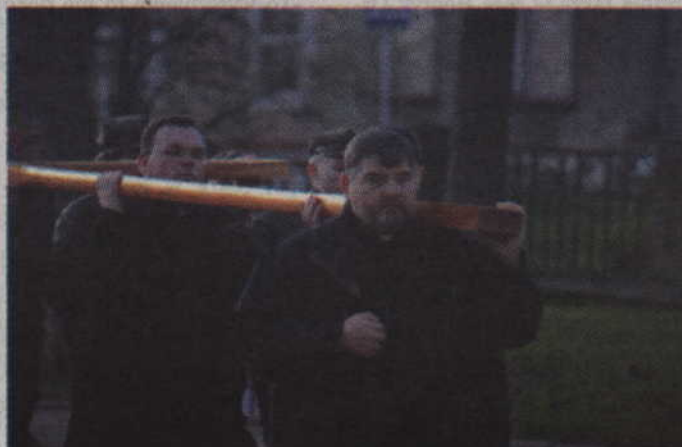
Na plac przed kościołem Św. Trójcy krzyż wnieśli ksiądz i zakonnicy.