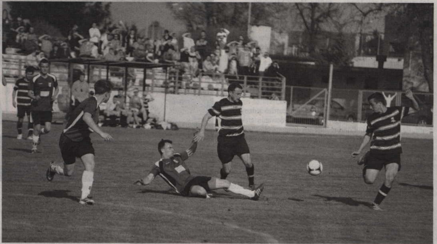
Starcie Rodła z Borowiakiem zakończyło się podziałem punktów.

Po przerwie grę również prowadzili kwidzynianie, jednak coraz śmiej na boisku poczynali sobie zawodnicy gości. Defensywa Rodła na szczęście skutecznie radziła sobie z atakami Borowiaka.