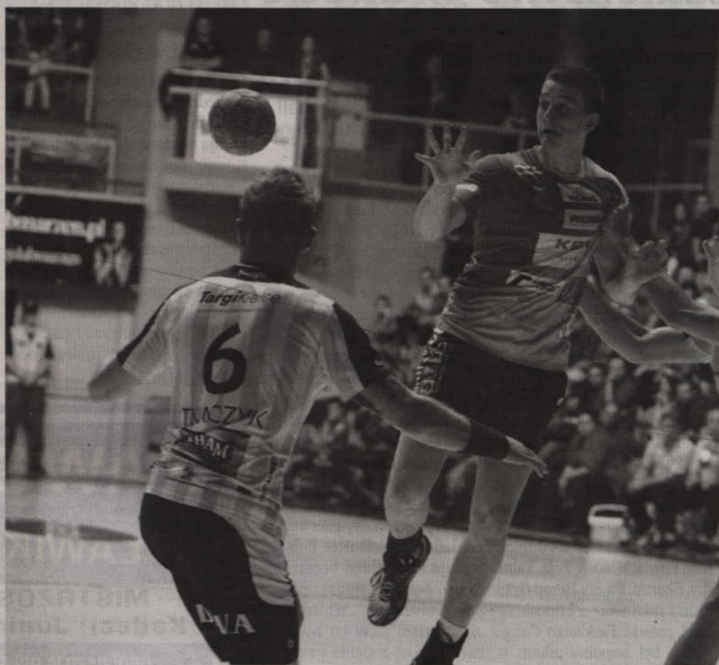
Do rewanżowego starcia z VIVE Kielce dojdzie już w najbliższą środę – 23 kwietnia o godz. 18.00.

Po zmianie stron ponownie zaatakowali kielczanie, którzy