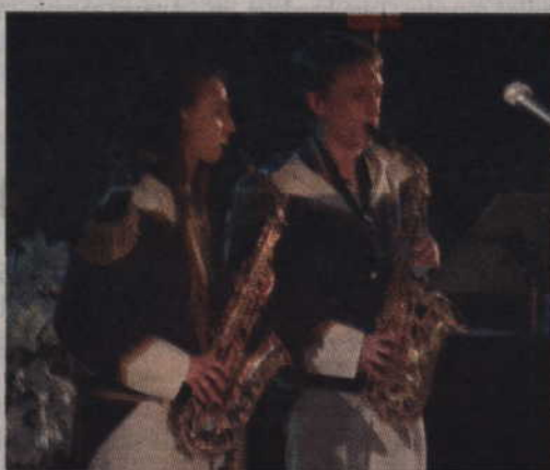
W programie wzięli udział także instrumentalni z orkiestry „Helikon”.