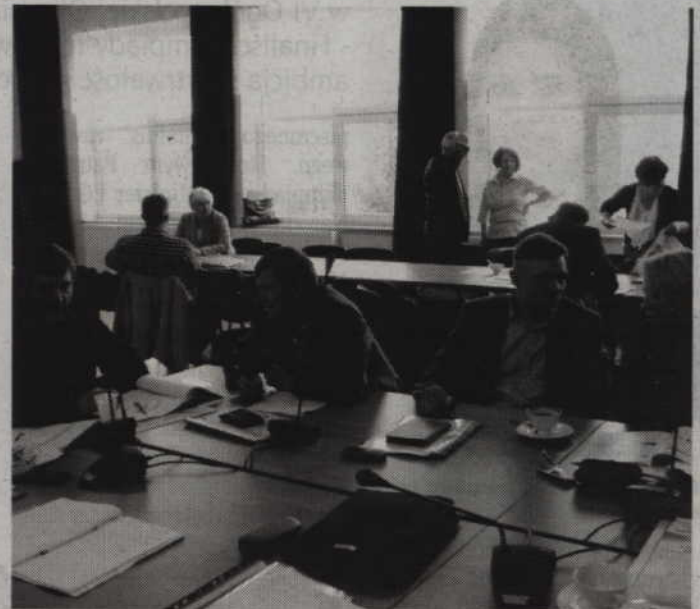
Gardejscy radni wyrazili zgodę na zaciągnięcie 2 mln kredytu.

-Ten kredyt pozwoli nam na realizację bieżących zadań jak również sfinansowanie niektó-