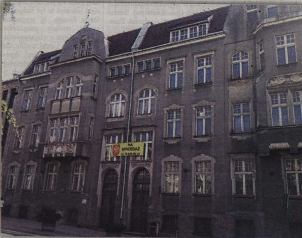
Największa nieruchomość która czeka na kupca to budynek po Domu Dziecka przy ul. Braterstwa Narodów w Kwidzynie.

W ubiegłym roku samorząd powiatu sprzedał budynek po Specjalnym Ośrodku Szkolno-Wychowawczym przy ul. Braterstwa Narodów w Kwidzynie. Nabywcą zostało Stowarzyszenie Rodzin Katolickich Diecezji Elbląskiej w Kwidzynie. Stowarzyszenie zamierza w przejętym