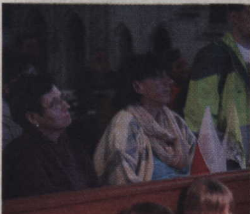
Niektórzy przynieśli ze sobą flagi biało-czerwone oraz flagi w barwach Watykanu.