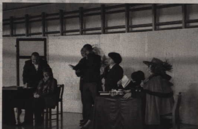
Amatorska grupa teatralna Super Nova wystawiła „Jubileusz” na podstawie jednoaktówki Antoniego Czechowa.