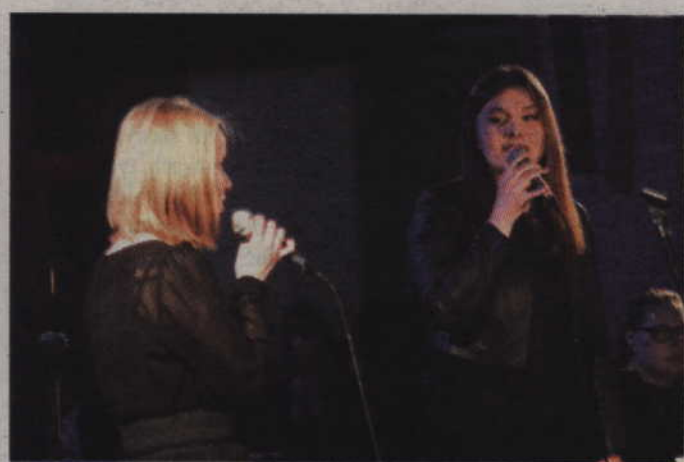
Fragment programu przygotowanego przez społeczność PSM w Kwidzynie.