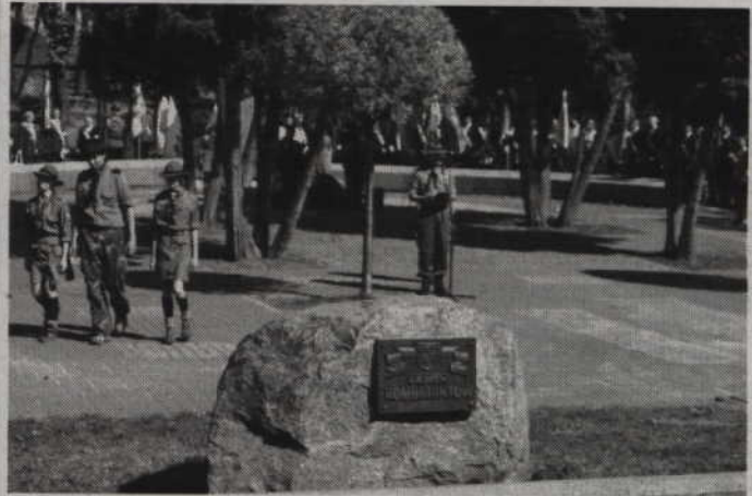
Uroczystości rozpoczną się na kwidzińskim Skwerze Kombatantów.

Przewodniczący Rady Miejskiej oraz Burmistrz Kwidzyna zapraszają na uroczyste obchody 223 rocznicy Konstytucji 3 Maja. Odbędą się one w sobotę - 3 maja, a rozpoczną się na Skwerze Kombatantów o godzinie 10.00. Po złożeniu wieńców i kwiatów na Grobie Nieznanego Żołnierza, mieszkańcy przejdą pod pomnik Marszałka J. Piłsud-