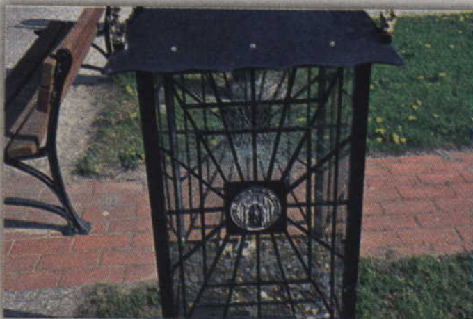
Skarbonka zniszczona przez prabuckich wandalów.