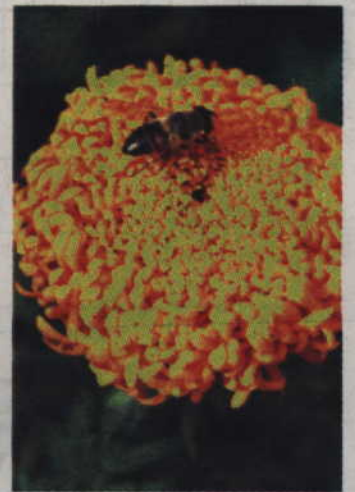
Aksamitki, zwane przez niektórych Turkami, nie są kapryśne, a różnorodność dostępnych odmian sprawia, że każdy znajdzie dla siebie odpowiednią wysokość czy kolor kwiatów. Będą też doskonałą jadłodajnią dla pszczół.

Są też inne rośliny, które wabią pszczoły. To m.in.: pierwiosnek, rezeda żółta, lipa drobnolistna, miodunka, mniszek, orlik, lipa szerokolistna, nawłoc kanadyjska, nostryk biały, malina właściwa, melisa lekarska, osę zwisły, robinia akacyjna, róża, ligustr pospolity, ostrzeń górski, berberys, chaber, dziurawiec zwyczajny, facelia błękitna, brodawnik je-