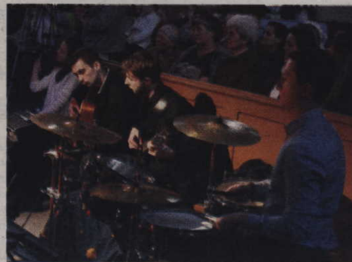
Wokalistom akompaniowali muzycy kwidzyńskiej szkoły muzycznej.