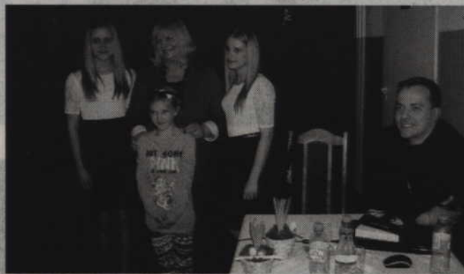
Wspólne zdjęcie na pewno będzie miłą pamiątką tego spotkania.

niektóre piosenki stawały się z czasem utworami uważanymi za protest songi.