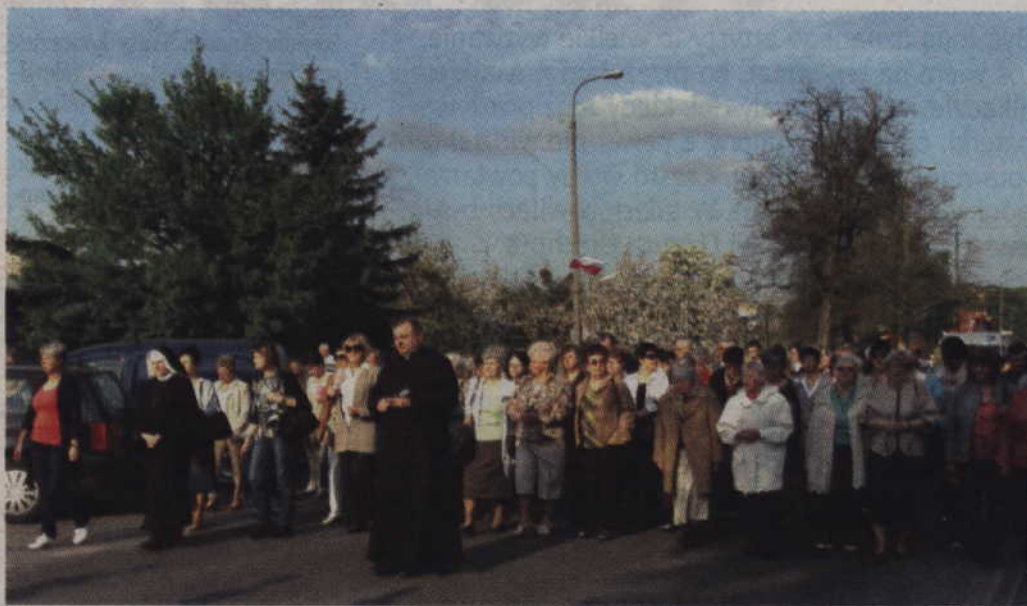
Mieszkańcy przeszli ulicami miasta z ronda Jana Pawła II na kwidzyński plac Jana Pawła II.