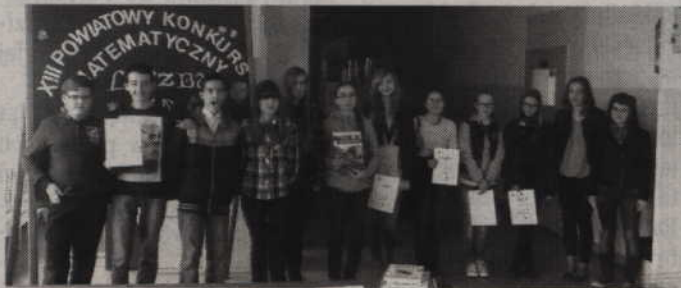
Laureaci tegorocznego konkursu „Liczby na co dzień”.

Zadania dotyczyły praktycznych rozwiązań życiowych problemów, a uczniowie reprezentowali bardzo wysoki poziom i stopień opanowania różnych dziedzin matematyki – mówi Wioletta Kowal-