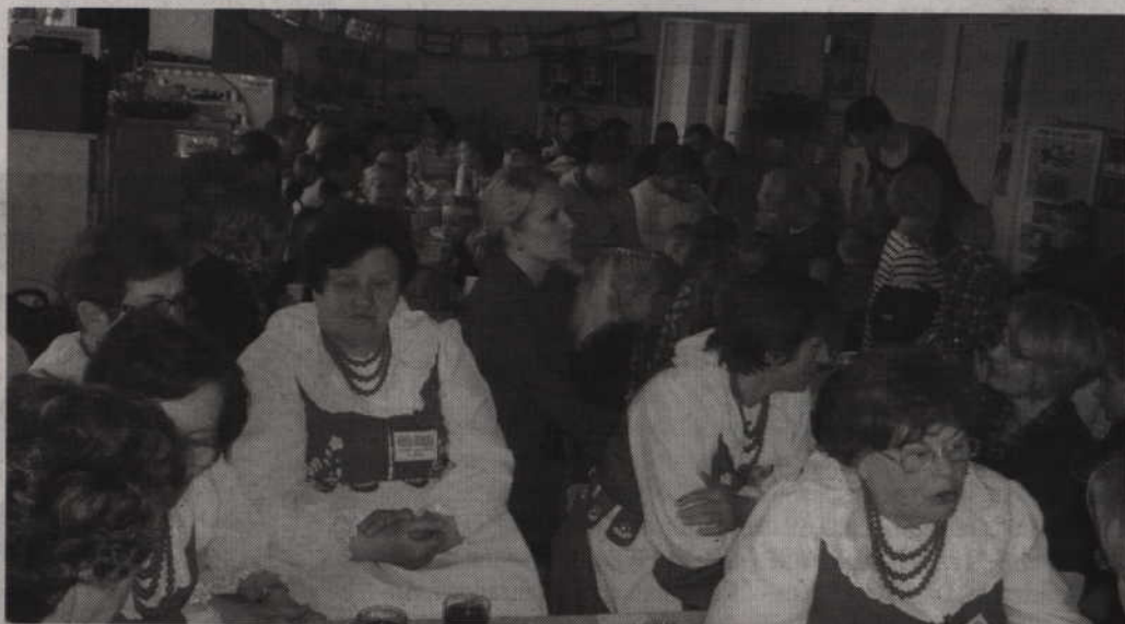
Gościem specjalnym był zespół „Wesoła Gromadka” z Tychnow, który również zasiadł wśród publiczności.

-Rodzice w naszym przedszkolu są partnerami, bardzo angażują się w życie przedszkola. Stali się jego sojusznikami w sprawach zdrowia i bezpieczeństwa dzieci, a także wspierają inne działania stymulujące wielostronny rozwój dzieci. Rodzice włożyli też ogromny wkład w organizację i przebieg konkursu recytatorskiego. Dobrze zorganizowana współpraca przedszkola z rodzicami jest jednym z istotnych czynników osiągania przez przedszkole dobrych wyników