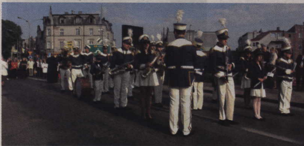
Uroczysty orszak prowadziła Orkiestra Dęta „Helikon”.