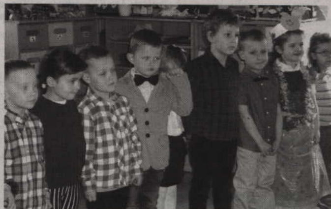
Uczestnicy przedszkolnego konkursu.

na problemy ekologiczne Konkurs „Żyj z przyrodą w zgodzie” odbył się w ramach realizowanej w przedszkolu innowacji pedagogicznej „Edukacja