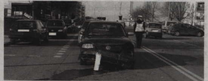
Do wypadku z udziałem vw passata doszło na ul. Wschodniej.

Na ulicy Wschodniej w Kwidzynie doszło do zderzenia passata i focusa. Na miejscu pracowali policjanci ruchu drogowego oraz technik kryminalistyki. Mundurowi zabezpieczyli miejsce zdarzenia, przeprowadzili oględziny, a policyjny technik sporządził