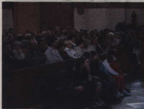
Mieszkańcy z uwagą wysłuchali przygotowanego koncertu.