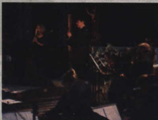
Podczas koncertu nie zabrakło również utworów instrumentalnych.