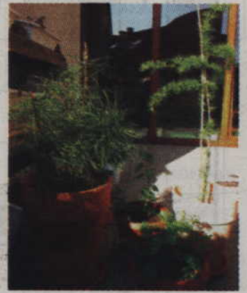
Drzewa na balkonie? Czemu nie. Są niewymagające, a tworzą nie tylko zielone tło dla innych roślin, ale i sprzyjający mikroklimat tuż za oknem.

Zielen może pomóc nam także w domu, w którym też może być wiele niedostrzegalnych gołym okiem zanieczyszczeń. Każdy gatunek ma swoje „ulubione” trucizny. Dla bluszczu są to rozpuszczalniki