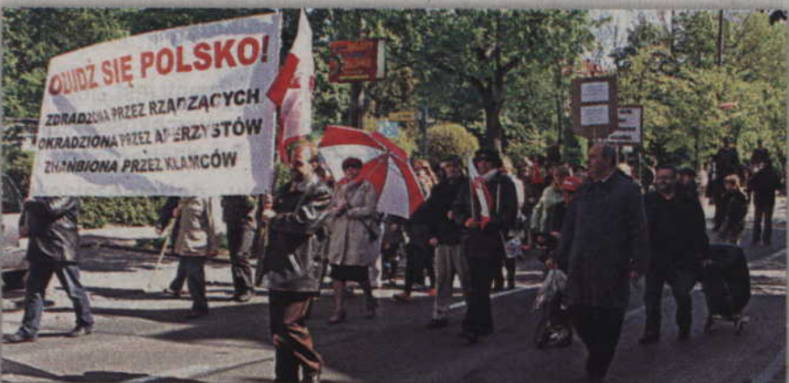
W przemaszu udział wzięli także przeciwnicy obecnego rządu, dając temu wyraz w hasłach umieszczonych na transparentach.