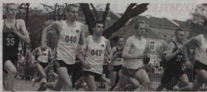
Bieg Unijny rozegrany zostanie w Kwidzynie już po raz jedenasty.

Zarówno w Dużym jak i Małym Biegu Unijnym uczestnicy walczyć będą również o nagrody pieniężne. Za zwycięstwo organizatorzy przewidują kwotę: 300 zł, a kolejne miejsca nagradzane są sumą 250 zł, 200 zł i 150 zł. Więcej informacji na temat biegu znajdziecie Państwo na stronie www.kkl.ckj.edu.pl (fox)