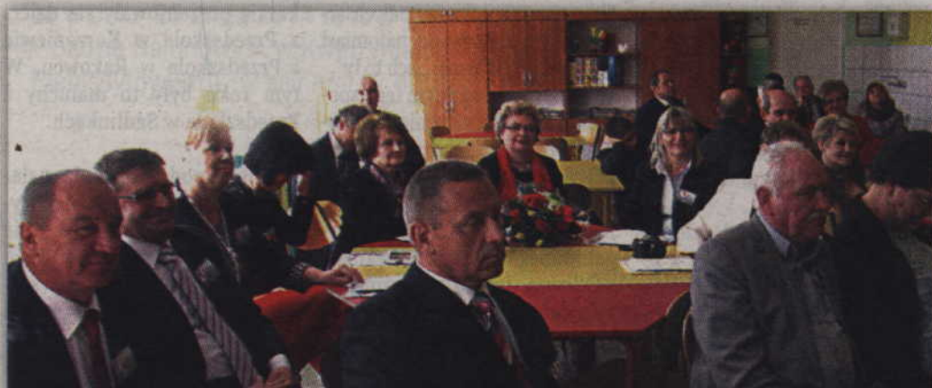
Choć od ostatniej godziny wychowawczej minęło już 41 lat, to na lekcji panowała absolutna cisza.