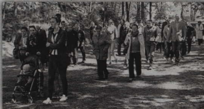
Mimo chłodu wielu mieszkańców zdecydowało się na przyście na stadion.