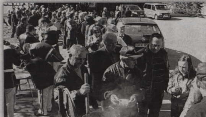
Strażacka grochówka cieszyła się zasłużonym uznaniem.