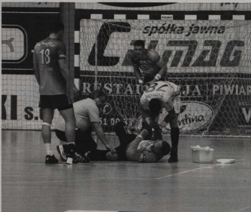
W 21 minucie Paweł Kiepułski długo nie podnosił się parkietu.