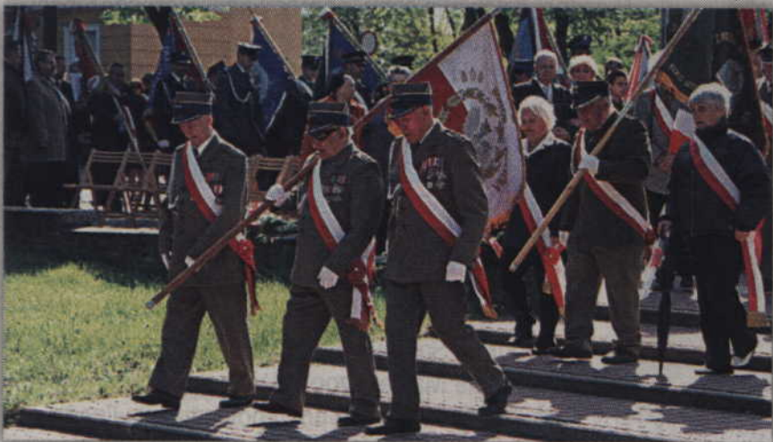
Święto konstytucji uczcili między innymi organizacje kombatantkie.