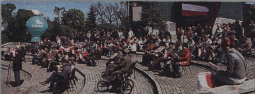
Mieszkańcy wraz z aktorami Teatru Muzycznego w Gdyni, śpiewali znane i mniej znane pieśni.