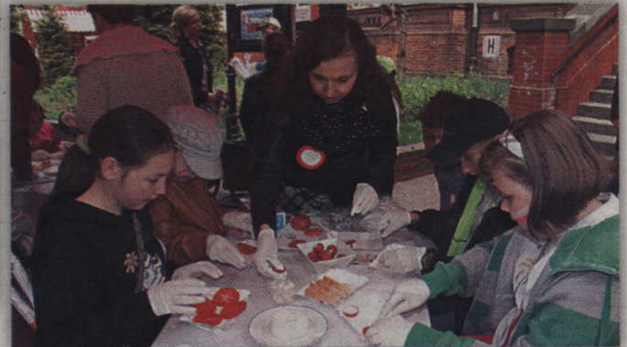
Tego dnia potrawy musiały zostać przygotowane w barwach narodowych.