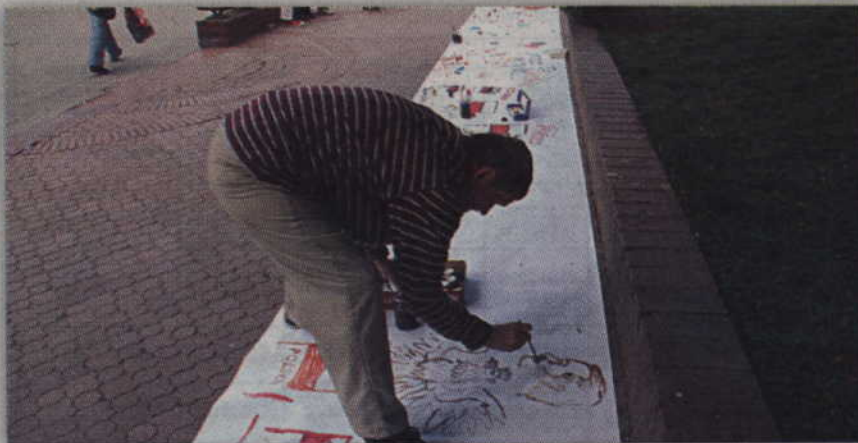
Leszek Czajka z Kwidzyna postanowił narysować nie tylko orła, ale także profil marszałka Józefa Piłsudskiego.