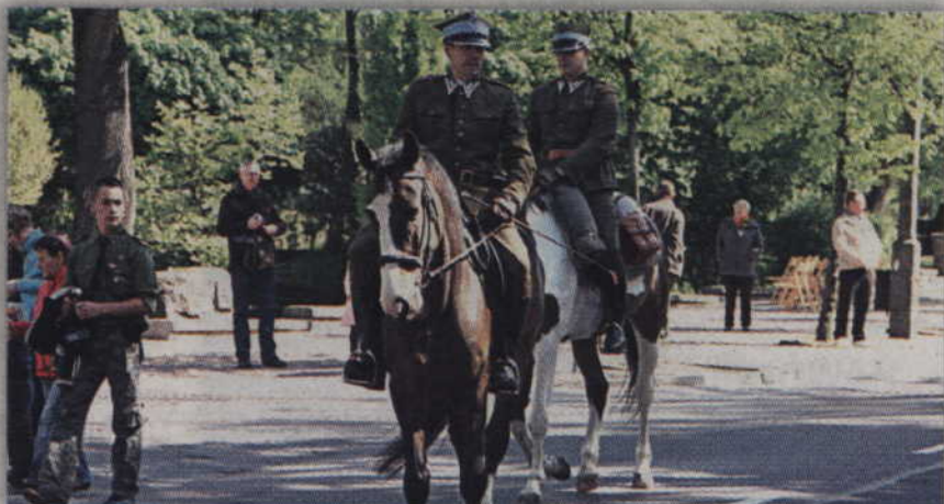
Podczas uroczystości nie mogło zabraknąć ułanów.