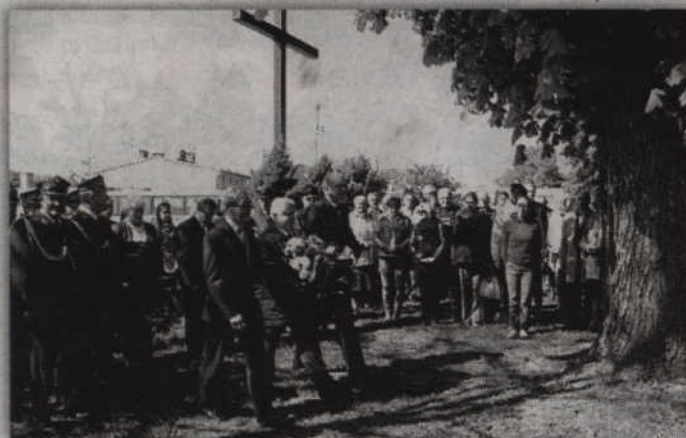
Pod tablicą pamiątkową kwiaty złożyła m.in. delegacja Urzędu Gminy Gardeja.