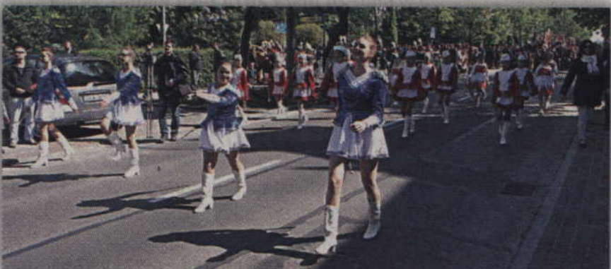
Przemasz uczestników uroczystości.