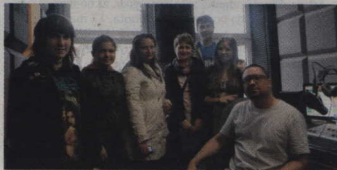
Z wizytą w studiu Radia Malbork.

towe zorganizowane na szkolnej sali gimnastycznej, gdzie młodzież grała w piłkę ręczną, piłkę nożną i tenisa stołowego. Wspólnie zorganizowali się także rodzice, którzy po części oficjalnej przygotowali dzieciom ognisko, zabawy i gry sportowe.