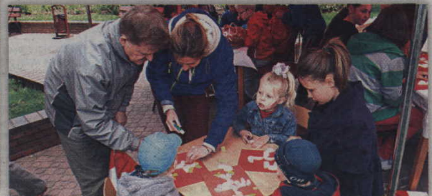
Sztukę origami wykorzystano do wykonania orłów.