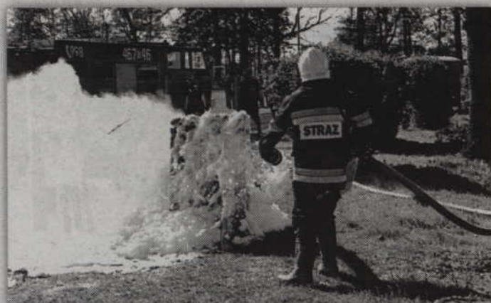
Pokaz strażackich umiejętności w wykonaniu OSP Rozajny.