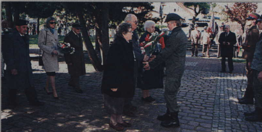
Złożeniem wiązanek kwiatów oraz wieńców na grobie Nieznanego Żołnierza uczczono Święto Narodowe 3 Maja.