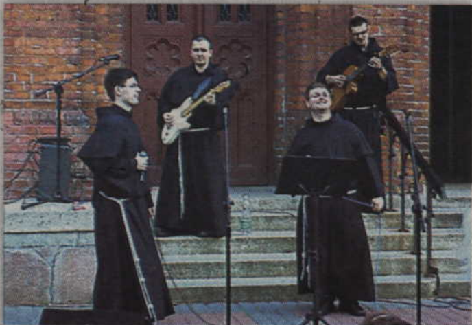
Zespół „Pokój i Dobro” podczas koncertu na kościelnym placu.