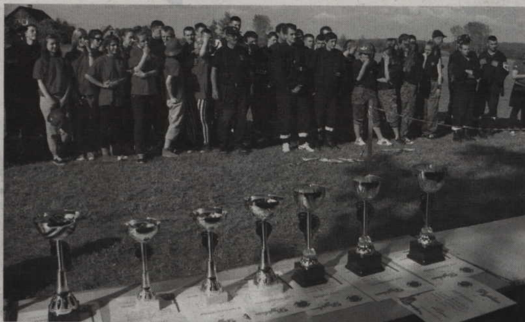
W zawodach pożarniczych wzięły udział wszystkie jednostki OSP z terenu gminy Sadlinki.

Drugą część pożarniczej rywalizacji stanowiła konkurencja bojowa. Nikt nie miał złudzeń, że była to najbardziej widowiskowa część strażackich zmagania. Brało w niej udział po ośmiu zawodników, a każdy musiał idealnie wykonać ciężące na nim zadania. Podłączenie węży do motopompy, rozciągnięcie węży strażackich, prawidłowe połączenie, a następnie strącenie czterech pachółków i uruchomienie specjalnego znaku musiało być wykonani w czasie krótszym niż jedna minuta. Najdrobniejszy błąd, zbyt słabe połączenie węży czy też złe ich rozciągnięcie mogło narazić zawodników na czasowe straty, których już nie dało się nadrobić.