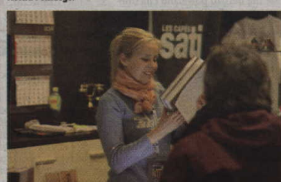
W Tabularium kupić można było uzupełnione wydanie Monografii Kwidzyna.