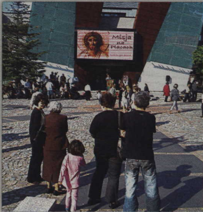
„Misje na placach” już po raz trzeci odbyły się na kwidzyńskim placu Jana Pawła II.

W spotkaniach ewangelizacyjnych na placach uczestniczą przede wszystkim osoby należące do wspólnot działających