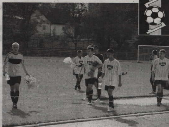
Piłkarze Rodła Kwidzyn tracą tylko 1 punkt do znajdującej się przed nimi Raduni Stężycy.

Rodło: Sadowski – Szpakowski, Stefaniak (85' Baprawski), Maluchnik, Pokwicki, Obiały, Temitayo (70' Strzelecki), Juchniewicz, Myścich (90' Kida), Gretkowski, Torlop (90' Łukaszewski).