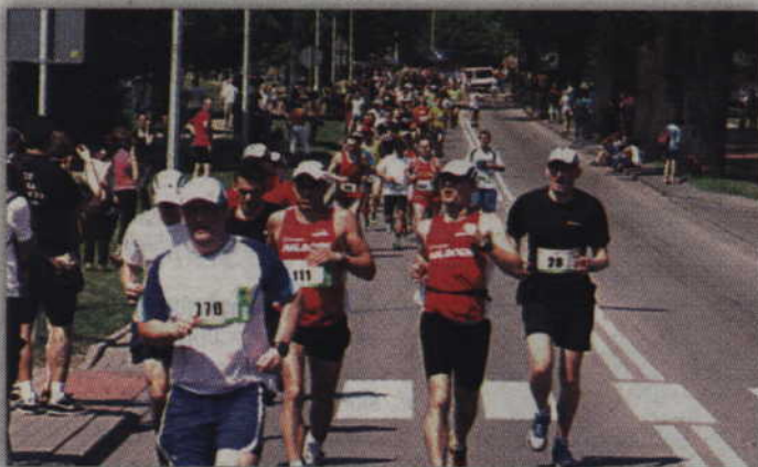
W tegorocznym Biegu Papiernika wystartuje prawie 3 tysiące osób.

Niemal 2900 osób zgłosiło swoją chęć startu w tegorocznym Kwidzyńskim Biegu Papiernika. Impreza organizowana już po raz piąty z roku na rok gromadzi na starcie coraz większą liczbę osób. Warto również dodać, że aż 504 startujących to mieszkańcy Kwidzyna.