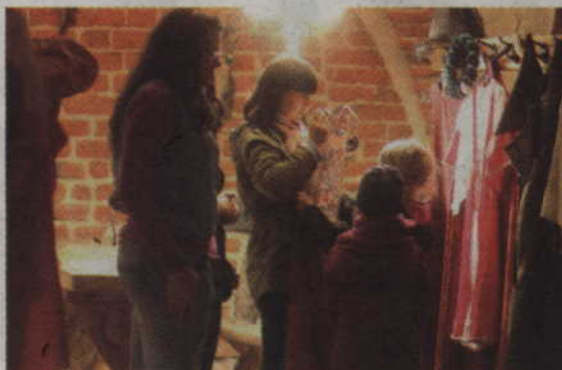
Wypożyczalnia strojów średniowiecznych cieszyła się dużym zainteresowaniem mieszkańców.