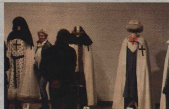
Intrygową wystawę ubiorów dostojników Zakonu Krzyżackiego i Królestwa Polskiego.