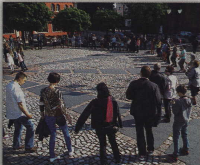
Podczas spotkania nie brakuje wspólnych tańców i śpiewów.