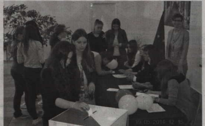
W szkolnych prawyborach wzięło udział 62 procent uprawnionych do głosowania.