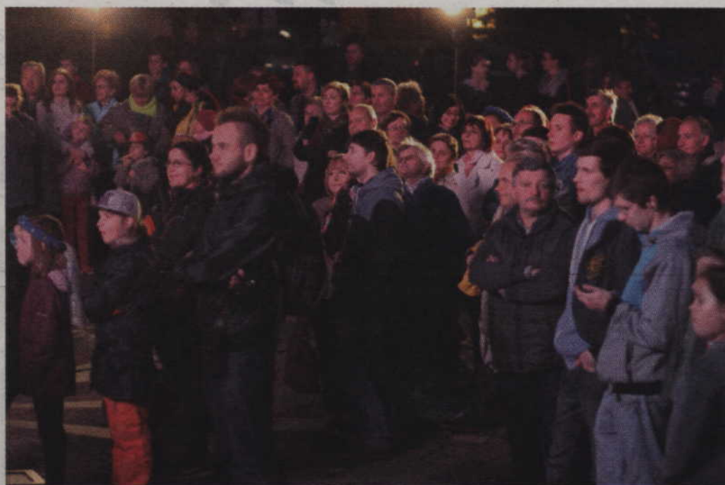
Kwidzynie przyglądają się pokazom.