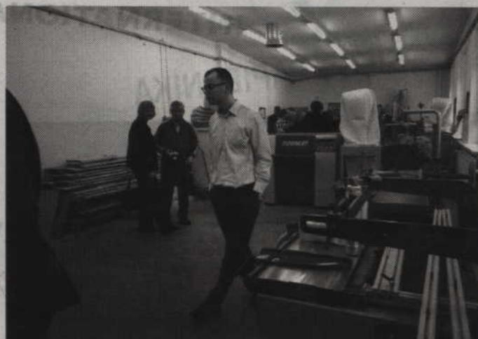
Kilka lat temu International Paper Kwidzyn wsparło funkcjonowanie Centrum Kształcenia Zawodowego i Ustawicznego. Teraz firma zdecydowała się pójść krok dalej.

-Szeroki zakres współpracy, którą proponują firmy IP Kwidzyn i KBR Poland, znacznie wykracza ponad standardowe praktyki zawodowe uczniów szkół zawodowych. Dlatego współpraca, która została sfinalizowana, w sposób znaczący wpłynie na efektywność kształcenia, jak i na atrakcyjność szkół zawodowych w naszym regionie. Za szerokie działania i otwartość obu firm, chciałabym w imieniu szkół,