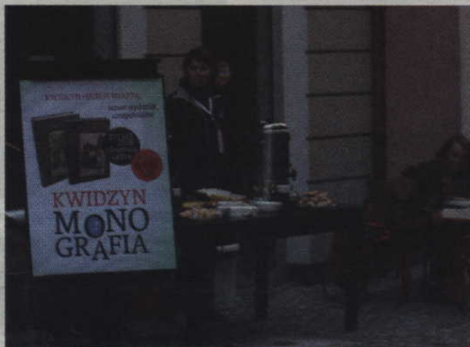
Przed wejściem do Tabularium usytuowano kawiarenkę funkcjonującą pod gołym niebem.