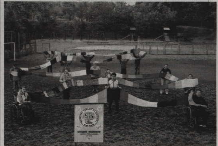
Uczestnicy Warsztatu Terapii Zajęciowej w Ryjewie z 34 metrowym szalem.

Do akcji włączyło się wiele placówek, a organizator postanowił nagrodzić organizację, która wykona najdłuższy szal. Dlatego też ryjewski Warsztat zmobilizował wszystkich, którzy się na tym znają i wykonał szal o długości 34 metrów. Czy to wystarczy aby zająć jedno z czołowych miejsc w tej rywalizacji? Nie wiadomo. Pozostanie jednak satysfakcja, że ktoś na tym skorzysta i nie będzie musiał marznąć w chłodne dni czy noce. (f)