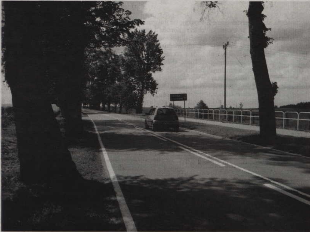
Droga krajowa nr 55 w najbliższych latach nie będzie remontowana.