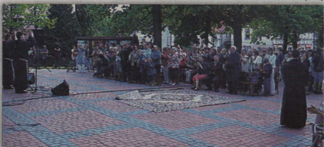
Występ franciszkańskiego zespołu zgromadził przed kościołem sporą grupę słuchaczy.