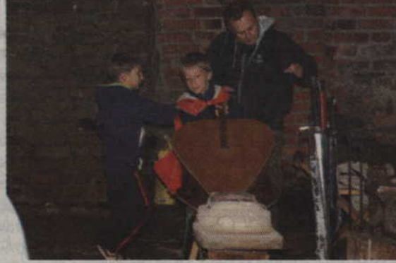
Na dziedzińcu zamkowym można było natknąć się m.in. na miechy, a także broń białą.