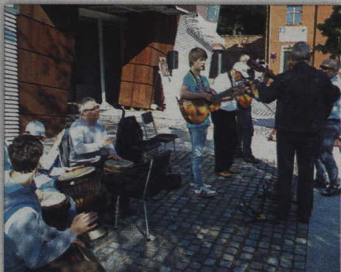
Muzycy przygrywają podczas ewangelizacji.