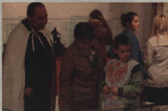
Przebrani kwidzynie zwiedzali sale muzeum zamkowego.