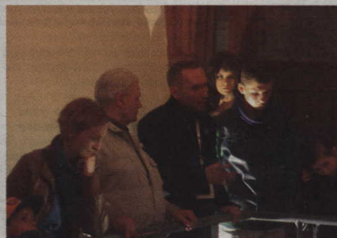
W Krypte Wielkich Mistrzów kwidzynie wystuchali opowieści o pochowanych tam władcach Zakonu Krzyżackiego.