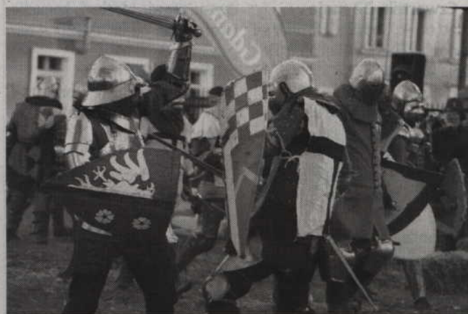
Pojedynki rycerskie podziwiać będzie można na placu przed prabucką Katedrą.