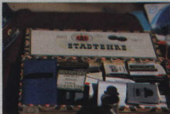
Kolekcjonerzy pudełek do zapalek również znaleźli coś dla siebie.