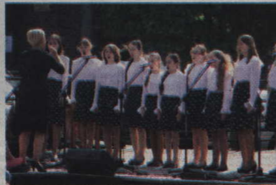
Na scenie prezentuje się rosyjski chór „Gloria”.