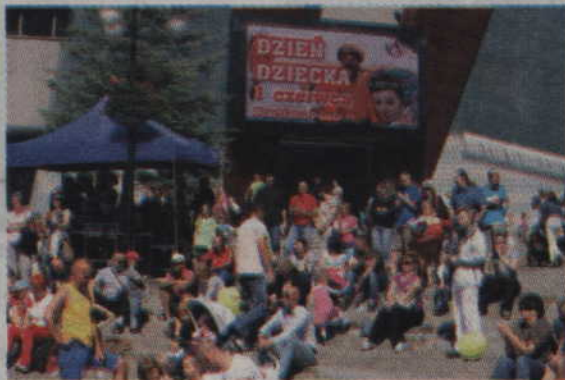
Imprezę z okazji Dnia Dziecka przygotowało Kwidzyńskie Centrum Kultury.