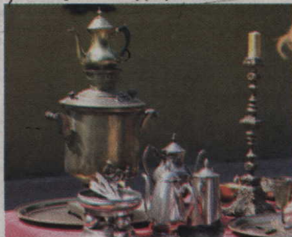
Samowar jest dziś prawie zapomnianym urządzeniem.