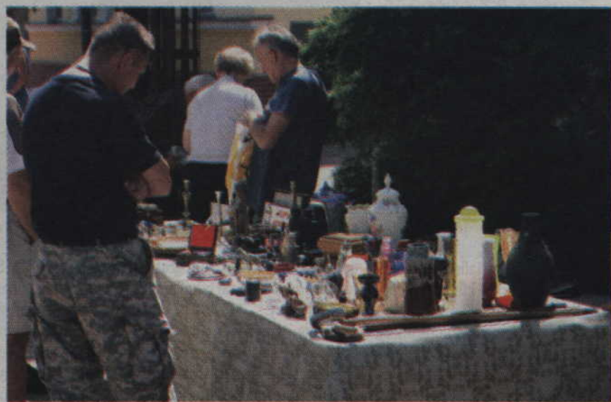
Na stoiskach spotkać można było dosłownie wszystko.