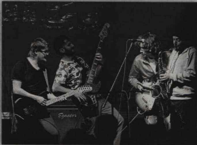
Zespół „Akurat” podczas kwidzyńskiego koncertu.