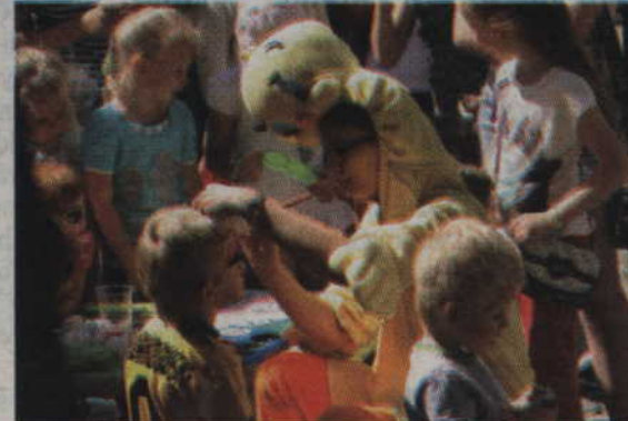
Chętnych do pomalowania swej twarzy nigdy nie brakowało.