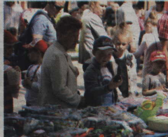
Na festynie nie mogło zabraknąć stoisk z zabawkami oraz słodkościami.