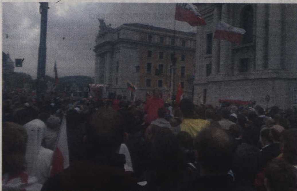
Tak wyglądały ulice stolicy Włoch w dniu kanonizacji.