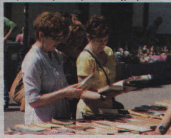
Za jedną złotówkę można było zakupić jedną z wystawionych pozycji książkowych.