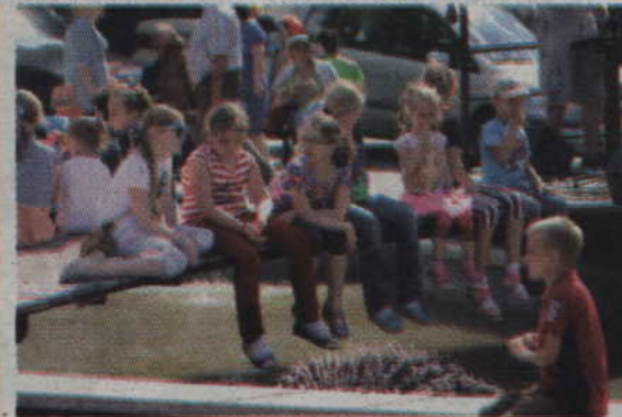
W oczekiwaniu na kolejny występ.