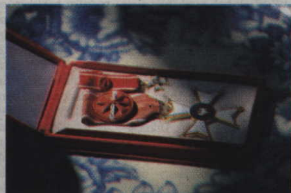
Wystawiony medal „Polonia Restituta”.