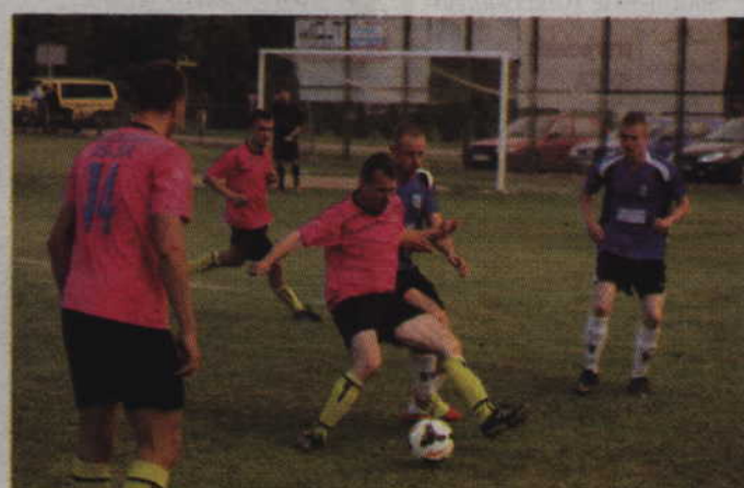
Wisła przegrała na własnym terenie z Borowiakiem 1:4.