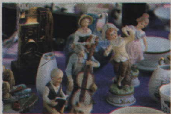
Porcelanowe figurki również znajdowały swoich zwolenników.