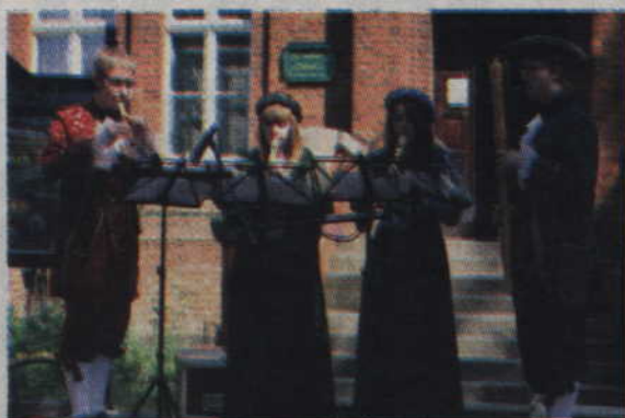
Atrakcją był występ zespołu muzyki dawnej.