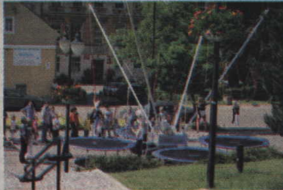
Dzieci chętnie korzystały również z ustawionych trampolin.