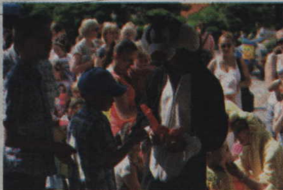
Jeśli ktoś chciał otrzymać wymodelowanego balonika musiał poczekać w kolejce.