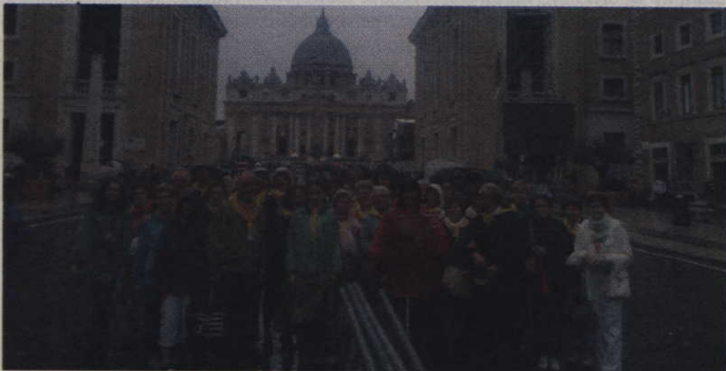
Kwidzyńscy pielgrzymi w Rzymie.

Był to również dzień, w którym kwidzynianie udali się na drugą stronę „włoskiego buta”.