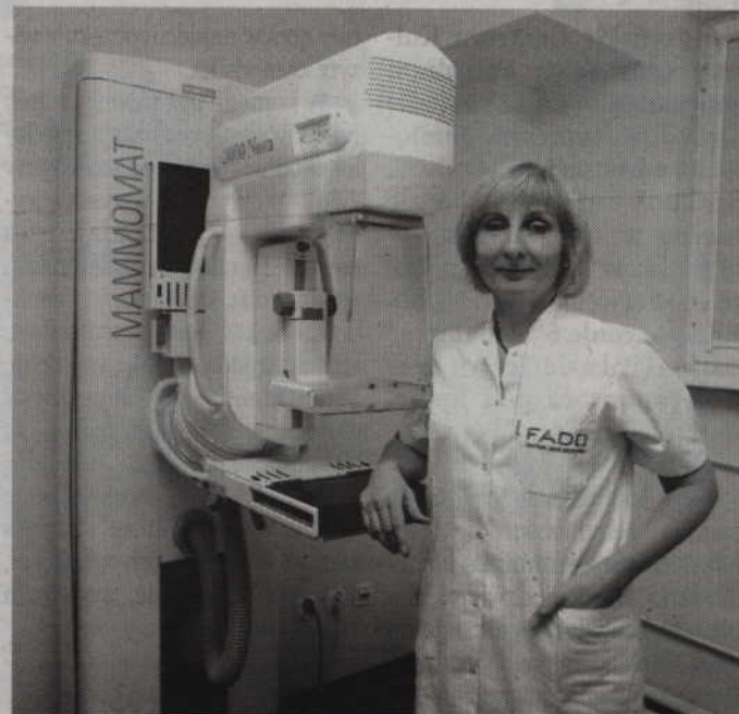
Bezpłatne badanie mammograficzne można będzie wykonać w Kwidzynie już od najbliższego poniedziałku.

Populacyjny Program Wczesnego Wykrywania Raka Piersi skierowany jest do kobiet zdrowych, które nie chorowały wcześniej na raka piersi. Ma na celu objęcie swoim zasięgiem jak największą liczbę kobiet w populacji 50 - 69 lat, czyli najbardziej narażonej na zachorowanie na raka piersi. Otrzymywany wynik badania skryningowego (prześwietlenia) to ocenione przez