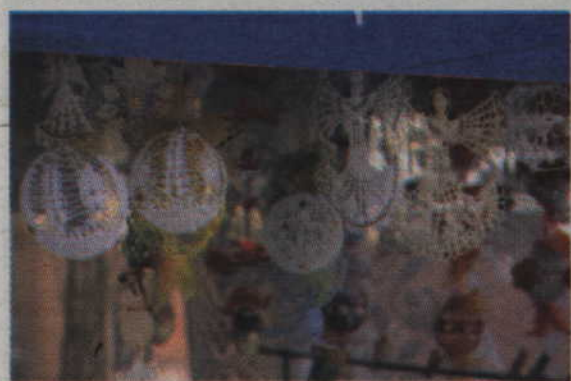
Efektowne dekoracje wykonane na szydełku.