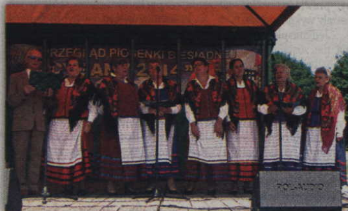
Na scenie zespół „Pomerania” z Kisielic.