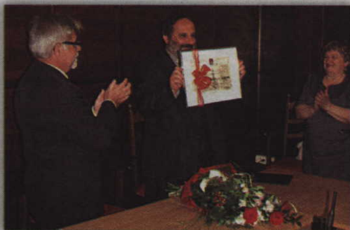
Wręczenie honorowego tytułu odbyło się na specjalnej sesji Rady Miasta i Gminy.

- W latach 50. ubiegłego wieku mój tata był w Prabutach w miejscowym sanatorium. Swoje wrażenia z pobytu opisał w pamiętniku. Przed kilkoma laty postanowiłem wydać jego pamiętnik i wówczas po raz kolejny natrafiłem na nazwę tego miasta. Nie ukrywam, że musiałem sięgnąć do atlasu i encyklopedii aby zobaczyć gdzie leżą te Prabuty. Kiedy dostałem zaproszenie na pierwszą konferencję kresową w Pra-