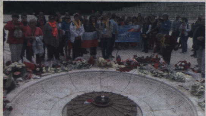
W 70 rocznicę zwycięskiej bitwy cmentarz na Monte Cassino odwiedzili również kwidzyńscy pielgrzymi.