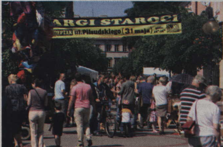
Targi staroci ponownie zagościły ma deptaku przy ul. Piłsudskiego.

Stare zegary, płyty, monety i medale – to tylko cześć rzeczy, które pojawiły się na XV Targach Staroci zorganizowanych przez Kwidzyńskie Towarzystwo Kulturalne. Tradycyjnie już na kwidzyńskim deptaku wystawili się zbieracze i kolekcjonerzy staroci. Można było kupić, sprzedać lub wymienić dosłownie wszystko. Nie zabrakło również stoiska biblioteki oraz Koła Gospodyń Wiejskich w Glinie. Dopisała także pogoda i mieszkańcy Kwidzyna, którzy z zainteresowaniem przyglądali się wystawionym przedmiotom. (fox)