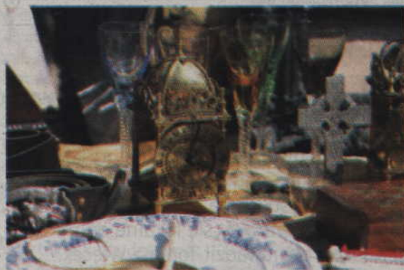
Zegary to dość częsty element stołów wystawienniczych.