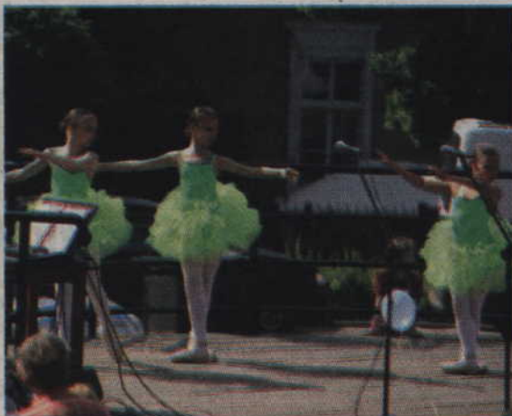
Dzieci z Zelenogradka zaprezentowały się również w pokazie baletowym.