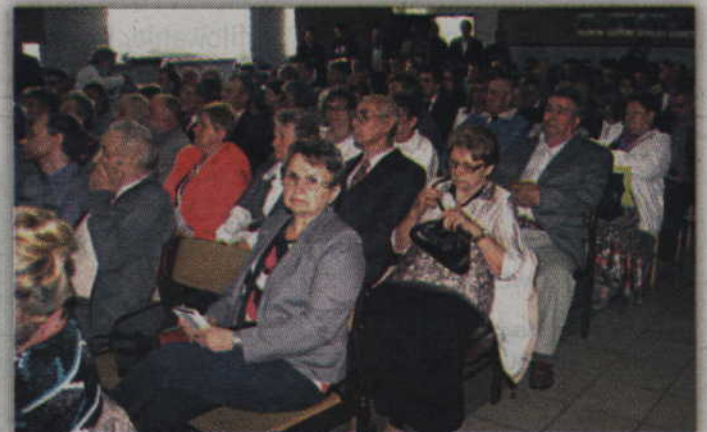
Tak duże zainteresowanie widzów nieco zaskoczyło organizatorów VI konferencji.

„Ukraiński nacjonalizm narodził się w głowach tamtejszej inteligencji. To nie byli przypadkowi ludzie, ale osoby wykształcone, obywatele II Rzeczypospolitej. Chcąc stworzyć niepodległą Ukrainę, stawiali sobie za cel pozbycie się innych narodów