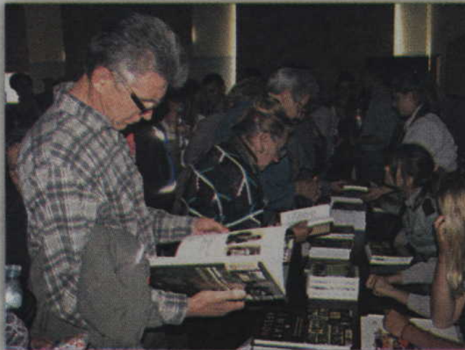
Podczas konferencji można było m.in. zakupić książki o tematyce kresowej.