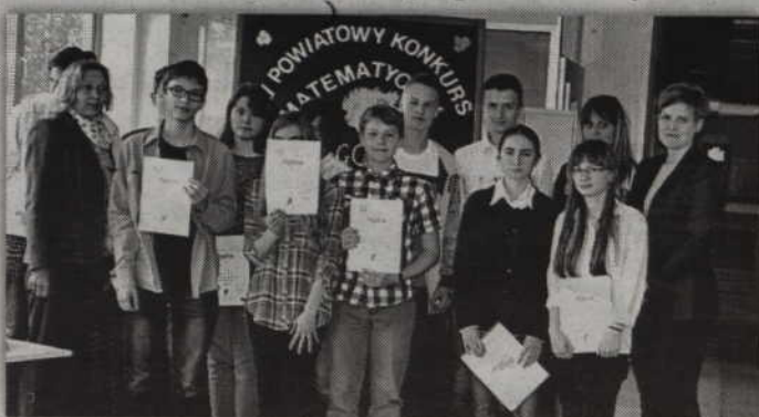
Laureaci tegorocznego Powiatowego Konkursu Matematycznego „Pitagoras”.