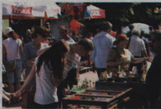
Mieszkańcy z zainteresowaniem przyglądali się wystawionym przedmiotom.