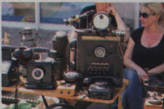
Wśród wystawionych rzeczy były m.in. stare telefony.