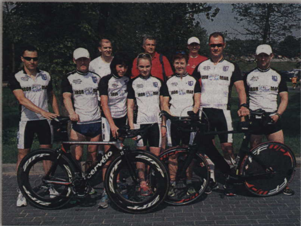
Kwidzyńska reprezentacja KTS „Ironman”.