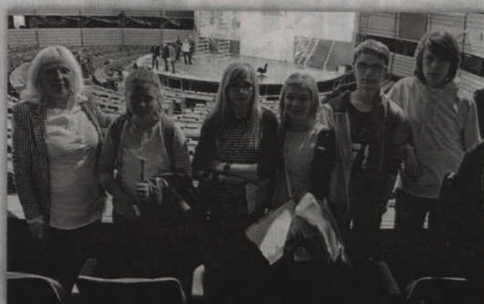
Wspólna fotografia w sali plenarnej PE.