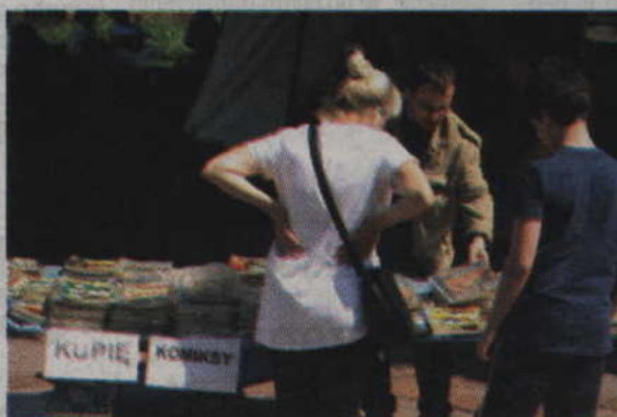
Amatorzy komiksów również znaleźli coś dla siebie.