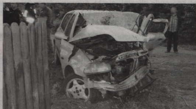
Tak wyglądało renault clio auto po uderzeniu w przydrożne drzewo. Fot. PSP Kwidzyn

W sobotę - 31 maja, tuż przed godziną 4 rano, doszło do groźnego wypadku w Rozpędzinach. 26-letni mieszkaniec powiatu kwidzińskiego stracił panowanie nad samochodem i uderzył w przydrożne drzewo. W wyniku poniesionych obrażeń zmarł. Czterej pasażerowie auta trafili do szpitala.