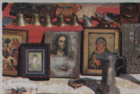
Wśród prezentowanych rzeczy można było dostrzec również ikony.