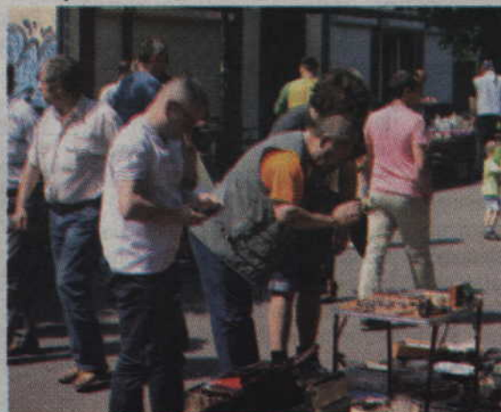
Atrakcyjne przedmioty zawsze warto obejrzeć z bliska.