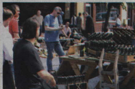
Na deptaku można było również podziwiać kolekcję starych butelek.