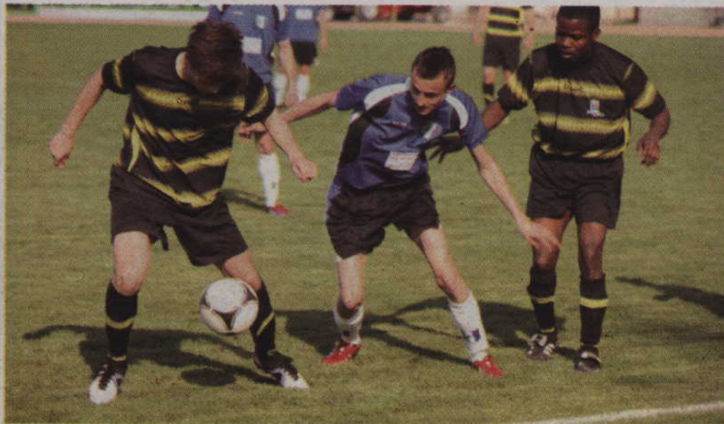
Piłkarze Rodła tracą już do lidera 14 punktów.

Relax - Pogoń 2:1, Chojniczanka II - Sokół 6:0, Delta - Kornowscy Szarża 4:0, Grom - Wda 2:3, Wisła - Borowiak 1:4, KP - Rodło 0:0, Orzeł - Centrum 0:0, Błękitni - Radunia 1:1.