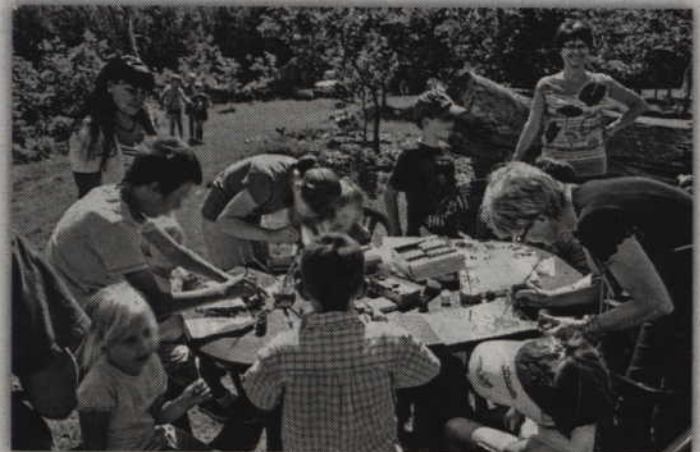
Dzień Rodzicielstwa Zastępczego pozwala na integrację rodzin zastępczych oraz ma zachęcać do zgłaszania się kandydatów na rodziców zastępczych.

Przewodniczący rady gminy Kwidzyn zwrócił uwagę, że w mediach pojawia się coraz więcej dra-