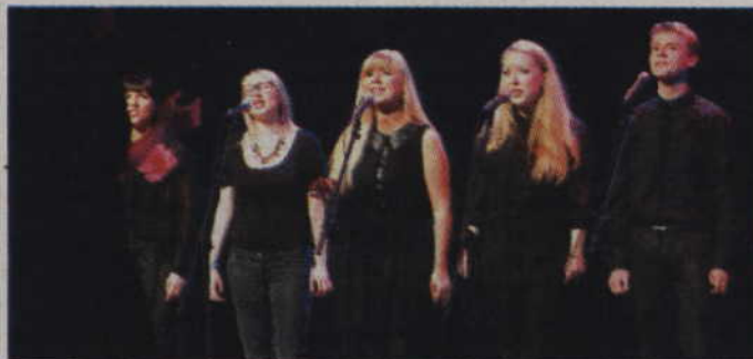
Podczas „Parafiady” posłuchać będzie można m.in. chóru „Harfa Gospel Choir”.