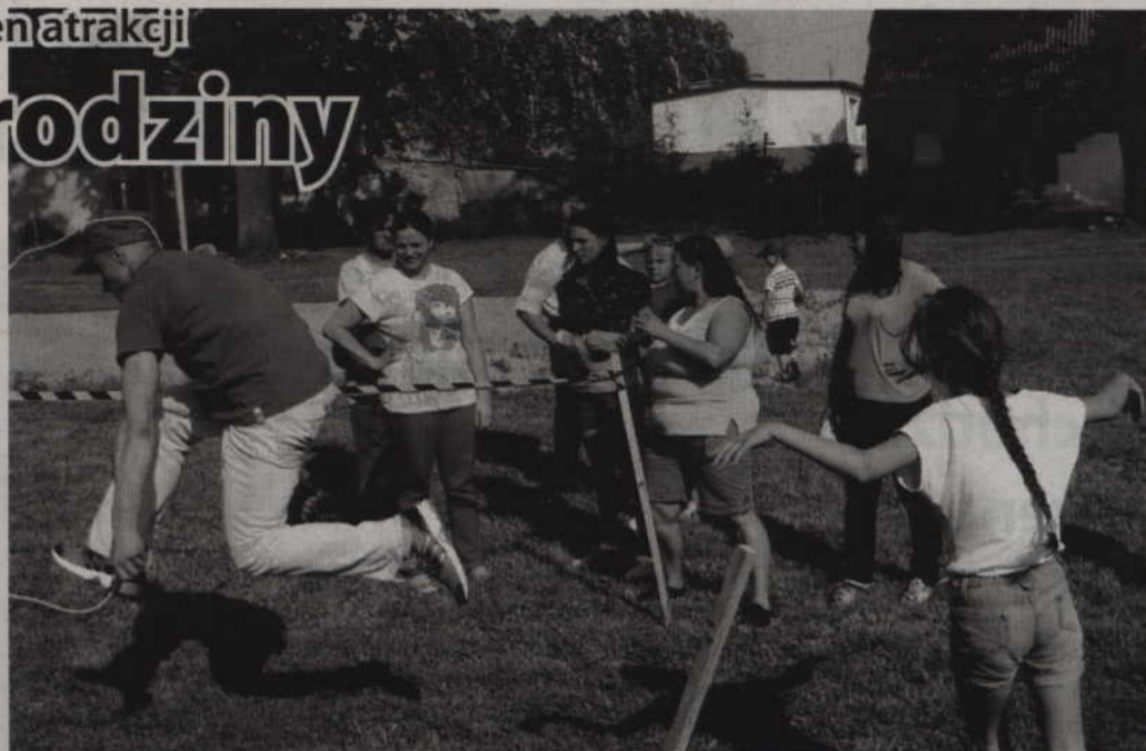
W konkurencjach sportowych trzeba było wykazać się dużą zręcznością.

zabawach mogli wystąpić zarówno najmłodszy, jak i ich starsi koledzy. Głównym punktem naszego festynu, który cieszył się dużą popularnością, były zawody rodzinne. W tej konkurencji małżonkowie mogli rywalizować ze sobą w przeciwnych drużynach. Chodziło nam o zaangażowanie jak największej liczby naszych mieszkańców. Ostatecznie do zmagania przystąpiło 9 drużyn – informuje S. Chejnowski.