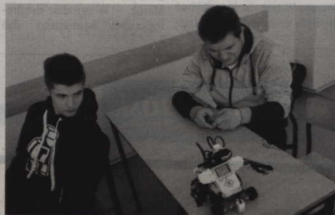
Uczestnicy zajęć próbują swoich sił w konstruowaniu i programowaniu automatów oraz robotów.

Warto dodać, że Centrum Kształcenia Zawodowego i Ustawicznego nawiązało współpracę