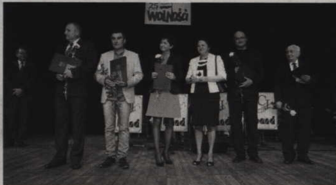
Wyróżnieni przedsiębiorcy na deskach kwidzińskiego Teatru.