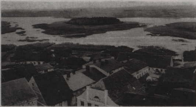
Jezioro Wielkie na przedwojennej fotografii.

Stowarzyszenie Miłośnicy Ziemi Gardejskiej „Gardanum” zaprasza wszystkich mieszkańców na spotkanie i dyskusję na temat „Czy warto przywrócić jezioro Wielkie w Gardeji?”. Spotkanie odbędzie się w najbliższy wtorek – 17 czerwca w sali Gminnego Ośrodka Kultury.