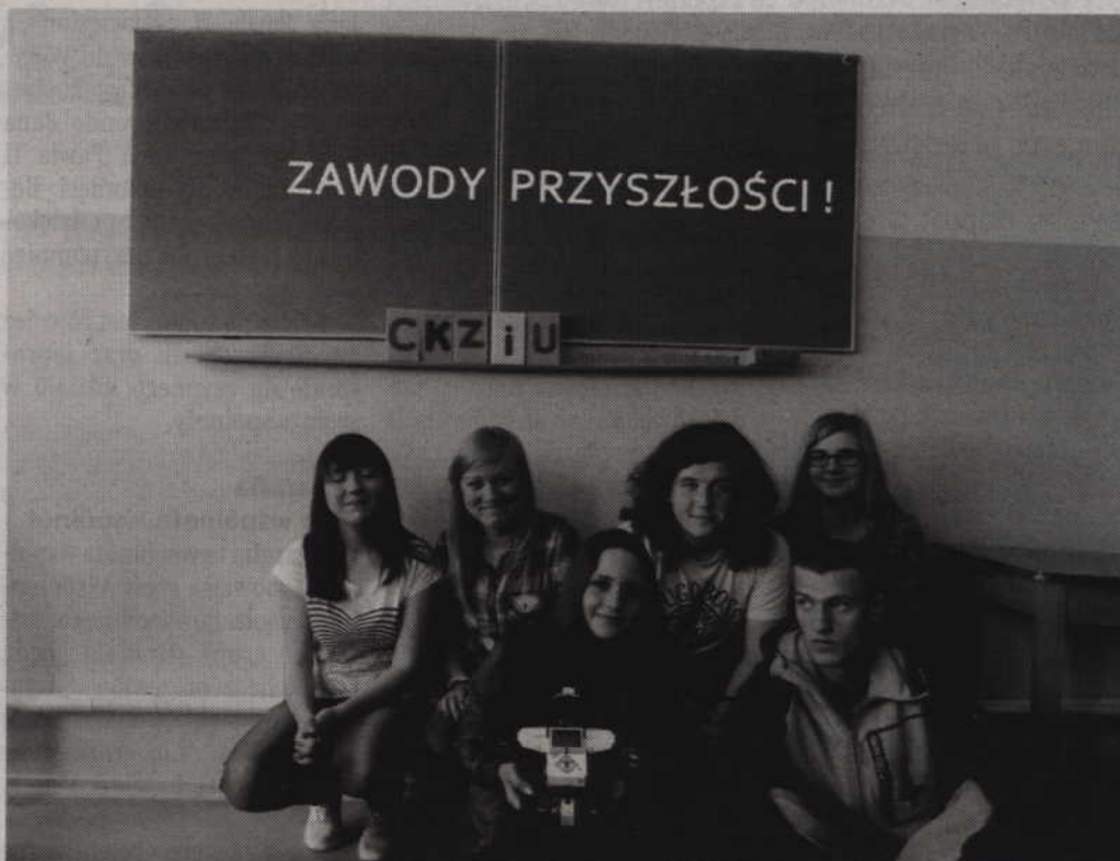
Uczniowie Centrum Kształcenia Zawodowego i Ustawicznego poznają zawody przyszłości.

Samodzielne wykonanie z pozoru trudnych projektów sprawia młodym konstruktorom wiele satysfakcji i radości oraz umacnia wiarę we własne możliwości. Całe przedsięwzięcie nie jest nudnym czy monotonnym przekazaniem wiedzy teoretycznej, lecz podparto je aspektami praktycznymi, co pozwala na zastosowanie zdobytej wiedzy w