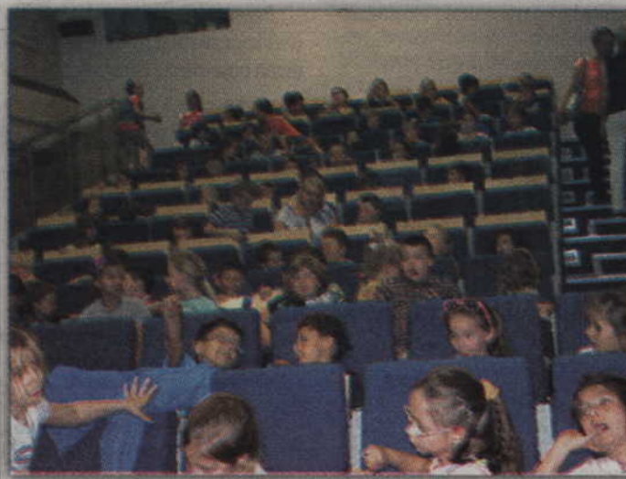
Najmłodsi uczniowie w sali audiowizualnej KCK.

Pedagogiczna Biblioteka Wojewódzka w Gdańsku, Filia w Kwidzynie, już po raz drugi zorganizowała zajęcia z edukacji filmowej. W spotkaniu brali udział uczniowie klas I-III, a impreza zorganizowana została w ramach XII Bałtyckiego Festiwalu Nauki.