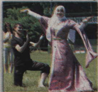
Pokazy tancerzy z zespołu „Kamala”.