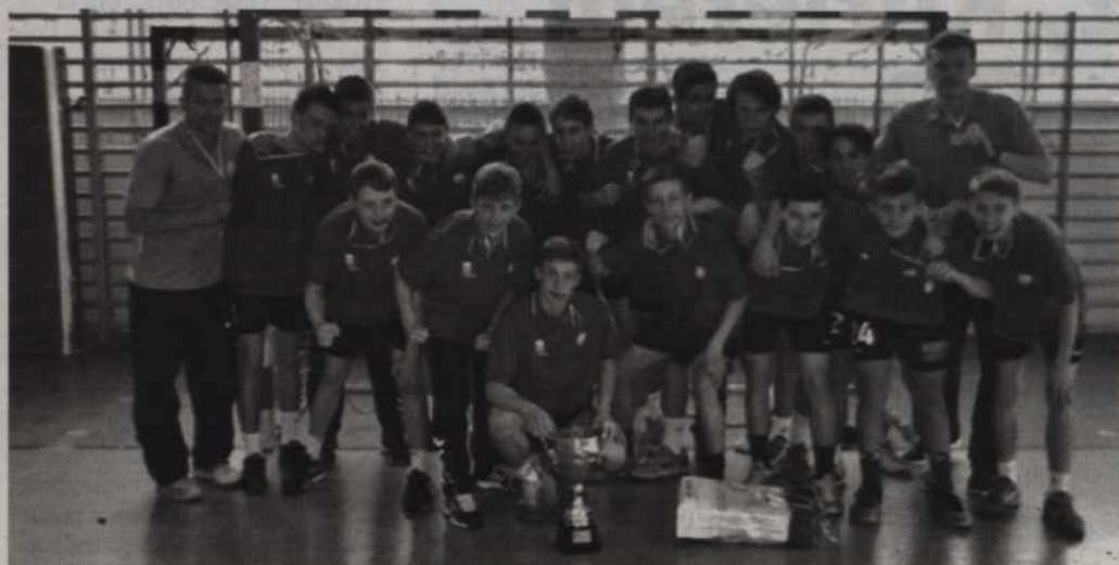
Złoty zespół MTS Kwidzyn został najlepszą drużyną w Polsce w kategorii młodzików.

W ćwierćfinale MTS Kwidzyn trafił na Pałac Młodzieży Tarnów. Do przerwy kwidzynianie remisowali z rywalami 9:9, jednak mecz ostatecznie zakończył się wygraną MTS 20:17. W półfinale zawodnicy z Kwidzyna trafili na drużynę Nike Ciechanów i do przerwy przegrywali z