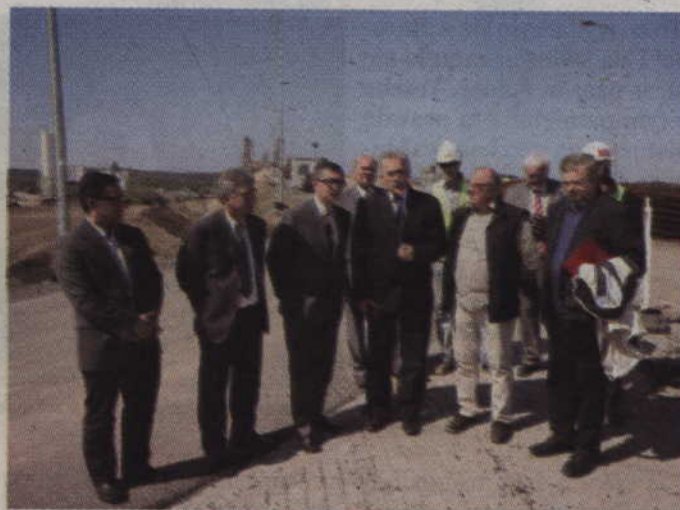
(fox) Parlamentarzyści podczas ubiegłorocznego objazdu dróg wojewódzkich.

również planowane inwestycje, czy to z pieniędzy unijnych w ramach tzw. Regionalnego Programu Operacyjnego czy też z własnego budżetu, a także ponad 50 mln zł przeznaczonych na projekt Powiśle. Z inicjatywy ministra Kozdronia rozmawialiśmy także o tym, o co zabiegaliśmy przez wiele lat, aby powstał pewien harmonogram modernizacji dróg wojewódzkich. Nie chodzi tu tylko o Powiśle, ale wszystkie drogi na Pomorzu. Panowie dyrektorzy stwierdzili, że przymierzają się do takiego projektu.