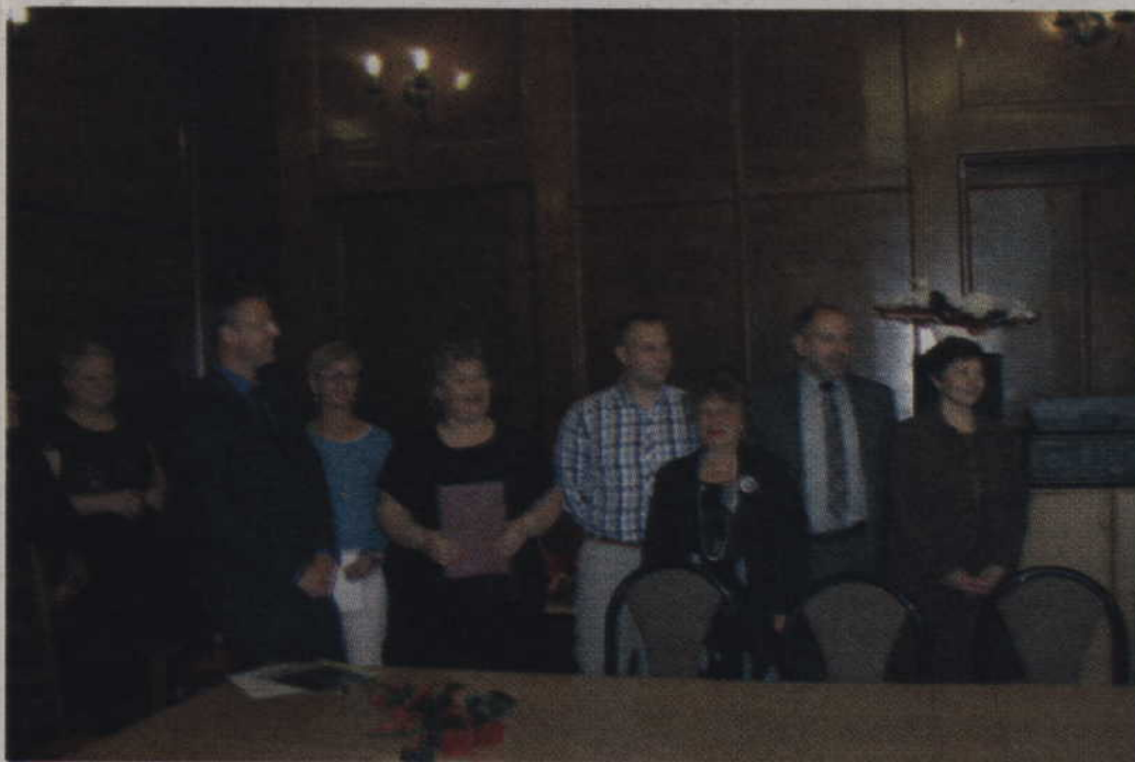
Nagrodzona „Supernova” w niepełnym składzie.

Trzecia nagroda, tym razem zbiorowa, powędrowała do grupy teatralnej „Supernova” z Obrzynowa. Autorem wniosku o przy-