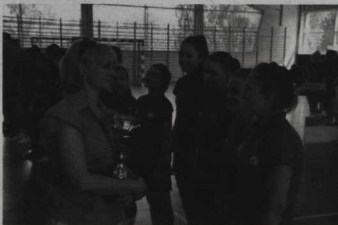
Zawodniczki MTS Kwidzyn obierają puchar za zdobycie II miejsca finale Pucharu ZPRP.