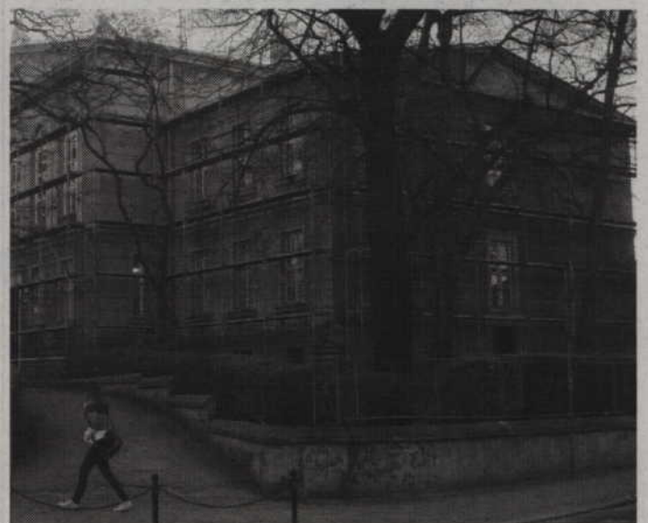
Termomodernizacja Zespołu Szkół Ponadgimnazjalnych nr 1 ma zakończyć się 15 sierpnia.

Wicestarosta dodaje, że bardzo dobrze układa się współpraca z Dariuszem Chmielewskim, pomorskim konserwatorem za-