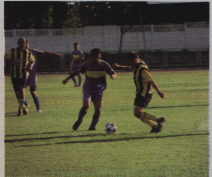
Zawodnicy Wisły nie sprościli kwidzyńskim piłkarzom przegrywając derbowe spotkanie aż 6:1.