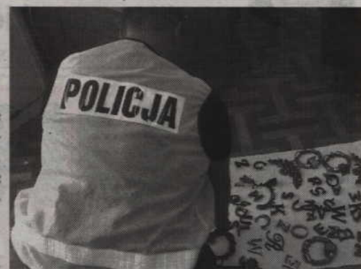
Przy zatrzymanym mężczyźnie znaleziono 380 liter, pocięte krzyże oraz inne ozdoby wykonane z mosiądzu.

-O próbie sprzedaży liter zagrabionych z nagrobków poinformował właściciel skupu złomu - wyjaśnia Agnieszka Stefańska, rzecznik prasowy Komendy Powiatowej Policji w Kwidzynie. - Policjanci ustalili, że zatrzymany mężczyzna okradł około 100 nagrobków na cmentarzu komunalnym w Kwidzynie. Złodziej odrywał elementy wykonane