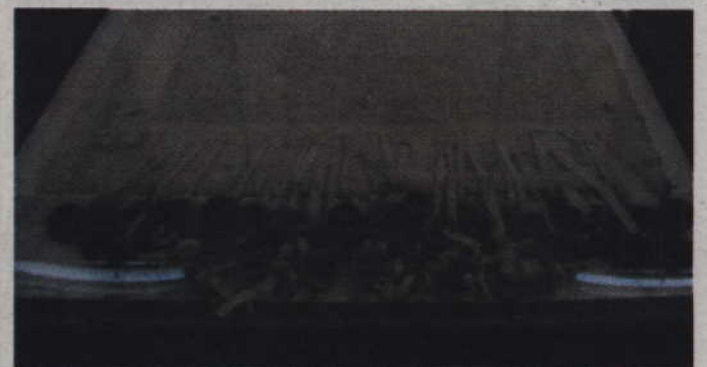
Akt założycielski Związku Pruskiego jest tak cenny, że jego wystawie towarzyszyły specjalne środki bezpieczeństwa

Pruskiego trafił do miejsca jego narodzin.