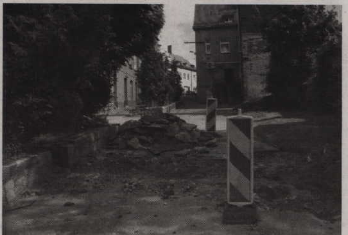
W lipcu ulica Zamkowa Góra zyska staromiejski urok

Władze miasta czynią obecnie starania, aby doprowadzić do remontu budynku przy Zamkowej Górze. Należą one jednak do wspólnot i miasto nie może przeznaczyć na remonty pieniędzy z budżetu. Szukane są możliwości prawne, aby pomóc wspólnotom w przeprowadzeniu remontów elewacji. (jk)