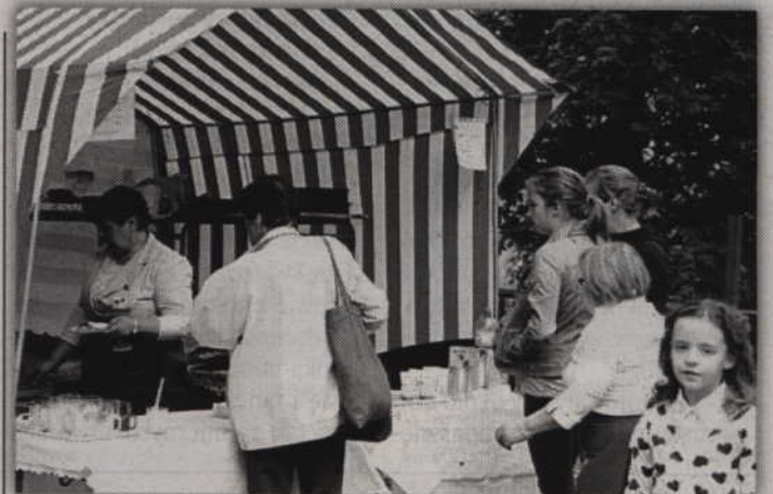
Chętni mogli skusić się na bigos, żurek, kawę, herbatę lub coś słodkiego.