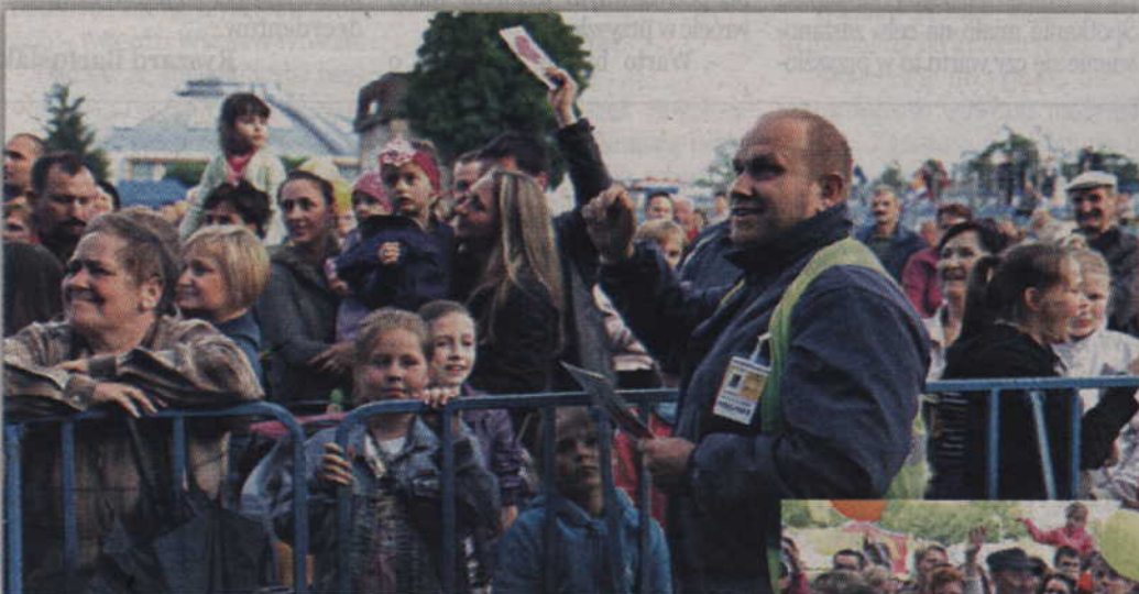
Kwidzyńska publiczność dobrze się bawiła na tegorocznych koncertach gwiazd.