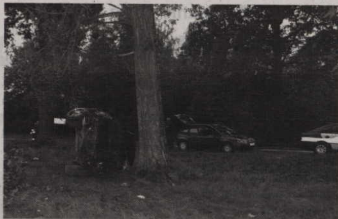
Alkohol wziął górę nad zdrowym rozsądkiem

Trzy dni później 19 czerwca doszło do dwóch następnych wypadków drogowych na terenie powiatu kwidzyńskiego. Pierwszy z nich miał miejsce około godziny 18.30 na drodze wojewódzkiej Licze - Osno w gminie Kwidzyn. Kierujący Toyotą stracił panowanie nad pojazdem i uderzył w przydrożne drzewo a następnie wyrzucił się. Trzy osoby, które jechały tym pojazdem