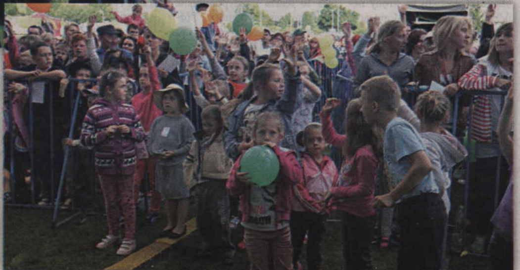
Kwidzyńska publiczność dobrze się bawiła na tegorocznych koncertach gwiazd.