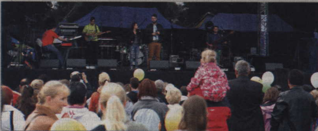
Na scenie stale coś się działo, nie można było się nudzić.