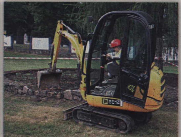
Dla najmłodszych organizatorzy przygotowali szereg atrakcji.

mógł w każdej chwili podejść do specjalnego namiotu. Tam dyżurował personel kwidzińskiego szpitala. Sobotni koncert Urszuli to przypomnienie jej największych przebojów. Wy-