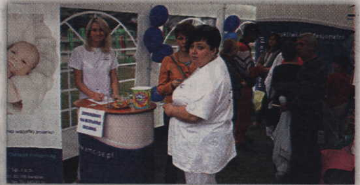
Kwidzyński szpital zapraszał do zmierzenia poziomu cukru i zmierzenia ciśnienia.