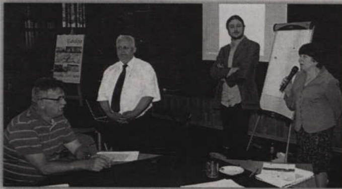
Debatę zorganizowało stowarzyszenie Gardanum.

Rejon Gardei nie należy do rejonów bogatych w wodę. Wód powierzchniowych jak na lekarstwo a te, które się pojawiają w wyniku opadów są natychmiast odprowadzane do rzeki Osy. Poprzedni gospodarze - Niemcy postanowili osuszyć trzy jeziora. Na ich dnie miały powstać w pierwszej kolejności pastwiska, grunty orne a w najlepszym wy-