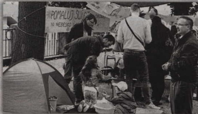
Jedno ze stoisk ustawionych wokół kościoła Św. Trójcy.

Podczas festynu zorganizowanego na terenach wokół kościoła pw. Św. Trójcy doskonale bawili się zarówno najmłodsi jak i dorośli. Dzieci chętnie uczestniczyły w zabawach i konkursach, a także malowały czy też pozowały do zdjęć. Nieco starsi mogli posłuchać koncertu zespołu młodzieżowego „Trishagion”, a także mogli wziąć udział w ewangelizacji prowadzonej przez wspólnoty neokatechumenalne. Dla chę-