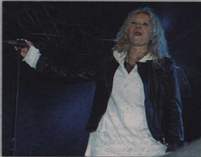
Urszula zaśpiewała swoje największe przeboje.