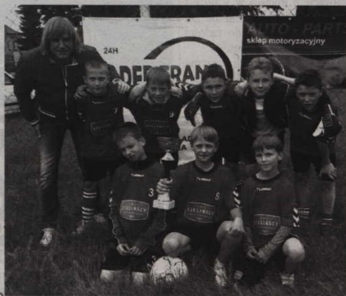
Turniej wygrali zawodnicy Zespołu Szkół Specjalnych w Kwidzynie.

Po podliczeniu zdobytych punktów pierwsze miejsce w 14