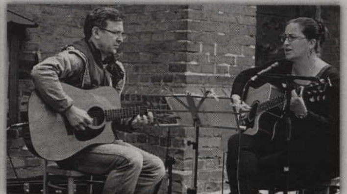
Podczas festynu nie zabrakło również muzyki.