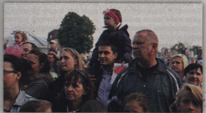
Każde miejsce do oglądania artystów występujących na scenie jest dobre.