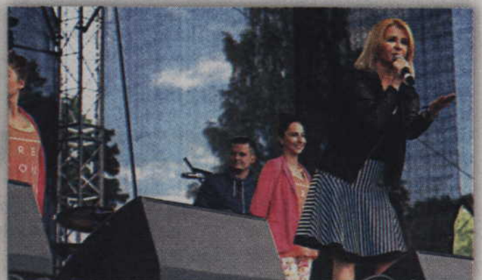
Występ Majki Jeżowskiej podobał się publiczności.