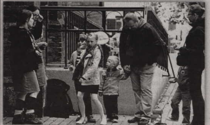
Uczestnicy rywalizacji w rzucie beretem na odległość.