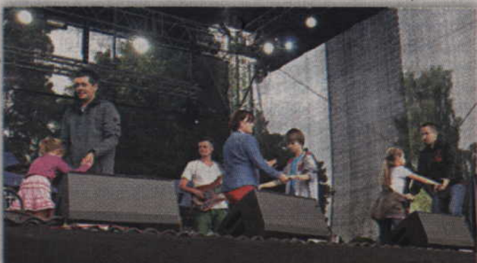
Majka Jeżowska do wspólnej zabawy na scenie zaprosiła dzieci i ich rodziców.