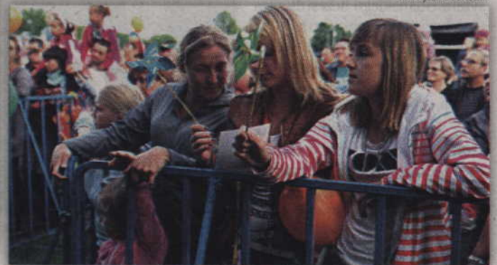
Kwidzyńska publiczność dobrze się bawiła na tegorocznych koncertach gwiazd.