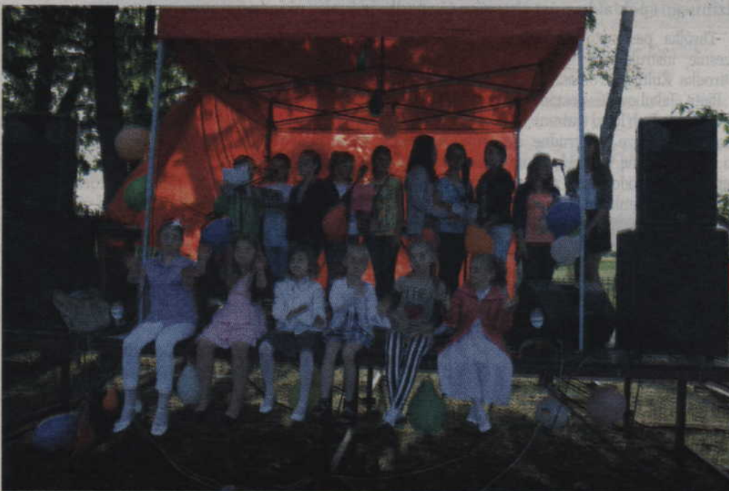
Piosenki umiły czas przebywającym na festynie parafialnym.