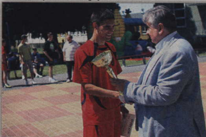
Turniej wygrali zawodnicy Zespołu Szkół Specjalnych w Kwidzynie.

Uczniowie Zespołu Szkół Specjalnych w Kwidzynie zwyciężyli w 14 powiatowych integracyjnych zawodach sprawnościowych rozgrywanych o puchar starosty kwidzyńskiego. W zawodach rywalizowało pięć ośrodków.