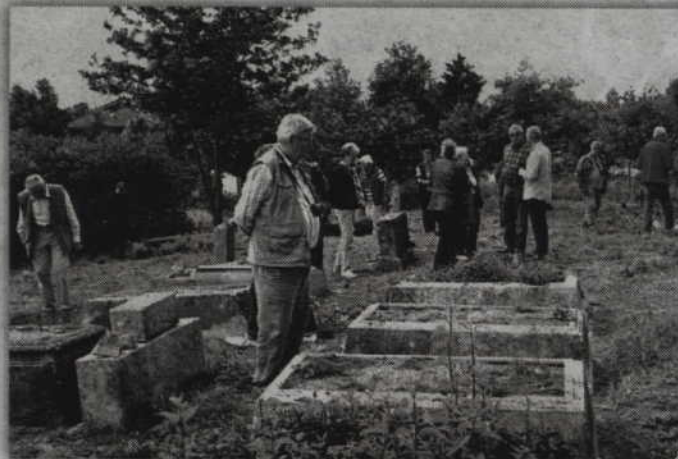
Goście z Niemiec odwiedzili uratowany cmentarz.