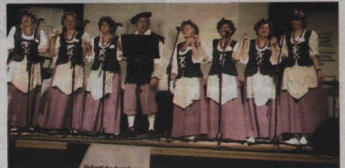
Na festiwalowej scenie prezentuje się zespół „Powiślanki”.