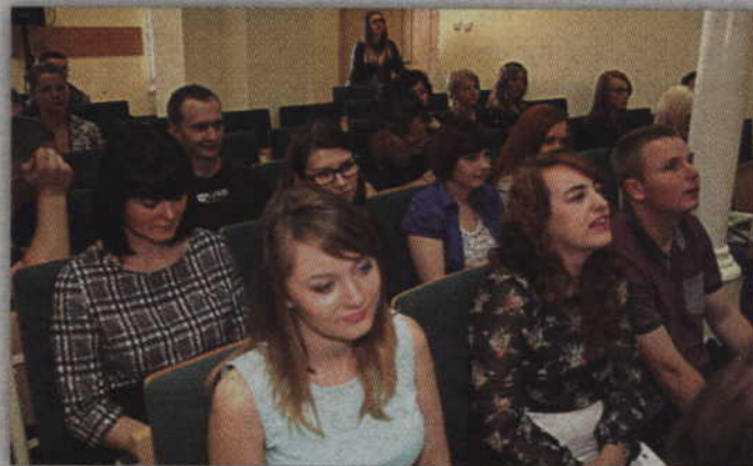
Szkolenie zorganizowane przez KPPT ukończyło 150 osób