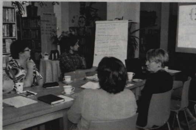
W korzeniewskiej filii Biblioteki Publicznej Gminy Kwidzyn odbyło się już pierwsze spotkanie partnerów projektu „Pakujemy walizkę - w podróż na całe życie”.