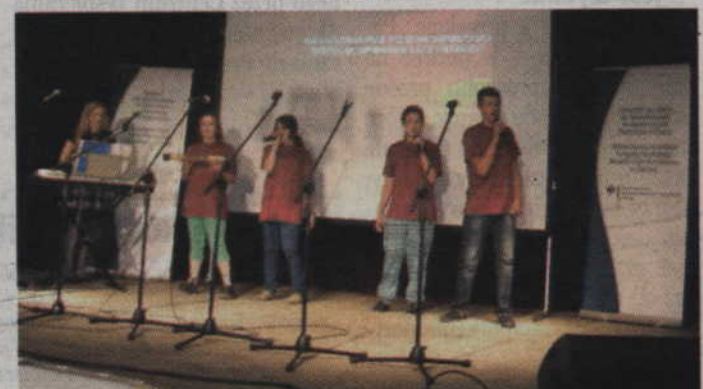
Towarzystwo Kulturalne Ludności Niemieckiej „Ojczyzna” reprezentowała także grupa „Hoffband”.