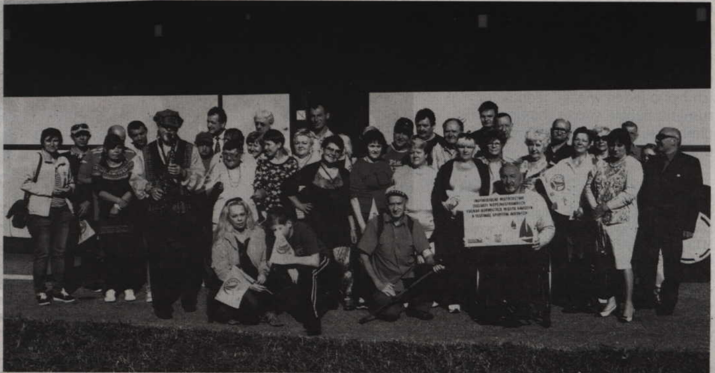
Pięćdziesięciu niepełnosprawnych żeglarzy oraz sympatyków żeglarstwa weźmie udział w Festiwalu Sportów Wodnych w Giżycku.

-Wyjeżdżamy do Międzynarodowego Centrum Żeglarstwa i Turystyki Wodnej w Giżycku. Jedziemy dużą grupą i będziemy widoczni na kei. W festiwalu wezmą udział osoby ze Stowarzyszenia na Rzecz Osób z Autyzmem, Warsztatu Terapii Zajęciowej w Ryjewie, Związku Emerytów, Rencistów i Inwalidów w Kwidzynie, Amazonki, a także osoby indywidualne z Kwidzyna oraz okolic. Będziemy tylko żeglować, ale zaplanowaliśmy też zmagania na lądzie, w tym rozgrywki szachowe, warcaby, tenis stołowy, a na wodzie oczywiście żeglarstwo i kajakerstwo. Podczas festiwalu wyłonimy mistrza żeglarskiego 2014 roku. Oprócz mistrzostw wystartujemy w Festiwalu Sportów Wodnych na jeziorze Kisajno – informuje