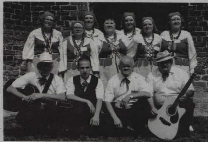
Podczas imprezy jubileusz 15-lecie obchodzić będzie kwidzyński zespół „Powiślanki”.

Impreza rozpocznie się od przemarszu uczestników tegorocznego spotkania kapel i zespołów ludowych. Artyści przejdą w barwnym korowodzie od ul. 11 Listopada na plac Jana Pawła II, gdzie odbywać się będą prezentacje sceniczne. Po uroczystym otwarciu imprezy jubileusz 15-lecia świętować będzie kwidzyński zespół „Powiślanki”. (fox)