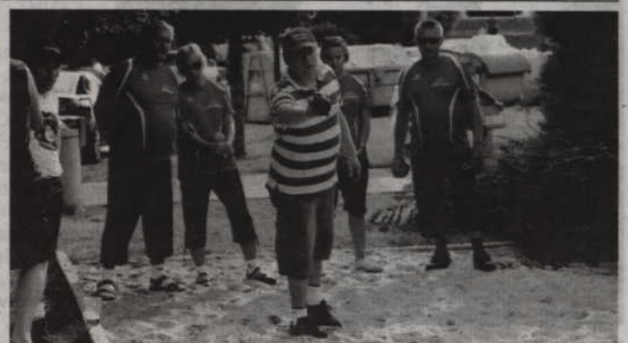
Zgłoszenia 4-osobowych drużyn przyjmowane są wyłącznie do 20 sierpnia.