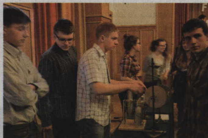
Fizyka i matematyka dla głodnych wiedzy i rozrywki.

Gdyby nie potrzeba młodych ludzi, a także wspomagających ich działania nauczycieli nie byłoby prospołecznych akcji pokazujących potrzebę wspierania więźniów sumienia, praw wyborów propagujących obywatelskie postawy, obchodów dnia wolnych wyborów i wielu innych akcji, które na stałe wpisały się w historię środowiska lokalnego.