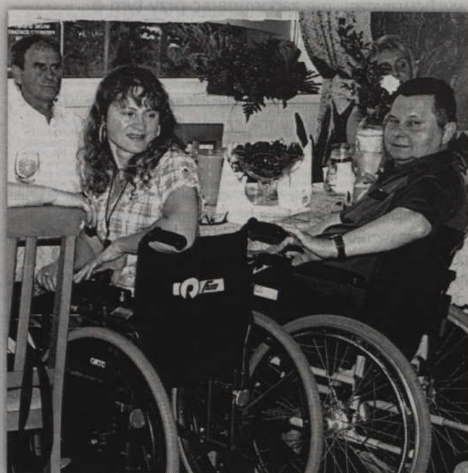
Koło liczy obecnie 16 członków, w tym 8 osób poruszających się na wózkach inwalidzkich.