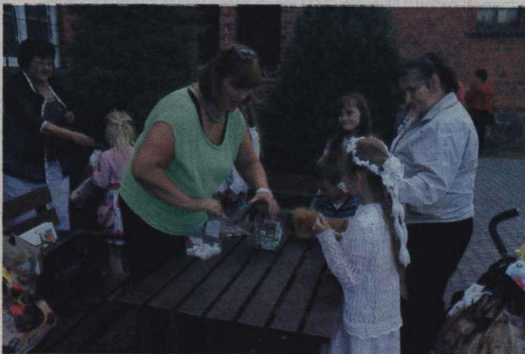
W loterii fantowej wygrywał każdy los.