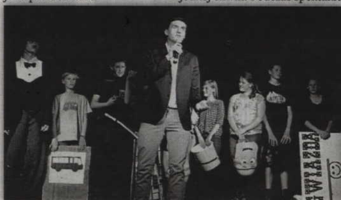
Grupa teatralna z Rakowca przypomniła świat filmu niemego.

Świat Charliego Chaplina nie był jedyną niespodzianką przygotowaną przez grupę teatralną. Na zakończenie publiczność miała okazję po raz pierwszy zobaczyć film zrobiony metodą poklatkową. Film powstał w ramach warsztatów filmowych realizowanych przez Gminny Ośrodek Kultury w świetlicach środowiskowych gminy Kwidzyn. Na zakończenie spotkania w Rakowcu, młodzi aktorzy zostali nagrodzeni prezentami przez Bank Spółdzielczy w Brodnicy, oddział w Kwidzynie. (RB)