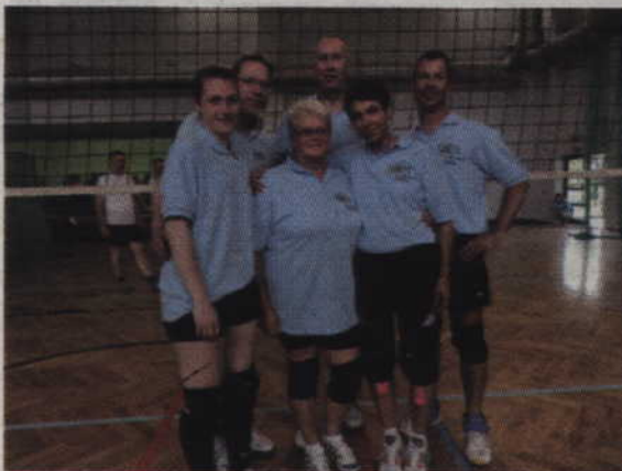
Reprezentacja Celle zwyciężyła w międzynarodowym turnieju miast partnerskich w siatkówce drużyn mieszanych.