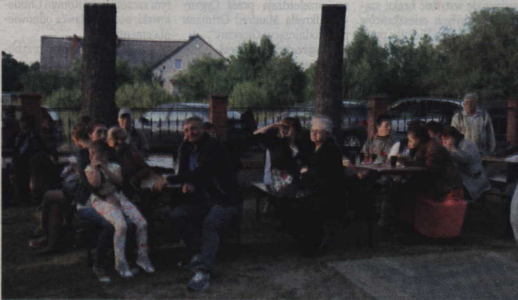
Podczas parafialnego festynu publiczność nie mogła się nudzić.