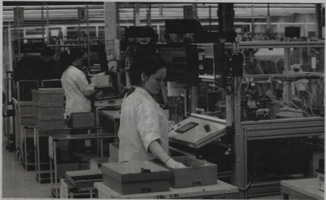
W tym roku firma Lacroix Electronics rozbudowała zakład produkcyjny w Kwidzynie oraz zwiększyła zatrudnienie.

Założona w 1997 roku fabryka Lacroix Electronics w Kwidzynie, specjalizująca się w produkcji elektroniki dla rynków moto-