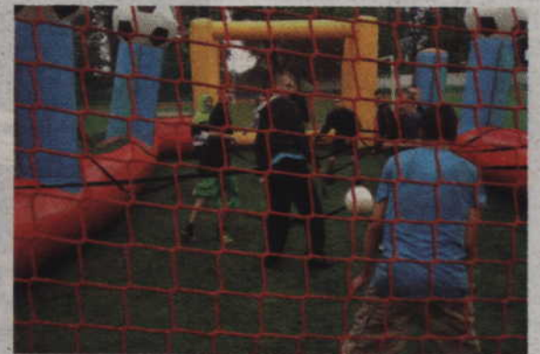
Turniej w gigantyczne piłkarzyki nie wzbudził zainteresowania kwidzyniaków.

4. Teść & Zięć (Zbigniew Jeż/ Grzegorz Wojciechowski)