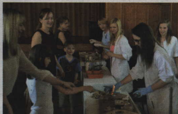
Chemiczne eksperymenty mogą być przyjemne i bezpieczne.