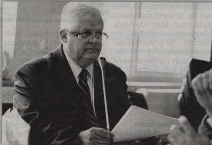
-Budżet uchwalony w 2013 roku został zrealizowany w 99 procentach. To był mercedes, majstersztyk – przekonywał K. Kwiatkowski.