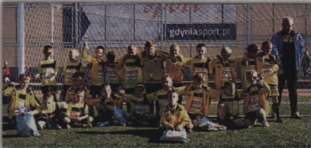
Młodzi piłkarze Rodła Kwidzyn podczas turnieju w Gdyni.

Oferty prosimy składać na adres: franczyza@coccodrillo.pl