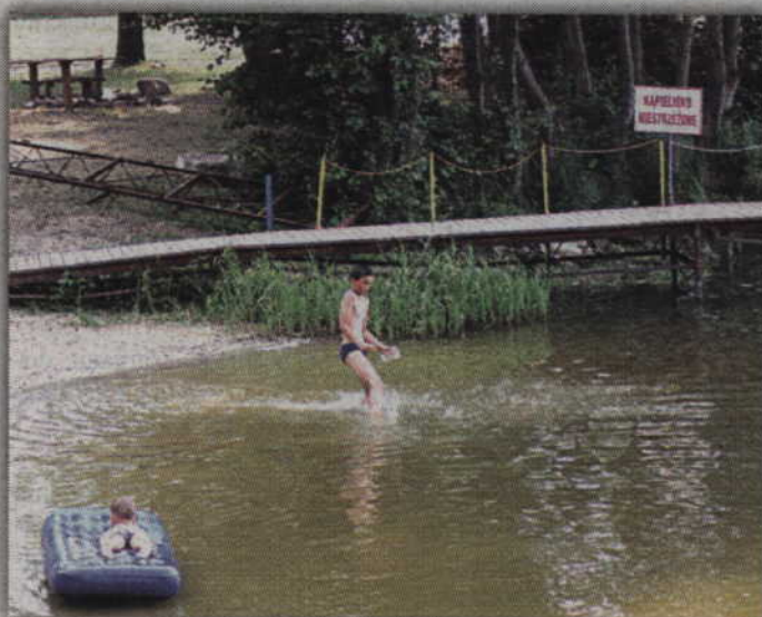
Nad jeziorem Kamień w Gardeji kąpiel ponownie będzie wzbroniona.