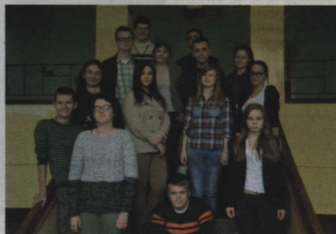
Grupa „najlepszych” przytępiana podczas szkolnej przerwy.