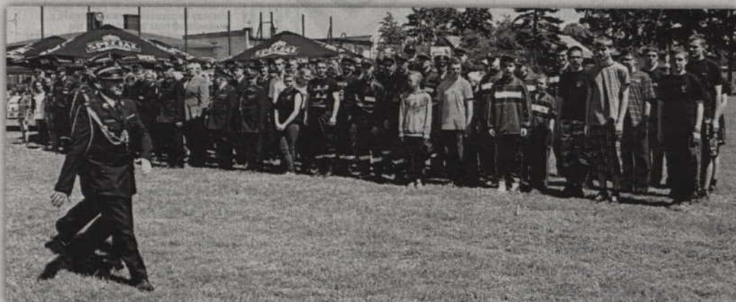
Fragment uroczystości jubileuszowych związanych z 95-leciem OSP Trzciano.