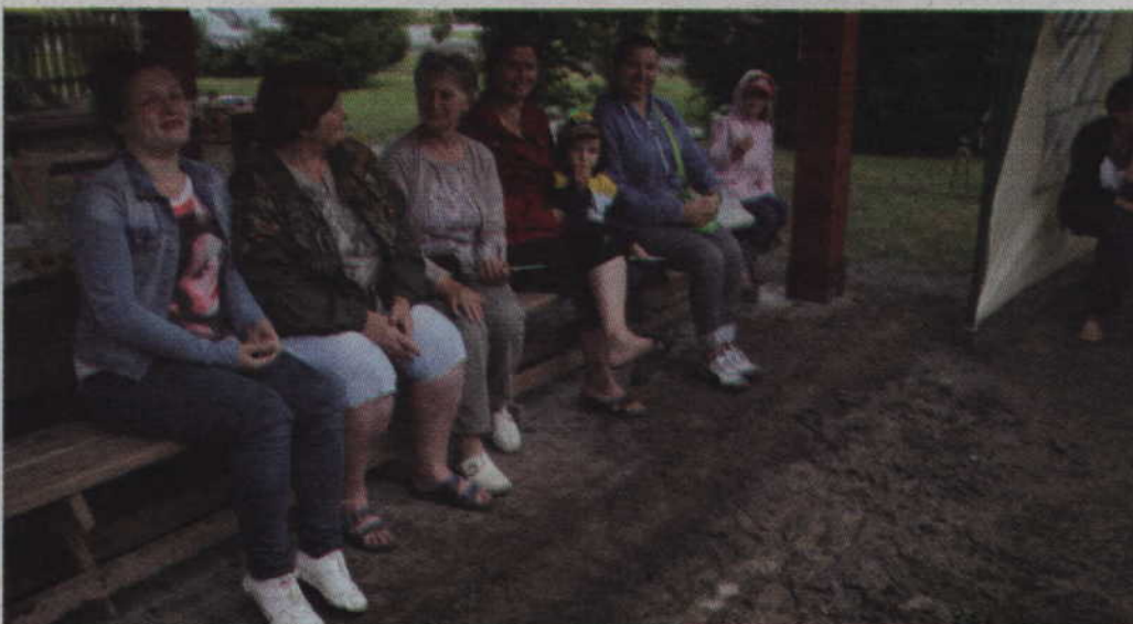
Rodzeństwo, mamy i babcie podczas sobotniego festynu.