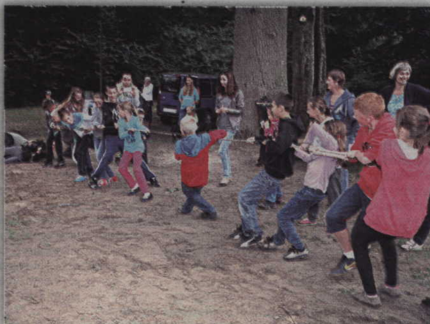
Przeciąganie liny dla pokonanych zakończyło się upadkiem.