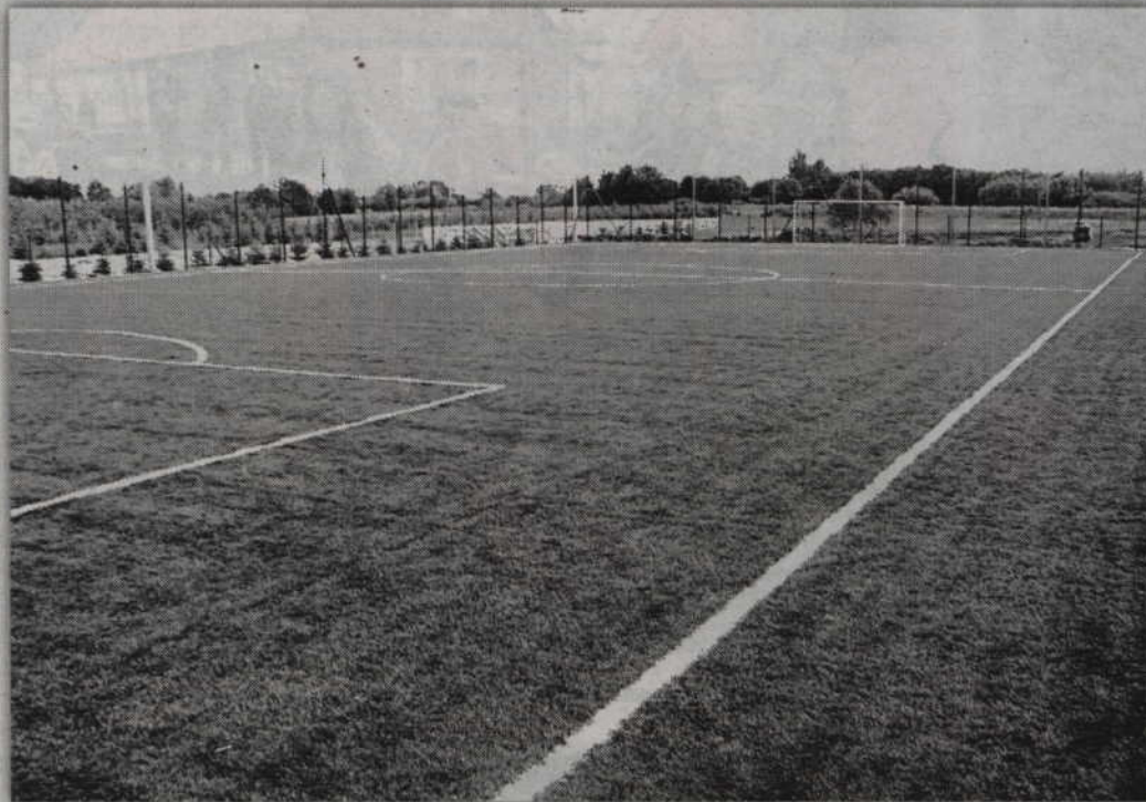
Wizualizacja przedstawia jak wyglądać będzie powstające boisko w Ryjewie.

Mieszkańcy Ryjewa otrzymają nową alternatywę dla aktywnego spędzania wolnego czasu na świeżym powietrzu. Tuż przy Gminnym Ośrodku Kultury w Ryjewie powstaje bowiem boisko do gry w piłkę nożną. Korzystanie z nowego obiektu będzie ogólnodostępne oraz nieodpłatne dla każdego miłośnika futbolu.