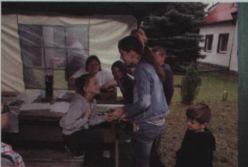
Śpiewać można w każdym miejscu.

Jak podkreślają organizatorzy dziecięcej tęczkowej soboty, tak udanej zabawy nie byłoby gdyby nie zaangażowanie pań z miejscowego koła gospodyń wiejskich. Ich praca przełożyła się na radość bawiących się dzieci. Wsparcie finansowe KGW w Glinie otrzymało natomiast od fundacji „Działaj Lokalnie”. (RB)