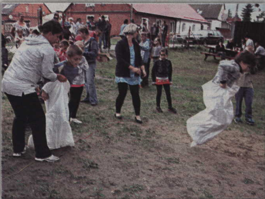
Jednym z festynowych zmagani był wyścig w workach.