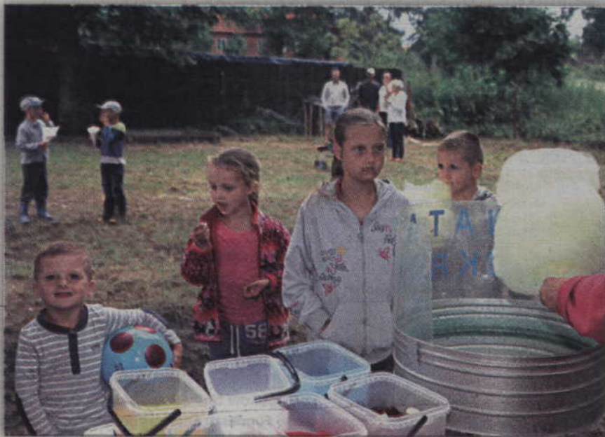
Podczas festynów wata cukrowa zawsze cieszy się dużą popularnością.

Wakacyjne miesiące to czas imprez plenerowych, które przyciągają mnóstwo publiczności. Nie inaczej było w Olszówce, kiedy to sołectwo zorganizowało kolejny festyn rodzinny. Dopisała publiczność, jednak pogoda w tym dniu była wyjątkowo kapryśna.