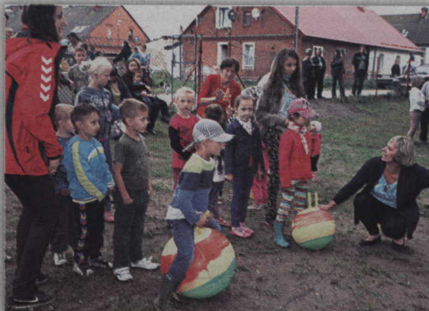
Dzieci chętnie rywalizowały w przygotowanych konkurencjach.