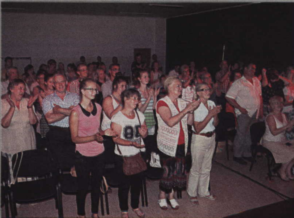
Owacje na stojąco na zakończenie małżeńskiej rocznicy.