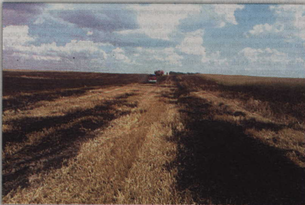
Sześć hektarów zboża na pniu spłonęło w Rakowcu, w gminie Kwidzyn.

Sześć hektarów zboża na pniu spłonęło w Rakowcu, w gminie Kwidzyn. Dym dotarł aż do Kwidzyna, wzbudzając zaniepokojenie mieszkańców. W akcji gaszenia ognia uczestniczyli strażacy z Jednostki Ratowniczo-Gaśniczej w Kwidzynie oraz ochotniczych straży pożarnej w Tychnowach, Rakowcu i Sadlinkach. Przyczyna pożaru jest nieznana. Szacunkowe straty to natomiast ok. 15 tys. zł.