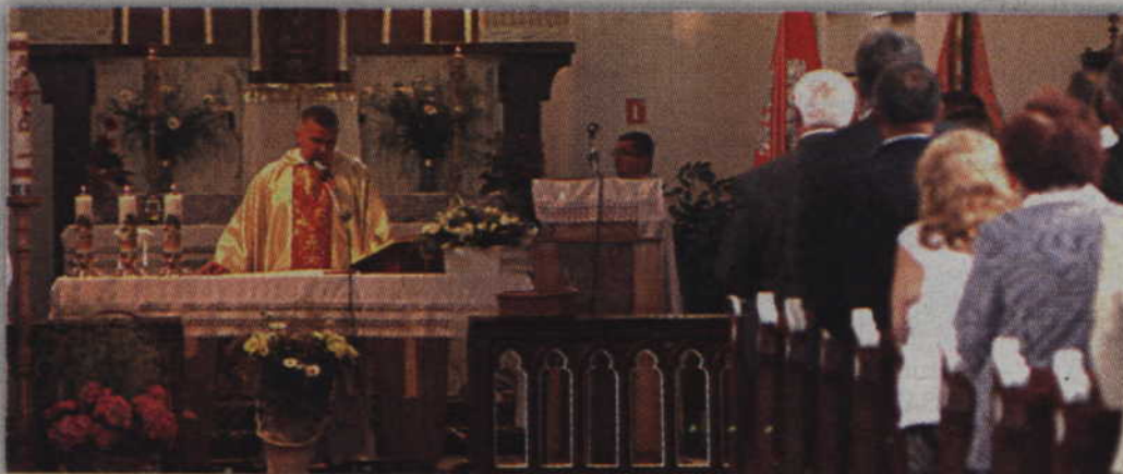
Uroczystości jubileuszowe rozpoczęły Msza święta.

- Zawsze to podkreślam na spotkaniu z dyrektorami, że podczas takich uroczystości jest nas zwyczajnie zbyt mało. To smutne i musimy nad tym pracować. Nie możemy bowiem dopuścić do takiej sytuacji, że my odejdziemy, a nasze dzieci zapomną o tych wydarzeniach. Musimy cały czas kultywować te tradycje. Nie może być też tak, że spotykamy się tylko na okrągłych uroczystościach organizowanych co 5 lat. Musimy pamiętać o tych wydarzeniach zdecydowanie częściej.