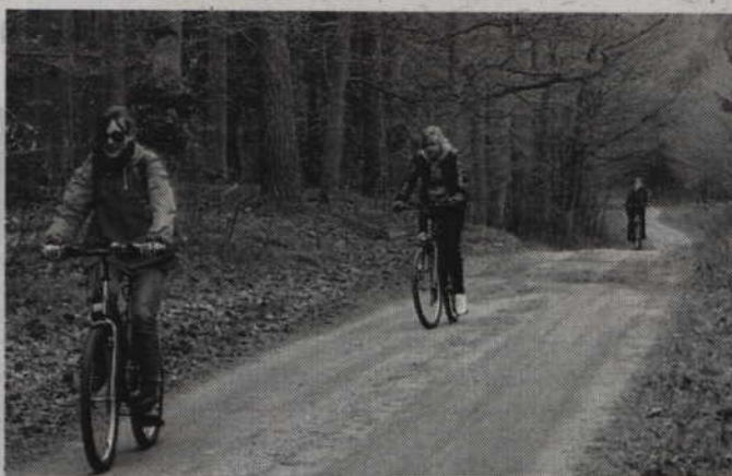
Gminy chcą połączyć swoje ścieżki rowerowe z trasami międzynarodowymi.

Starosta dodaje, że sam jeździ na rowerze i wie jak potrzebne są ścieżki. Powiat kwidzyński jest bardzo atrakcyjny rowerowo. Mogę zapewnić, że jest gdzie pojeździć. Wiem, że gmina Kwidzyn jest mocno zainteresowana budową ścieżek, gdyż ma już wybudowaną ścieżkę z Maresy do Korzeniewa. Także burmistrz Kwidzyna jest zainteresowany ich budową. Podczas posiedzeń MOF zastanawiał się nad połączeniem dworca PKP, który będzie takim węzłem komunikacyjnym, ze ścieżkami rowerowymi, prowadzącymi do wału. Nie powstał jeszcze żaden dokument czy program. Jak tyl-