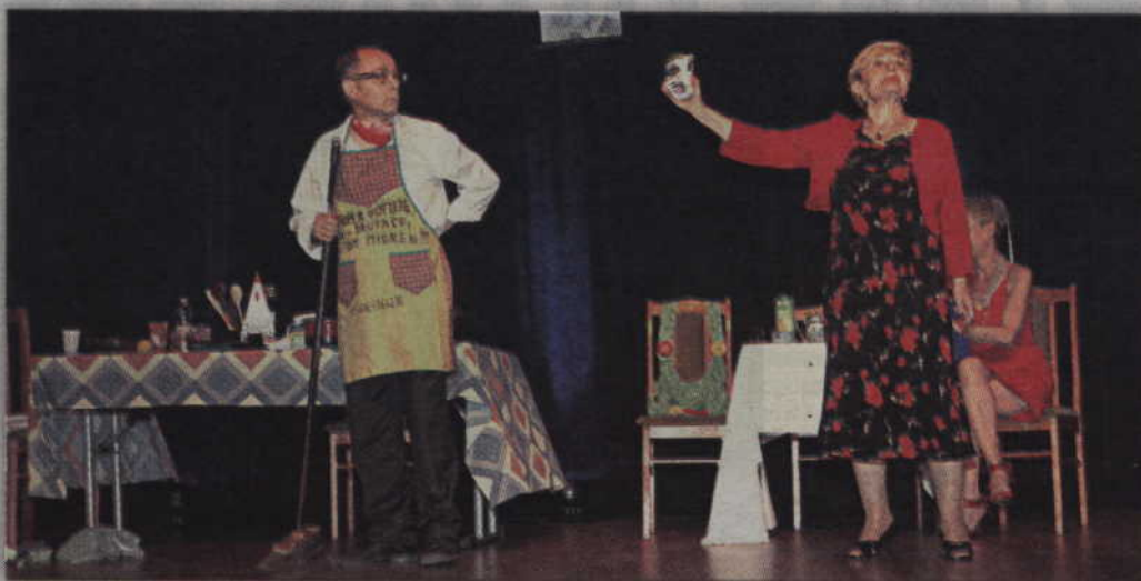
Demoniczna teściowa przypomina zięciowi o jego roli w małżeństwie.