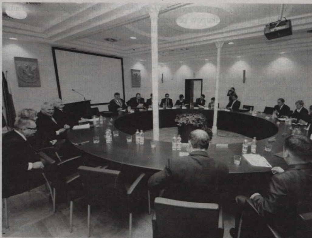
Za przyjęciem sprawozdania głosowało 15 radnych. Sprzeciw wyraziło pięć osób.

-Być może ktoś opatrnie pojmuję zadanie radnego. Jeśli otrzymuję sprawozdanie finansowe, to oceniam czy środki, którymi dysponuje powiat, wydawane są w sposób właściwy. Sam szukam w Biuletynie Informacji Publicznej odniesień z powia-