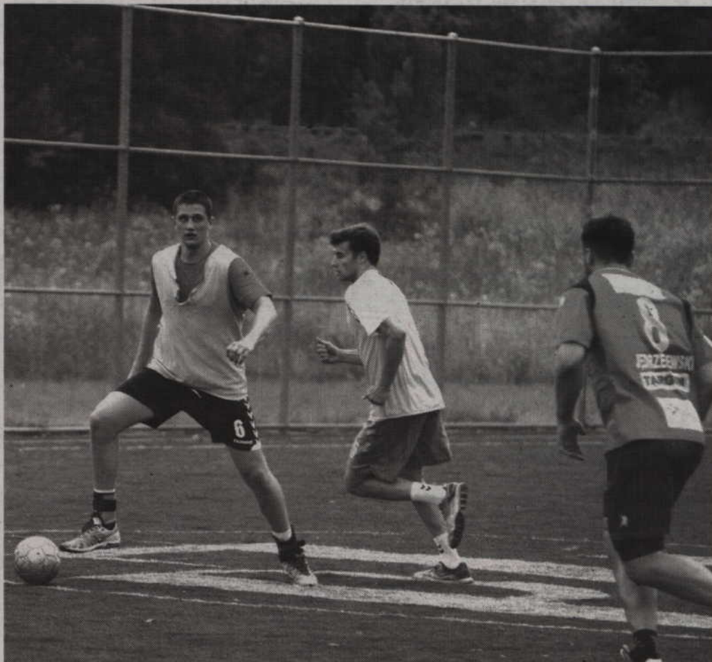
Piłkarze MMTS Kwidzyn rozpoczęli zajęcia od gry w piłkę nożną.

-Pierwszy tydzień to typowy rozruch, natomiast od przyszłego tygodnia, aż do turnieju