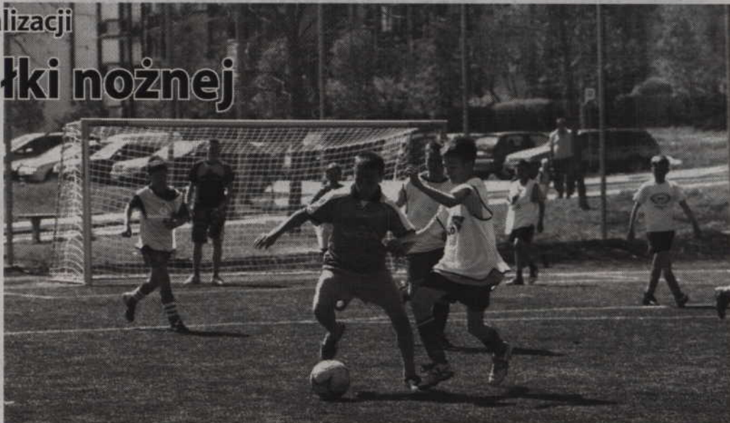
I wakacyjny turniej piłki nożnej odbędzie się na Orliku przy ul. Kazimierza Wielkiego.