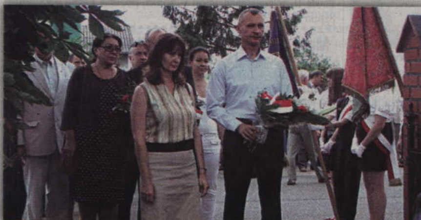
Uroczystości w Janowie związane były z 94 rocznicą plebiscytu na Powiślu.