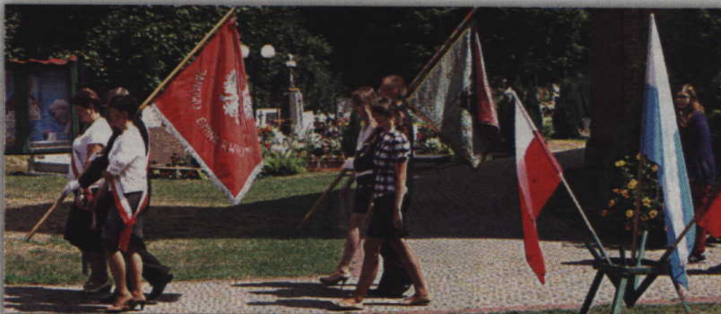
Nie zabrakło delegacji oraz sztandarów szkół oraz instytucji gminnych.