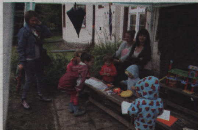
Maluchom w zabawie nie przeszkadzał nawet deszcz.