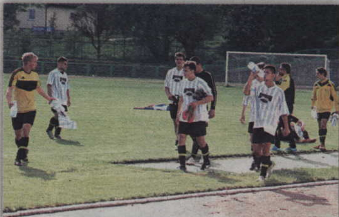
Piłkarzy pierwszej drużyny KOP Rodło czeka sześć spotkań sparingowych.