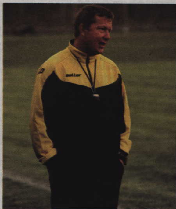
Jeśli dopisze nam zdrowie i w zespole nie będzie kontuzji, to będziemy liczyć się w V lidze.

-Rozmawialiśmy z Centrum Pelplin, który miał problemy z licencją. Była