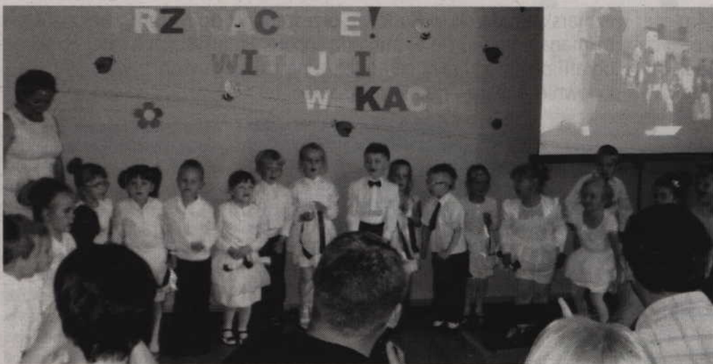
Bądkowskie przedszkolaki mają za sobą pierwszy rok nauki.