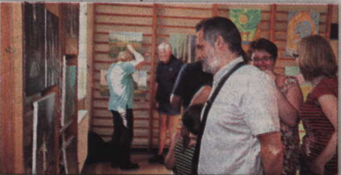
Malarze prezentowali swoje prace w sali gimnastycznej.