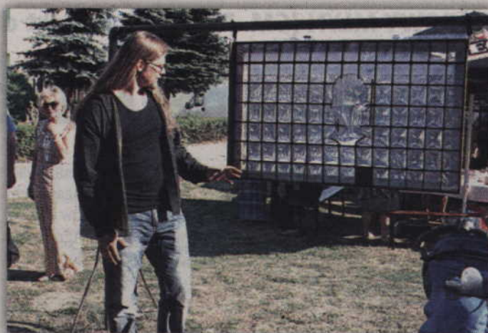
Okno, a może lustro? Na to pytanie każdy musiał odpowiedzieć sobie sam.