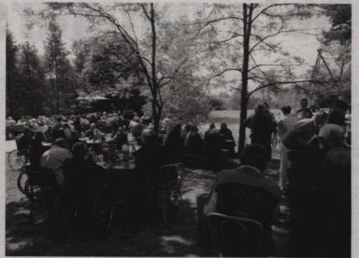
Projektem objęto około 150 osób z ośrodków AGAPE w Borowym Młynie i Nowym Stawie.

powietrzu) – wyjaśnia kierownik alizowane w projekcie są natomiast bezpłatne. Młynie. -Wszystkie działania re-