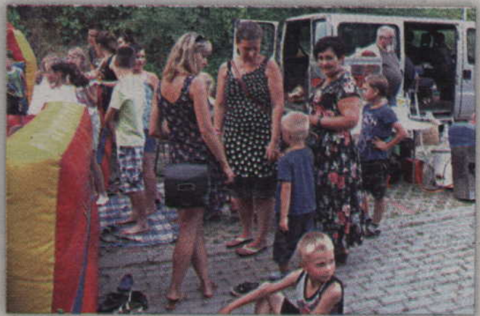
Wielką atrakcją dla dzieci zawsze stanowią zjeżdżalnie. Nie dziwiły zatem kolejki maluchów czekających na możliwość zabawy na tym dmuchanym placu zabaw.