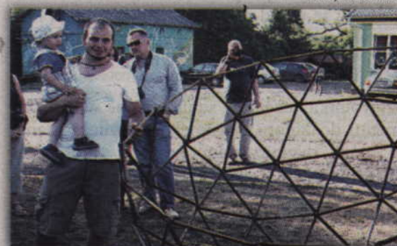
Nietypowa forma przestrzenna wzbudziła zainteresowanie zwiedzających.