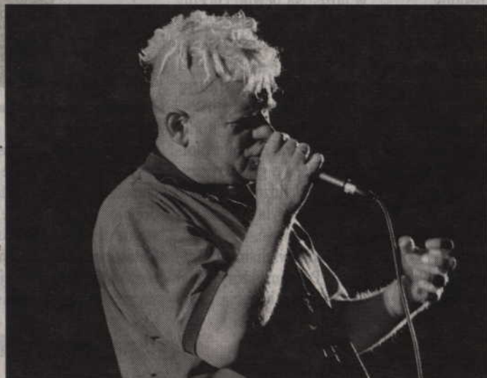
Podczas kwidzyńskiego koncertu Kazik zaśpiewa piosenki swojego ojca Stanisława Staszewskiego.

Kwidzyńskie Centrum Kultury zaprasza na koncert Kazika. Artysta wystąpi w kwidzyńskim Teatrze 18 września, a towarzyszyć mu będzie kwartet ProForma. Cena biletu: 70 zł.