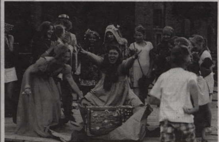
Festiwal Ulicznej Sztuki odbędzie się w Kwidzynie już po raz trzeci.

Kwidzyńskie Centrum Kultury zaprasza na kolejne FUS-y czyli Festiwal Ulicznej Sztuki. Impreza odbędzie się w najbliższą sobotę – 26 lipca na kwidzyńskim placu Jana Pawła II. W programie przewidziano m.in. warsztaty i pokazy kuglarskie, street art, oraz akcje: mydło i powidło oraz uwolnij książkę. Organizatorzy zachęcają również do przybycia na festiwal z kiczowatym przedmiotem. (fox)