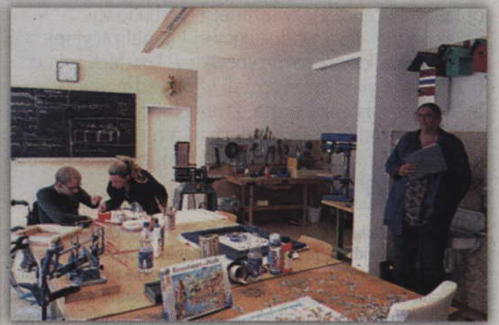
Delegacja z powiatu kwidzyńskiego przyglądała się sposobom na aktywizację osób starszych i niepełnosprawnych w partnerskim powiecie Osterholz.