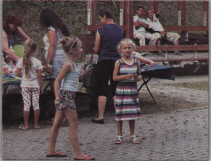
Podczas festynu doskonale bawili się zarówno ci najmłodsi, jak i nieco starsi.