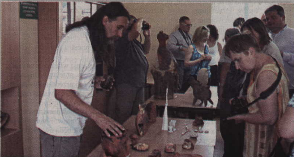
To tylko część ceramicznych dzieł wypalonych podczas tegorocznego pleneru.

- Kiedy po raz pierwszy zobaczyłam w jakim materiale mam