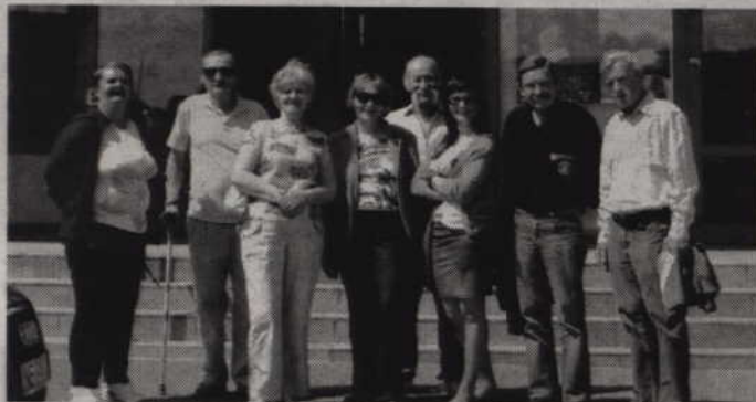
Dzięki ministerialnemu dofinansowaniu możliwe są m.in. wyjazdy do teatru w Elblągu.