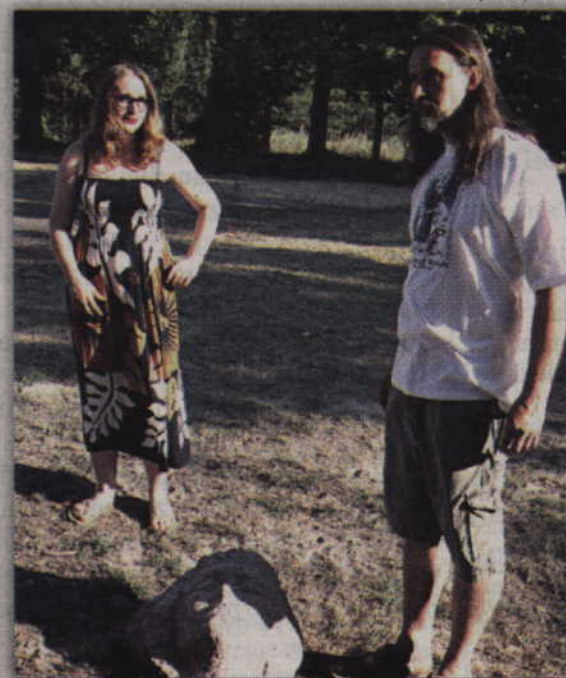
W tym roku wielu artystów wykorzystało w swych pracach kamienie.