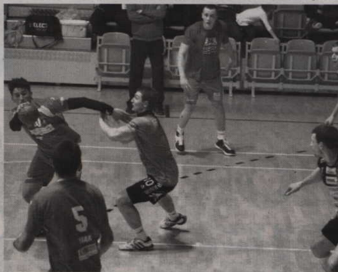
MMTS Kwidzyn rozpocznie turniej od pojedynku z Wybrzeżem Gdańsk.

Urodził się w 18 lipca 1921 roku w Nowym Klinczu, a zmarł w 27 września 2011 roku w Gdańsku. Podczas II wojny światowej był w II Korpusie Polskim generała Władysława Andersa i walczył m.in. w Monte Cassino. Wychował ponad 40 reprezentantów Polski w piłce ręcznej i przeszkolił ponad 1500 zawodników. W 1951 roku został pierwszym szkoleniowcem GKS-u Wybrzeże Gdańsk, a w 1958 roku powołał sekcję w Spójni Gdańsk. Jednym z jego wychowanków był Bogdan Wenta, którego namówił do uprawiania piłki ręcznej.