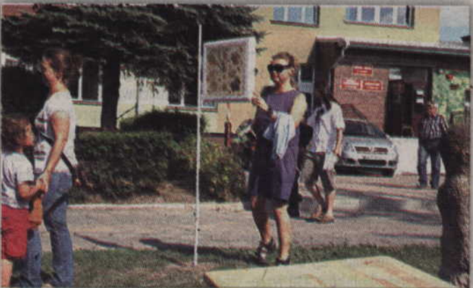
Takie przedstawienie okna wzbudzało spore zainteresowanie oglądających wystawę.