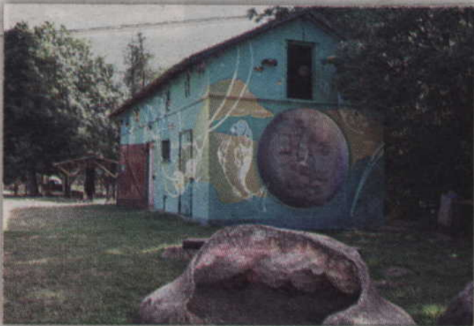
Rodowo to wioska artystycznych cudów.

24 plener rzeźbiarsko-malarski w Rodowie przeszedł już do historii. Uroczyste zakończenie i podsumowanie prawie dwóch tygodni artystycznych zmagani odbyło się w minioną sobotę. Po artystach z całej Polski oraz gościach z Ukrainy pozostało kilkaset najróżniejszych dzieł, od fotografii poprzez obrazy, ceramikę, a na rzeźbach skończywszy. Wioska Cudów opustoszała, artyści wyjechali, ale ich dzieła pozostały i ponownie wzbogaciły całe otoczenie.