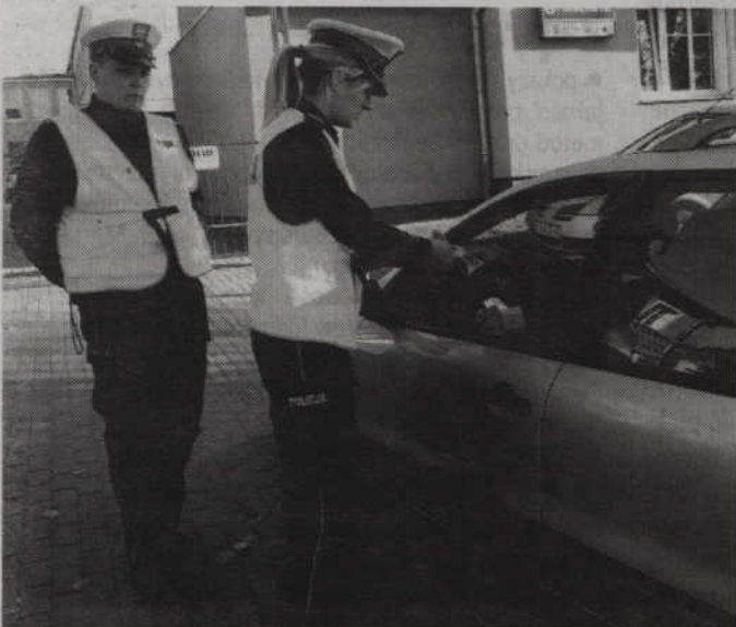
Podczas akcji kwidzyńscy policjanci wylegitymowali 61 osób i skontrolowali 39 pojazdów.

Wciąż najczęstszymi przyczynami wypadków z winy pieszych są: nieostrożne wejście na jezdnię przed jadącym pojazdem, wejście na jezdnię zza pojazdu, przekraczanie jezdni w niedozwolonym miejscu oraz chodzenie nieprawidłową stroną drogi poza terenem zabudowanym. (f)