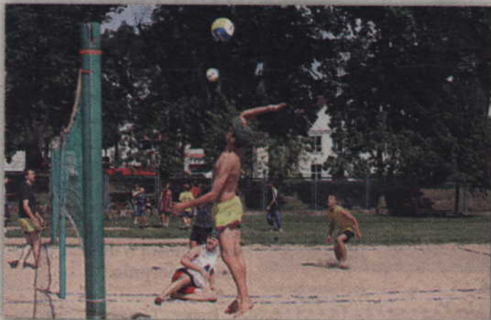
Turniej siatkówki plażowej rozegrany zostanie na boiskach kwidzińskiego stadionu.

Kwidzińskie Centrum Sportu i Rekreacji zaprasza na sobotnie turnieje wakacyjne. W ramach „Wakacji na sportowo”, w najbliższą sobotę – 26 lipca rozegrany zostanie I wakacyjny turniej siatkówki plażowej drużyn dwuosobowych. Początek rywalizacji – godzina 11.00.