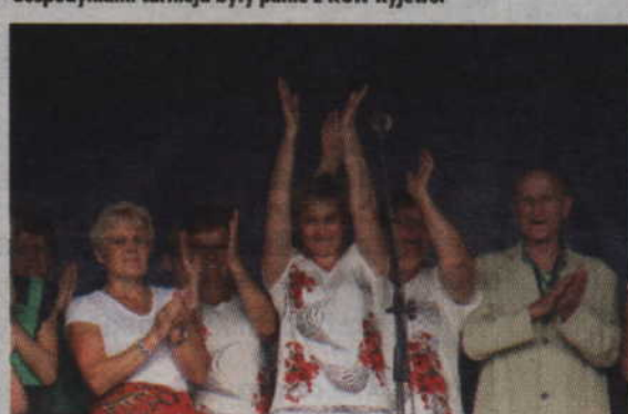
Radość pań z Nebrowa Wielkiego po zwycięstwie w konkursie na potrawę z wołowiny.