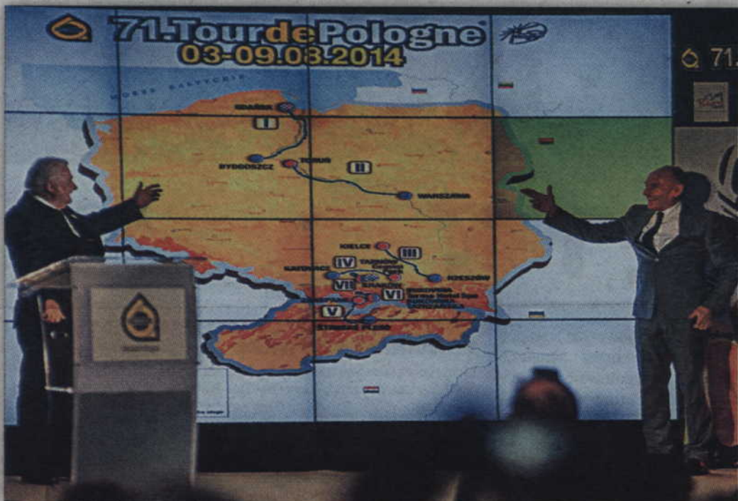
Lech Wałęsa oraz Czesław Lang podczas prezentacji trasy tegorocznego 71 Tour de Pologne.

Zawodnicy rywalizujący w 71 Tour de Pologne przejadą ulicami Kwidzyna. Nasze miasto znalazło się bowiem na trasie pierwszego etapu wyścigu prowadzącego z Gdańska do Bydgoszczy o długości 226 km. W Kwidzynie zlokalizowana została także lotna premia wyścigu na 64 km, która stanie przed Urzędem Miasta na ul. Warszawskiej.