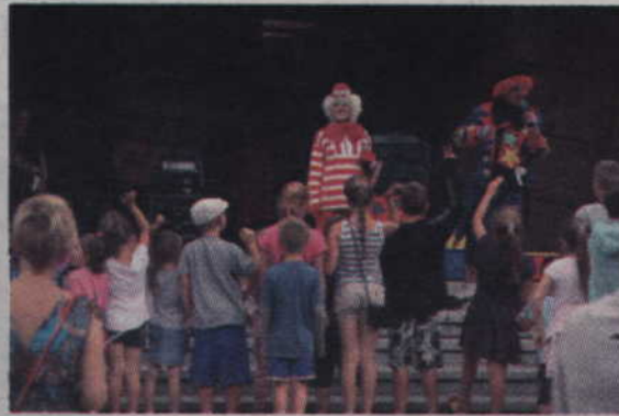
Dzieci chętnie uczestniczyły w zabawach z klaunami.