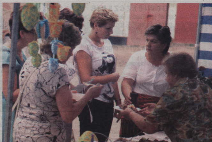
Jurorzy próbują potraw przygotowanych przez KGW Trzciano.