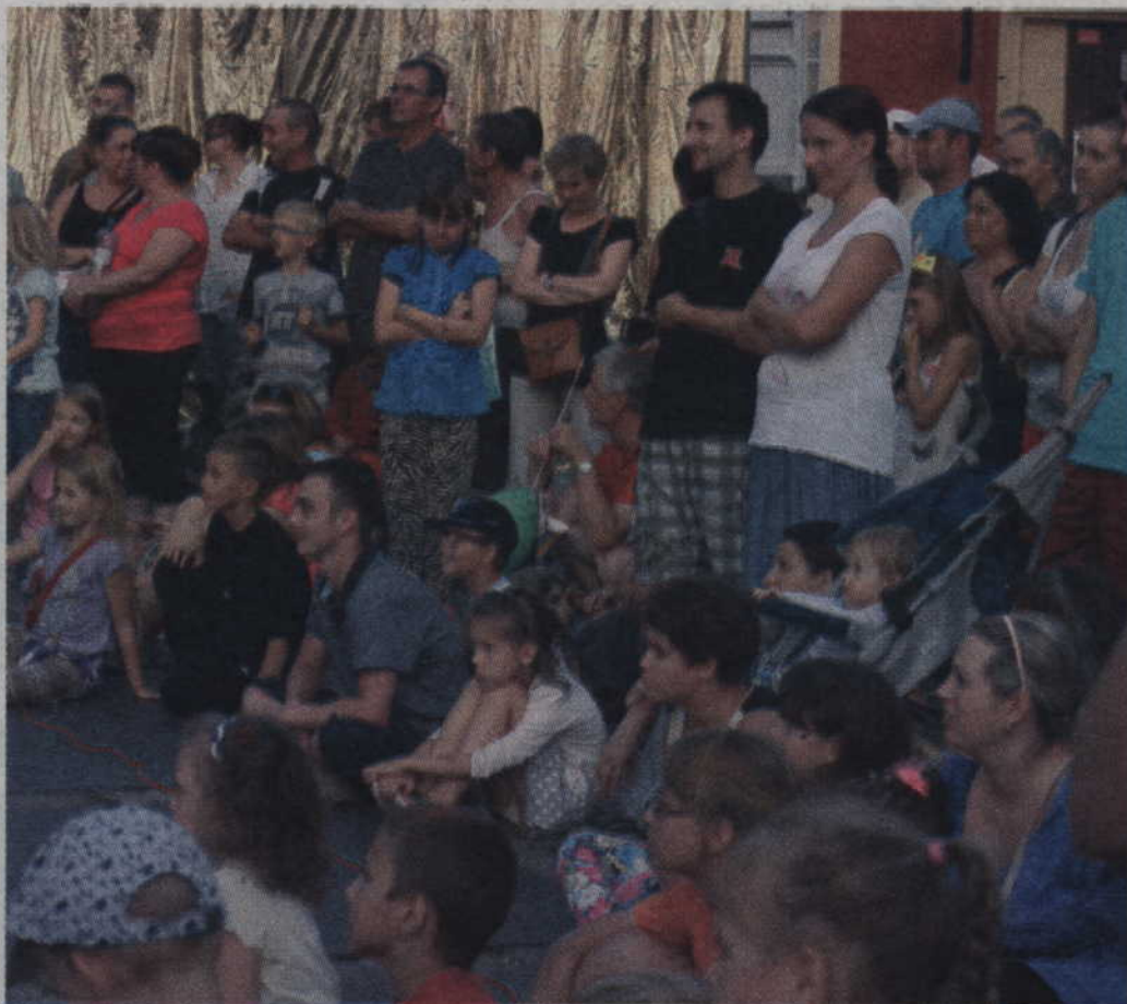
Widzowie w skupieniu oglądali każde przedstawienie.

„Ruphert i Rico” – Clown Circus Show z Gorzyc Wielkich „Bardzo dziwna bajka” – Teatr Pinezka z Gdańska „Country Show” – Teatr Nikoli z Krakowa „Morskie opowieści” – Teatr Pinezka z Gdańska „Święto kucharza” – Teatr Nikoli z Krakowa „Inżynieria marzeń” – Teatr 3,5 ze Sztumu „Korowód tańca” – Kijowski Teatr Uliczny „Pieśń Bugajów” – Teatr Awatar z Legnicy „Zmierz elfów” – Teatr Awatar z Legnicy