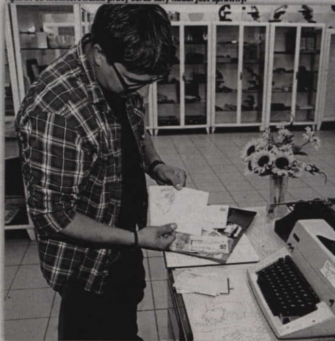
W zbiorach znalazły się liczne rysunki autorstwa byłych pacjentów.