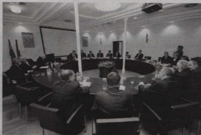
Za udzieleniem absolutorium głosowało 15 radnych koalicji PO - SLD. Przeciwnych było 5 radnych PiS.

SLD za ważne uznaje także zapewnienie środków na aktywne przeciwdziałanie bezrobociu oraz wykluczeniu społecznemu.