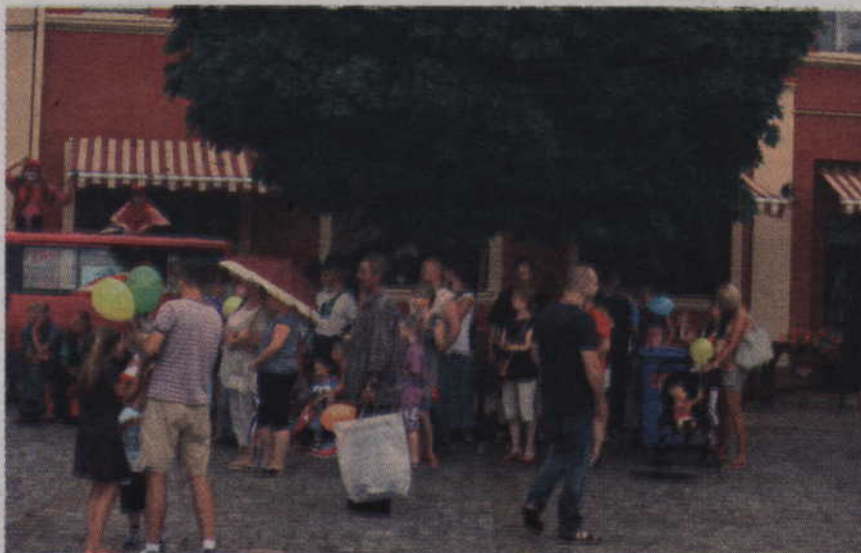
Chwilami publiczność chowała się przed deszczem pod drzewami.