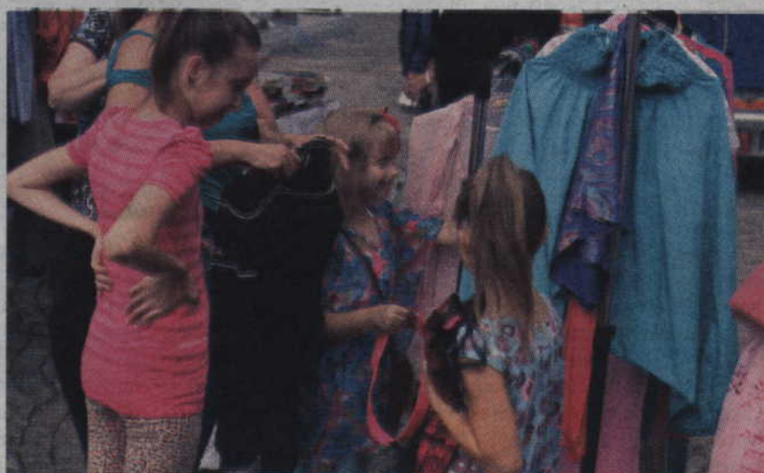
Tego dnia Second Hand był otwarty dla wszystkich.