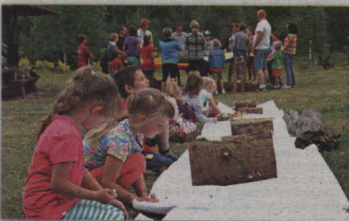
Ponad 200 osób bawiło się podczas pikniku zorganizowanego z okazji Dnia Rodzicielstwa Zastępczego.