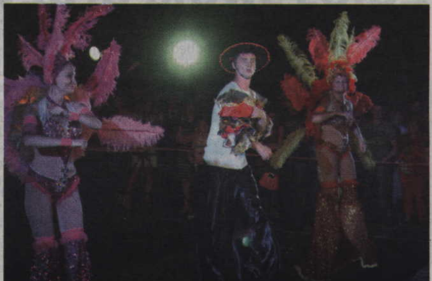
Nie placu Jana Pawła II zabrakło także brazylijskiej samby.