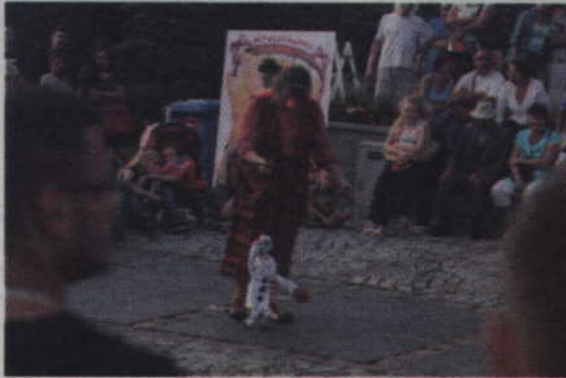
Fragment spektaklu „Ruphert i Rico”.