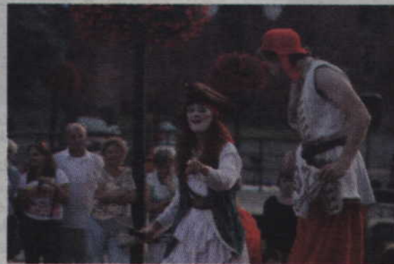
Aktorzy Clown Circus Show podczas swojego spektaklu.