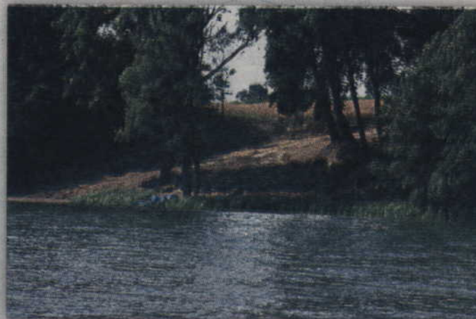
Z daleka widać, że to miejsce przypomina plażę.

- Nie przypominam sobie, abyśmy wydawali zgodę na jakiegokolwiek prace ziemne nad jeziorem Morawskim. Przeprowadzimy kontrolę tego terenu, a także poprosimy inne instytucje o informację czy nie wydawały zgody na tego typu prace - powiedział A. Wróblewicz ze Starostwa Powiatowego w Kwidzynie.