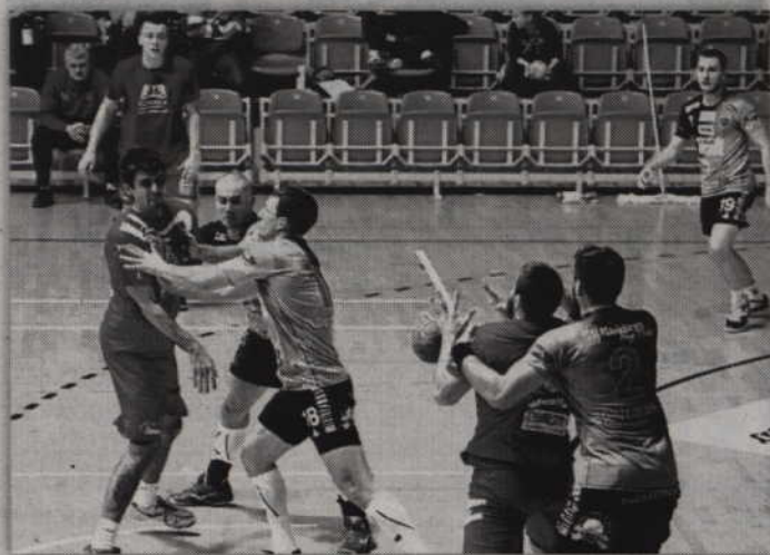
MMTS Kwidzyn rozpocznie turniej od pojedynku z Wybrzeżem Gdańsk.

Szczypiorniści MMTS Kwidzyn wezmą udział w III Memoriale Leona Walleranda. Poza czerwono-czarnymi w gdańskim turnieju wezmą udział PGE Stal Mielec, Nielba Wągrowiec oraz Wybrzeże Gdańsk. Spotkania turniejowe rozegrane zostaną w dniach 1-2 sierpnia i będą pierwszymi sparingami rozegranymi przez kwidzyńskich piłkarzy.