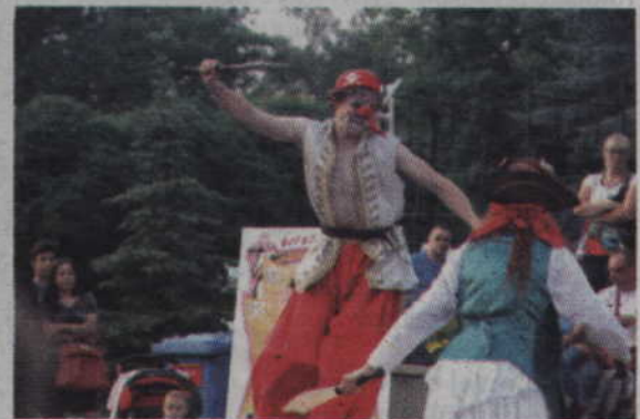
Choć odtwórcy ról chodzili na szcudłach w spektaklu nie brakowało scen walki.