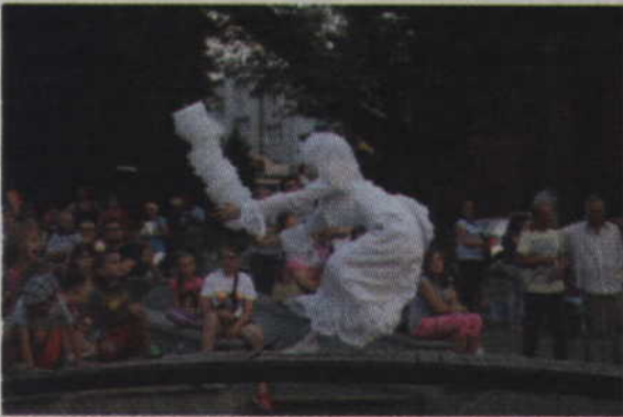
Czasami widzowie obawiali się czy rekwizyty nie wypadną aktorom z rąk.