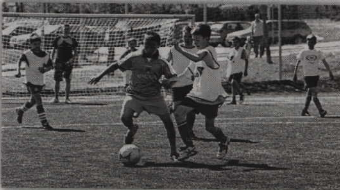
II wakacyjny turniej szóstek piłkarskich rozpocznie się o godz. 10.00.

Kwidzyńskie Centrum Sportu i Rekreacji zaprasza na II wakacyjny turniej szóstek piłkarskich. Futbolowa rywalizacja odbędzie się w najbliższą sobotę - 2 sierpnia na boisku Orlik przy ul. Hallera. Początek gier godzina 10.00.