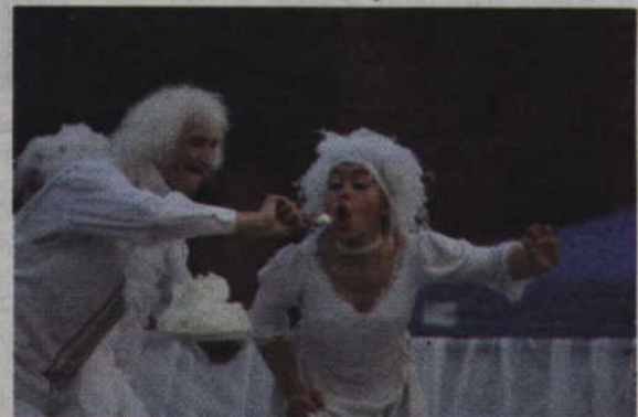
Fragment spektaklu „Święto kucharza” krakowskiego Teatru Nikoli.