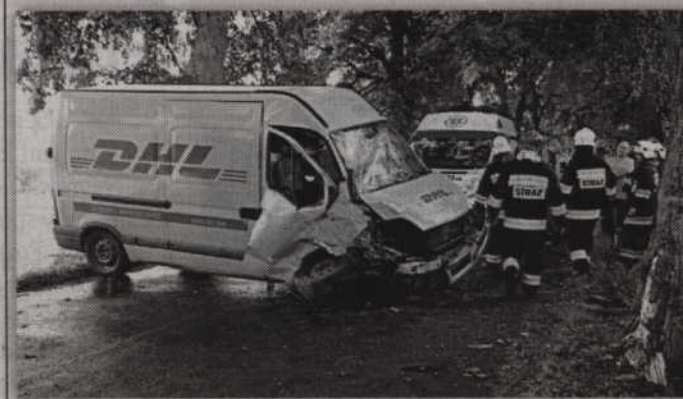
W wypadku do którego doszło na trasie Gardeja - Zebrdowo kierowca renault uderzył w przydrożne drzewo.

- W wyniku uderzenia 57-letni kierowca renault uderzył w przydrożne drzewo. Po opatrzeniu w szpitalu został jednak zwolniony do domu. Wszyscy uczestnicy wypadków byli trzeźwi. W związku z wszystkimi wypadkami policjanci prowadzą postępowania, które mają na celu dokładne wyjaśnienie przyczyn i okoliczności tych zdarzeń - dodaje rzecznik KPP Kwidzyn. (fox)