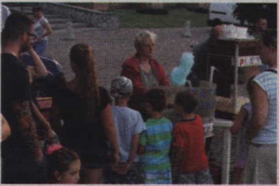
Kolejka chętnych przy obowiązkowej wacie cukrowej.