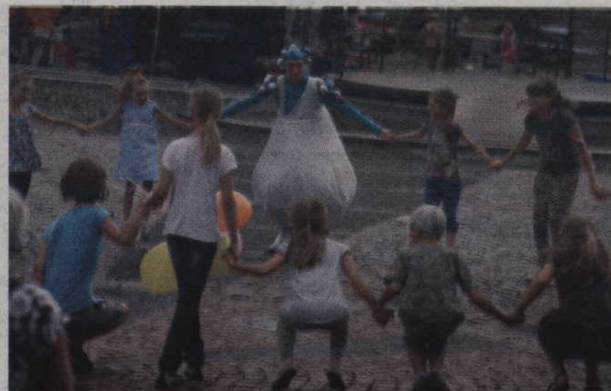
Wspólna zabawa na placu Jana Pawła II.