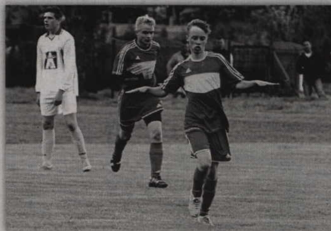
Od nowego sezonu piłkarze Rodła będą grali w klasie okręgowej sportbazar.pl