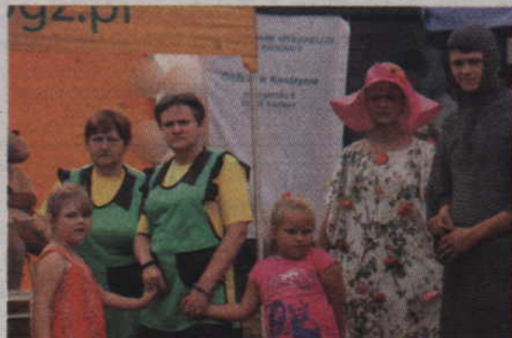
Koło z Dworka w konkursie na regionalny strój historyczny przygotowało taką oto propozycję.