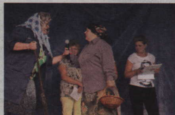
Fragment skeczu przygotowanego przez Koło z Trzciana.