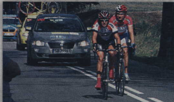
Ulicami Kwidzyna i okolic przejedzie 21 zespołów kolarskich.