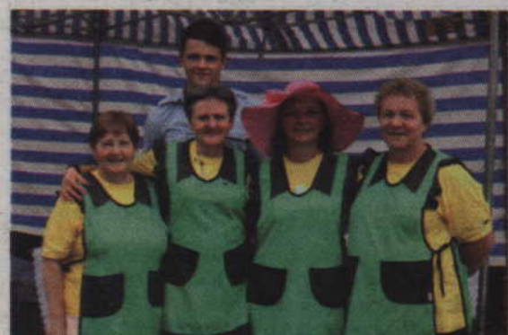
Koło z Dworka przyjechało na ryjewski turniej po raz pierwszy.