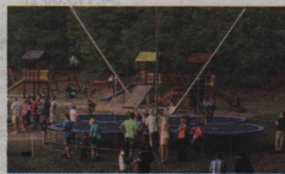
Organizatorzy turnieju przygotowali również moc atrakcji dla najmłodszych.