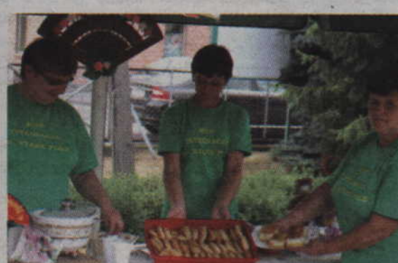
Wyroby przygotowane przez KGW Integracja gminy Stare Pole.

się tutaj bawią. W turnieju powinny aktywnie uczestniczyć również samorządy, ale wykręcają się brakiem pieniędzy. Skoro samorząd nie ma środków, aby wystawić stoisko z prezentacją dorobku własnej gminy, to nie ma co się dziwić zwykłym mieszkańcom.