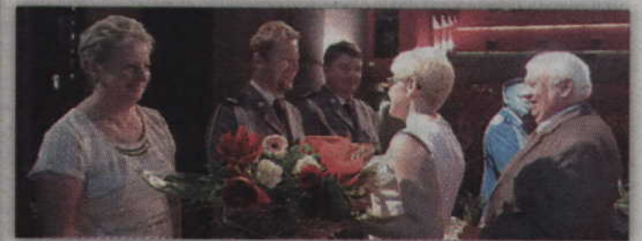
Komendant Komendy Powiatowej w Kwidzynie odbiera gratulacje od władarzy gmin powiatu kwidzińskiego.

Nominacje na wyższe stopnie otrzymało 58 funkcjonariuszy. Na zdjęciu niektórzy z wyróżnionych osób.