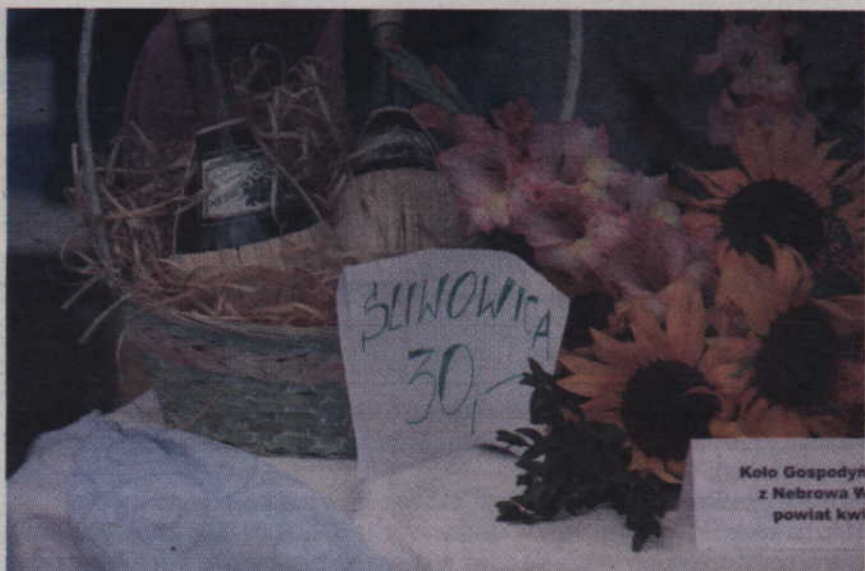
Na stoisku Nebrowa znaleźć można było m.in. śliwowicę.