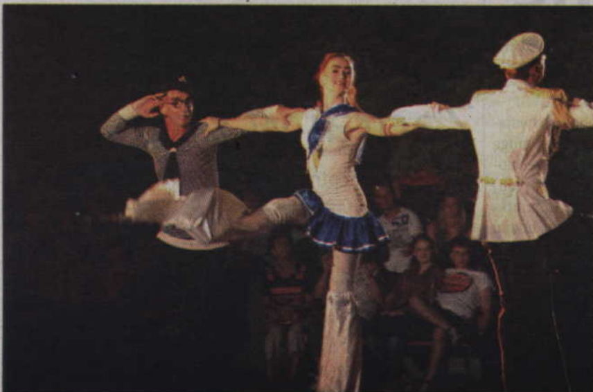
Ukraińscy artyści zaskoczyli widzów barwnymi strojami.