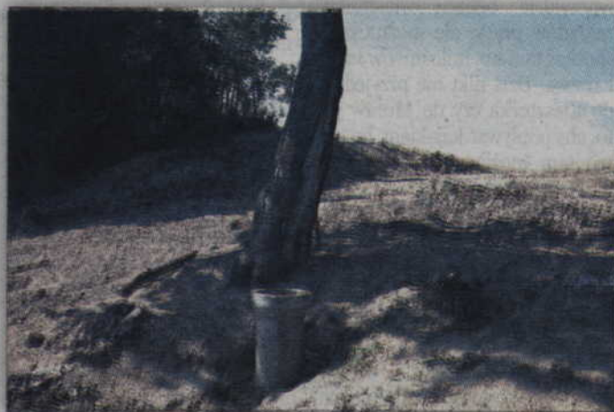
Starostwo sprawdzi, czy wydane zostały zezwolenia na prowadzenie prac ziemnych.