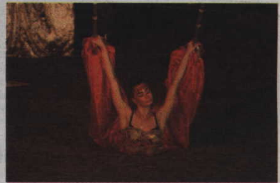
Efektowna poza artystki z Kijowskiego Teatru Ulicznego.