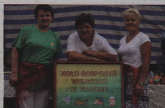
Gospodyniami turnieju były panie z KGW Ryjewo.