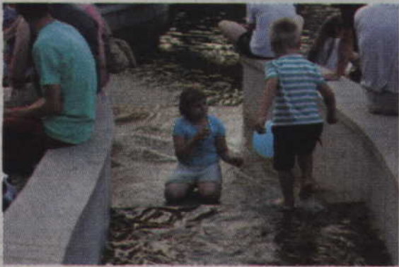
Dzieci chłodziły się w wodzie znajdującej się na placu.