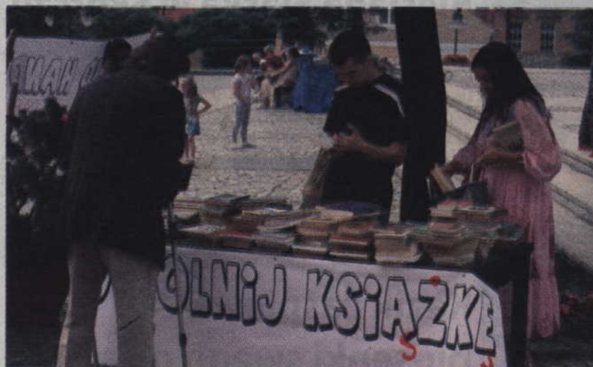
Akcja „Uwolnij książkę” cieszyła się dużym zainteresowaniem mieszkańców.