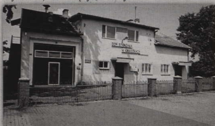
Za kilka miesięcy świetlica w Kaniczkach będzie wyglądała zupełnie inaczej.

- W ramach przebudowy świetlicy zostanie wykonany remont pomieszczeń wewnątrz obiektu, a na podłodze położony zostanie grys. Ponadto całkowicie wymienimy instalację elektryczną, sanitarną oraz wszystkie drzwi. Zaplanowaliśmy również zakup kompletnego wyposażenia do kuchni. Z dachu zostanie zdjęty eternit i zastąpi go blachodachówka. Kosztorys inwestorski zaplanowaliśmy na około 200 tys. złotych. O tym, ile rzeczywiście będzie kosztowało to zadanie będziemy mogli powiedzieć po przetargu - poinformował Andrzej Kuzimski. (RB)