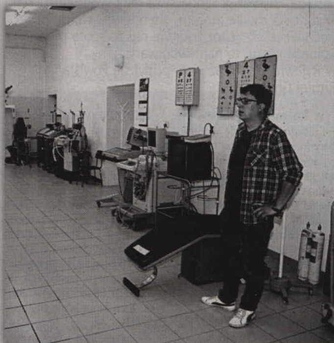
W izbie zgromadzono dużo dawnego sprzętu medycznego.