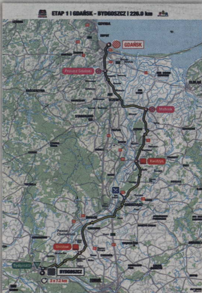
Trasa I etapu to 225 km z Gdańska do Bydgoszczy. Lotna premia w Kwidzynie umiejscowiona jest na 64 km trasy.