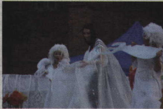
Krakowscy artyści do wspólnej zabawy zaprosili też panią Karolinę.