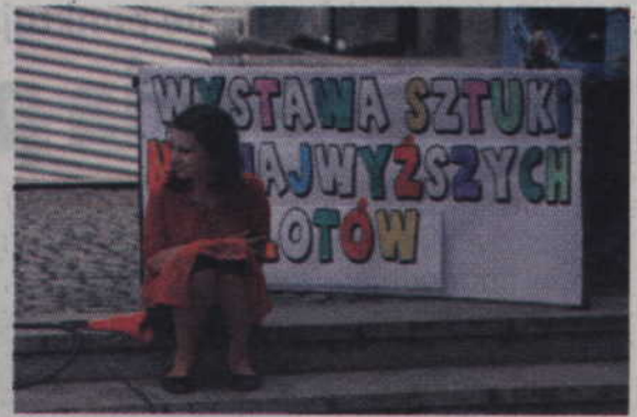
Swoje miejsce miała również Wystawa Sztuki Nienajwyższych Lotów.