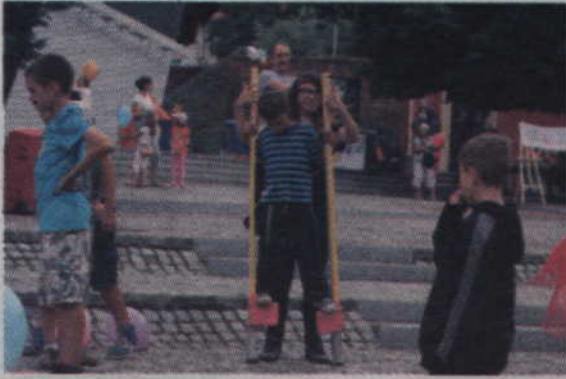
Chętni mogli spróbować swoich sił w chodzeniu na szcudłach.