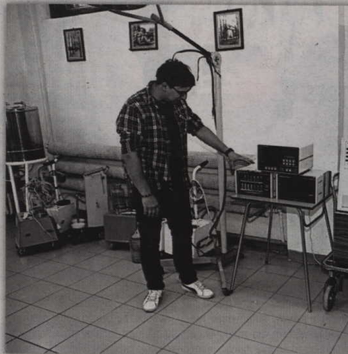
Aparat do monitorowania pracy serca cały nadal jest sprawny.

Dziś prabucki szpital specjalistyczny nie przypomina już dawnego sanatorium przeciw-