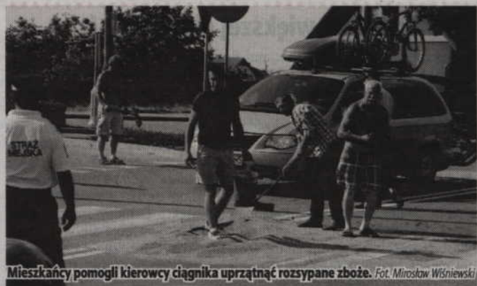
Mieszkańcy pomogli kierowcy ciągnika uprzątnąć rozsypałe zboże.

KWIDZYN. Zatrzymano sprawcę lipcowej kradzieży