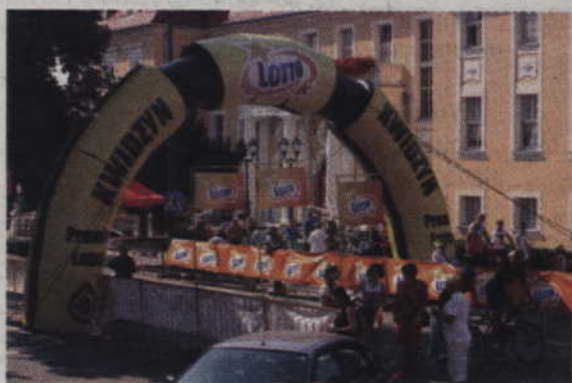
Lotna premia umiejscowiona została na ul. Warszawskiej.