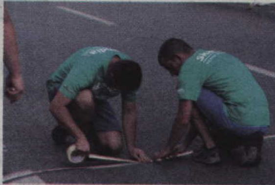
Organizatorzy oznaczają linię lotnej premii w Kwidzynie.