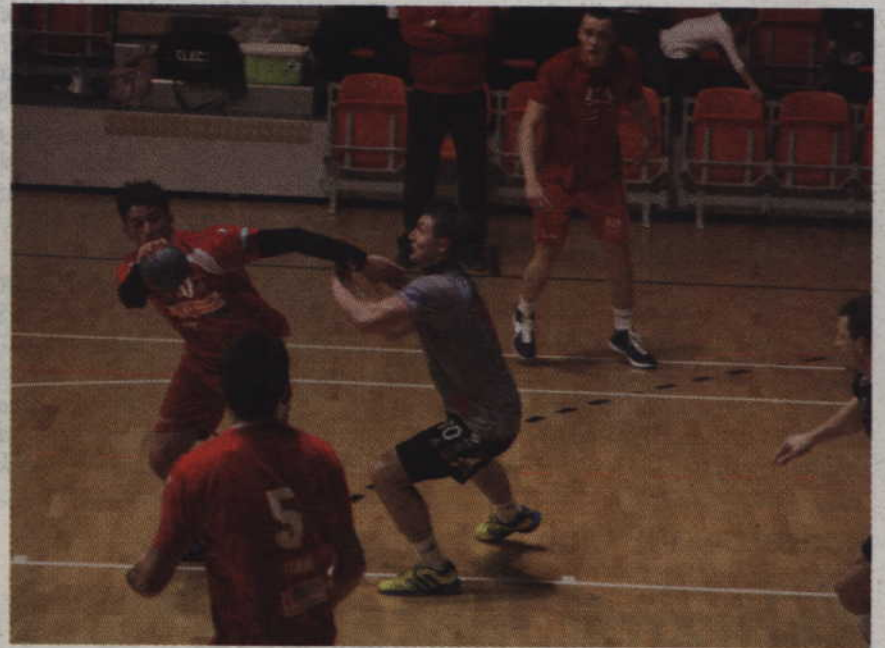
Zawodnicy MMTS Kwidzyn rozpoczęli turniejowe boje od porażki z Wybrzeżem Gdańsk.

Kwidzynianie jednak poprawili się w kolejnych spotkaniach. Najpierw ograli Nielbę Wągrowiec 21:23, po czym zwyciężyli również PGE Stal Mielec 23:20. Wydawało się, że kwidzynianie wygrali gdański turniej. Po podliczeniu okazało się