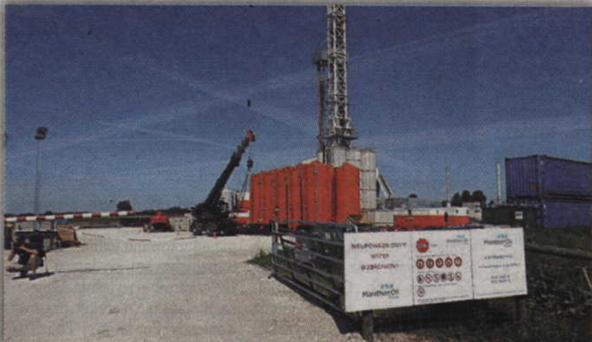
Wiertnia w Pilichowie przed kilkunastoma miesiącami.