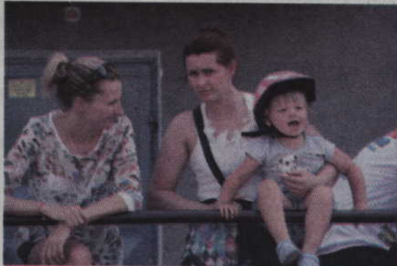
Wielu kwidzyńskich rowerzystów przyjechało, aby dopingować przejeżdżających kolarzy. Wiek nie grał tutaj roli.