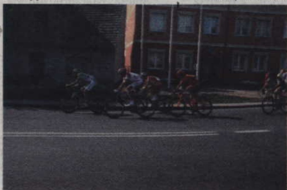
Na czele wyścigu jechała grupa z dwoma Polakami w składzie.