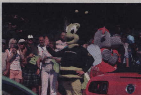
Nie zabrakło też maskotek wyścigu oraz sponsorów.