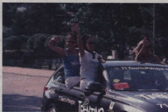
Jako pierwsza do Kwidzyna przyjechała ekipa reklamowa, w tym uśmiechnięte hostessy.