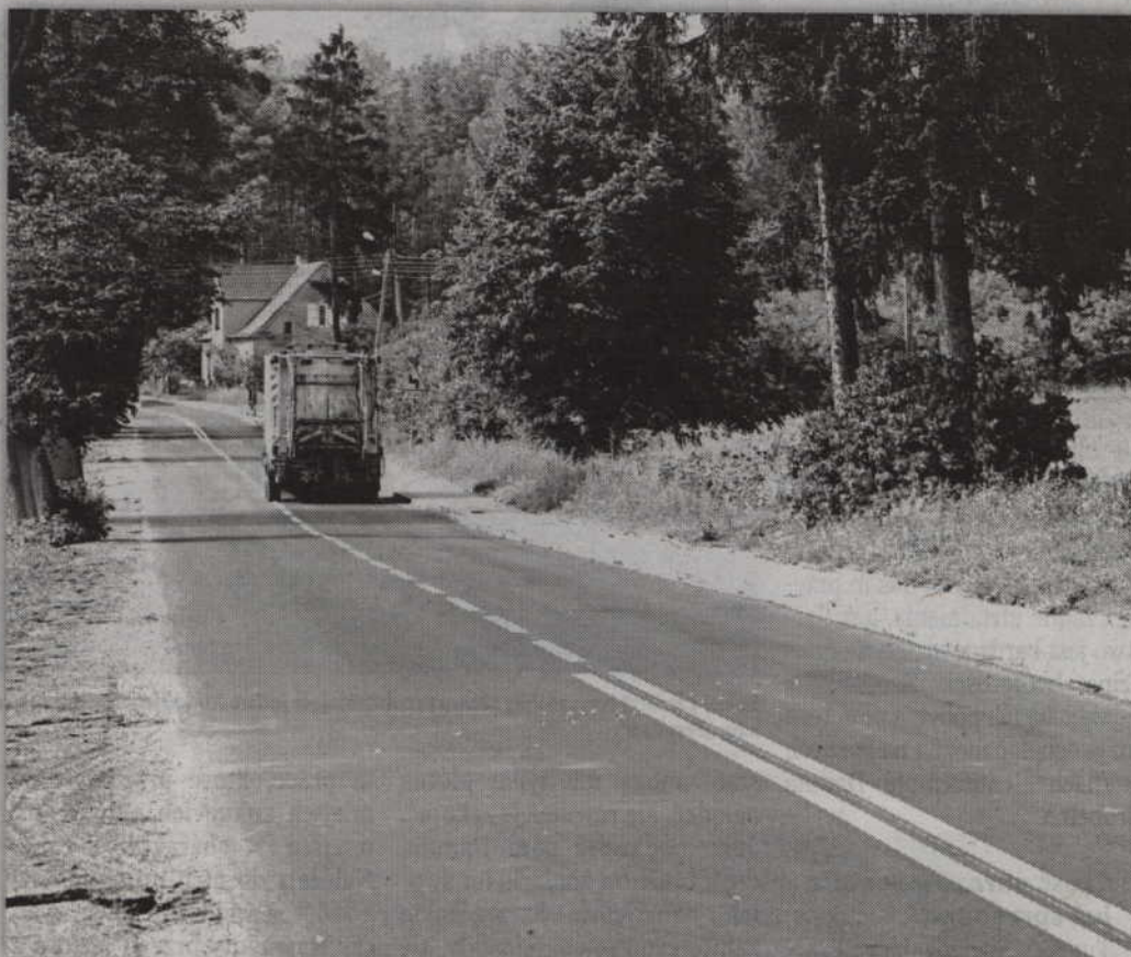
Zakończono ostatni etap modernizacji drogi Kwidzyn - Pierzchowice.

Przy ostatnim odcinku zmodernizowanej drogi zainstalowano ok. pół kilometra barier ochronnych. Zbudowano także chodnik o długości ok. 220 m.