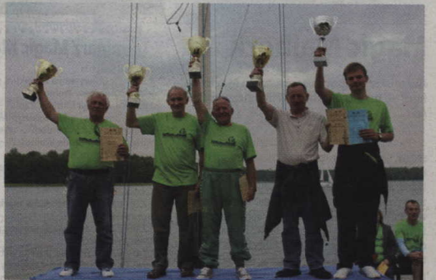
Najlepsi zawodnicy tegorocznych Mistrzostw Kwidzyna Żeglarzy Niepełnosprawnych.

Warto również dodać, że członkowie i sympatycy kwidzińskiego stowarzyszenia startujący w X Fe-