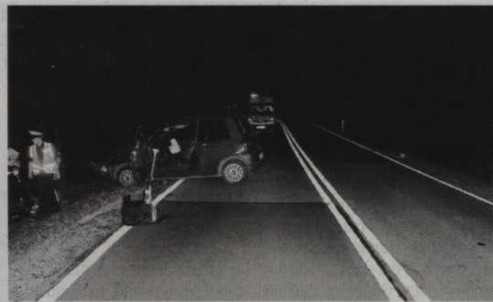
Policjanci zabezpieczali miejsce wypadku.

KWIDZYN. Mieszkańcy pomogli kierowcy ciągnika