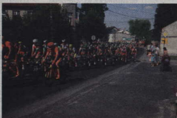
Peleton spokojnie przejechał przez Gardeję.