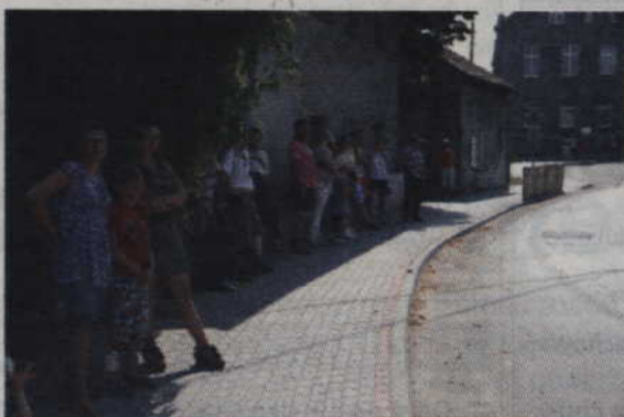
Mieszkańcy wypatrywali kolarzy szukając choć odrobinę cienia.