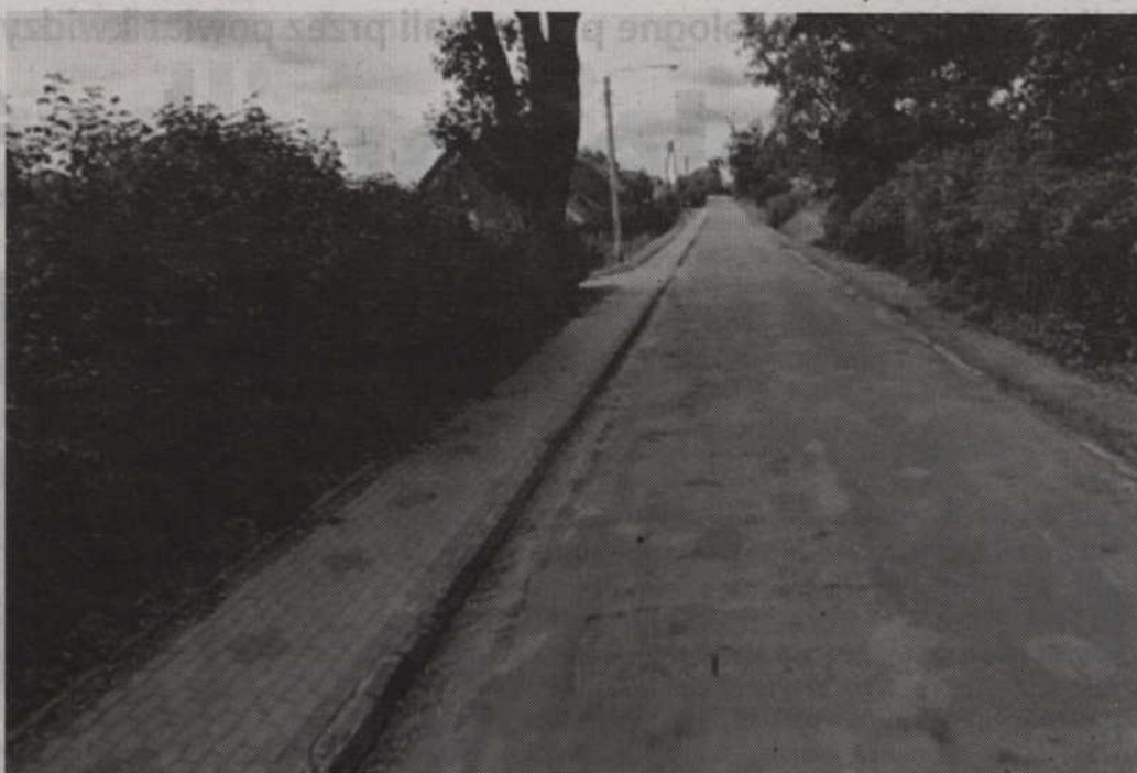
Tak obecnie wygląda stan drogi wojewódzkiej nr 607 w Ryjewie.