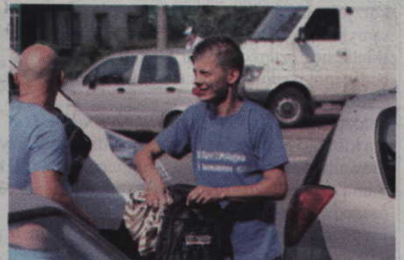
Chętni mogli kupić zestaw pamiątkowy 71 TdP, m.in. koszulkę i plecak.