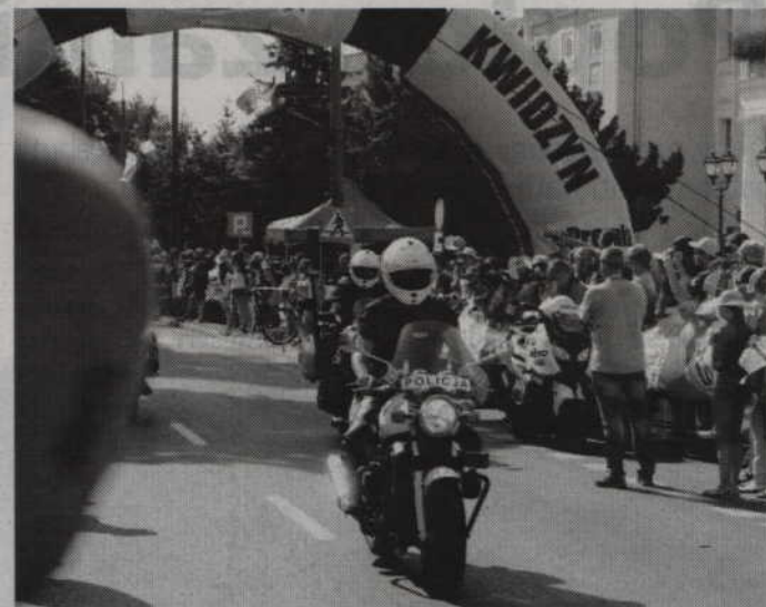
Trasę wyścigu zabezpieczają 60 policjantów.

-Wyścigi kolarskie zawsze cieszyły się wielką sympatią kibiców i nie inaczej było tym razem. Na całej trasie kibicowały kolarzom tłumy fanów tego sportu. Przy-