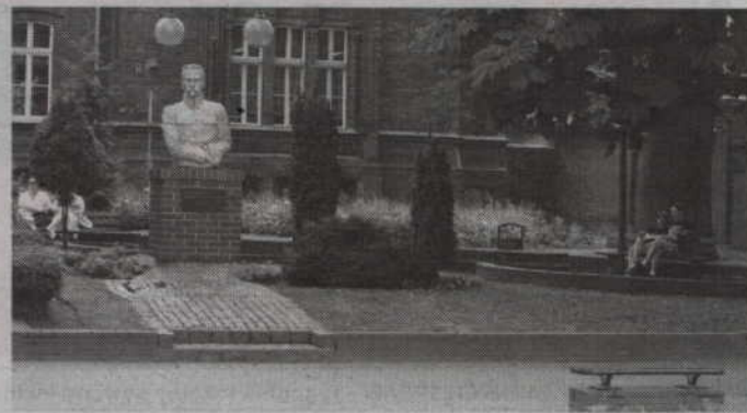
Spotkanie odbędzie się przed kwidzyńskim pomnikiem Józefa Piłsudskiego.

Gazeta Polska Klub Kwidzyn II zaprasza na spotkanie z okazji 100 rocznicy wymarszu 1 Kompanii Kadrowej Józefa Piłsudskiego. Spotkanie odbędzie się w środę - 6 sierpnia, o godz. 18.00, pod pomnikiem Marszałka Józefa Piłsudskiego w Kwidzynie (na deptaku przed biblioteką). W programie przewidziane jest złożenie wiązanek kwiatów, zapalenie zniczy pod pomnikiem Komendanta oraz śpiewanie piosenek legionowych. (fox)