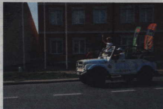
Przejeżdżające hostessy pozdrowiały gardejskich kibiców.