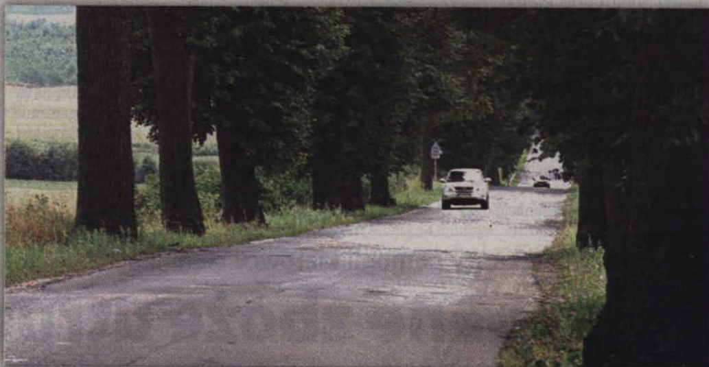
Modernizacja drogi z Bądek do Wandowa będzie wymagała wycięcia kilkudziesięciu drzew.

- Chodzi o zjazd z mostu, w kierunku Korzeniewa. Po lewej stronie drogi rosną duże lipy, które zupełnie zasłaniają widoczność. Osoba, która zamierza skręcić samochodem w stronę Korzeniewa nie ma szans, mimo