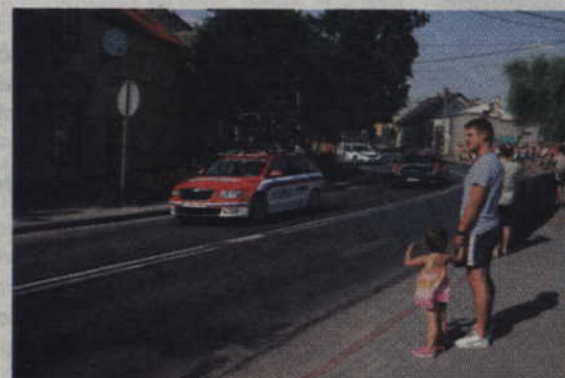
Kolarzom kibicowały całe rodziny.