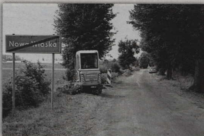
Inwestycja „Szerokopasmowe pomorskie” dotarła do gminy Gardeja.

Gmina Ryjewo: Barcice, Trzciano Gmina Prabuty: Obrzynowo, Trumiejki Gmina Kwidzyn: Brachlewo, Dankowo, Górki, Gurcz, Janowo, Licze, Maza, Nowy Dwór, Pawlice Gmina Gardeja: Nowa Wioska, Otłowiec, Rozajny, Gardeja