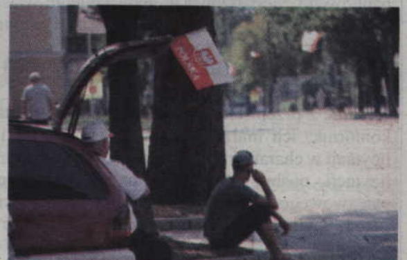
Kibicować Polsce można na wiele sposobów.