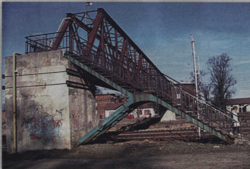
Z kładki nad torami można jeszcze korzystać, ale jej dni są i tak policzone.

- Na wiosnę tego roku uzgodniliśmy z PKP PLK czyli głównym wykonawcą tej inwestycji, że kładka będzie zdemontowana dopiero wtedy, gdy zostanie oddane do użytku przejście podziemne. Gdyby nie nasze stanowcze działania, kładka na pewno już dawno by zniknęła, a mieszkańcy zostaliby pozbawieni bezpiecznego przejścia na drugą stronę miasta. Pozytywnym zakończeniem ówczesnych perturbacji było otrzymanie zapewnienia od głównego inwestora, że możemy być spokojni co do przyszłości kładki. Jak pokazały piątkowe wydarzenia, spokój był tylko pozorny. Główny wyko-