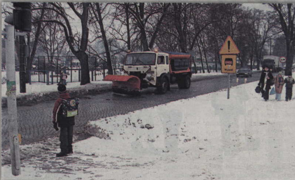
Powiat rozpoczął procedurę wyłaniającą firmy, które w okresie zimowym zajmą się odśnieżaniem dróg.

- Podobnie jak w roku ubiegłym będzie to 15 mniejszych rejonów, aby reakcja wykonawcy po pojawieniu się trudnych warunków na drogach była szybsza, a czas odśnieżania był skrócony. Nie ukrywam też, że chodzi o to, aby dać szansę mniejszym podmiotom z naszego powiatu do wzięcia udziału