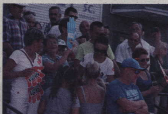
Hostessy rozdawały mieszkańcom materiały promocyjne zachęcając do głośnego dopingiu.