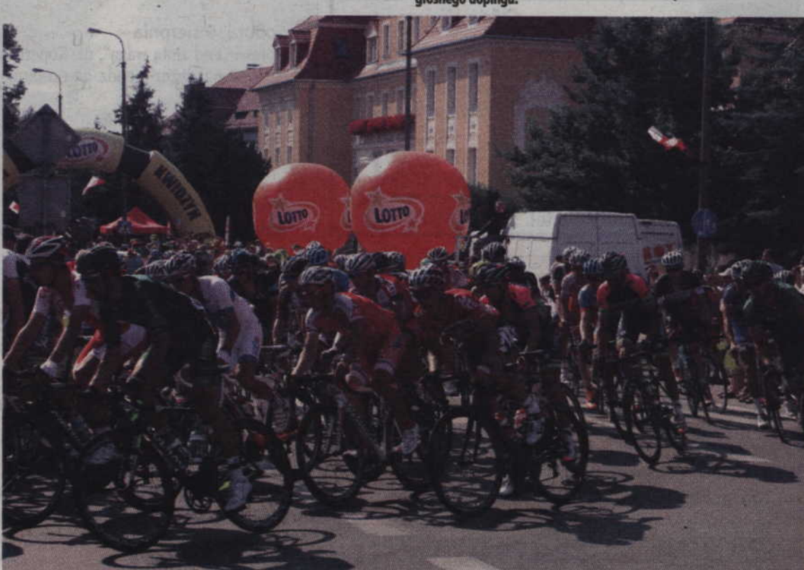
Peleton miał około 14 minut straty do uciekającej grupki.