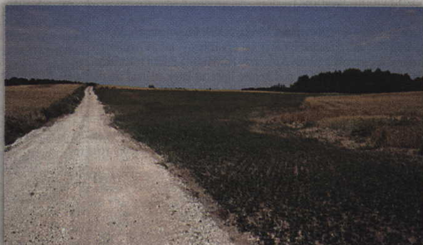
Tak ten sam teren wygląda dzisiaj.