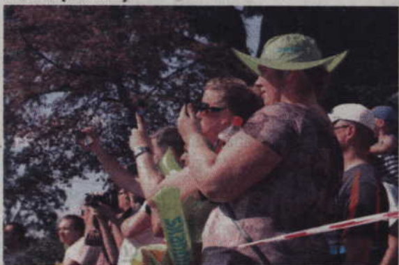
Mieszkańcy Kwidzyna nie omieszkali zarejestrować przejazdu kolarzy