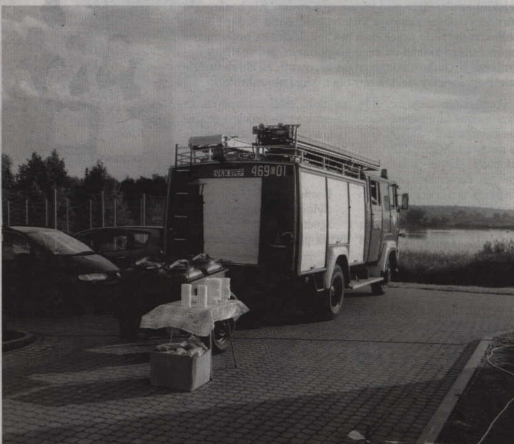
Prawie 40-letni Jelcz uległ poważnej awarii podczas akcji gaśniczej w kwidzyńskiej fabryce papieru. Na zdjęciu uszkodzone auto podczas gminnych dożynek.

Strażacy mogą liczyć także na przychyłność Rady Gminy. Poin-