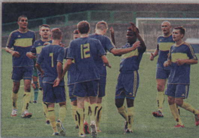
Piłkarze Rodła Kwidzyn po efektywnym zwycięstwie nad Miłoradem, tym razem ograli Chojniczankę II Chojnice.

Spotkanie w Chojnicach rozpoczęło się dość fatalnie dla kwidzyńskich piłkarzy. Już w 7 minucie padł bowiem gol dla gospodarzy. Po rzucie różnym, piłkę do siatki gości wpakował Przemysław Czerwiński, a rezerwy Chojniczanki objęły prowadzenie w tym spotkaniu. Gospodarze próbowali pójść za ciosem, jednak próby kolejnych ataków pod bramką Rodła spełzały na niczym. Nieudanie kontrowali również kwidzynianie, bowiem zarówno Temitayo, Juchniewicz, Górka czy Gretkowski, nie potrafili pokonać bramkarza Chojnic.