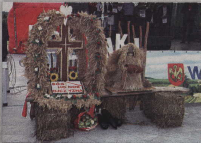
Wykonanie takiego wieńca to żmudna praca.

Jednak publiczność z niecierpliwością oczekiwała na występy tegorocznych gwiazd gardejskich dożynek. Na przysłowiowy pierwszy ogień poszedł zespół Belfast, który zaśpiewał znane i lubiane utwory legendarnego zespołu Bonny M. Dzięki nim nieco starsza publiczność przypomniała sobie zatem lata, kiedy na radiowych falach i w telewizji królował ten niemiecki zespół. Po nich sceną