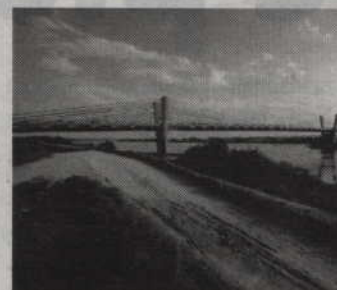
Od 1 września przejazd Drogą Krajową nr 90 znajdzie się w systemie viaTOLL.

Struktura modelu rozliczeń nadal pozostaje mniej więcej na tym samym poziomie. W przeciwieństwie do innych państw europejskich, gdzie funkcjonują elektroniczne systemy poboru