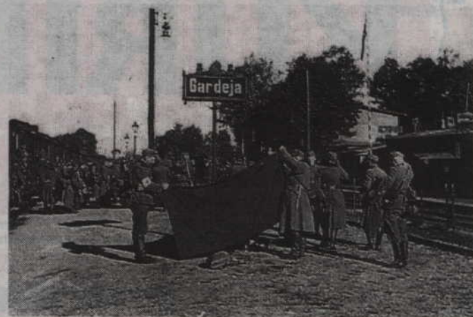
Niemieccy żołnierze z XXI Korpusu rankiem 1 września 1939 roku zajęli dworzec kolejowy w Gardcji

Kolejną jednostką z tego korpusu była 228 DP Landwehry, którą dowodził Hans Suttner. 228 Dywizja Piechoty została sformowana przez dowództwo Landwehry w Elblągu na mocy rozkazu z 16 sierpnia 1939 roku, w trzeciej fali mobilizacyjnej w III Okręgu Wojskowym. Choć jednostki te wchodziły w skład 3 armii niemieckiej, dowodzonej przez generała artylerii Georga von Kuchlera, postawiono im specjalne zadanie. XXI Korpus miał działać na korzyść 4 armii niemieckiej, której zadaniem było przecięcie polskiego Pomorza. Przed uderzeniem na Polskę we wrześniu 1939 roku, Niemcy zbudowali kilkanaście umocnień w rejonie Gardeji, Rusinowa i Biskupca. Miały one na celu zabezpieczać węzeł kolejowo-drogowy w Kwidzynie i rejon koncentracji 3 armii. Dla wzmocnienia obrony wzniesiono dodatkowo kilka umocnień w okolicy Okrągłej Łąki, Gardeji i Krążkowa. Otrzymały one nazwę tzw. „pozycji gardejskiej”. Obiekty te nadzo-