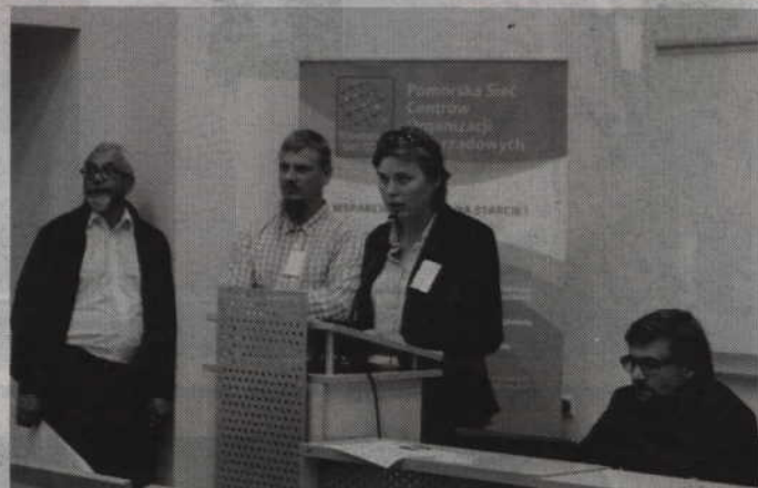
Uczestnicy forum przez osiem godzin uczestniczyli w zajęciach przygotowanych przez Fundację M.A.P.A. Obywatelska z Kwidzyna.

I Forum było przede wszystkim platformą do wzajemnego poznania się oraz wymiany doświadczeń między pozarządowym Powiślem, Kociewiem, Żuławami i Mierzeją Wiślana. (fox)