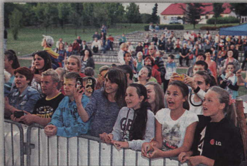
Zespół Next szczególnie spodobał się młodszej publiczności.