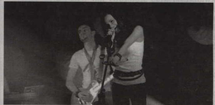
Gwiazdą kwidzyńskiego Pożegnania Lata będzie m.in. Natalia Szroeder.

Kwidzyńskie Centrum Kultury zaprasza na Pożegnanie Lata. Impreza odbędzie się na terenach rekreacyjnych nad Liwą już w najbliższą sobotę - 30 sierpnia. Wstęp wolny. W programie znalazły się m.in. koncerty Natalii Szroeder oraz zespołu Future Folk. Nie zabraknie także atrakcji dla dzieci, a dorośli mieszkańcy będą mogli m.in. wspólnie przygotować wielki gar smacznej stawy. (fox)