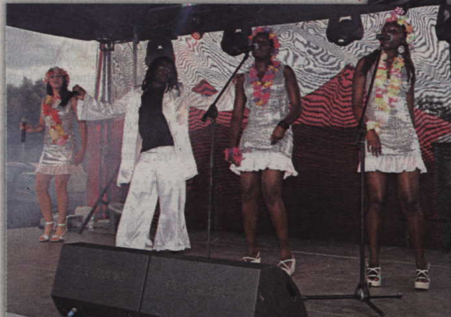
Zespół Belfast przypomniał największe przeboje grupy Boney M.