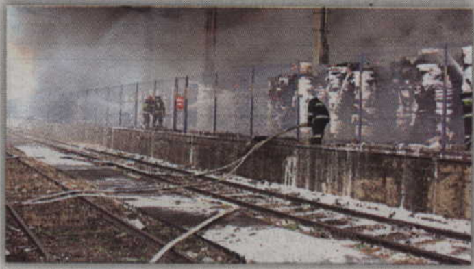
30 godzin trwała akcja gaszenia pożaru, który wybuchł na terenie składowiska makulatury w International Paper Kwidzyn.