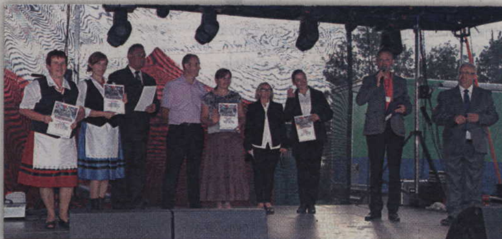
W tym roku nagrodzono autorów wszystkich wieńców dożynkowych.

Zgodnie z tradycją podczas święta plonów organizowane są