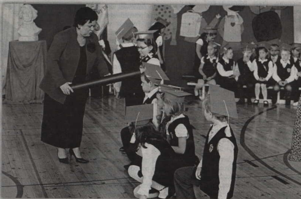
Do czterech szkół podstawowych w Kwidzynie trafi ok. 180 pierwszoklasistów.