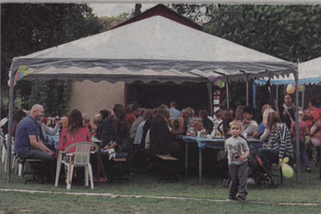
Działkowcy podczas wspólnego biesiadowania.