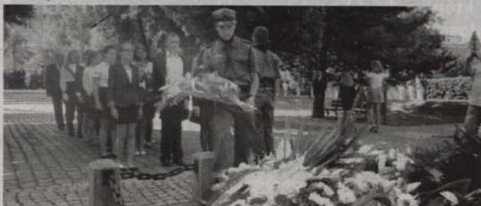
Uroczystości upamiętniające rozpoczęcie II Wojny Światowej rozpoczną się na Skwerze Kombatantów.

Przewodniczący Rady Miejskiej w Kwidzynie oraz Burmistrz Kwidzyna zapraszają na uroczyste obchody 75 rocznicy wybuchu II Wojny Światowej. Uroczystości odbędą się w najbliższy poniedziałek – 1 września na Skwerze Kombatantów, przy ul. Warszawskiej.