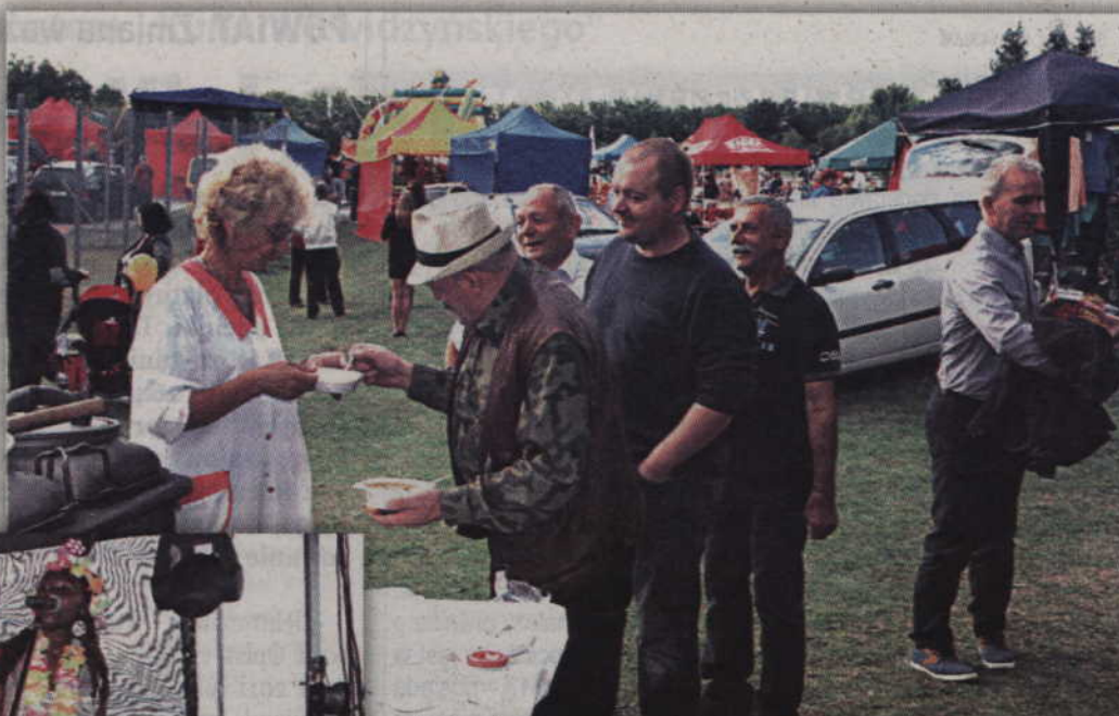
Gardejska grochówka zawsze cieszy się uznaniem.