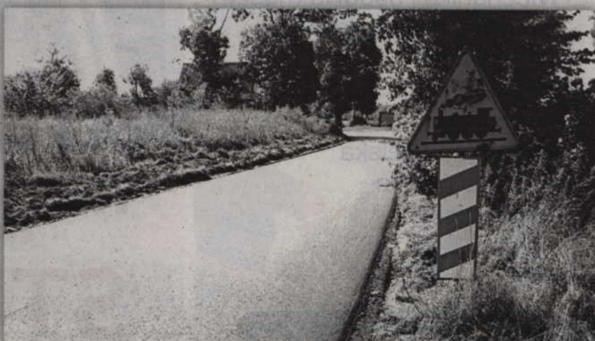
Nowa asfaltowa nawierzchnia cieszy nie tylko kierowców.