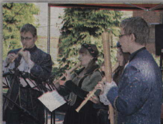
Koncert grupy Con Grazia.