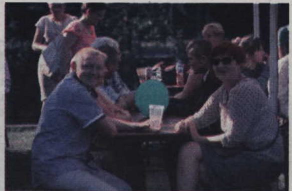
Przez dożynki powiatowe przeprowadziła zebranych efektowna para prowadzących.