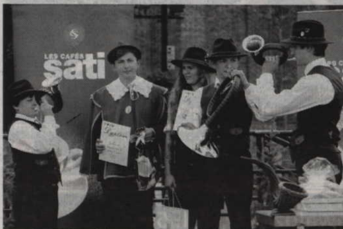
W kategorii C triumfował Zespół Sygnalistów Myśliwskich „Niedźwiedź” z Bytowa.