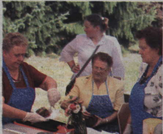
Panie z Koła Gospodyń Wiejskich w Trzcianie przygotowały m.in. smakowite ciasto.