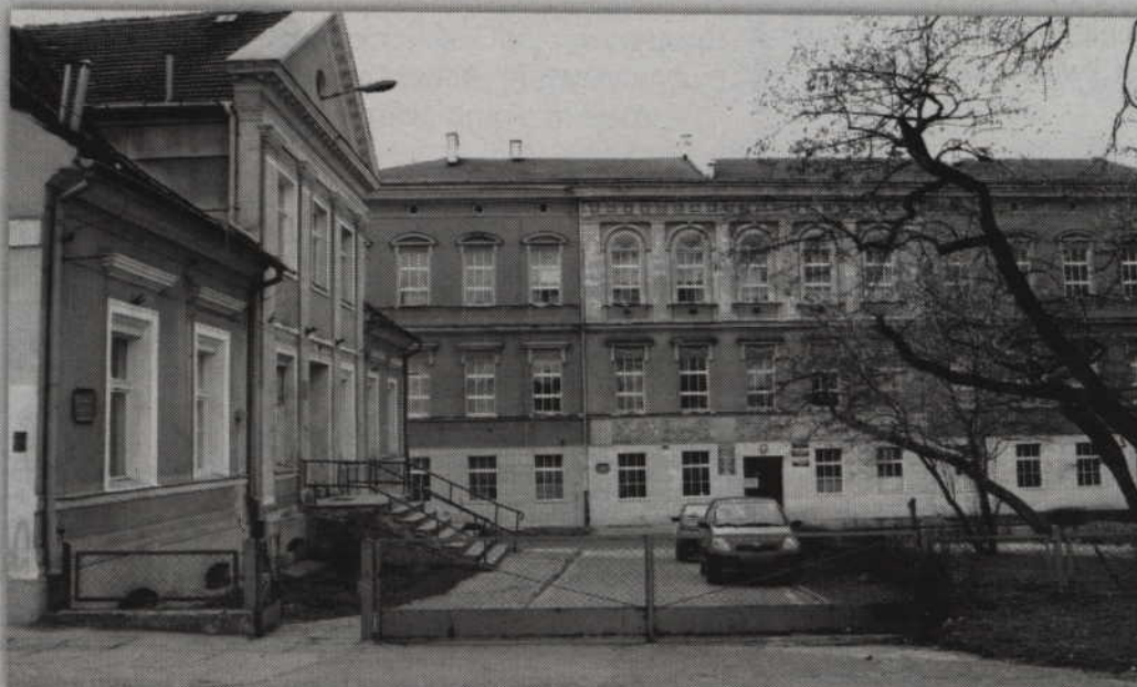
Zabytkowy budynek ZSP nr 2 w Kwidzynie czeka gruntowna renowacja.

skają można wsparcie na zakup wyposażenia pracowni oraz przywrócenia pierwotnego stanu