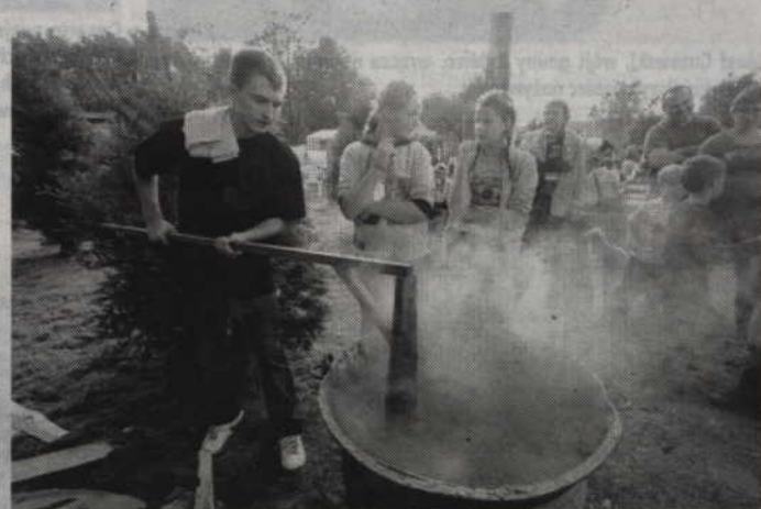
Wspólne smażenie powideł to już tradycja nebrowskich spotkań.

Impreza rozpocznie się o godzinie 15.00 od parady motocyklistów. Podczas Święta Powideł Nebrowskich odbędzie się również konkurs kulinarny na ciasto ze śliwką, a dla uczestników zabawy zagrają zespoły „Bahama Boney M” oraz „Rytmy”. Nie zabraknie również pokazów tańca z ogniem. Ponadto podczas trwania imprezy prowadzony będzie bufet na którym będzie można skosztować darmowej grochówki oraz ciasta ze śliwką. Nie zabraknie również atrakcji przygotowanych przez strażaków – ochotników. (fox)