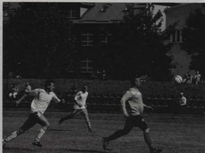
W drugiej połowie mimo okrojonego składu piłkarze Spójni często zagrażali bramce przeciwników.

-Mecz rozgrywany w samo południe, przy takim upale, dał się mocno we znaki wszystkim zawodnikom. Wygraliśmy, bo w