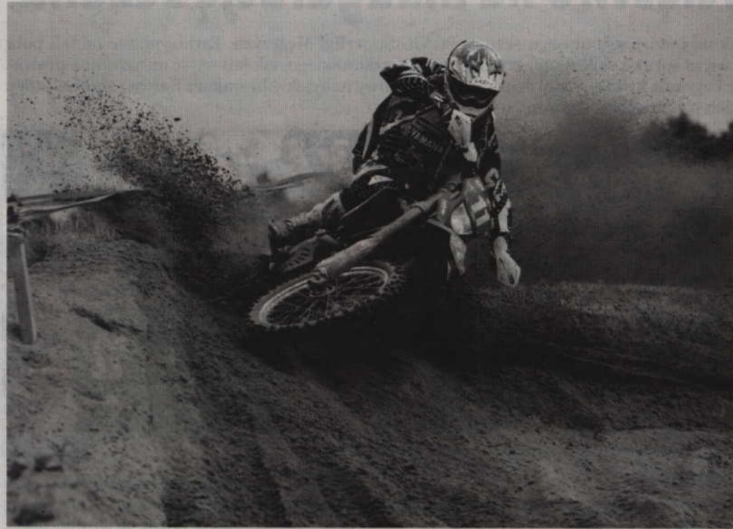
Zawody enduro odbędą się w Kwidzynie po 4 latach przerwy.