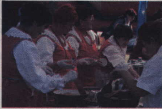
Placki przygotowane przez Koło Gospodyń Wiejskich „Renawa” z Benowa okazały się prawdziwym hitem tego festynu.