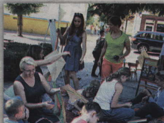
Dzieci oraz rodzice podczas przygotowywania latawców.