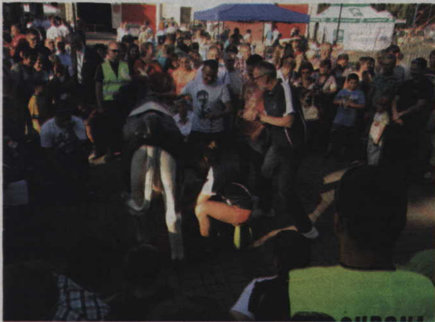
Wiele emocji wzbudziła rywalizacja gmin w dojeniu sztucznej krowy.