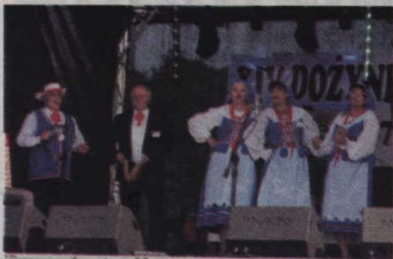
Występ zespołu „Powiślanki”.