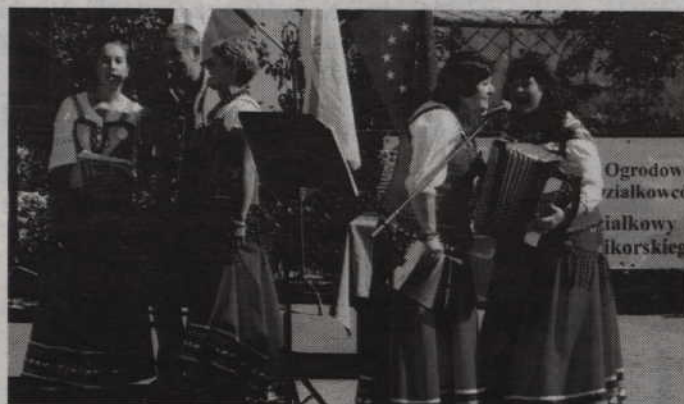
W dobry humor świętujących wprowadził zespół „Cyganeczki”.

Występ grupy „Cyganeczki” oraz zabawa z zespołem „Rytmy” to tylko niektóre z atrakcji jakie czekały uczestników Dnia Działkowca zorganizowanego przez Rodzinną Ogród Działkowy im. gen. W. Sikorskiego w Kwidzynie. Nie zabrakło również prezentacji kulinarnych kół gospodyń działkowych, wystawy plonów działkowych czy też loterii fantowej.