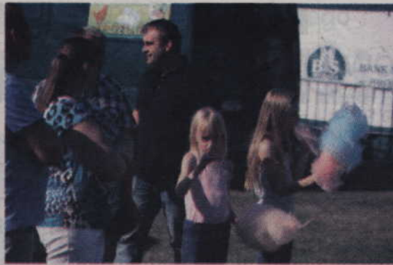
Kolorowa wata cukrowa przyciąga najmłodszych na każdej imprezie plenerowej.