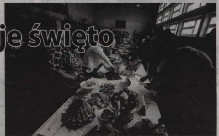
Podczas Święta Wsi w Tychnowach odbędzie się uroczysta inauguracja publikacji „Powiślański Stół Wielkanocny” prezentującej potrawy przygotowywane przez lokalne koła gospodyń.

Podczas imprezy odbędą się między innymi pokazy i warsztaty, w tym hafciarskie i rzeźbiarskie. Zaprezentowany zostanie zabytkowy sprzęt rolniczy. Będą też przysmaki kuchni regionalnej. Reprezentacje poszczególnych sołectw będą walczyły o Puchar Wójta Gminy Kwidzyn.