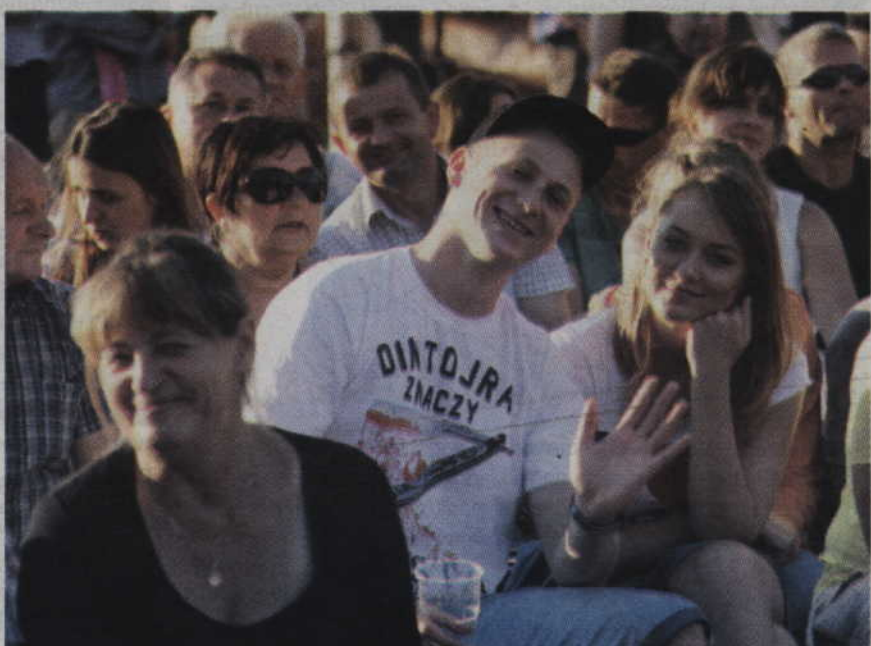
Zadowoleni uczestnicy dożynek w Ryjewie.