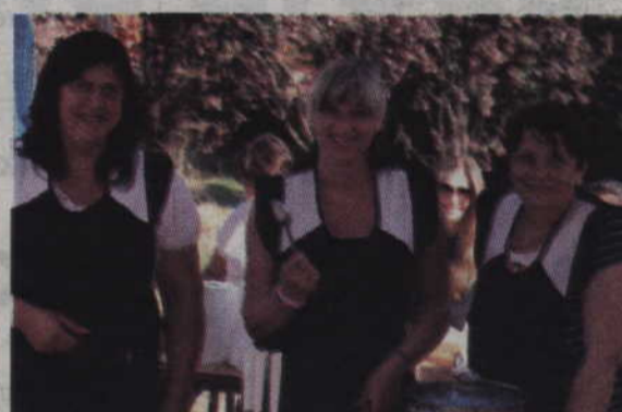
Roześmiane członkinie Koła Gospodyń Wiejskich w Mątowskich Pastwiskach.