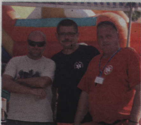
Ratownicy medyczni również chcieli mieć swoje zdjęcie na tamach „Kurierera”.