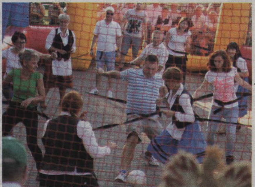
Rywalizacja na nietypowym boisku bardzo szybko zyskała wielu sympatyków.