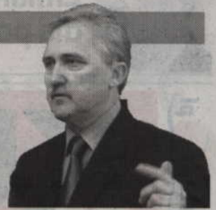
Leszek Czarnobaj - senator RP

O projekcie ustawy, która ma przeciwdziałać transferowaniu pieniędzy do tzw. rajów podatkowych rozmawiamy z Leszkiem Czarnobajem, senatorem RP.