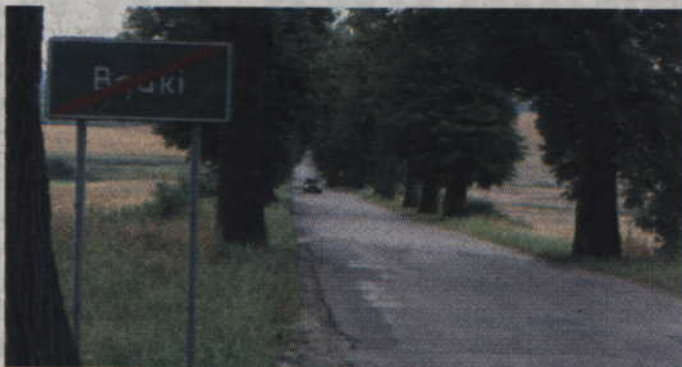
Samorząd powiatu chce usunąć około stu drzew znajdujących się przy drodze Bądko-Wandowo.