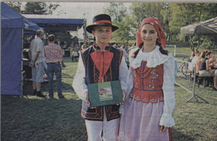
Święto Wsi było okazją do zaprezentowania książki „Smaki Powiśla - Powiślański Stół Wielkanocny”.