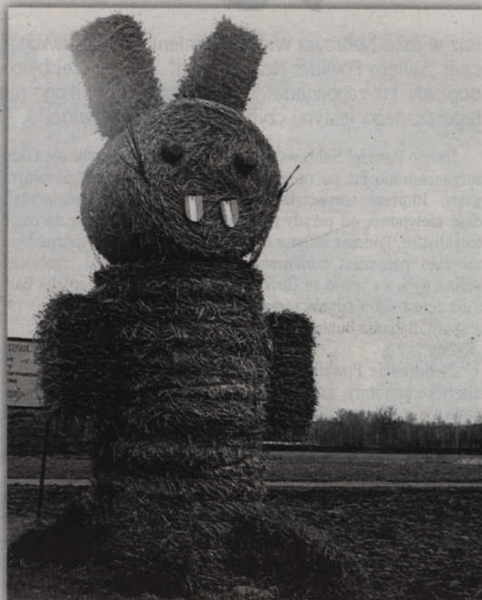
Olbrzymia figura zająca przez 12 lat witała przejeżdżających przez Grabowo.