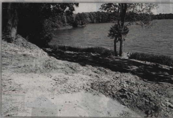
Wszystko wskazuje na to, że właściciel działki sąsiadującej z jeziorem przeprowadził prace ziemne bez zgody RDOŚ.

- Obszary chronionego krajobrazu nie leżą w kompetencji starostwa. Nadzór nad takimi terenami pełni Regionalna Dyrekcja Ochrony Środowiska. Był jednak sygnał o zniszczeniu fragmentu chronionego krajobrazu, więc naszym obowiązkiem było sprawdzić, czy takie działania rzeczywiście miały miejsce. Na miejscu wykonaliśmy dokumentację fotograficzną, potwierdziliśmy też wycinkę drzew. W sprawie wycinki drzew wystoso-