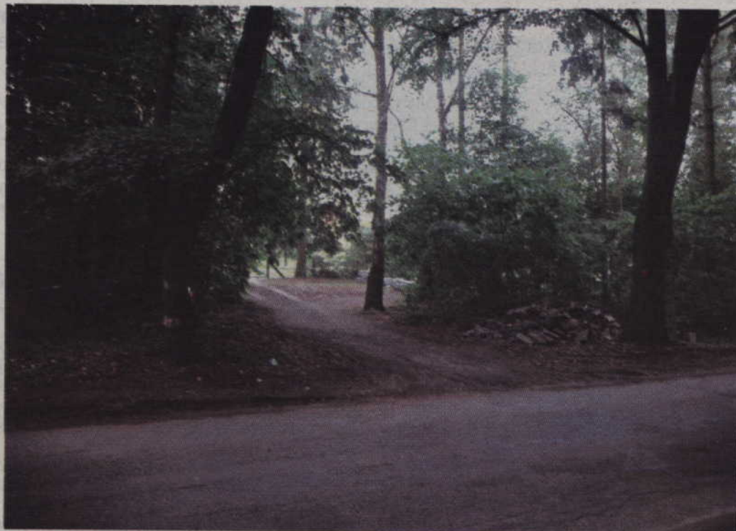
Jeśli Lasy Państwowe wprowadzą zakaz wjazdów od strony ulicy Kuracyjnej część mieszkańców nie wyjedzie ze swoich posesji. Póki co nielegalnie przejeżdżają przez tereny leśne.

-To co obecnie jest wyjeżdżone przez mieszkańców było nawet częściowo utrzymywane przez gminę, my się tego nie wyrzekamy. Skoro mieszkańcy korzystali z przysłowiowych skrótów jadąc do swoich posesji, to nawet ułożyliśmy w tym miejscu kilka płyt betonowych. To wszystko funkcjonowało przez kilkadziesiąt lat do czasu, kiedy rozpoczęliśmy modernizację ulicy Kuracyjnej. Nie zaprzeczamy, że tych wjazdów przez tereny leśne się namnożyło. Również ja się nie zarzekam, że nie korzystam z przysłowiowego skrótu przez las. W planie zagospodarowania przestrzennego przy mojej