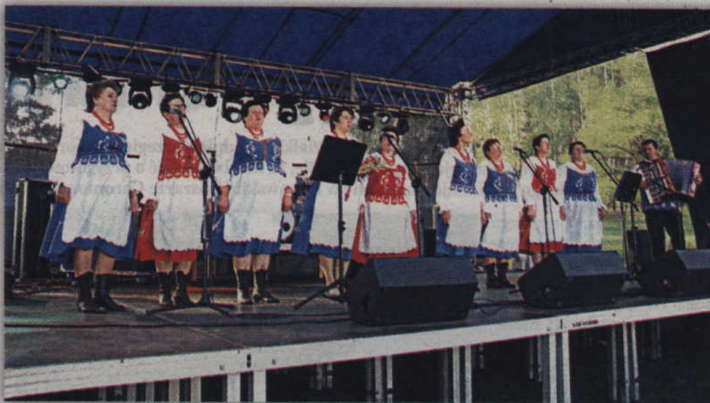
Na scenie „Wesoła Gromadka” z Tychnow.