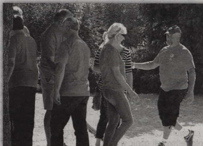
Zwycięski TKKF Celuloza w meczu z Antares Lubawa.

Po spotkaniach 1/16 finału do dalszej fazy rozgrywek awansowały: TKKF Celuloza, PSM Renawa II, Bractwo, Piastów, TGB Warszawa II,