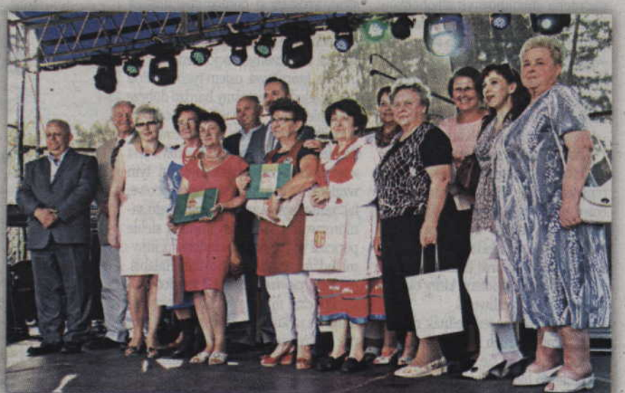
Na scenie samorządowcy z powiatu kwidzyńskiego oraz panie z kół gospodyń wiejskich, autorki przepisów zamieszczonych w publikacji.