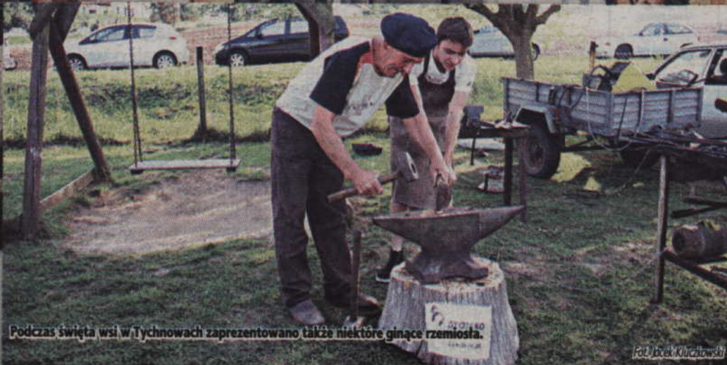
Podczas święta wsi w Tychnowach zaprezentowano także niektóre ginące rzemiosła.