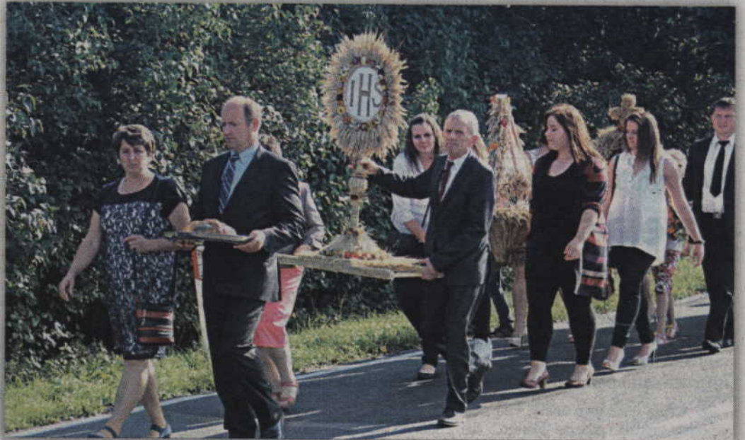
Po Mszy świętej, odprawionej w kościele parafialnym w Tychnowach, orszak dożynkowy przeszedł na teren przy miejscowej Szkole Podstawowej.

Jury przyznało wyróżnienia za wykonanie wieńców dla sołectw Pastwa i Podzamcze. Trzecie miejsce przyznano sołectwu