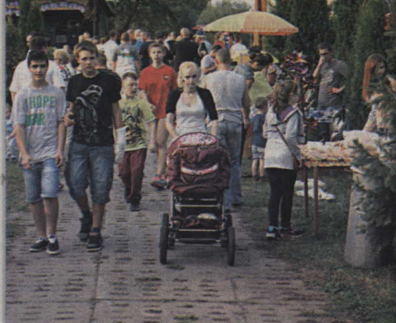
Imprezę, jak co roku, zorganizowano na placu przed remizą w Nebrowie Wielkim.