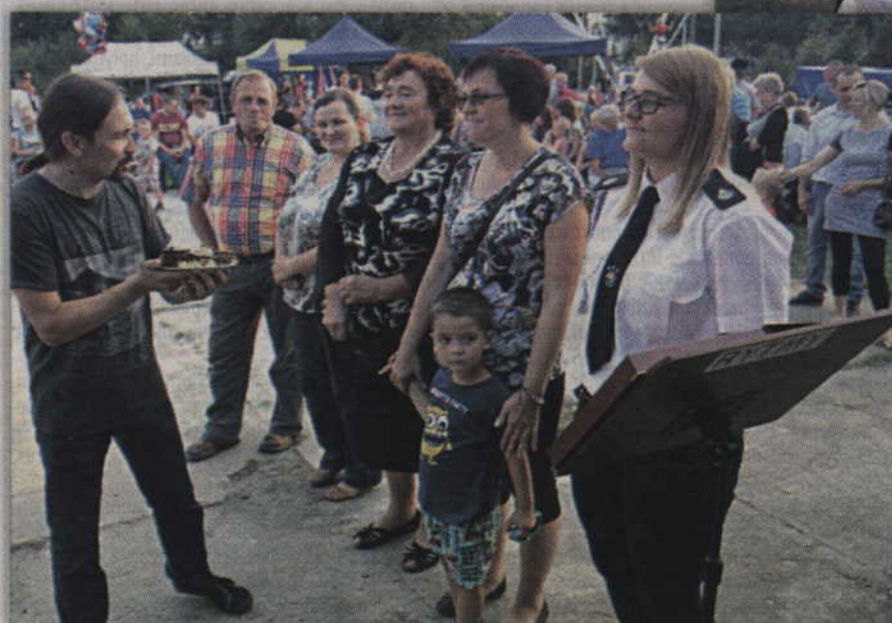
Jurorzy oceniali cztery tegoroczne wypieki zgłoszone do konkursu. Na zdjęciu panie, których ciasta rywalizowały o główną nagrodę.