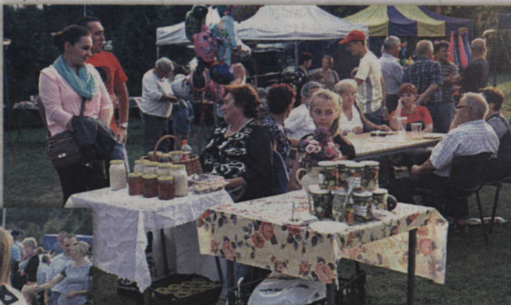
Na festynie nie zabrakło miodów z miejscowej pasieki.