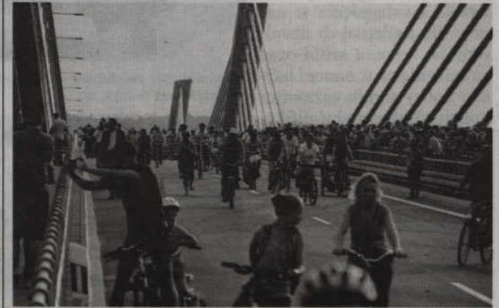
Ubiegłoroczne otwarcie mostu odbyło się przy ogromnym zainteresowaniu mieszkańców.

KWIDZYN. W przyszłym roku poznamy liczbę osób spoza miasta, którzy korzystają z kwidzińskich obiektów, takich jak pływalnie, cyfrowe kino czy hala widowiskowo-sportowa. W ten sposób władze chcą zorientować się jak oddanie do użytku mostu przez Wisłę wpłynęło na zainteresowanie ofertą kulturalną i sportową miasta.