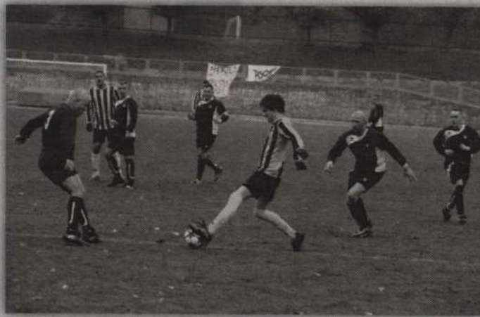
Rodło II Kwidzyn rozgromiło Koronę Rywałd aż 7:1.