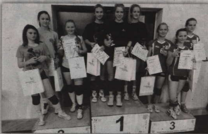
Kwidzyńskie Siatkareczki zwyciężyły w dwóch kategoriach. Na zdjęciu na najwyższym stopniu podium w kat. rocz. 1999-2001.