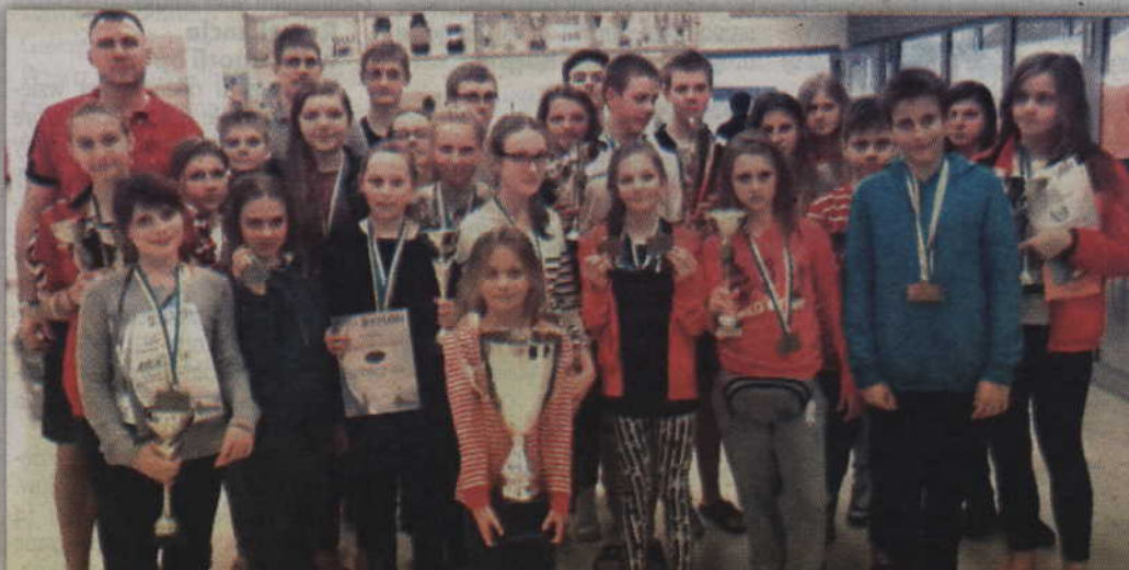
Pływacy MTS Kwidzyn po zakończonych zawodach TRI-TEM Swimming Cup w Kościerzynie.