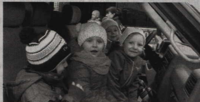
Największą przyjemność sprawiło dzieciom oglądanie policyjnego radiowozu.