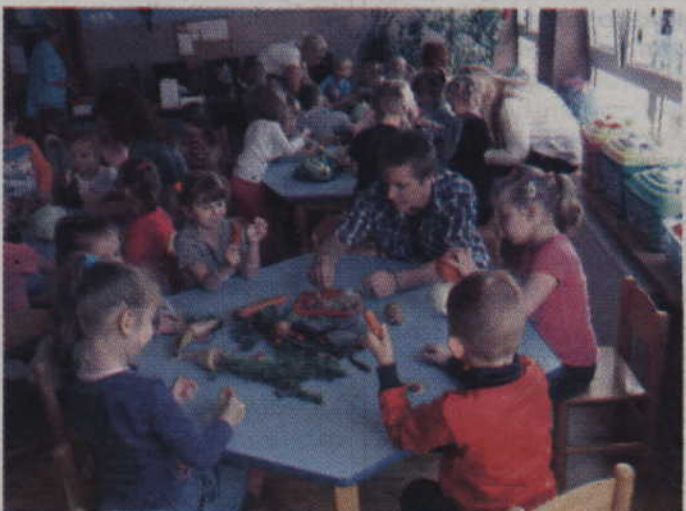
Wolontariusze odwiedzili dzieci z Niepublicznego Przedszkola Ekologicznego w Kwidzynie.

- Szkolne Koło Wolontariatu otrzymało dofinansowanie rzeczowe na realizację swojego projektu w Niepublicznym Przedszkolu Ekologicznym w Kwidzynie. W tym celu zakupiło