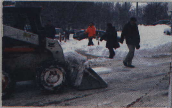
Powiat kwidzyński podzielony został na 16 rejonów, aby można było skuteczniej i szybciej rozpocząć działania na drogach.

nia i poprawiamy nawierzchnię na drodze w Olszanie. To asfaltowy odcinek drogi powiatowej. Zamierzamy też wykonać nakładkę. Poprawiamy również nawierzchnię drogi w Rozajnach Wielkich, poprzez poszerzenie pobocza. Ten rok jest dla nas wyjątkowo łaskawy