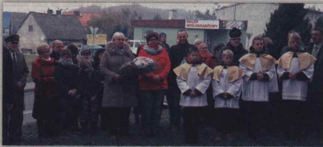
Po mszy mieszkańcy złożyli kwiaty oraz zapalili znicze pod tablicą Walczących Za Ojczyznę.

Przypomnijmy, że w 1918 roku Polska zaczęła ogromne dzieło odbudowy i scalania własnych ziem po 123 latach niewoli. Niestety Niepodległa Polska nie dotarła wówczas na Powiśle, w tym również do Gardei. Choć była na wyciągnięcie ręki, to jednak dzieliła ją nieprzyjazna granica.