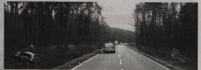
Do wypadku doszło na trasie K-55 w okolicach skrzyżowania z drogą prowadzącą do Ryjewa.