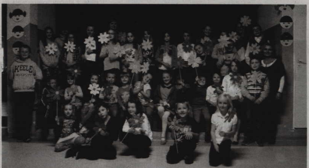
W warsztatach teatralnych zorganizowanych w Obrzynowie wzięło udział kilkadziesiąt osób.

Jak podkreśla Agnieszka Suwińska, współprowadząca warsztaty teatralne, od kilku lat w Obrzynowie odbywa się przegląd teatralny. Jego adresatami są uczniowie szkół podstawowych i przedszkoli. Warsztaty są również pewną formą nagradzania tych osób, które chcą się bawić w teatr.