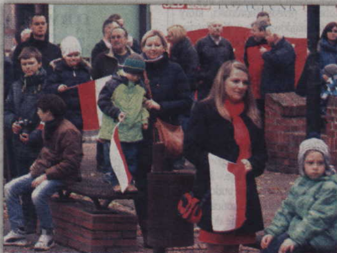
11 Listopada barwy narodowe towarzyszyły niemal wszystkim mieszkańcom Kwidzyna.