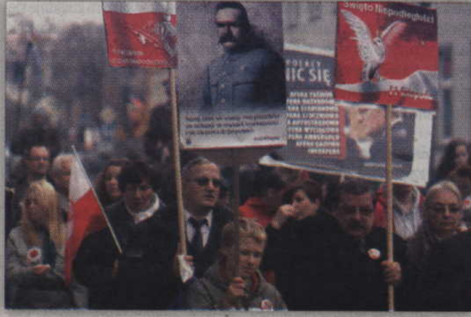
Sympatycy prawej strony sceny politycznej przypomnieli m.in. słowa Marszałka.