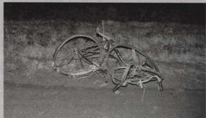
Tak wyglądało auto sprawcy wypadku oraz rower zmarłego 51-latka.