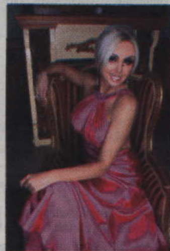
Koncert Teresy Werner odbędzie się 22 listopada.

W roku 2014 Teresa Werner wydała swój najnowszy album zatytułowany „Szczęśliwe chwile”, na której znalazło się 18 piosenek oraz muzyczny bonus. (fox)