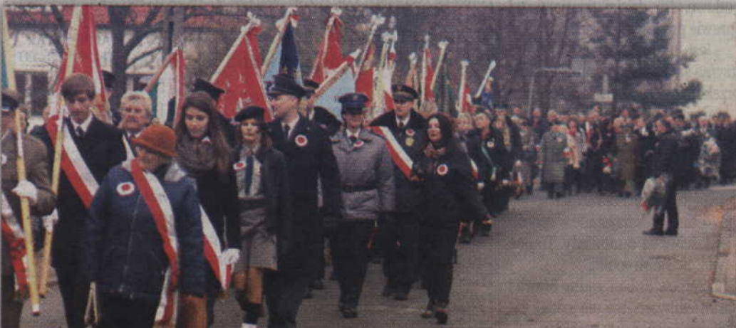
W uroczystościach wzięły również udział poczty sztandarowe.