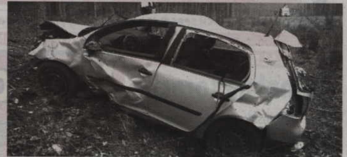
Kierowca golfa stracił panowanie nad autem, zjechał na pobocze i dachował.

-Wstępne ustalenia stróżów prawa wykazały, że jadący golfem 22-letni mieszkaniec powiatu elbląskiego, najprawdopodobniej nie dostosował prędkości do warunków panujących na jezdni, stracił panowanie nad pojazdem, zjechał na pobocze i dachował. W wypadku ogólnych obrażeń doznały trzy osoby: kierowca oraz dwoje pasażerów auta. Czwarą osobą, tj. 19-letnią pasażerką golfa trafiła w stanie ciężkim do szpitala - wyjaśnia Anna Filar, rzecznik prasowy Komendy Powiatowej