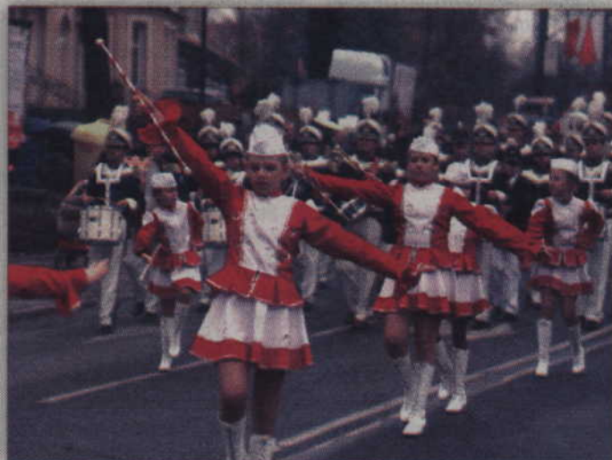
Uroczysty orszak prowadziły mażoretki oraz orkiestra dęta „Helikon”.