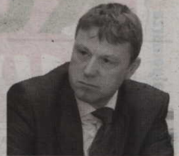
kańców znalazło zatrudnienie.

-Druga tura jest rzeczywiście trudniejsza. Wielu mieszkańców uważa, że oddając głos w pierwszej turze wypełniło swój obowiązek. Cały czas spotykam się z mieszkańcami, zachęcam do udziału w wyborach. Na kogo zagłosują w drugiej turze to będzie ich suwerenna decyzja. Jako urzędujący burmistrz nigdy nie naraziłem gminy na szkody. Za mojej kadencji powstały dwa spore zakłady, gdzie wielu miesz-