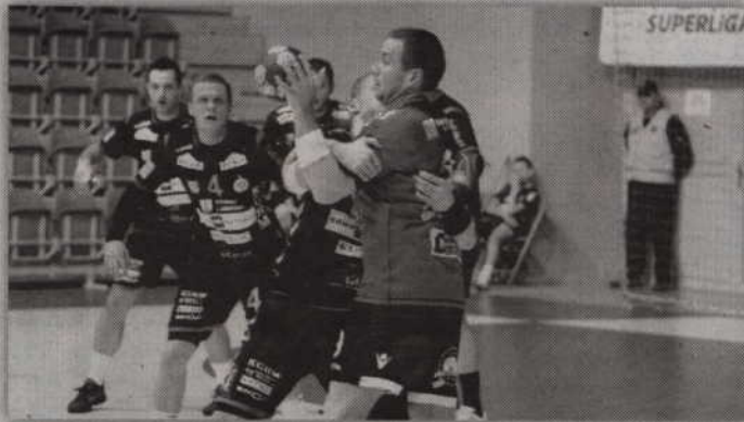
Zagłębie Lubin będzie pierwszym rywalem MMTS w tegorocznych rozgrywkach pucharowych.