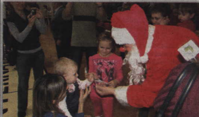
Podczas zabawy przedszkolaki spotkają się również z Mikołajem.

REKREACJA. Kwidzyńskie Centrum Sportu i Rekreacji zaprasza na imprezę dla przedszkolaków „Umieję wszystko”. Odbędzie się ona w sobotę - 6 grudnia o godz. 11.00, i jak co roku będzie to zabawa sportowo-rekreacyjna z Mikołajem. Udział dzieci w zabawie jest bezpłatny.