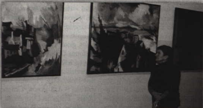
Zwiedzającym udostępniono kilkadziesiąt obrazów.

tel. 58/ 535 14 90, kom.661 032 652, 665 389 690