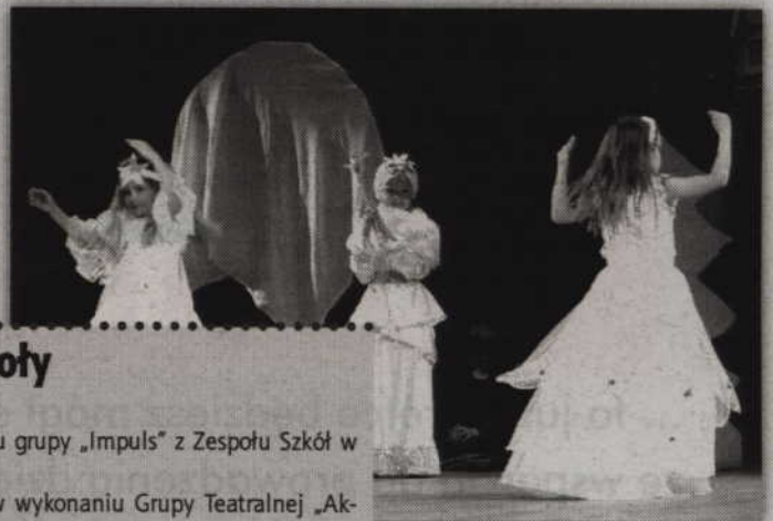
Uczniowie SP 4 w Kwidzynie w spektaklu „Dwie Dorotki”.