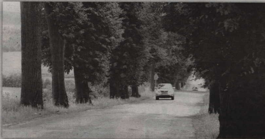
Samorząd powiatu zabiega o wycięcie 111 drzew rosnących na drodze z Bądek do Jaromierza.