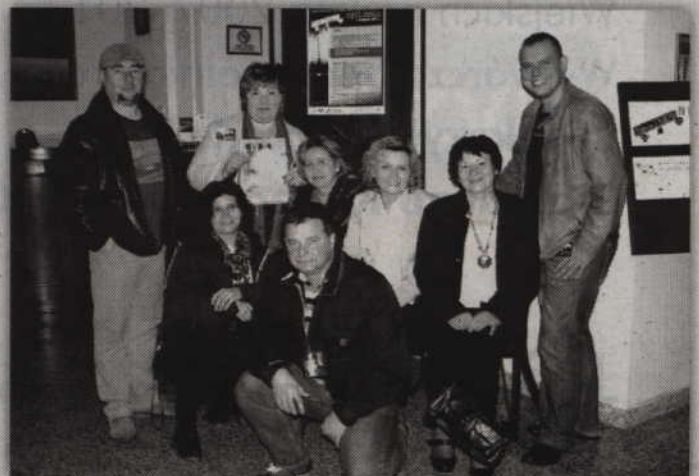
Super Nova jako jedyna grupa teatralna zdecydowała się na klasykę podczas przeglądu.

przedstawień. Poprowadzili także specjalne warsztaty teatralne, które „Super Novej” pozwolą na jeszcze lepsze bawienie się w teatr. Z naszej redakcyjnej strony