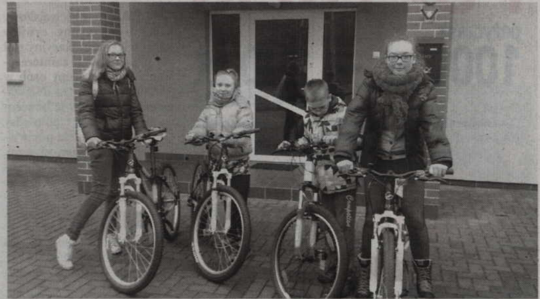
Osiem rowerów otrzymali wychowankowie Centrum Domów dla Dzieci w Kwidzynie. To efekt tegorocznej edycji Skandia Maraton Lang Team.