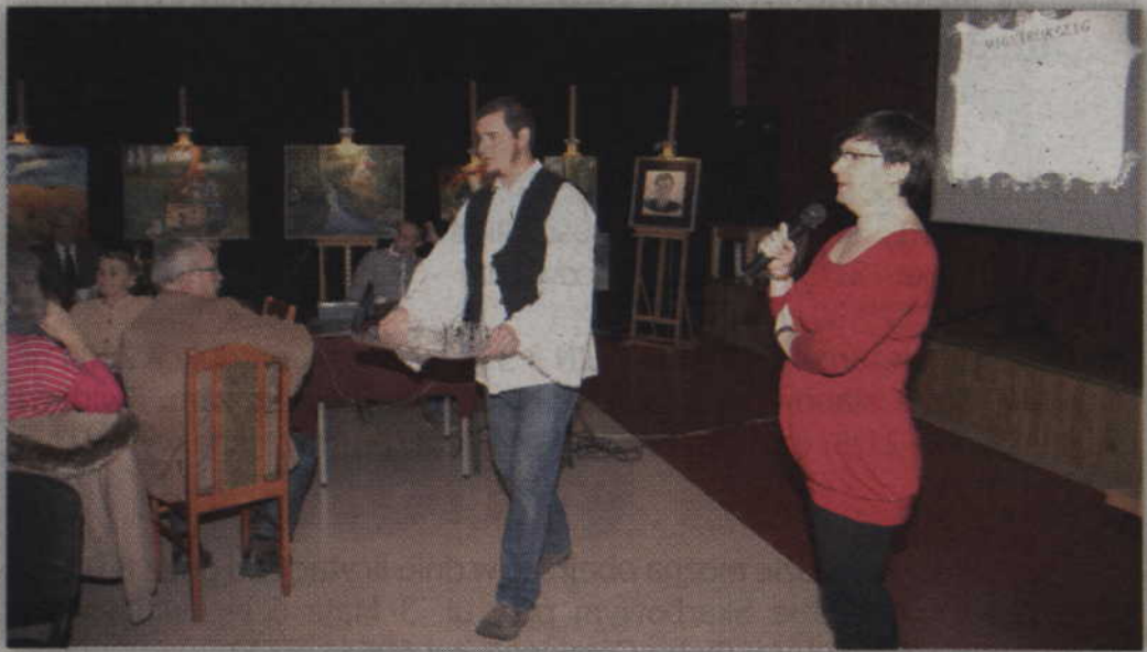
Kieliszek Palinki na Węgrzech pije się na pusty żołądek.