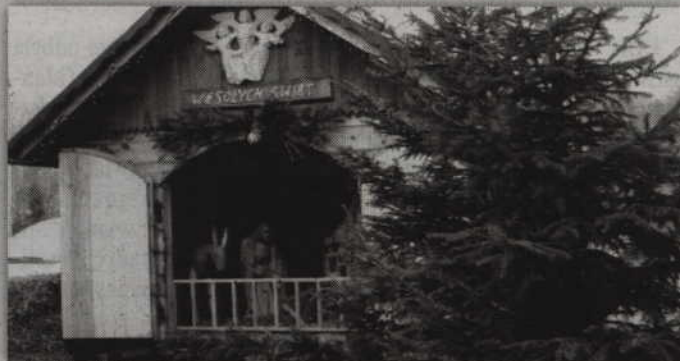
Szopka Bożonarodzeniowa stanęła na placu przy Gminnym Ośrodku Kultury w Ryjewie.

Podczas imprezy odbywały się tańce, zabawy oraz konkurencje z nagrodami, a po przybyciu Świętego Mikołaja każde dziecko otrzymało paczkę pełną słodyczy. Na koniec, po dość długim wręczaniu paczek, Mikołaj również zatańczył wraz z uczestnikami ryjewskiego