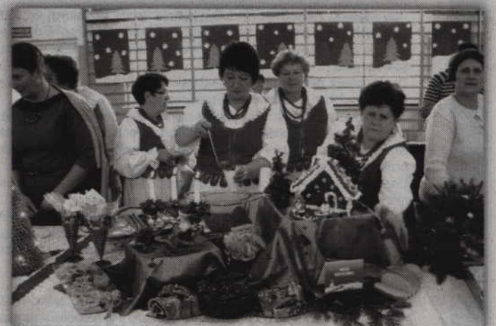
W ubiegłym roku panie z KGW w Benowie serwowały wymyślną zupę grzybową.

-Przewidujemy, że w imprezie weźmie udział nawet 25 kół gospodyń wiejskich. Z samej gminy Prabuty zgłosiło się już 8 kół. W świąteczny nastrój wprowadzi wszystkich występ „Grupy