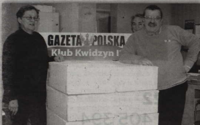
Klub Gazety Polskiej II przygotował 16 paczek, które trafią do kombatantów z Kresów.

KWIDZYN. Klub Gazety Polskiej Kwidzyn II przygotował szesnaście świątecznych paczek, które trafią do kombatantów, niezłomnych Bohaterów. Po II Wojnie Światowej pozostali oni na Kresach Utraconych czyli dzisiejszych terytoriach Litwy, Białorusi i Ukrainy.