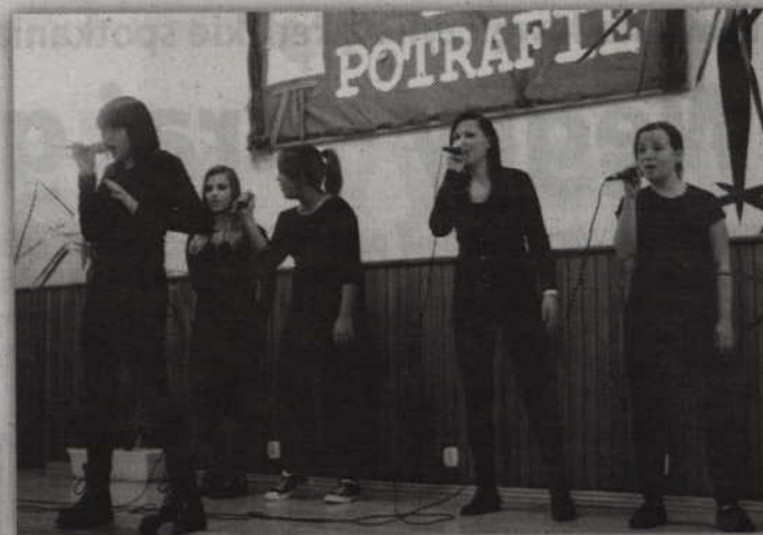
Podstawą przygotowanego programu artystycznego występ szkolnego zespołu „Salem”.