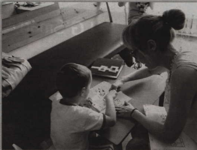
Ponad trzysta dzieci i młodzieży, a także ich rodzice i opiekunowie skorzystali z pomocy Stowarzyszenia Rehabilitacyjnego Centrum Rozwoju Porozumienia w Kwidzynie.

Prezes kwidzińskiego stowarzyszenia dodaje, że realizacja