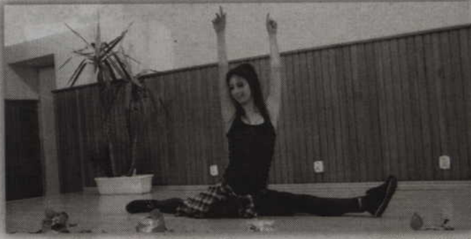
Fragment jednego z pokazów tanecznych.