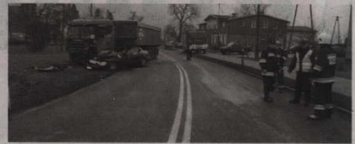
Do wypadku doszło na drodze K-55 w Tychnowach.

Wstępne ustalenia stróżów prawa wykazały, że jadąca daewoo leganza 26-letnia mieszkanka Słupska, nie dostosowała