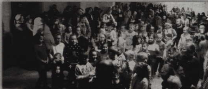
Dzieci spotkały się z Mikołajem odbyło się w sali GOK.

spotkania, po czym udał się w podróż do innych dzieci.