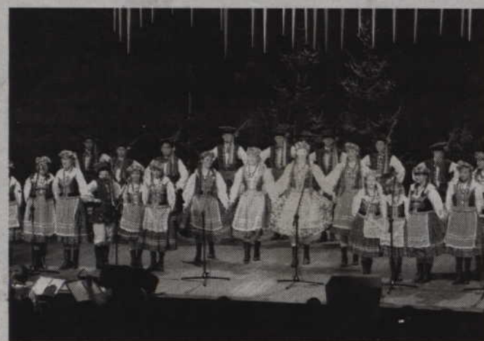
Koncertu kołęd w wykonaniu „Powiśla” będzie można wysłuchać dwukrotnie: w niedzielę - 21 grudnia, a także dzień później, podczas spotkania oplatkowego.