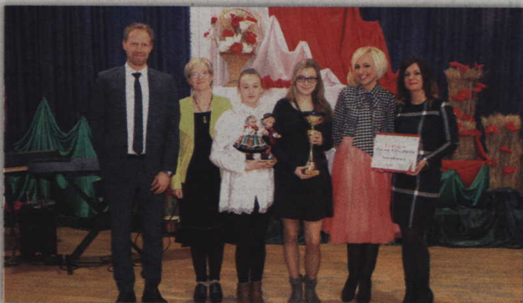
Nagrodzona Grand Prix reprezentacja Gimnazjum nr 2 w Kwidzynie w towarzystwie prowadzących galę finałową.

Twórczości Patriotycznej odbyła się w Gimnazjum nr 12 w Gdańsku. Organizatorami tegorocznych zmagani byli: Gimnazjum nr 12 w Gdańsku, Związek Nauczycielstwa Polskiego Oddział Gdańsk oraz Stowarzyszenie Miłośników Polskiej Tradycji. Festiwal obejmował natomiast siedem konkursów przeznaczonych dla