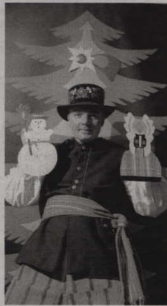
Spektakl „Choinka” przygotował Teatr Falkoshow z Krakowa.

Spektakl przygotowany przez Teatr Falkoshow z Krakowa obejrzyć można w sobotę - 19 grudnia o godz. 18.00 w Czarnej Sali Kwidzińskiego Centrum Kultury przy ul. Słowiańskiej. Bilety w cenie 10 zł nabywać można przed wejściem. (fox)