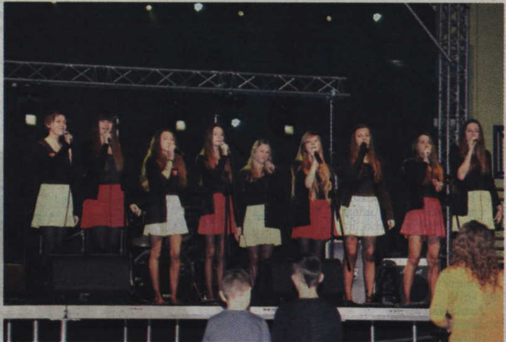
Na scenie zaprezentował się zespół wokalny działający w domu kultury.

„Na hali publiczność, wykonawcy i my jako organizatorzy mieliśmy zdecydowanie więcej miejsca niż w domu kultury. Bez przeszkód rozstawiliśmy dużą scenę, która ułatwiła prowadzenie imprezy jak i występy zespołów muzycznych czy grup wokalnych. Oprócz występów zespołów działających przy