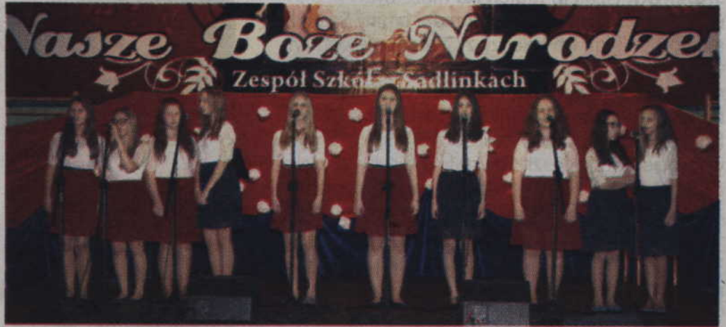
Zespół wokalny Fantazja z Sadlinek zwyciężył w kategorii zespoły wokalne gimnazjum.