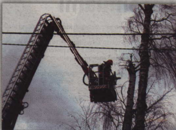
Strażacy usuwali skutki przejścia nad powiatem huragan Feliks.