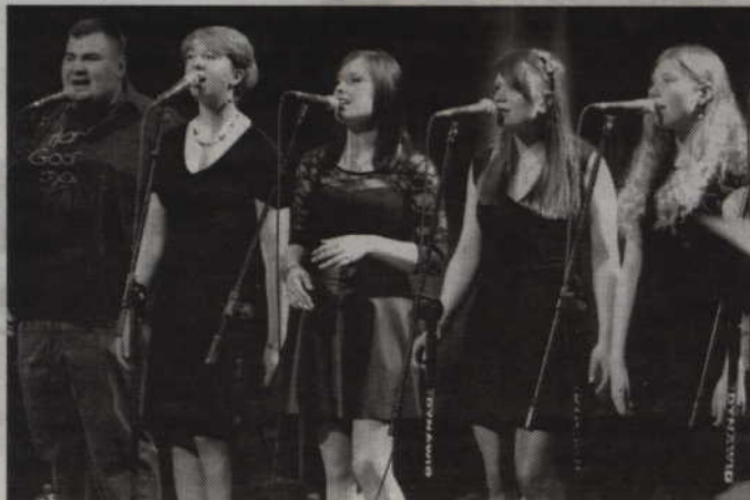
Harfa Gospel Choir obchodzi 20-lecie swojego istnienia.