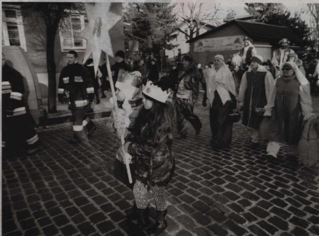
Efektowny orszak Trzech Króli przeszedł ulicami Prabut.

Organizatorzy zbadali również o bezpieczeństwo. Tym razem w rolę osób ochraniających procesję przejęli strażacy z jedno-