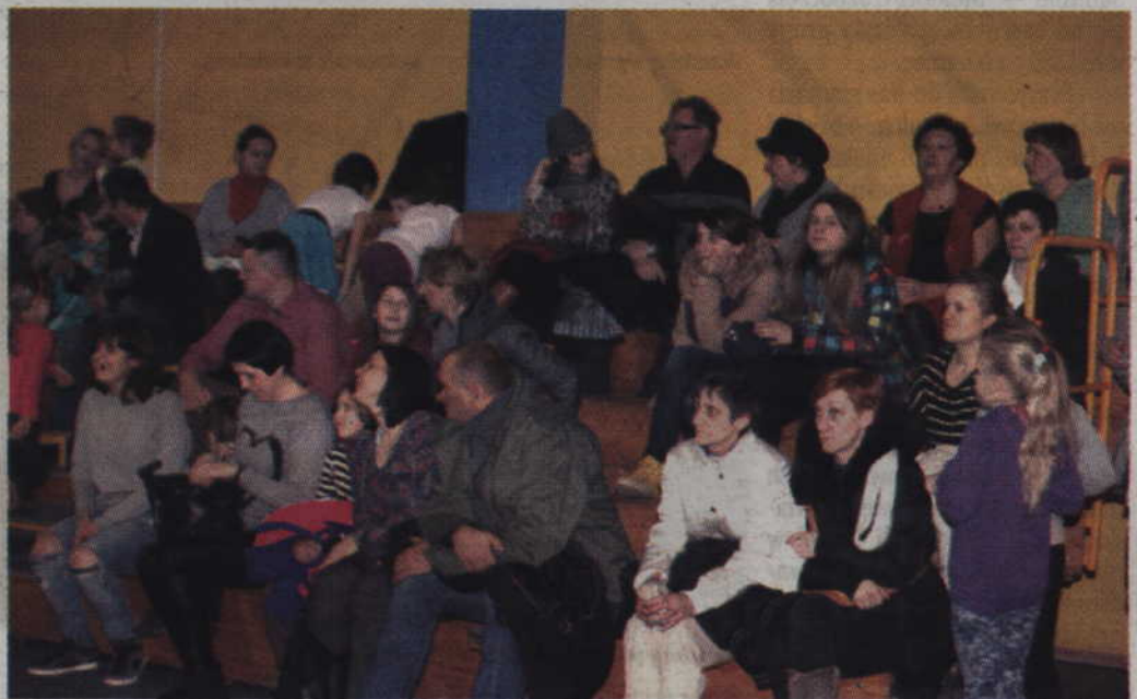
Publiczność bez przeszkód, zajmując miejsca na trybunach mogła uczestniczyć w zabawie.