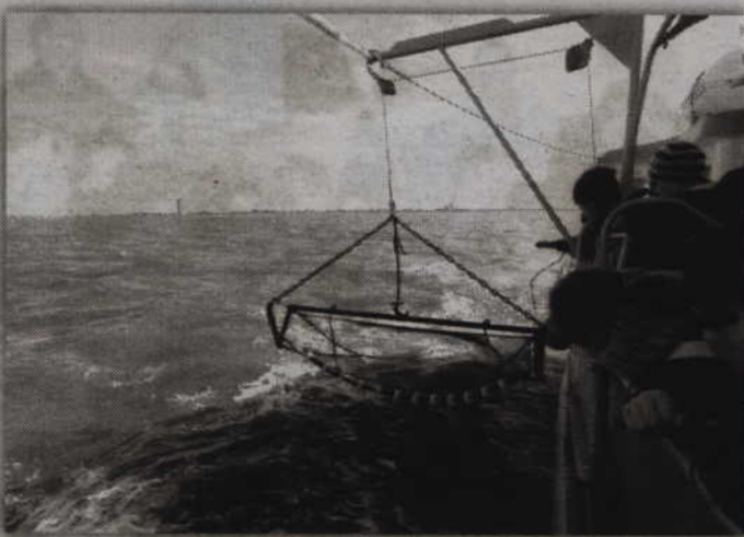
Efektowny połów krewetek na Morzu Północnym.

nia przy stole. Przy okazji uczniowie zwiedzili również Kwidzyn oraz katedrę, a dzień zakończyła natomiast wycieczka rowerowa do gospodarstwa agroturystycznego w Rakowcu.