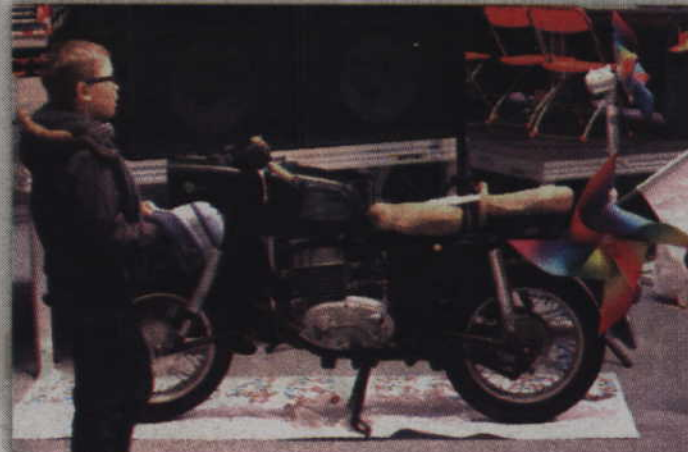
Podczas tegorocznego finału wylicytować można było m.in. motocykl, który wystąpił w filmie Jacka Borcucha „Nieulotne”.