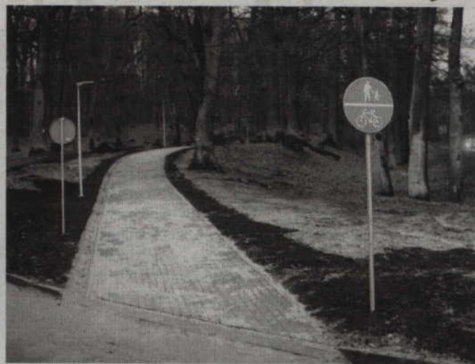
-Ze ścieżki można już korzystać - zapewnia wiceburmistrz Piotr Halagiera.

-W zasadzie wszystkie prace zostały już wykonane. Gotowe są nawierzchnia i oświetlenie. Pozostało jedynie zagospodarowanie terenu przy ścieżce. Teren musi zostać wyrównany. Posadzona zostanie tam trawa. Prace zostaną wykonane jak tylko pozwoli na to pogoda, ale ze ścieżki można już korzystać. Można jeździć po niej rowerem i można także spacerować.