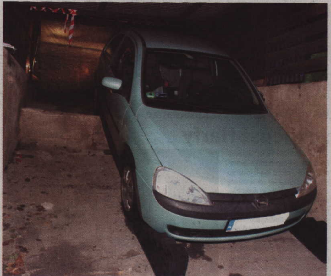
Zaparkowane auto stoczyło się do garażu przygniatając 58-letnią kobietę.