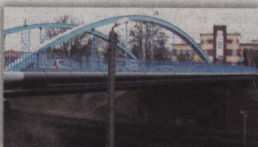
Prace modernizacyjne na wiadukcie odbędą się w okresie wakacyjnym.