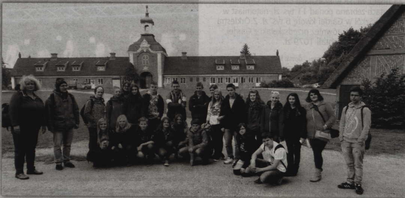
Uczestnicy wymiany podczas wizyty w skansenie w Kiekeberg.

Z racji tego, że tematem przewodnim ubiegłorocznej wymiany była „Kuchnia lokalna” w programie wizyty nie mogło zabraknąć dnia kulinarnego. Tego dnia młodzież odwiedziła ZSP nr 2 w Kwidzynie, gdzie wspólnie przygotowywano bezy, pierogi, hot-dogi, ciastka, drożdżówki oraz bułeczki. Podczas wspólnych zajęć uczniowie poznawali także zasady prawidłowego zachowa-