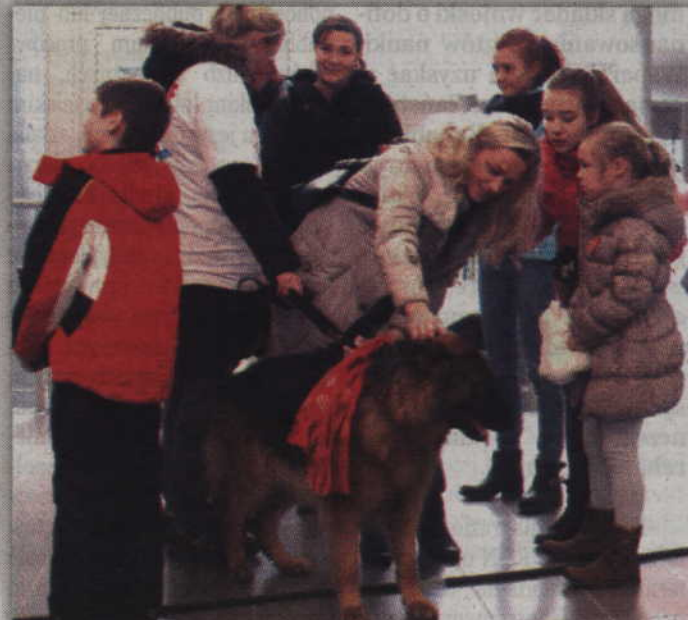
Każdy chciał choć przez chwilę pogłaskać Orkiestrowego psa.