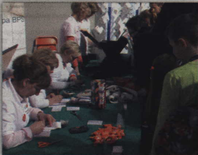
Pracownicy Powiślańskiego Banku Spółdzielczego w Kwidzynie liczą pieniądze zebrane przez wolontariuszy.

- Gdy rozpoczynaliśmy finał mieliśmy 137 przedmiotów przeznaczonych do licytacji, a w dniu finału przybywało nam jeszcze zazwyczaj 20-30 przedmiotów. Tym razem przekroczono liczbę 150 dodatko-