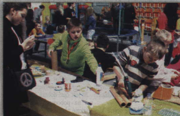
Dzieci podczas zabawy w kąciku Leonardo School Kwidzyn.