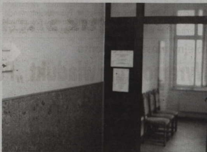
Ośrodek Interwencji Kryzysowej znajduje się na II piętrze budynku przy ul. Chopina 26 (dawny budynek policji).

-Do tej pory tylko jedna organizacja pozarządowa wyrażała chęć prowadzenia ośrodka. Pod koniec roku wpłynęły dwie oferty, w tym Fundacji Edukacji i Rozwoju „FLOW”, której oferta okazała się korzystniejsza. Mam nadzieję, że jakość świadczonych usług będzie bardzo dobra. Siedziba ośrodka mieści się w budynku przy ul. Chopina 26, w pomieszczeniach na drugim piętrze. Przypomnę, że ośrodek zapewnia profesjonalną pomoc osobom oraz rodzinom, które znalazły się w trudnej sytuacji kryzysowej. Ośrodek prowadzi już od 1 stycznia stałe dyżury in-