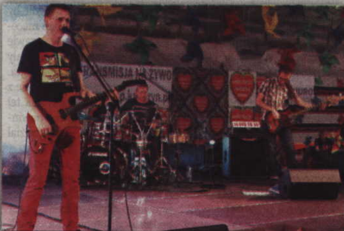
Gwiazdą kwidzyńskiego finału był zespół „11 Cover Group”.