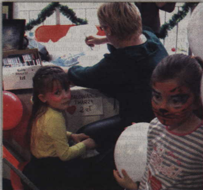
Najmłodsi mogli również skorzystać z tradycyjnego malowania twarzy.