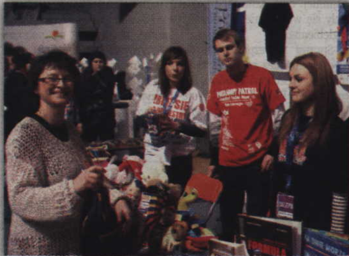
Mieszkańcy chętnie odwiedzali sklepik orkiestrowy.