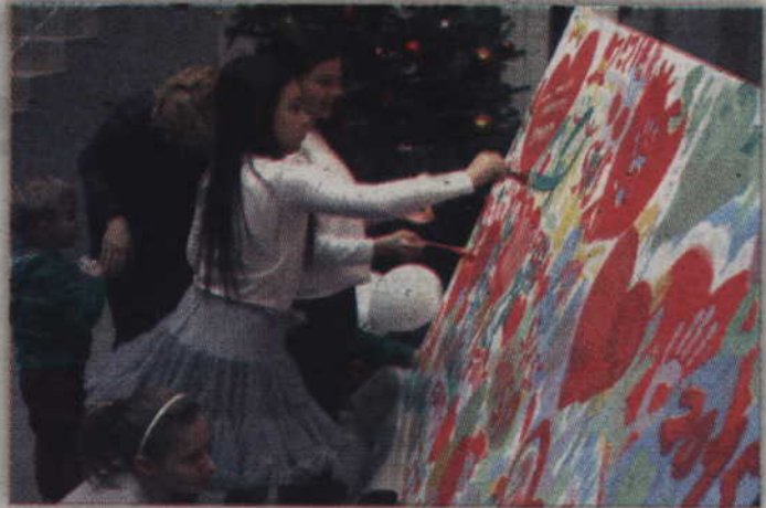
Chętni mogli chwycić za pędzel i współtworzyć wielkie orkiestrowe dzieło.