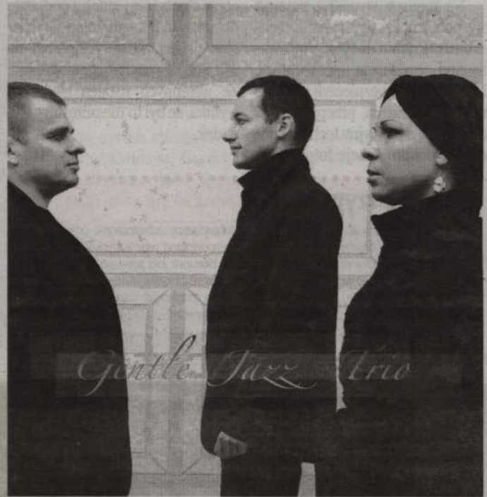
Wstęp na koncert kolęd „Gentle Jazz Trio” będzie możliwy wyłącznie za okazaniem bezpłatnej wejściówki.