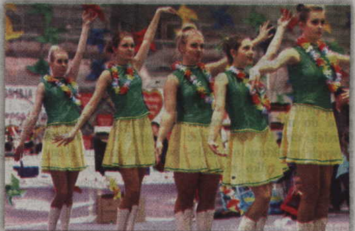
Efektowny pokaz kwidzyńskich mażoretek przykuł uwagę publiczności.