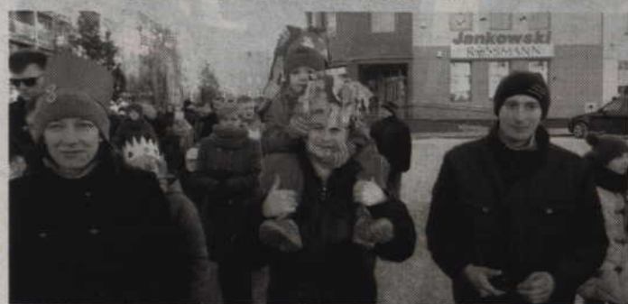
Prabuckie uczestniczący w uroczystościach Objawienia Pańskiego przystroili swoje głowy barwnymi koronami.

stek OSP. Warto również dodać, że do przygotowania uroczystości Trzech Króli włączył się również Ośrodek Jeździecki Marty,