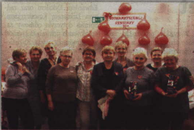
Orkiestrę wsparło również Stowarzyszenie „Seniorzy 50+”.