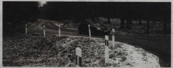
Drogowcy ustawili plastikowe słupki, aby zwiększyć bezpieczeństwo na tym odcinku.