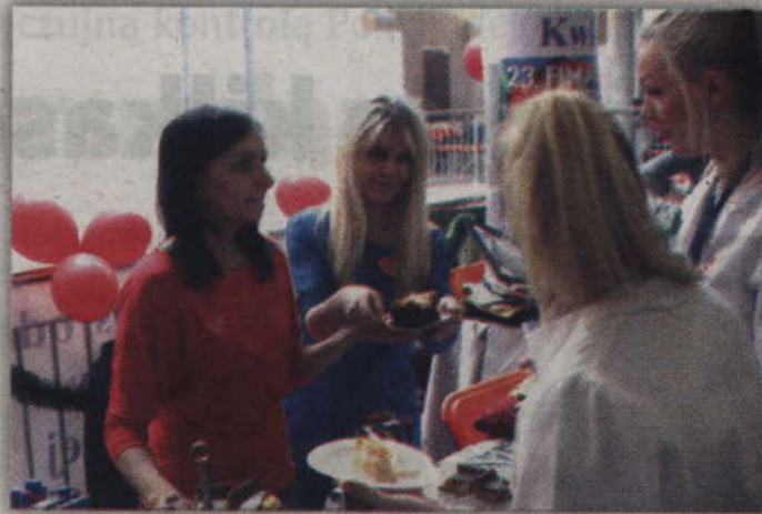
Kwidzyński MOPS serwował słodkości.