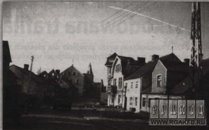
Gardeja, jeszcze przed zniszczeniem jej przez Rosjan, w roku 1945.

metrów dalej w stronę Trumiej. Niemcy mieli się bronić praktycznie do ostatniego człowieka. Według przekazów, za sprawą ataków na Rosjan stała doborowa jednostka SS osłaniająca ostatnie transporty ludności cywilnej uciekającej w stronę Kwidzyna.