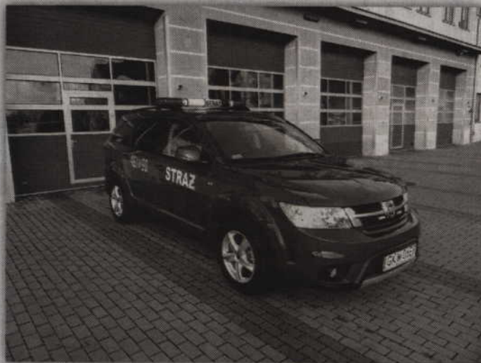
Dwa nowe samochody trafiły do Komendy Powiatowej Państwowej Straży Pożarnej w Kwidzynie. Pierwszy to średni samochód ratowniczo-gaśniczy, natomiast drugie auto to lekki samochód rozpoznawczo-ratowniczy.