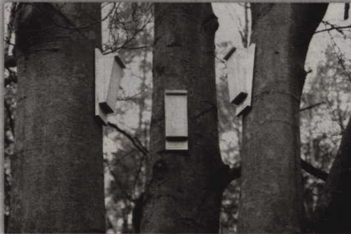
Budki lęgowe zostały zawieszane z myślą o nietoperzach.

- Budki nie są dziełem leśników i nie zostały rozwieszane na terenie lasów. Drzewa, gdzie zostały rozwieszane, rosnące w pobliżu drogi wojewódzkiej nr 532, należą do pasa drogowego. Tak więc pomysłodawcami tychże budek byli drogowcy. Chociaż budki wyglądają jak miejsca, gdzie mogą robić swoje gniazda leśne ptaki mają