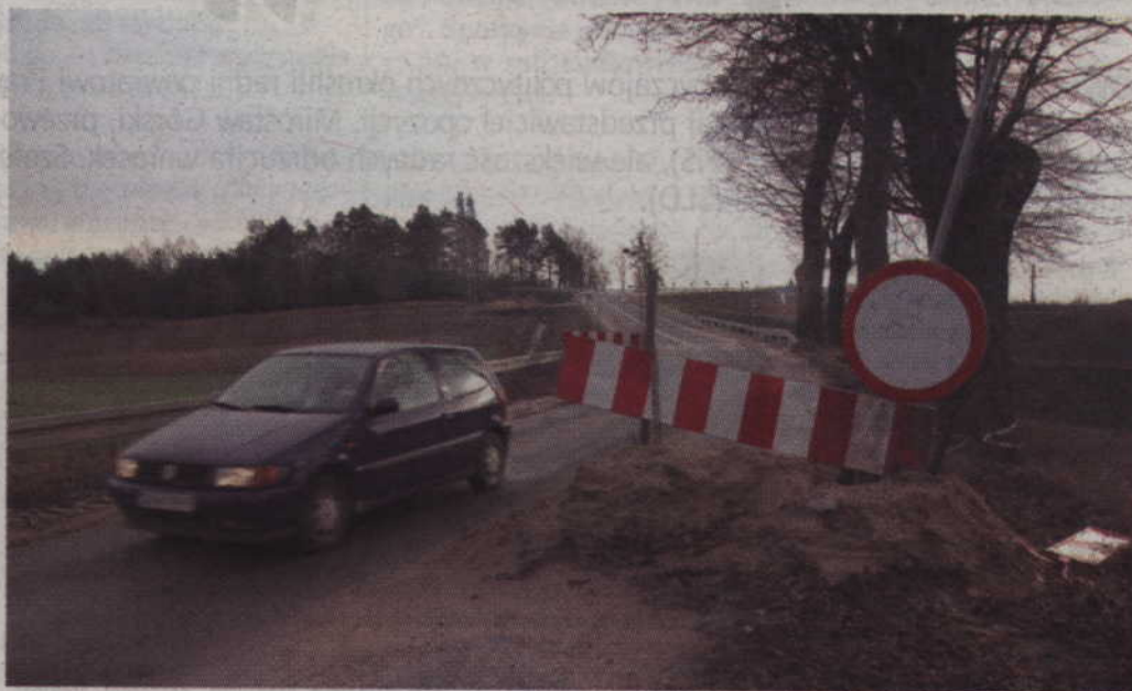
Wiadukt w Julianowie to cały czas teren budowy z zakazem wjazdu.

-Trakcja PRKiI wybudowała wiadukty w ciągu drogi wojewódz-