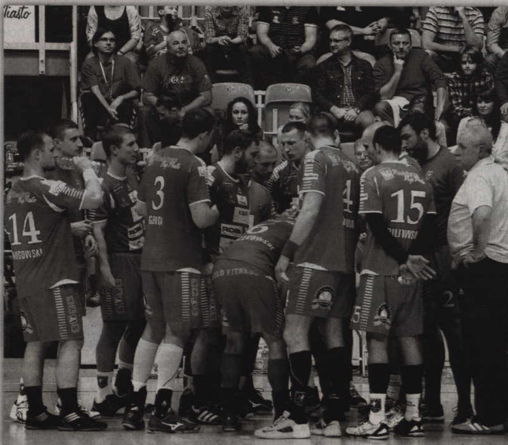
Kwidzynianie zajęli ostatecznie V miejsce w turnieju rozgrywanym w Rewalu.