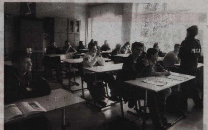
Policjantki rozmawiały z gimnazjalistami m.in. o odpowiedzialności za popełnione czyny przestępcze.

Policjantki zajmujące się prewencją kryminalną zostały zaproszone przez dyrekcję Gimnazjum nr 3 w Kwidzynie do przeprowadzenia w szkole zajęć informacyjno-prewencyjnych. Spotkania odbyły się w trzech grupach i uczestniczyli w nich gimnazjaliści z klas drugich. Policjantka zajmująca się problematyką przemocy i prewencją kryminalną omówiła konsekwencje zażywania przez młodzież środków odurzających, w tym dopalaczy. Przed-