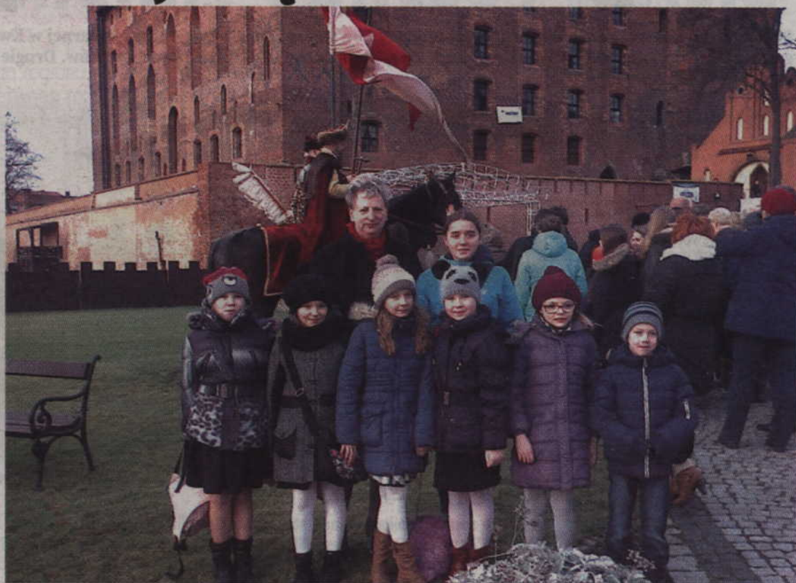
Zdjęcia do filmu reklamowego kręcono na zamku w Gniewie.