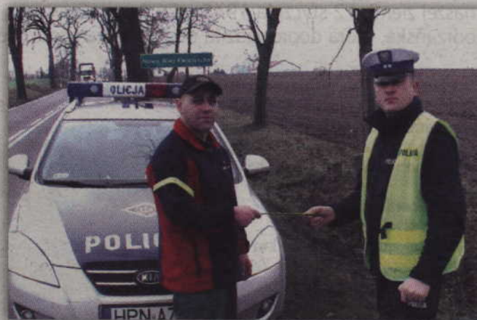
W trakcie policyjnej akcji funkcjonariusze przekazywali pieszym odblaski.

- Od 31 sierpnia ubiegłego roku obowiązuje przepis nakazujący noszenie odblasków wszystkim uczestnikom ruchu drogowego poruszającym się po zmroku, poza obszarem zabudowanym. Niestosowanie się do nowego przepisu, nakazującego