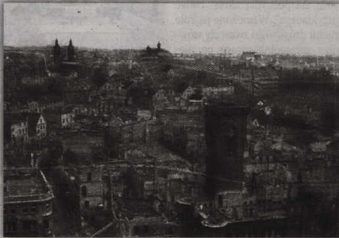
Zniszczony Kwidzyn z roku 1948 na zdjęciu Andrzeja Zakrzewskiego.

Kiedy w Kwidzynie spokojnie jeszcze czekali na rozkaz ewakuacji, Prabuty zostały już zajęte przez Rosjan. Stało się to w nocy 23 na 24 stycznia 1945 roku. W tym samym czasie rosyjskie czołgi widziane były także w okolicach Rakowca. Wycofujący się żołnierze niemieccy nie podejmowali jednak zdecydowanych prób oporu. Kierowali się na zachód w kierunku Wisły i tamtejszych mostów. Spalinali jednak gdzie to możliwe marsz Rosjan, aby mogli uciec ostatni cywile, a czasem nawet przygotowywali zasadzki. Jedną z nich miała miejsce między Łodygowem i Trumiejami. Według relacji świadka tamtych wydarzeń, jednego z pierwszych mieszkańców polskich już Kisielic, na dzisiejszej drodze wojewódzkiej nr 522, została zaatakowana rosyjska kolumna wojskowa. Po tem walki przeniosły się kilkaset