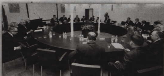
Decyzją koalicjantów opozycja znalazła się poza komisją rewizyjną rady powiatu.

Oprócz komisji rewizyjnej, powstałyby cztery komisje. W skali całej kadencji da to oszczędności w wysokości 220 tys. zł, tylko na samym uposażeniu, a organizacyjnie