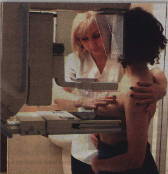
Mammografia polega na zrobieniu 4 zdjęć rentgenowskich, dwóch projekcji każdej piersi – informują organizatorzy.