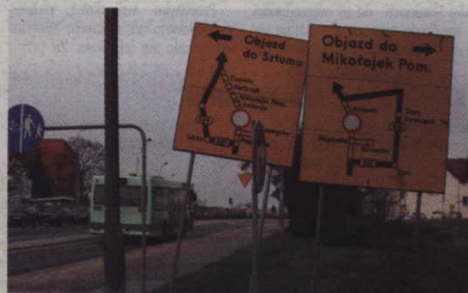
Znaki informują o trwającej przebudowie drogi wojewódzkiej nr 522.