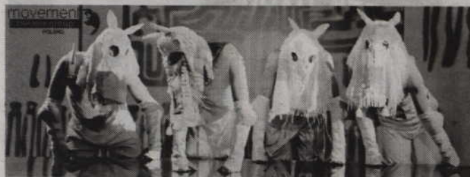
Prapremiera „Kwadratury konia” odbyła się podczas ubiegłorocznego festiwalu „Animo” w Kwidzynie.