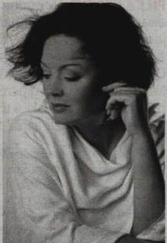
Hanna Banaszak wystąpi w Kwidzynie już 6 lutego.

Hanna Banaszak swoją drogę artystyczną rozpoczęła pod koniec lat 70. Często podkreśla, że w pracy interesuje ją różnorodność i wiarygodność każdej kolejnej odsłony. Już na samym początku zainteresowali się nią współcześni poeci i kompozytorzy. Byli wśród nich m.in.: Jerzy Wasowski, Andrzej Trzaskowski, Jonasz Kofta, Jeremi Przybora i Jerzy „Duduś” Matuszkiewicz. Nadal współpracuje z czołową polskich twórców. Należą do nich: Jerzy Satański, Jan „Kanty” Pawłuskiewicz, Janusz Strobel, Zbigniew Preisner, Józef Baran i inni. Swoją interpretacją współczesną poezję Jana Kochanowskiego, a także wykonuje wiersze J. Brodzkiego, W. Szymborskiej czy J. Kaczmarskiego. Zmierzyła się również wokalnie z muzyką Mozarta, Vivaldiego, Mangione, Metheny-ego, Davis-a, Gershwin i Ellingtona.