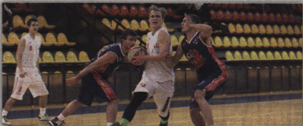
Zawodnicy MTS Basket Kwidzyn znaleźli się w finale A i powalczą o awans do II ligi.

KOSZYKÓWKA. A jednak MTS Basket Kwidzyn powalczą o awans do II ligi mężczyzn. Po zakończonym sezonie zasadniczym kwidzińskie dziewczyny zajęły ostatecznie trzecie miejsce w swojej grupie i awansowały do kolejnej fazy z trzeciego miejsca, wyprzedzając tym samym gdańską Politechnikę. Awans do tych rozgrywek wywalczyły również ekipy Trusa Elbląg i Jedynki Pelplin.