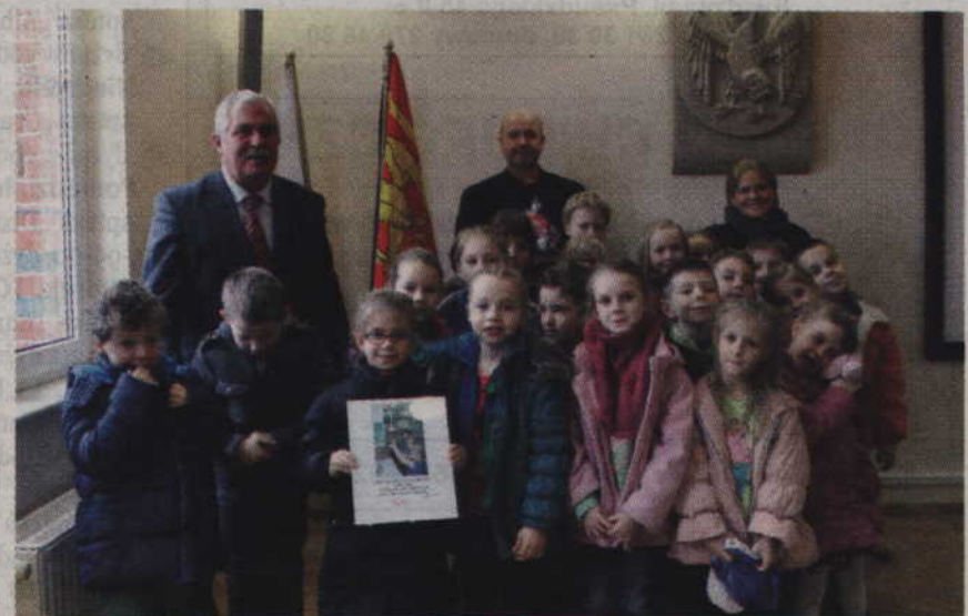
Młodsi realizatorzy projektu spotkali się z Andrzejem Fortuną, wicestarostą kwidzyńskim i Andrzejem Wróblewiczem, pełnomocnikiem starosty do spraw architektury, budownictwa i ochrony środowiska.

-Byłem zaskoczony, gdy do mojego gabinetu przyszli uczniowie i zapoznali mnie ze zrealizowanym przez siebie projektem. To pierwsza klasa w naszym powiecie, z własnym gniazdkiem. Dzieci wraz ze swoją nauczycielką zrealizowały nie tylko znakomity projekt, ale także pierwszy w ich życiu biznes. Zebrały przecież 500 kg makulatury i ze sprzedaży zakupiły panel słoneczny, dzięki któremu mogą ładować akumulatory swoich telefonów komórkowych, nie zużywając energii z sieci,