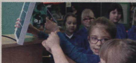
Uczniowie klasy IA Szkoły Podstawowej nr 6 w Kwidzynie, pod kierunkiem nauczycielki Zofii Cieślakowskiej, uruchomili pierwsze w powiecie kwidzyńskim eko-gniazdko, dzięki któremu mogą ładować akumulatory telefonów komórkowych za darmo.