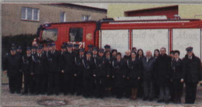
Uczestnicy uroczystości przy nowym aucie ratowniczo-pożarniczym i zmodernizowanej remizie.