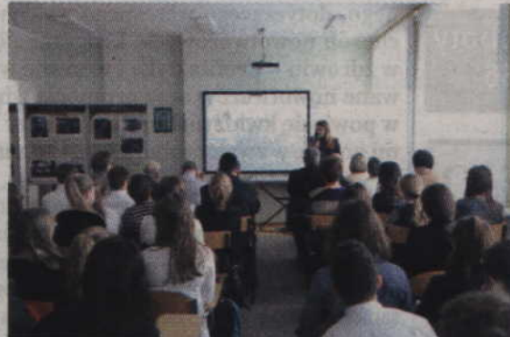
Wystawa została zorganizowana w Izbie Pamięci Gimnazjum nr 2.

zentowano kilkadziesiąt fotogramów przedstawiających historię 5 Brygady Wileńskiej AK z jej legendarnym dowódcą majorem Zygmuntem Szenadzielarzem „Łupaszka”. Większość fotografii dotyczyła działalności 5 Brygady na Pomorzu Gdańskim, Powiślu, Kociewiu, w Borach Tucholskich. Na zdjęciach umieszczono także biografie dowódców poszczególnych szwadronów, z których większość została w bestialski sposób zamordowana przez komunistów. Zaprezentowano również szereg dokumentów znajdujących się w zbiorach IPN, m.in. wyrok śmierci na Danutę Siedzikówną „Inkę” czy słynną, kolportowaną także w 1946 r. w