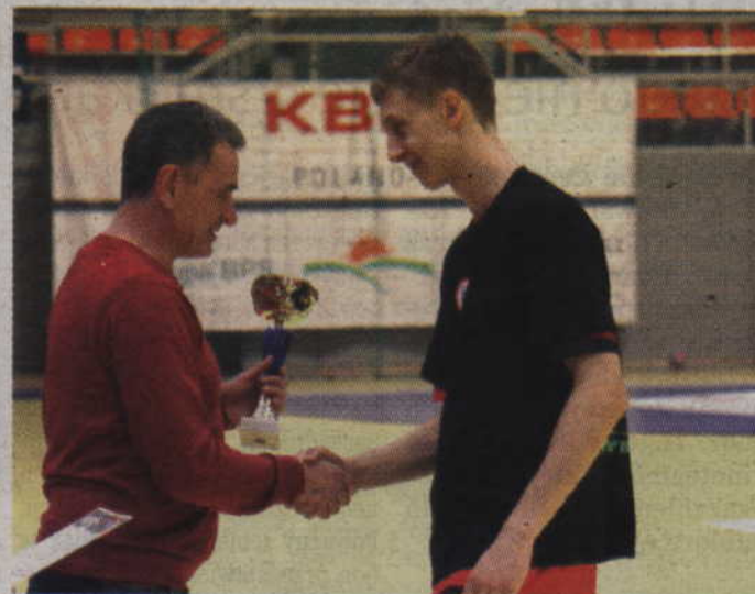
Prezes Pomorskiego Związku Piłki Ręcznej nagradza kwidzyński zespół za zdobycie I miejsca w 1/8 finału MP.

-Uważam, że mamy jeszcze głębokie rezerwy i możemy grać