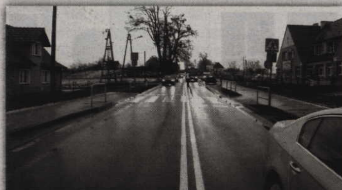
Do potrącenia doszło na przejściu dla pieszych w Tychnowach.

TYCHNOWY (GM. KWIDZYN). Kierowca forda focusa potrącił trzynastolatkę przebiegającą przez przejście dla pieszych. Dziewczynka została przetransportowana helikopterem do szpitala w Gdańsku.