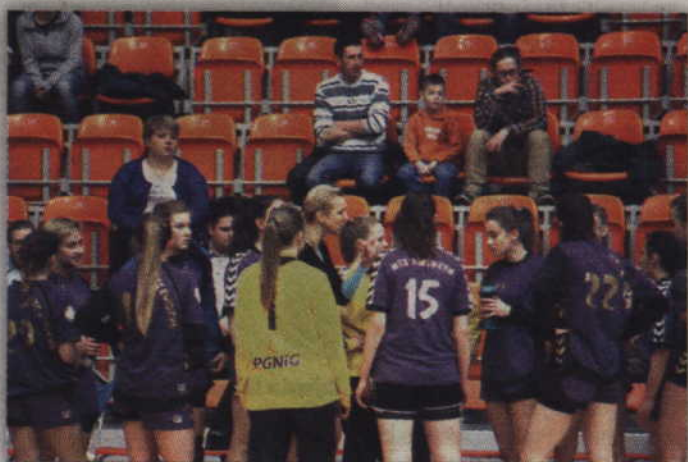
W najbliższy weekend juniorki MTS Kwidzyn będą walczyć o awans do półfinałów Mistrzostw Polski.

W 1/8 finału, który również odbył się w Kwidzynie, kwidzińskie dziewczyny dość pewnie wygrały wszystkie spotkania. Najpierw ograły Sprintera Lublin 31:13, a następnie rozgromiły AZS EUST Radom 46:23, w efekcie zajęły I miejsce w turnieju i mogły być pewne gry w ćwierćfinale. Tym razem może jednak nie być tak łatwo. Najtrudniejszym przeciwnikiem kwidzińskiego zespołu wydaje się MKS Lublin, który awansował do ćwierćfinału wygrywając turniej w Łomży. Lublinianki ograły w nim Gościbę Sulikowice 29:25 (14:11) oraz Dwójkę Łomża 31:28 (14:14).