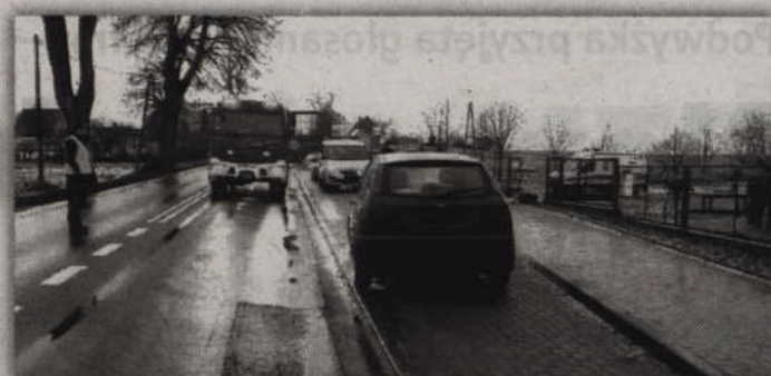
58-letni kierowca forda focusa był trzeźwy.

Do zdarzenia doszło w miniony czwartek - 29 stycznia, kilka minut przed godziną 7.00. Dyżurny kwidzińskiej jednostki skierował patrol ruchu drogowego na drogę K-55 w miejscowości Tychnowy (gm. Kwidzyn), gdzie miało dojść do potrącenia 13-letniej dziewczynki. Jak ustalili policjanci pracujący na miejscu zdarzenia do wypadku doszło na znajdującym się w tym miejscu przejściu dla pieszych.