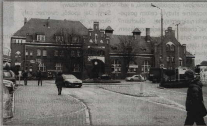
Zagospodarowanie budynku dworca i terenu przy torach to jeden z projektów o które będzie zabiegał kwidzyński MOF.

Komitet zajmuje się między innymi opiniowaniem kryteriów oceny projektów oraz analizowaniem rezultatów realizacji RPO. Utworzenie Miejskich Obszarów Funkcjonalnych było warunkiem ubiegania się gmin o pieniądze unijne. W województwie pomorskim powstało siedem Miejskich Obszarów Funkcjonalnych. Miejski Obszar Funkcjonalny tworzą w powiecie kwidzyńskim: miasto Kwidzyn oraz gminy Kwidzyn, Gardeja i Sadlinki. W ramach kwidzyńskiego MOF samorządy będą zabiegały o dofinansowanie budowy kompostowni dynamicz-