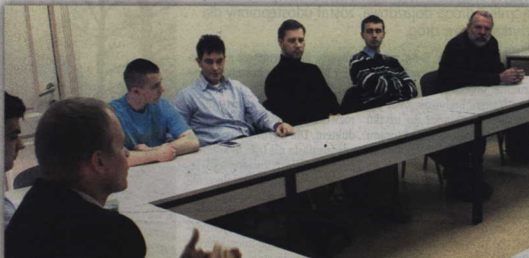
Członkowie KORWiN Kwidzyn podczas zwołanej konferencji prasowej.