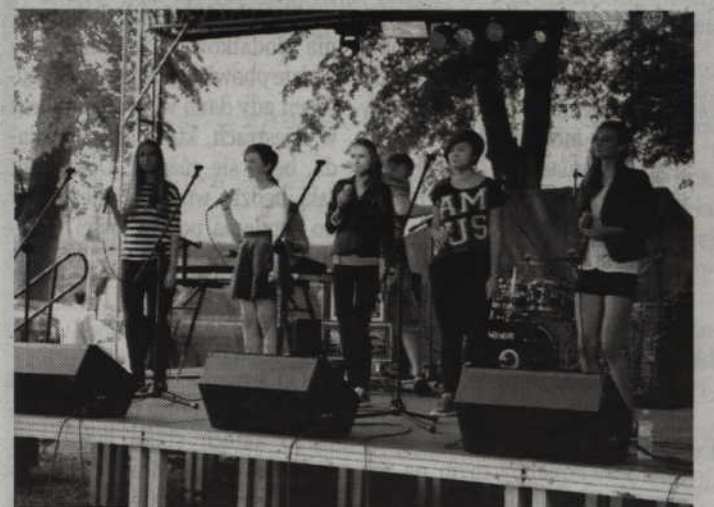
Grupa „Pas de nom” wykona utwory niezwykłych artystów polskiej sceny muzycznej.