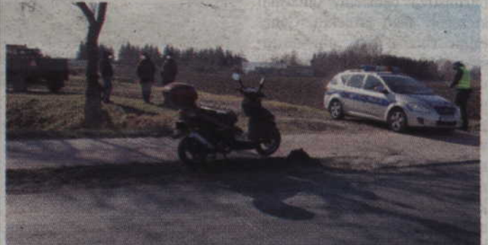
Kierujący motocyklem nie ustąpił pierwszeństwa przejazdu i uderzył w bok skręcającego ciągnika.

-Motorowerzysta wraz z 69-letnią pasażerką uderzył w bok jadącego ciągnika - wyjaśnia Anna Filar, rzecznik prasowy Komendy Powiatowej Policji w Kwidzynie. -W wyniku zdarzenia kierowca i pasażerka jednoślada, z obrażeniami ciała, zostali przewiezieni do kwidzyńskiego szpitala. Badanie na trzeźwość wykazało, że wszyscy uczestnicy zdarzenia byli trzeźwi. Teraz kwidzyńscy policjanci ustalają dokładne okoliczności wypadku. (fox)