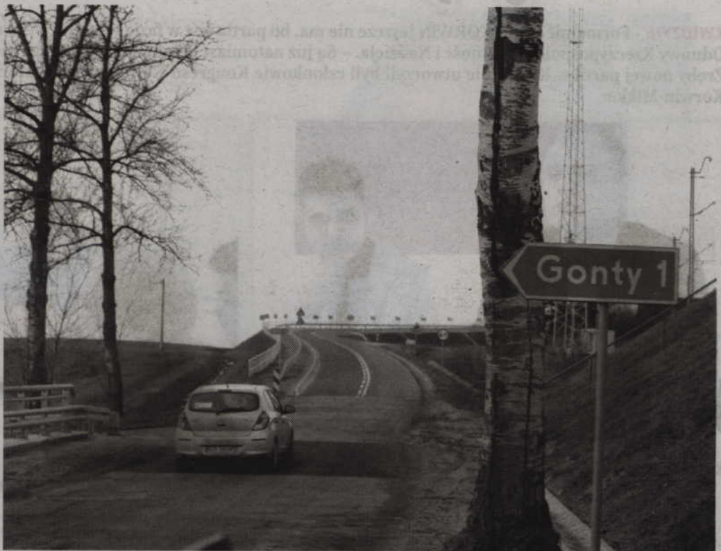
Wiadukt w Julianowie jest już otwarty dla kierowców.

–Remont drogi wojewódzkiej to bardzo miła wiadomość, ale niestety związana z poważnymi utrudnieniami. Chcielibyśmy, aby odcinek drogi od Kamiennie do Prabuty był remontowy