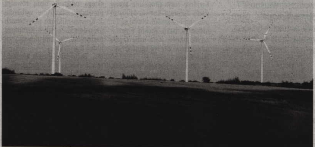
Budowa wiatraków, które miały pojawić się w Pawłowie, została wstrzymana z uwagi na brak raportu o oddziaływaniu inwestycji na lokalne środowisko.

–Prawdą jest, że podjęliśmy decyzję o czasowym zawieszeniu postępowania. Firma zainteresowana budową farmy wiatrowej nie przedstawiła kompletnego dokumentów, w tym bardzo ważnego opracowania jakim