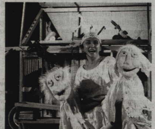
Spektakl przygotowany przez Teatr Małe Mi zobaczyć będzie można już w najbliższy piątek.

Przedstawienie powstało na podstawie ludo-