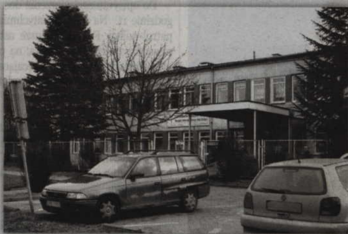
Kapitalny remont budynku zakończyć się ma w pierwszym kwartale przyszłego roku.

- Podczas kolejnego kolegium burmistrza będziemy omawiali szczegóły tego projektu. Generalnie chodzi o to, aby dostosować cały obiekt do wymogów unijnych. Dotyczy to szczególnie wymogów sanitarnych. Musi to zrobić każdy zakład opieki zdrowotnej. W budynku przebudowane zostaną pomieszczenia, jednak nie będziemy zmieniali ścian konstrukcyjnych. Wszystkie usługi świadczone przez ośrodek będą realizowane na parterze. Nie będzie więc potrzeby budowania wind. Na piętrze będą mogły znajdować się pomieszczenia, które dotyczą administracji. Będą