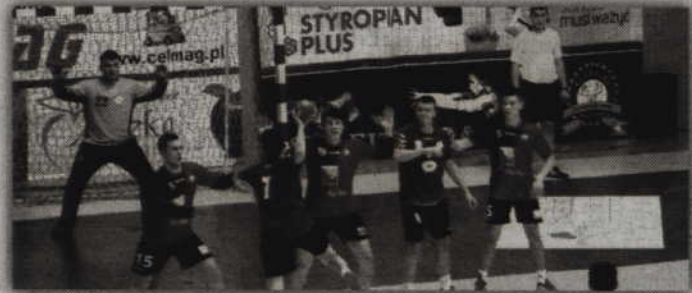
Już w najbliższy piątek zawodnicy MTS Kwidzyn rozpoczną walkę o awans do finału MP juniorów w piłce ręcznej.

Pozostałe dwie ekipy awansowały do turnieju półfinałowego z drugich miejsc w fazie ćwierćfinałowej. Pawda Zamość była druga