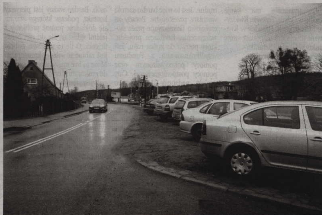
W dni, kiedy odbywają się sesje, kierowcy parkują swoje samochody m.in. na trawniku wzdłuż ulicy Kwidzyńskiej.

SADLINKI. W centrum Sadlinek, w najbliższym sąsiedztwie urzędu gminy, brakuje miejsc parkingowych. Można to dostrzec szczególnie w te dni, kiedy odbywają się posiedzenia rady gminy czy też spotkania z sołtysami. W budżecie na rok 2015 zaplanowano jednak rozbudowę istniejącego parkingu. Za 220 tys. zł. gmina chce wybudować dodatkowe 22 miejsca parkingowe.