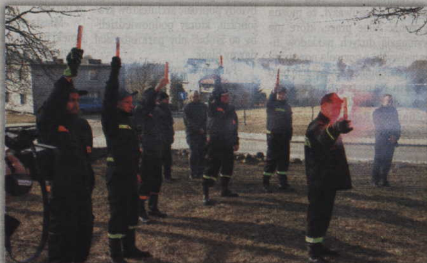
Efektowna oprawa apelu poległych przygotowana przez gardejskich strażaków.