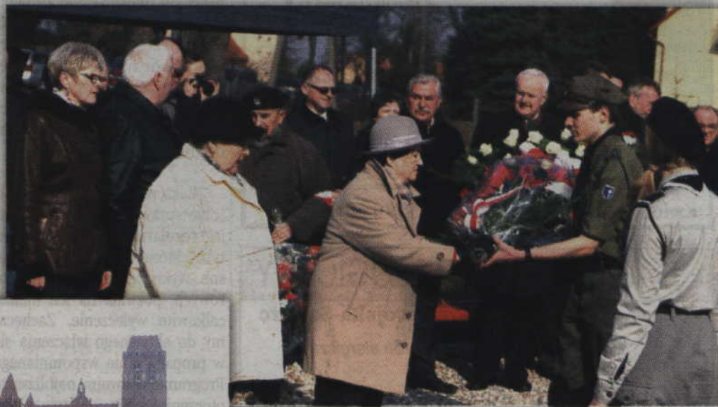
Wiązanki kwiatów złożono pod tablicą poświęconą Konfederacji Obrony Wiary i Ojczyzny.

Kontynuacją uroczystości powiatowych było złożenie kwiatów pod tablicą pamięci Organizacji Młodzieży Demokratyczno-Katolickiej, znajdującej się na budynku kwidzyńskiego I Liceum Ogólnokształcącego. Ostatnim powiatowym Dniem Pamięci „Żołnierzy Wyklętych” była natomiast uroczysta Msza św. sprawowana w kwidzyńskiej Katedrze. (fox)