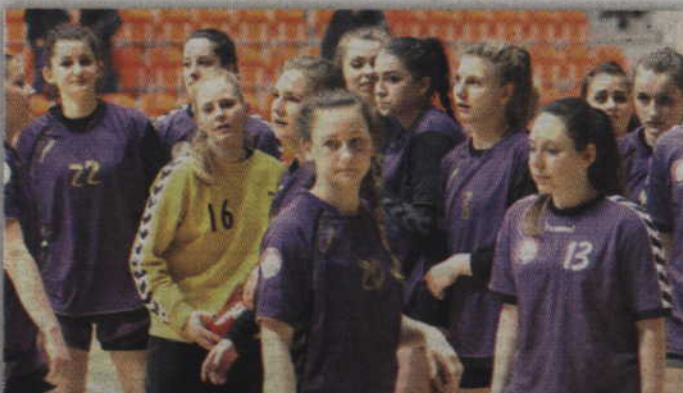
Juniorki MTS Kwidzyn powalczą o medal mistrzostw Polski.