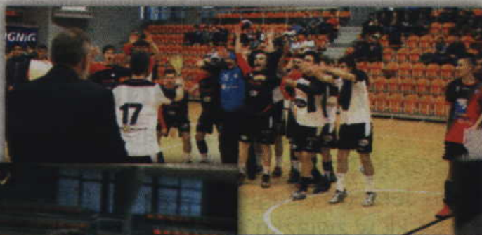
I miejsce w kwidzyńskim półfinale wywalczyła Siódmka-Mieź Legnica.