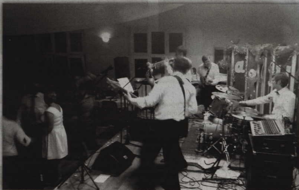
Mieszkańcy bawili się przy dźwiękach zespołu „Witek Band” z Malborka.