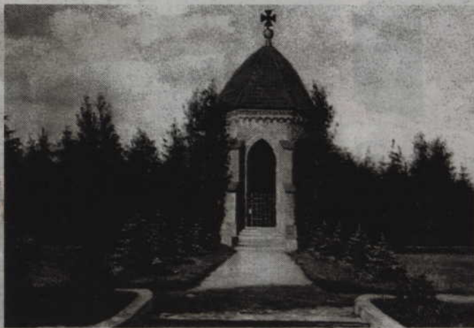
Od 1925 roku w parku stał pomnik bohaterów, którzy zginęli podczas I wojny światowej.