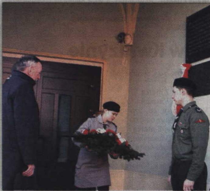
Delegacje złożyły również kwiaty pod tablicą pamięci Organizacji Młodzieży Demokratyczno-Katolickiej.