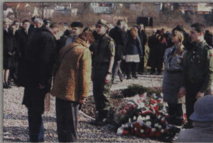
Cześć żołnierzom niezłomnym oddali samorządowcy z całego powiatu.