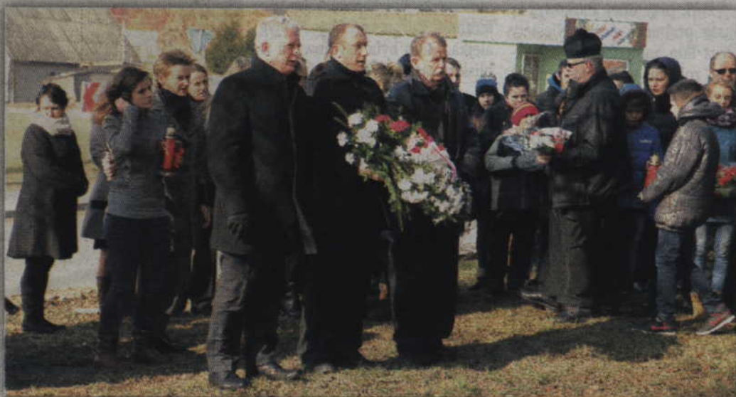
Kwiaty pod tablicą poświęconą walczącym za Polskę złożyła delegacja rady gminy Gardeja.

Organizatorzy zaprezentowali publiczności również film fabularny o obronie Grodna we wrześniu 1939 roku. To mało znany epizod w najnowszej historii Polski. Kilka tysięcy polskich żołnierzy, policjantów, ludności cywilnej