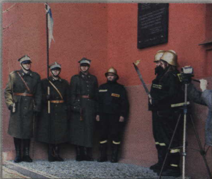
Gardejską uroczystość uświetnili ułani ze Stowarzyszenia Kwidzińskiego Szwadronu Kawalerii im. 6 Pułku Ułanów Kaniowskich.