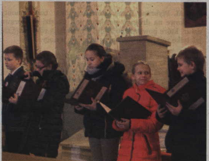
Specjalny program poświęcony żołnierzom wyklętym przygotowali uczniowie ze szkoły w Janowie.

-Ten ból jest naprawdę przejmujący, gdy czytamy o torturach, o tym jak łamano ludzi, jak łama-