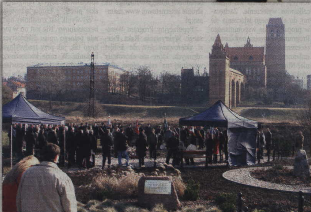
Uroczystości rozpoczęły się na skwerze w Marezie (gm. Kwidzyn).