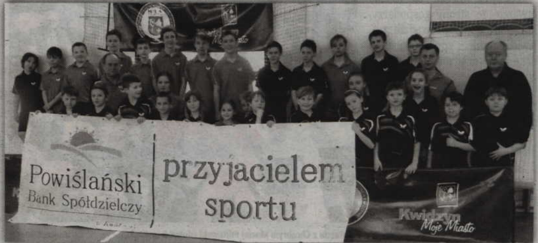
Tenisści MTS Kwidzyn od czterech lat szlifują formę na dochodzeniowych zimowiskach sportowych.

Tydzień po zakończeniu intensywnych przygotowań zawodników MTS do lat 12 czekał pierwszy egzamin w postaci startu w III Wojewódzkim Turnieju Klasyfikacyjnym młodzików. W gdańskiej hali MRKS swoje umiejętności zaprezentowało 21 zawodników i zawodniczek reprezentujących barwy kwidzińskiego klubu.