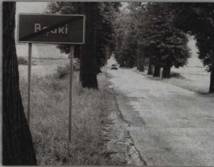
Modernizacja drogi Bąki - Wandowo potrwa około 3 miesięcy.

Samorząd powiatu planuje rozpoczęcie prac najpóźniej w