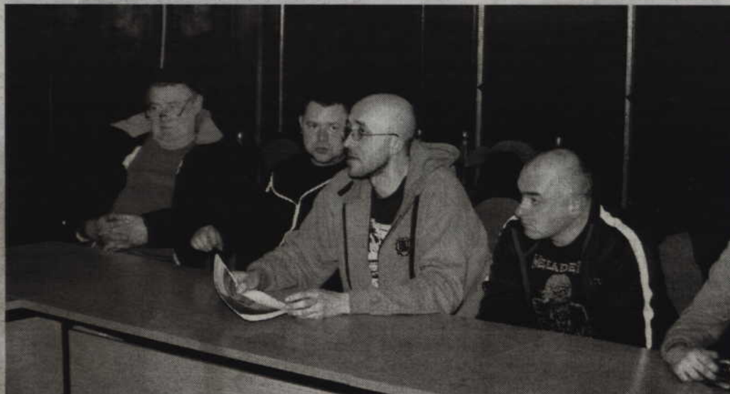
Uczestnicy spotkania byli w jednym zgodni - w parku nie będzie betonu.

Obecny na spotkaniu burmistrz Marek Szulc nie ukrywał,