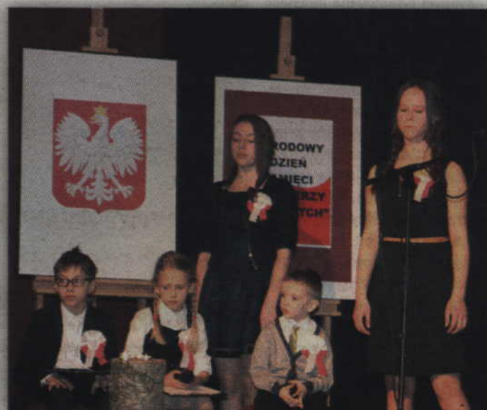
Program „Zachowali się jak trzeba” przygotowany przez uczniów z Cygan i Gardel zakończył obchody pamięci o żołnierzach niezłomnych.