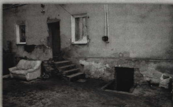
Radni dopytywali czy rodzina 27-letniej kobiety nie powinna zostać przeniesiona w inne miejsce. Wraz dziećmi, matką i braćmi kobieta mieszkała na 30 m2.

- To jest porażka nas wszystkich, oświaty, służby zdrowia, radnych, sołtysów. Od wielu lat, od kiedy pracuję, może pięciu radnych zainteresowało się swoimi wyborcami. Nigdy nikt nie przychodził, nie zgłaszał o takich problemach. To nie jest tylko nasza rola, ale nas wszystkich, sąsiadów, krewnych. Jako ośrodek pomocy społecznej uważam, że zrobiliśmy