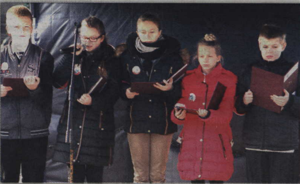
Specjalny program poświęcony Żołnierzom Wyklętym przygotowali uczniowie ze Szkoły Podstawowej w Janowie.