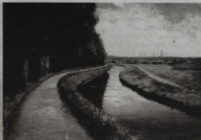
Tak wyglądała Młynówka i biegnąca przy niej parkowa aleja w latach trzydziestych XX wieku.