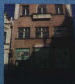
Tczew, Pl. Hallera 6