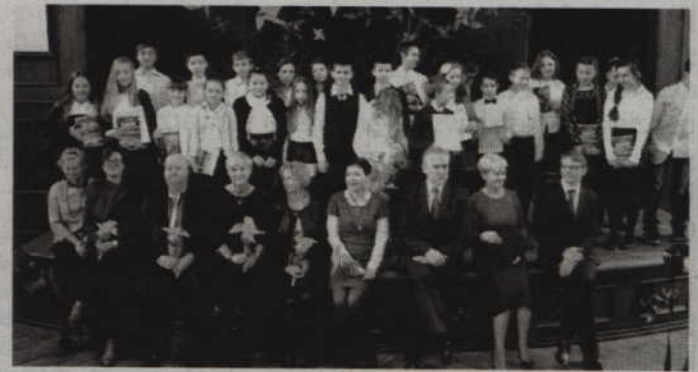
Uczestnicy tegoroczego święta na wspólnej fotografii.

Rada Rodziców ufundowała również nagrody dla klas biorą-