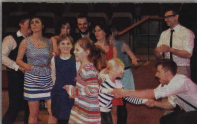
Wspólna zabawa podczas koncertu.