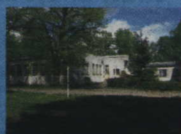
Tczew, ul. Targowa 1