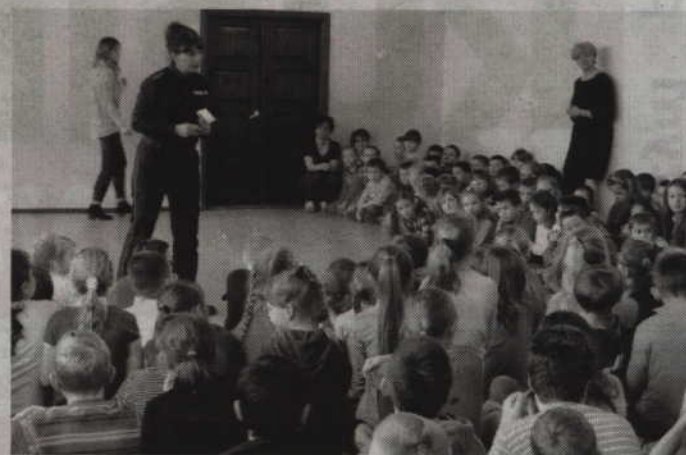
Policjantki rozmawiały m.in. o odpowiedzialności za popełnione czyny przestępcze.

-Uczniowie dowiedzieli się jaką ponoszą odpowiedzialność prawną za przejawianie zachowań, które wyczerpują znamiona demoralizacji, a także gdzie mogą szukać pomocy w przypadku stania się ofiarą przemocy np. w sieci - wy-