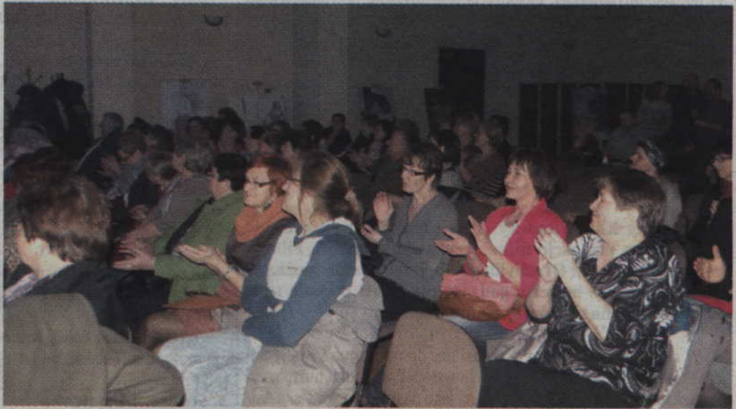
Sala GOK wypełniła się do ostatniego miejsca.

tował prawie godzinny występ. Koncert wyraźnie spodobał się mieszkańcom, bowiem występującym podziękowano owacjami na stojąco. Jednak nie był to koniec atrakcji przygotowanych przez GOK. „O kobietach i mi-