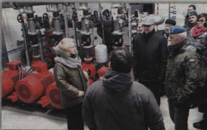
Beata Oczkiewicz wiceminister obrony narodowej w czasie wizyty w składzie paliwowym w Gardziej Jamach.

GARDEJA, JAMY. Polska armia modernizuje się na potęgę. Nowy sprzęt wojskowy czy remonty infrastruktury koszarowej to tylko pierwsze z brzegu przykłady mówiące o wzmocnieniu obronności kraju. Do pozytywnych przykładów modernizacji infrastruktury wojskowej można zaliczyć generalny remont składów paliwowych w Jamach koło Gardeji. Za 96 mln. zł. stworzono nowoczesną bazę paliwową.