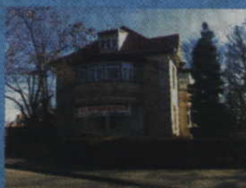
Tczew, ul. Kołłątaja 5

(83-110), ul. Piaskowa 2, I piętro, pokój 129, tel. 58 77-34-853.