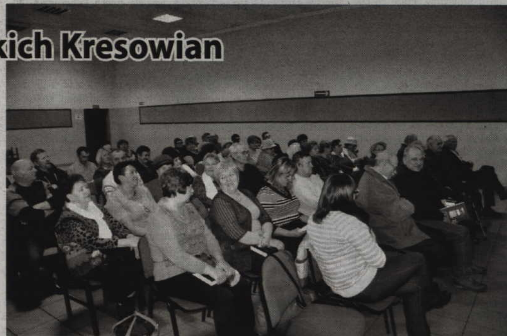
Na pierwsze spotkanie promocyjne wydanej publikacji przyszło kilkadziesiąt osób.

Promocja tej wyjątkowej publikacji rozpoczęła się 5 marca. Natomiast w najbliższy piątek, 13 marca o godzinie 11, w Prabuckim Centrum Kultury i Sportu rozpocznie się specjalna konferencja kresowa promująca książkę pt. „Wspomnienia prabuckich Kresowian”. W pro-