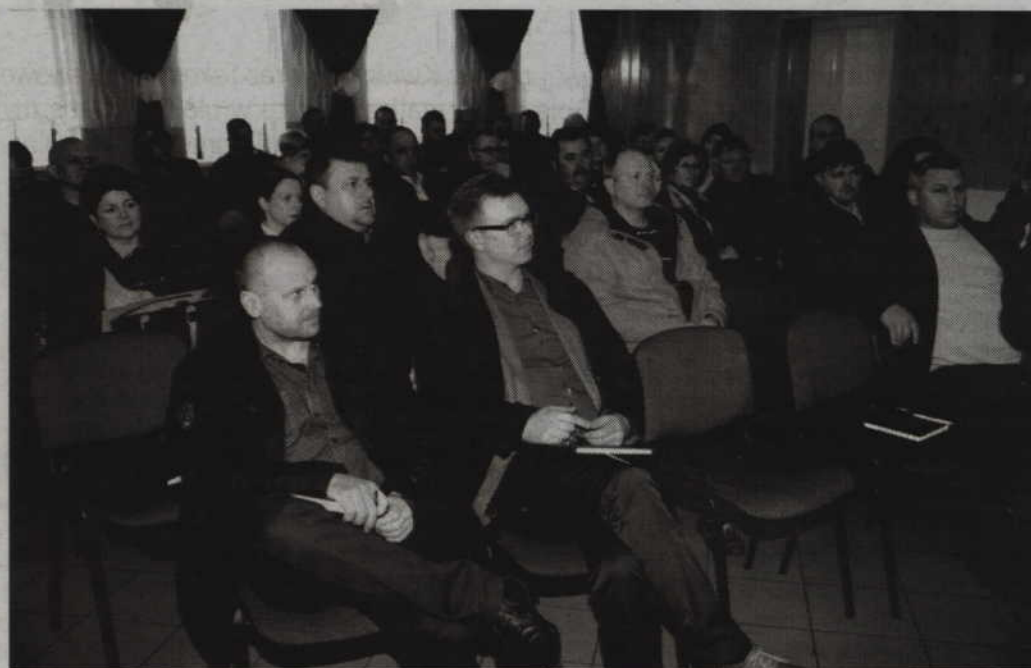
W spotkaniu w Bronisławowie wzięli udział nie tylko sołtysi ale także członkowie rad sołeckich i radni.

-Nie chcemy robić niczego na siłę. W naszej gminie fundusz sołecki nie jest wydzielony i my jako radni mamy czas do końca marca, aby taki fundusz wydzielić. Zaproponowaliśmy sołtysom z gminy, aby napisali do rady