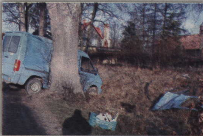
Jadący po łuku drogi volkswagen wpadł w poślizg i uderzył w przydrożne drzewo.

- Kierowca samochodu, 65-letni mieszkaniec Kwidzyna, był trzeźwy i nie doznał żadnych obrażeń – dodaje rzecznik KPP Kwidzyn. -Pracujący na