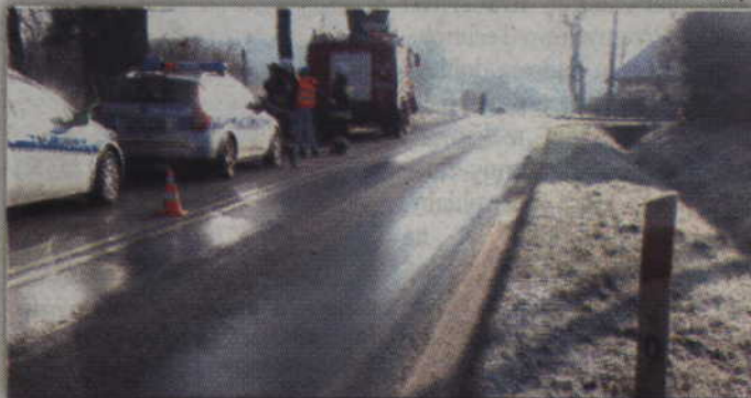
Pomocy poszkodowanym udzielali m.in. policjanci oraz strażacy.