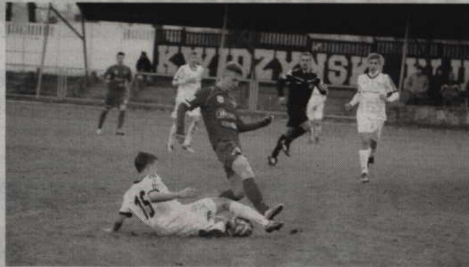
Olimpia Grudziądz przegrała na kwidzyńskim stadionie 0:1.