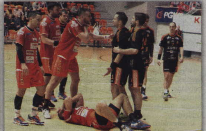
W meczu nie brakowało ostrych zagrań. W dwóch przypadkach sędzia ukarał graczy Zagłębia czerwonymi kartkami.