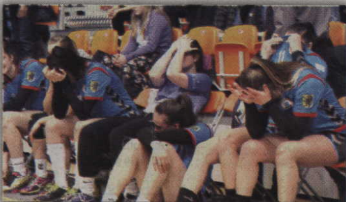
Po finałowej porażce kwidzynianki długo nie mogły dojść do siebie.

Turniej finałowy mistrzostw Polski juniorek rozgrywany w kwidzyńskiej hali przy ul. Wiejskiej rozpoczął się dla kwidzynianek od starcia z Varsovią Warszawa. Ku wielkiej radości kibiców kwidzynianki zaczęły od iscie mocnego uderzenia, bowiem po pierwszych 6 minutach prowadziły już 5:0! Dopiero wówczas swoją niemoc przełamały piłkarki z Warszawy, które po trafieniu Szubińskiej zdobyły swoją pierwszą bramkę w tym spotkaniu. Gospodynie jednak nie zważały