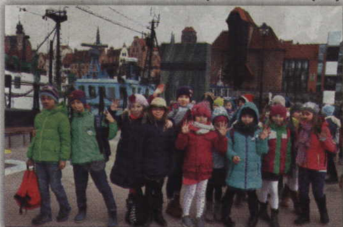
Klasa II b podczas zwiedzania Gdańska.