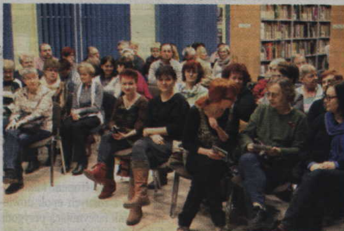
Publiczność czekająca na występ artystki.

Podczas koncertu artystka zaśpiewała znane standardy jazzowe, takie jak np. „I got Rhythm”, a także utwory gospel. Nie zabrakło także największych hi-