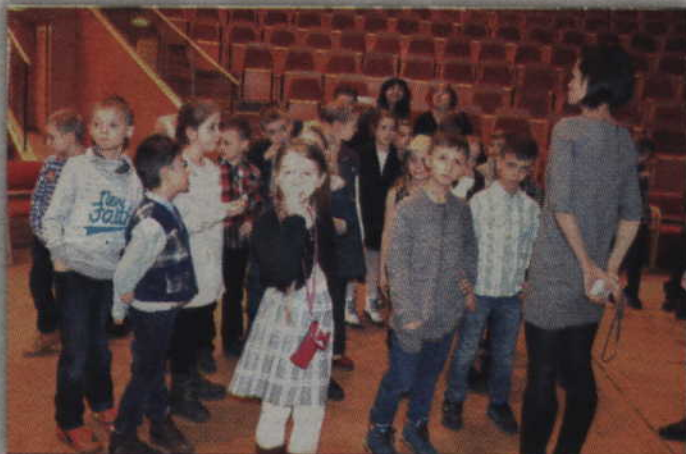
Dzieci podczas wizyty w filharmonii.

W pierwszym etapie konkursu „My na Pomorzu” wyróżnione zostały dwie grupy z powiatu kwidzińskiego. Są to: klasa II b ze