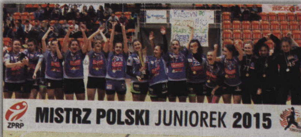
Radości nie ukrywały natomiast złote piłkarki Ruchu.