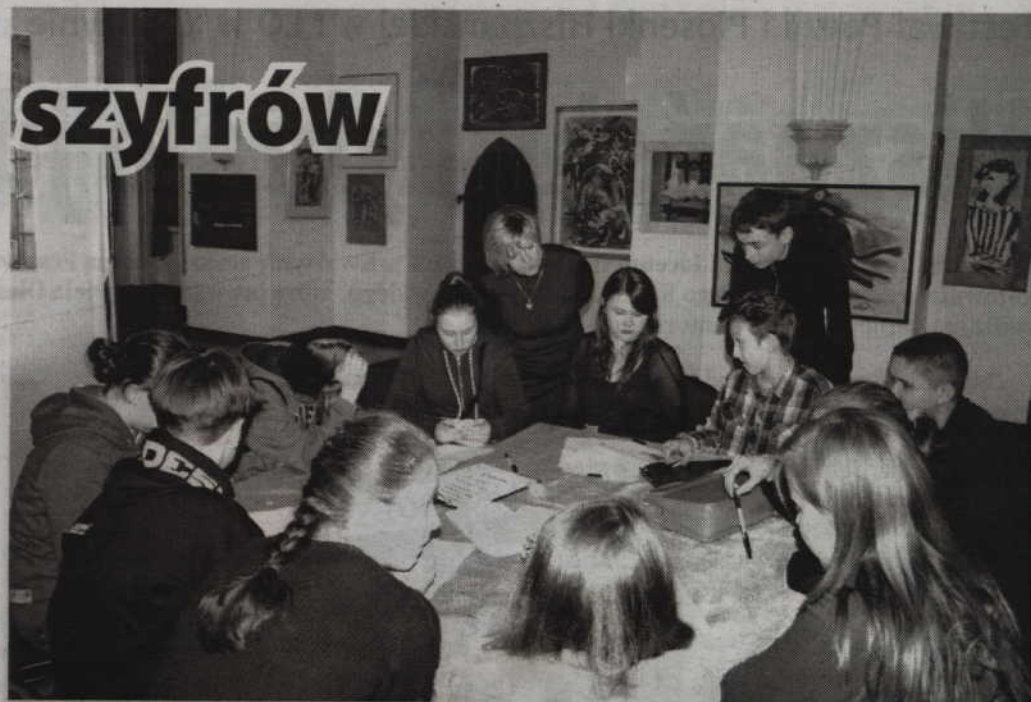
W nocnych zmaganiach z matematycznymi zagadkami wzięli udział uczniowie gimnazjów oraz szkół ponadgimnazjalnych z całego powiatu, uczestniczący w Lokalnym Programie Wspierania Uzdolnień.