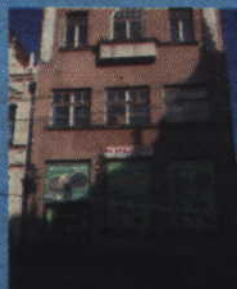
Tczew, Pl. Hallera 6