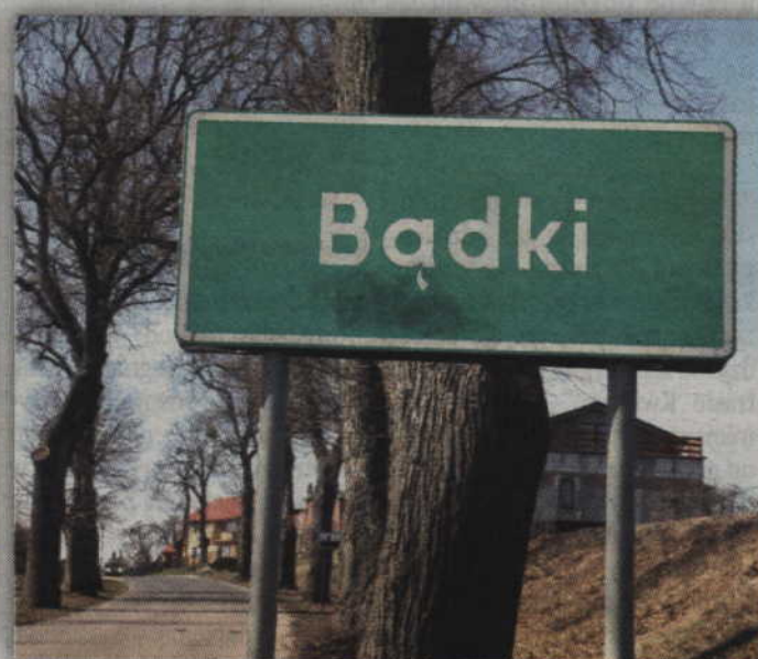
Spór o Bądk ciągnie się już od pięciu lat.

wanych nieruchomościach miasto Kwidzyna zamierza prowadzić działania inwestycyjne zmierzające do uatrakcyjnienia tego terenu m.in. poprzez budowę kanalizacji wodociągowej, sanitarnej a także dróg dojazdowych. Budowa infrastruktury kanalizacyjnej w przyszłości umożliwi skanalizowanie Bądek poprzez doprowadzenie kolektora sanitarnego. Według zapewnień burmistrza Krzysztofiaka, planowane inwestycje nie stanowią katalogu za-