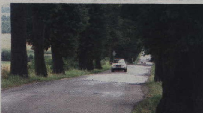
Samorząd powiatu chce usunąć 111 drzew rosnących przy drodze Bądko-Wandowo-Jaromierz.

-Nie zamierzamy wstrzymać tej inwestycji i nie mieliśmy takiego zamiaru. Musimy pamiętać, że na modernizację drogi otrzymaliśmy pieniądze z Narodowego Programu Przebudowy Dróg Lokalnych. Środki te musimy rozliczyć w tym roku. Gdybyśmy nie rozpoczęli prac, musielibyśmy je zwrócić. Po prostu wykonamy modernizację w nieco mniejszym zakresie niż planowaliśmy. Nie będziemy mogli zbudować zatok autobusowych, bowiem drzewa przeszkadzają w ich budowie. Przystanki autobusowe będą nadal na jezdni. Nie jest to bezpieczne rozwiązanie. Nie będzie też możliwości poszerzenia pobocza, które często decyduje o bezpieczeństwie użytkowników dróg. Drzewa w niektórych miejscach znajdują się o kilkanaście centymetrów od skraju jezdni. Nie zrezygnujemy jednak ze starań o usunięcie drzew, które są zagrożeniem dla ruchu drogowego. Chciałbym też zwrócić uwagę na fakt, że całe postępowanie zajęło panu wójtowi bardzo dużo czasu. Nasz wniosek został złożony we wrześniu 2014 roku, a udokumentowane oględziny przy udziale RDOŚ i Eko-Inicjatywy, odbyły się pod koniec lutego. Poza tym wójt sam wnioskuję, że niektóre z tych drzew nie powinny zostać usunięte. Nie wiemy na jakiej podstawie.