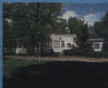
Tczew, ul. Targowa 1