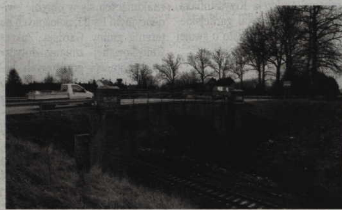
Wiadukt czeka remont, a kierowców utrudnienia w ruchu.

Burmistrz Prabut obawia się, że wielu kierowców będzie chciało korzystać z drogi polnej prowadzącej do plaży miejskiej nad jeziorem Dzierzgoń, a biegnącej wzdłuż linii kolejowej E-65. Służby miejskie będą musiały zadbać o stan nawierzchni tej drogi. (RB)