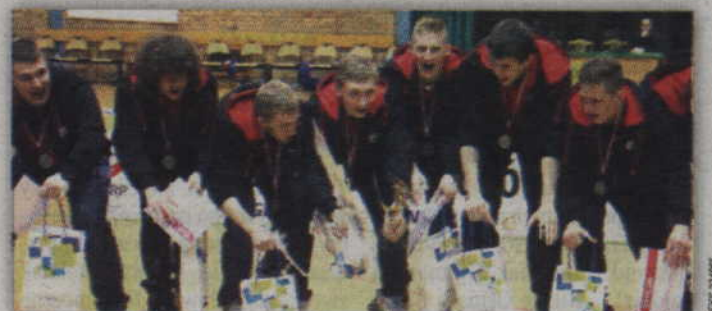
Zawodnicy MTS Kwidzyn cieszą się ze zdobycia brązowego medalu Mistrzostw Polski juniorów.

O wiele więcej emocji było w drugim meczu, w którym zmierzli się gracz Siódemki Miedzi Legnica i Vive Tauron Kielce. W regulaminowym czasie mecz zakończył się remisem 29:29, a o tym kto zagra o złoto decydowała dogrywka. W niej o 1 bramkę lepsi okazali się gracze gospodarzy.