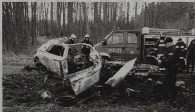
Spalone auto odciążone od drzewa przy użyciu samochodu OSP w Rakowcu.

LICZE. 21-letni kierowca fiata stillo zginął w wypadku drogowym do którego doszło na trasie Kwidzyn - Prabuty. Mężczyzna z nieznaną przyczyną uderzył w drzewo, a chwilę później prowadzony przez niego pojazd stanął w płomieniach. Młody kierowca poniósł śmierć na miejscu.