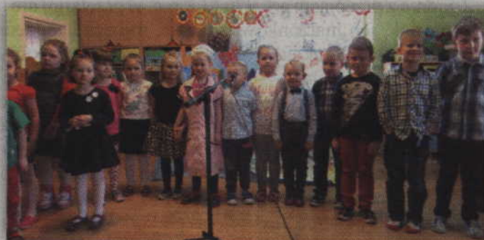
Uczestnicy tegorocznego konkursu recytatorskiego.

Do tegorocznego konkursu zgłosiło się 19 uczestników. Wszyscy wykazali się umiejętnościami recytatorskimi i zostali nagrodzeni gromkimi brawami. Specjalnie powołane jury oceniło dobór repertuaru do tematyki konkursu oraz do możliwości dziecka, interpretację i znajomość tekstu poetyckiego oraz ogólne wrażenie estetyczne (gesty, stroje, gadzety). Jury jednogłośnie postanowiło, że zwycięzcami zostaną wszystkie przedszkolaki. Uczestnicy za udział w konkursie otrzymali nagrody książkowe oraz dyplomy. Atrakcją imprezy był występ zespołu ludowego „Wesoła Gromadka”, który swoimi przyspiewkami zabawił licznie zgromadzoną publiczność.