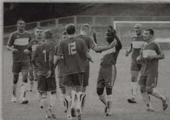
Rodło Kwidzyn rozpoczęło rozgrywki od zwycięstwa w Miłoradzu.

Po zmianie stron kwidzynianie starali się jak najszybciej zdobyć gola. Udało się już w 5 minut po rozpoczęciu gry, kiedy to po