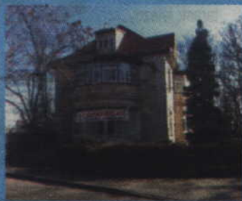
Tczew, ul. Kołłątaja 5

Szczegółowych informacji dotyczących przetargów udziela Referat Gospodarki Nieruchomościami Starostwa Powiatowego w Tczewie (83-110), ul. Piaskowa 2, I piętro, pokój 129, tel. 58 77-34-853.