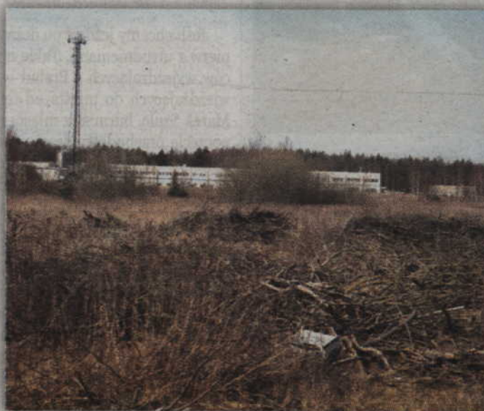
Na spornej ziemi również mogłyby powstać fabryki, gdyby nie brak dobrej woli ze strony obu samorządów.