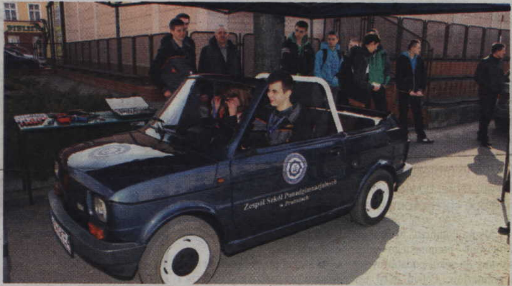
Zespół Szkół Ponadgimnazjalnych w Prabutach bardzo przekonująco zachęcał do zdobycia zawodu mechanika pojazdów samochodowych.

-Szkoły zawodowe, organy prowadzące i pracodawcy zwarli szeregi, aby wspólnie działać na rzecz promocji szkolenia zawodowego, aby uczniowie mogli jak najlepiej poznać szkoły w swoim rejonie i dokonali jak najlepszych wyborów. Jeżeli nie ma perspektywy, związanej z kontynuacją nauki w szkolnictwie wyższym, lepiej być absolwentem szkoły, która pozwala na zdobycie konkretnego zawodu, niż mieć tylko świadectwo maturalne. Taka alternatywa powinna przyświecać uczniom przy wyborze kolejnego