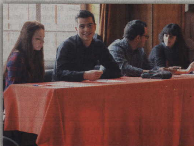
Jury podczas pracy.