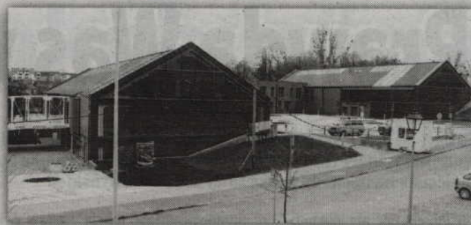
Dobiaża końca budowa infrastruktury Kwidzyńskiego Parku Przemysłowo-Technologicznego w Górkach (gmina Kwidzyn). Inwestycja ma zostać zakończona do końca kwietnia.

- Dodatkowo od ubiegłego roku realizujemy projekt Krajowej Agencji Poszanowania Energii, w zakresie promocji biomasy dla biogazowni. Wartość projektu wynosi 1,2 mln zł. Park prowadzi szkolenia