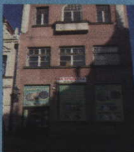
Tczew, Pl. Hallera 6

informuje o publikacjach na stronach internetowych: www.powiat.tczew.pl oraz www.bip.powiat.tczew.pl ogłoszeń odnośnie sprzedaży nieruchomości, stanowiących przedmiot własności Powiatu Tczewskiego. Szczegółowych informacji dotyczących przetargów udziela Referat Gospodarki Nieruchomościami Starostwa Powiatowego w Tczewie (83-110), ul. Piaskowa 2, I piętro, pokój 129, tel. 58 77-34-853.