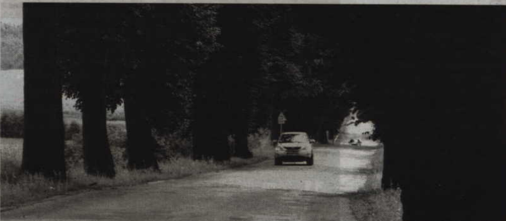
Samorząd powiatu nadal liczy na wycięcie 111 drzew przy drodze Bądko-Wandowo-Jaromierz.

POWIAT. Mimo braku zgody na wycinkę drzew samorząd powiatu rozpoczął procedurę przetargową, która ma wyłonić wykonawcę modernizacji drogi Bądko-Wandowo-Jaromierz. Ogłoszony został już przetarg. Samorząd pozyskał na kapitalny remont drogi 3 mln zł z Narodowego Programu Przebudowy Dróg Lokalnych, czyli tzw. schetynówki. Udział powiatu w przedsięwzięciu to ok. 3,6 mln zł.