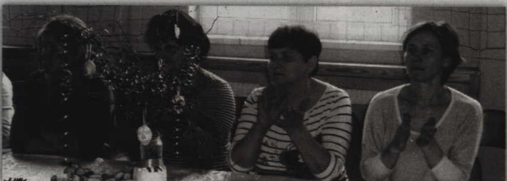
Zwycięzynie III turnieju kół gospodyń wiejskich panie z Okrągłej Łąki.