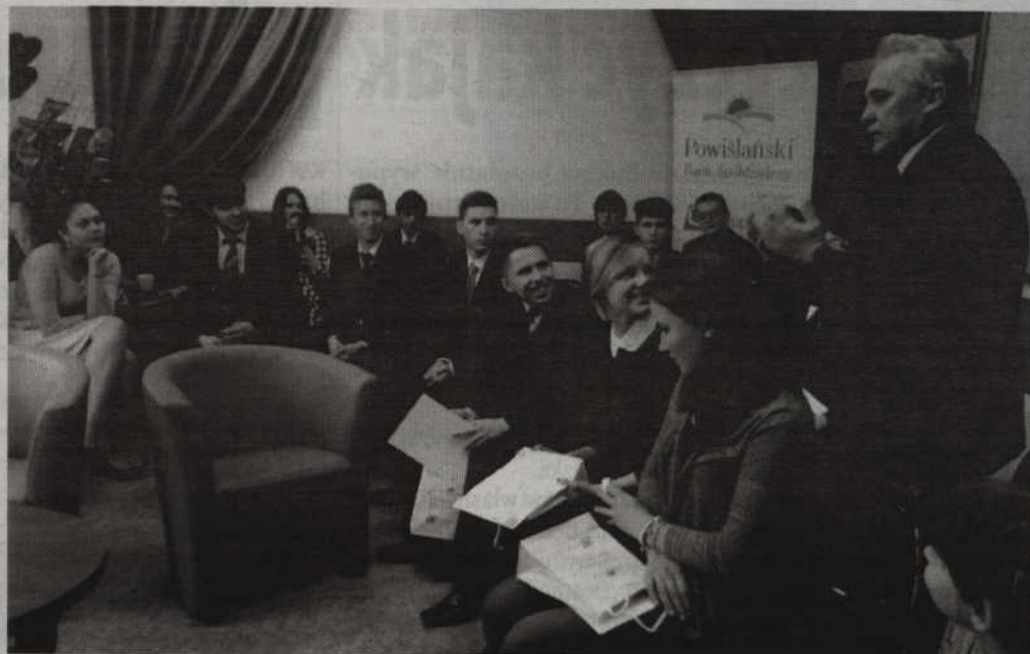
Gościem spotkania był senator Leszek Czarnobaj.

W trakcie pojedynku, poszczególni mówcy przedstawiali argumentację na poparcie swojego stanowiska w tezie. Posługiwali się często trafnymi przykładami; nierzadko odwołując się również do aktualnych wydarzeń. Uczestnicy turnieju starali się reagować na argumentację przeciwnika, podważając ją. Dodatkowo korzystali z prawa do zadawania pytań, co czyniło pojedynki jesz-