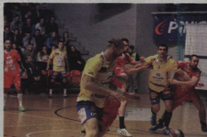
Drugie spotkanie ćwierćfinałowe pary Vive - MMTS odbędzie się w kwidzyńskiej hali przy ul. Wiejskiej już w najbliższy poniedziałek, 13 kwietnia o godz. 18.30.

Po zmianie stron Vive rozpoczęło grę do czterech bramek z rzędu, co pozwoliło gospodarzom na powiększenie przewagi do dziesięciu bramek - 23:13. Kwidzynianie próbowali odrobić straty, ale po 10 minutach