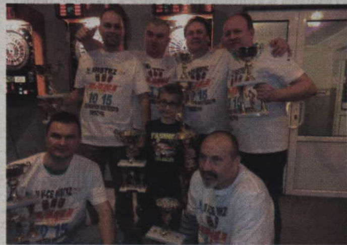
Na czele turnieju drużynowego znalazła się kwidzyńsko-elbląska ekipa No Fair Play.