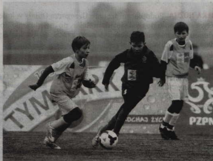
Piłkarska rywalizacja młodych piłkarzy odbywa się w trzech kategoriach wiekowych: U-8, U-10 i U-12.