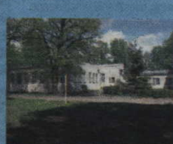
Tczew, ul. Targowa 1

Malbork, os. Kolorowe, 2 pok., 54 m2, 1 p., niskie koszty utrzymania, od 01.05.2015r., 505 341 879