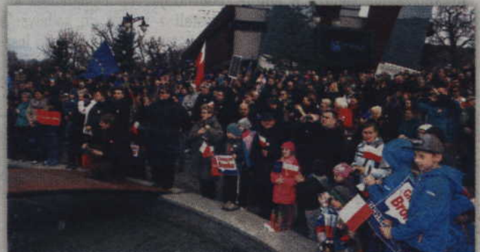
Mieszkańcy licznie przybyli na spotkanie z urzędującym Prezydentem.

litycznie oszukują. Tak samo jak kłamali i oszukiwali w momencie wchodzenia do Unii. Kłamstwo w polityce jest zjawiskiem częstym, tak samo częstym jak błąd. Różnica między błędem a kłamstwem polega na tym, że za błąd się przeprosza, a do kłamstwa nikt nie chce się przyznać. Gdzie są ci, którzy straszili Polskę utratą suwerenności. Jakim prawem straszą dzisiaj straszną perspektywą wejścia do Strefy Euro? Tak samo kłamią, oszukują i chcą nas sparaliżować lękiem. A my wiemy, że tylko polska mądra praca i członkostwo w Unii daje bezpieczeństwo, zamożność i lepszą przyszłość - podkreślał Prezydent Bronisław Komorowski.