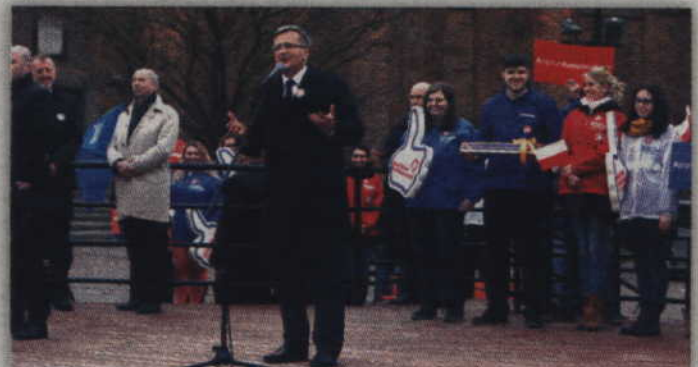
Bronisław Komorowski przemawiał do mieszkańców zgromadzonych na placu Jana Pawła II.

- Straszili nas, że przestaniemy mówić po polsku, jajka będziemy jedli z Niemiec a mięso z Francji. Ci, którzy obiecują, że można coś uzyskać bez pracy, bez członkostwa w Unii Europejskiej, po prostu politycznie kłamią, po-