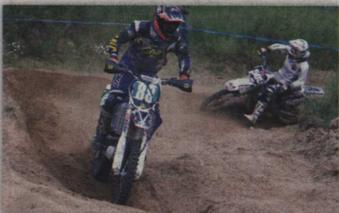
Rywalizacja w cross-country odbędzie się na torze w Bądkach, znajdującym się za fabryką Jabil.