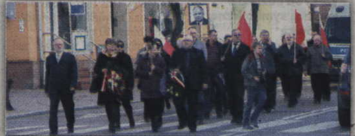
Zebrani przeszli ulicą Grudziądzką, Batalionów Chłopskich oraz Targową, aby dotrzeć do kwidzyńskiej Katedry.

W rocznicę wydarzeń z 10 kwietnia 2010 roku