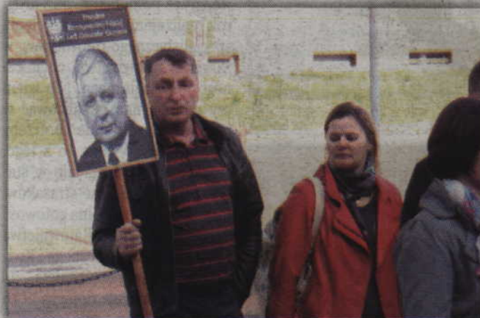
Zebrany, z plakatu, przyglądał się Prezydent Lech Kaczyński.