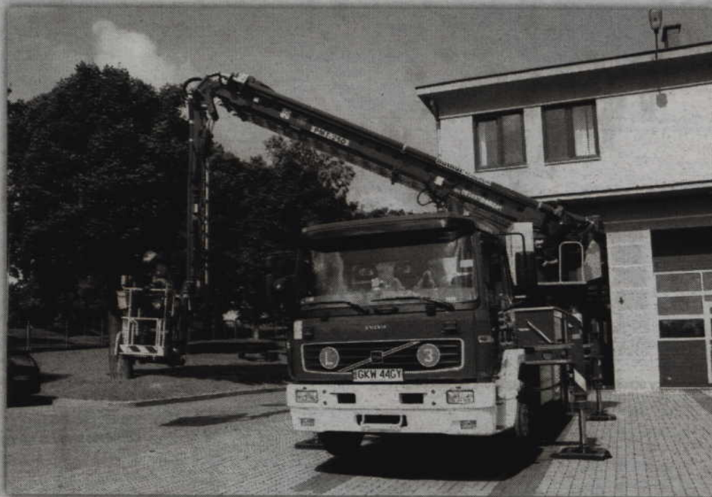
Strażacy bardzo dużą wagę przykładają do ćwiczeń, które prowadzone są niemal przez cały czas.