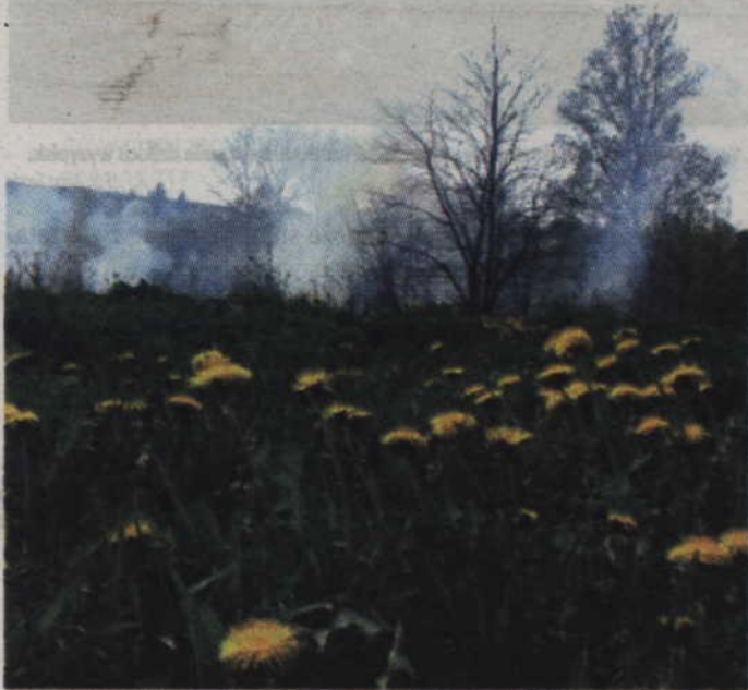
Wypalanie traw i zarośli to brutalny atak na cały ekosystem.