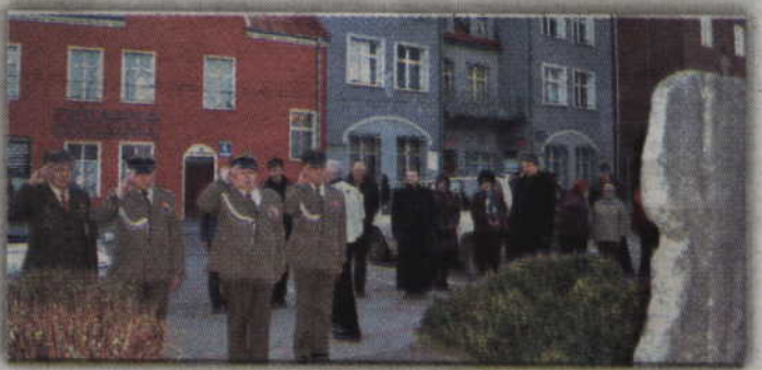
Kwiaty złożono również przy pomniku pamięci znajdującym się przy ul. Kwidzyńskiej.