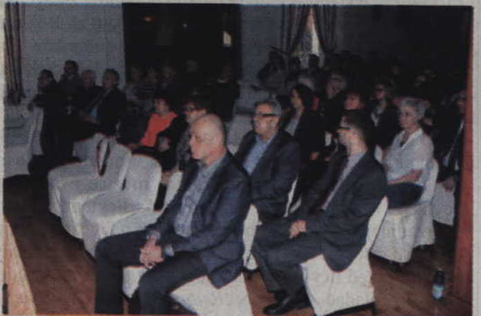
Konferencja inauguracyjna program odbyła się w restauracji Resursa.