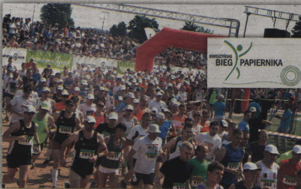
Tegoroczny Bieg Papiernika odbędzie się 23 maja.