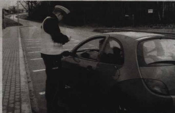
Policjanci wylegitymowali 196 kierowców i 20 pieszych.

POWIAT. Podczas świątecznego weekendu policjanci prowadzili kontrole na drogach i dbali o bezpieczeństwo mieszkańców patrolując teren powiatu kwidzyńskiego. Świąteczne dni upłynęły w miarę bezpiecznie. Funkcjonariusze odnotowali tylko jeden wypadek drogowy i uniemożliwili dalszą jazdę czterem nietrzeźwym.