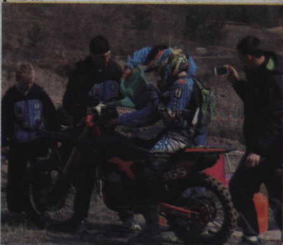
Chwila na uzupełnienie paliwa.