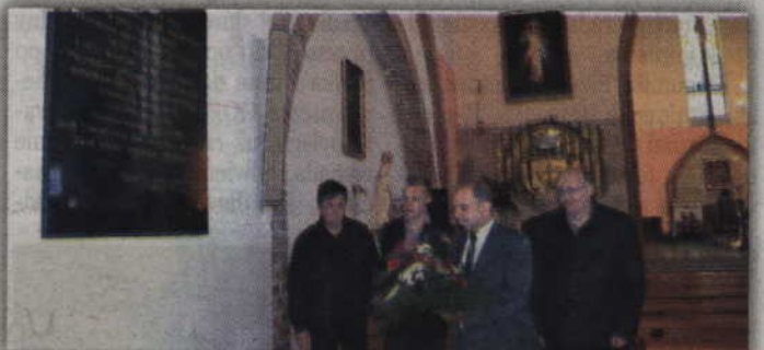
Po Mszy św. złożono kwiaty pod tablicą upamiętniającą ofiary katastrofy smoleńskiej.