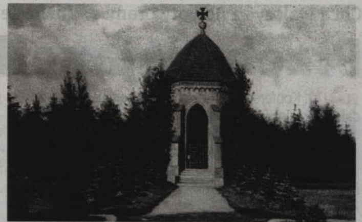
Czy tablica upamiętniająca żołnierzy 5 regimentu kirasjerów znajdzie swoje stałe miejsce w dawnym mauzoleum zdecydują prabucy radni.

-Wielu osobom ten pomysł może wydawać się kontrowersyjnym. Nie możemy jednak odcinać się od przeszłości naszego miasta i zapominać, kto w tym mieście mieszkał przed kilku-