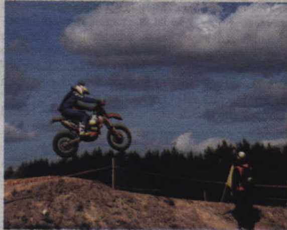
Amatorzy wysokich lotów mieli na co popatrzeć.