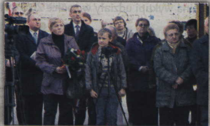
Uczestnicy spotkania zebrał się przed budynkiem kwidzyńskiej „Solidarności”.