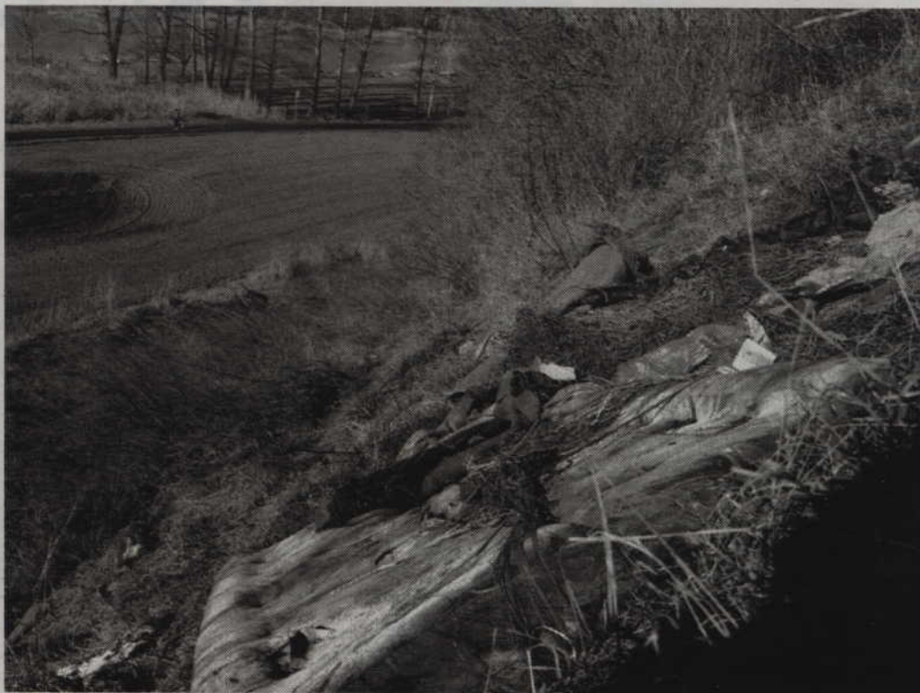
Budząca się ze snu przyroda i... sterty śmieci. To niebywałe, że wciąż tak łatwo przychodzi ludziom tworzenie dzikich wysypisk.

Pamiętajmy też, by nie wyrzucać torebek foliowych. Skoro nie zajmują wiele miejsca, można je ciasno zwinąć i wcisnąć do kieszeni, torby czy koszyka. Dlaczego warto to robić? Bo porzucone podczas wycieczki,