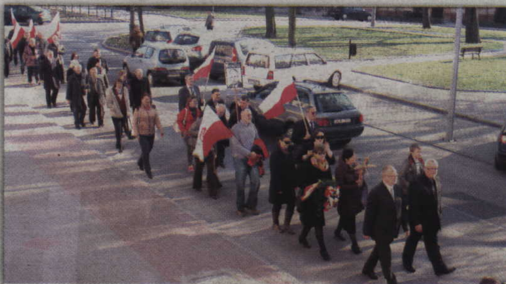
Mieszkańcy uczcili piątą rocznicę katastrofy smoleńskiej.