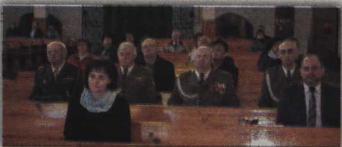
Uroczystości rocznicowe odbyły się w prabuckiej Konkatedrze.