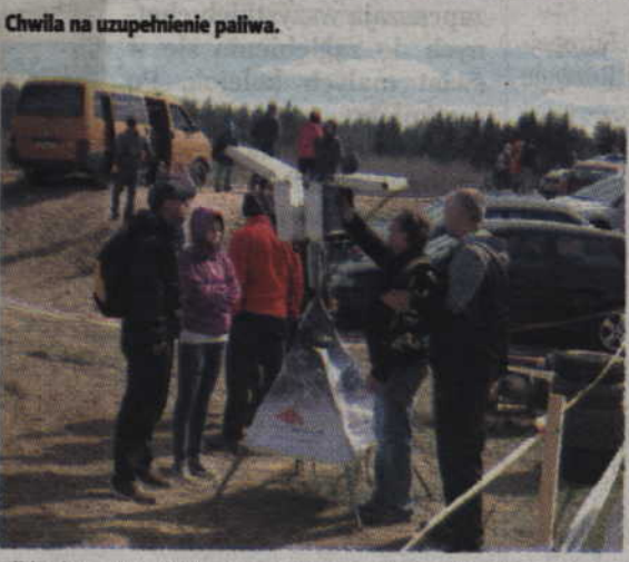
Kibice i przedstawiciele poszczególnych ekip mogli na bieżąco sprawdzać przebieg rywalizacji.