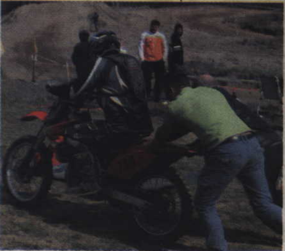
Czasem wymagana była drobna pomoc kibiców.