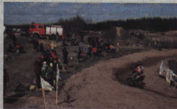
Kibice kibicowali rywalizacji motocyklistów na torze w Bądkach.