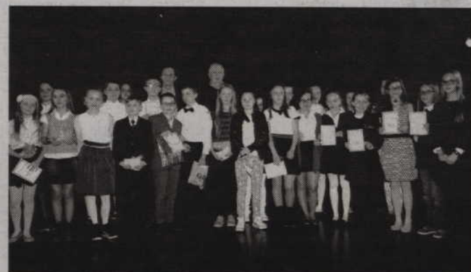
Laureaci oraz uczestnicy konkursu w kategorii uczniów szkół podstawowych z klas IV-V.