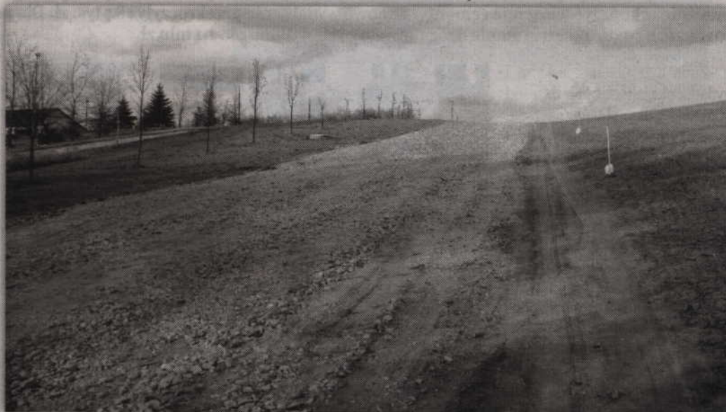
Droga w pobliżu jeziora Kamień zmieniła swój wygląd.

Prace ziemne trwały dwa dni. Do zniwelowania terenu nie wystarczyła tylko ziemia znajdu-