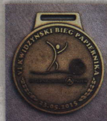
Tak wygląda medal tegorocznej edycji Biegu Papiernika.

Przypominamy, że zapisy internetowe na stronie www.biegpapiernika.pl do biegu na 10 km będą trwały tylko do 10 maja. Po tym terminie będzie się moż-