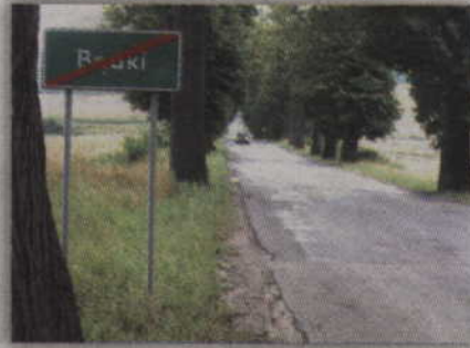
Modernizacja drogi Bądky - Wandowo - Jaromierz ma zostać zakończona do końca sierpnia.

-Drugie zadanie obejmuje odcinek z Wandowa do Jaromierza. Planujemy wykonanie powierzchniowego utrwalenia. To była jedna z pierwszych zmodernizowanych przez nas dróg. Zabieg ten powinien być wykonany już dawno. Dzięki tej inwestycji uda się go wreszcie wykonać - twierdzi Andrzej Fortuna.