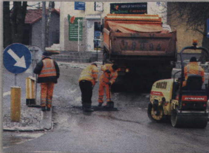
Koszt wiosennych prac remontowych wyniósł ok. 217 tys. zł.

-Zima była dla nas łaskawa i wydatki okazały się najniższe od kilku lat. Udało się nam też zakończyć wiosenne remonty. Koszt wszystkich prac wyniósł ok. 217 tys. zł. To niewiele w porównaniu z ubiegłymi latami, ale to tylko jedno z zadań, które zrealizowaliśmy. Od kilku lat zabezpieczamy nawierzchnie naszych dróg. Właśnie przygotowujemy się do przeprowadzenia kolejnych tego typu prac, polegających na powierzchniowym utwardzeniu nawierzchni emulsją i grysami. W ubiegłym roku tym sposobem zabezpieczyliśmy powierzchnię ok. 68 tys. m kw. dróg. Koszt tego zadania wyniósł ok.