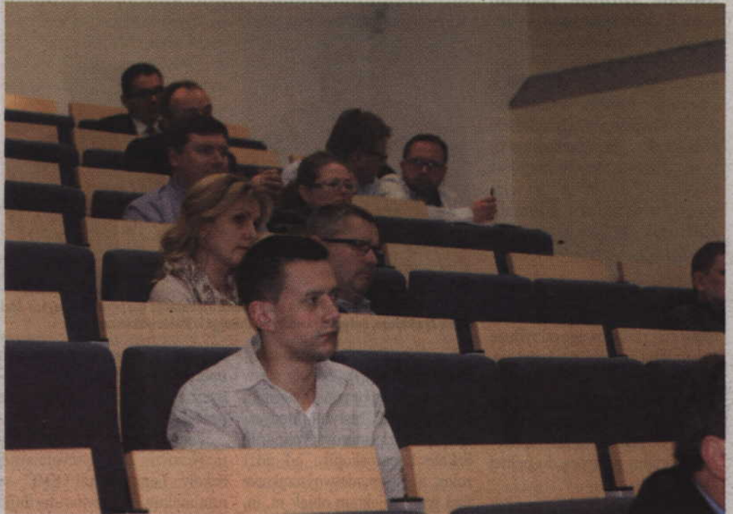
W debacie wzięli udział m.in. kwidzyńscy przedsiębiorcy.

-Właściciel firmy musi być wyczulony na to z kim współpracuje. Wiarygodność w gospodar-