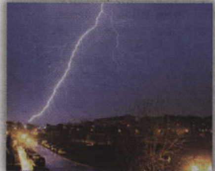
Na zdjęciu poniedziałkowa burza, która przeszła nad Kwidzynom.

- Porażenie piorunem może skończyć się śmiercią lub trwałym kalectwem. Należy pamiętać, że wysokie elementy doskonale przyciągają wyładowania atmosferyczne. Najlepiej nie przebywać podczas burzy w ich pobliżu. Nie wolno też szukać schronienia pod drzewami, słupami i li-