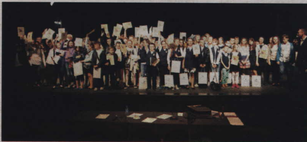
Wspólna fotografia uczestników konkursu historycznego w kategorii szkół podstawowych.