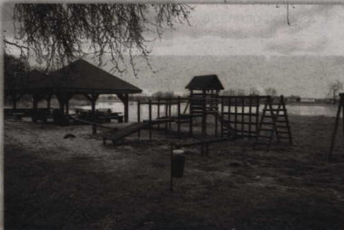
W ramach Europejskiego Funduszu Rolnego nad jeziorem Glina powstało miejsce do wypoczynku.

Obawy, że mieszkańcy będą mogli mieć trudniejszy dostęp do plaży wyrażała wójt Elżbieta Krajewska. W rozmowie z nami wójt Krajewska podkreślała, że władze zrobią wszystko, aby