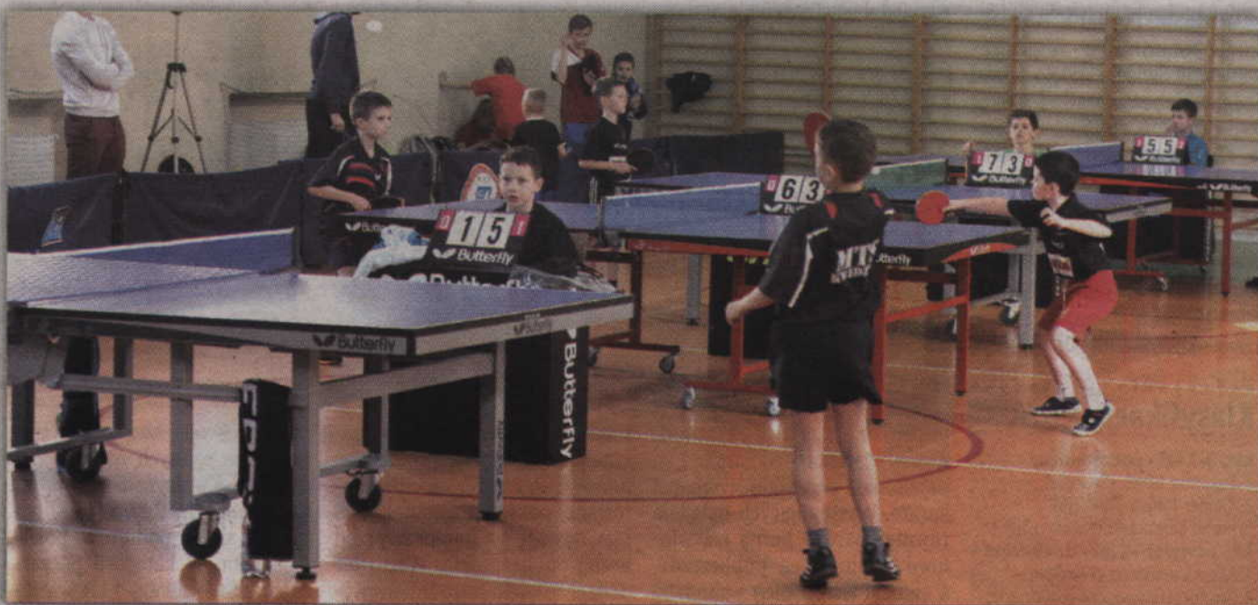
W II turnieju GP Kwidzyna wzięło udział ponad setka uczniów i uczennic.