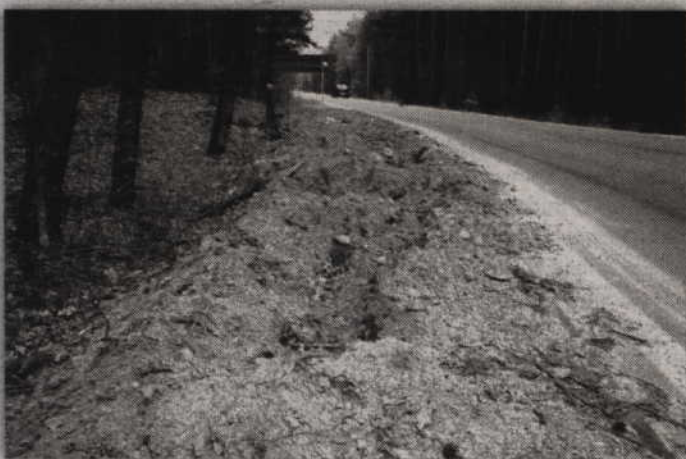
Dziki z upodobaniem niszczą pobocze wyremontowanej drogi nr 522.

Tak więc jak na razie dziki oprócz kierowców będą również zainteresowane fragmentem drogi wojewódzkiej nr 522. Być może z czasem znudzi im się ryć pod asfaltem i przeniosą się w nowe miejsce. (RB)