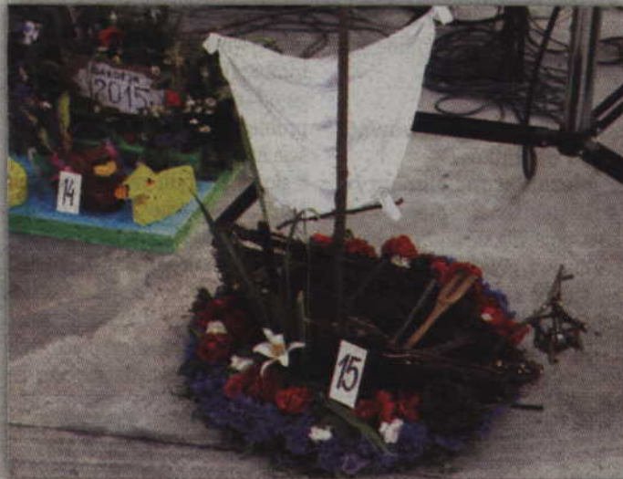
Zwycięski wianek autorstwa pań z Czarnego Małego 1.

Publiczność, która przychodzi na imprezy plenerowe zawsze z niecierpliwością czeka na występy gwiazd lub gwiazdeczek. Na dobry początek muzycznej części gardejskiej nocy świętojańskiej