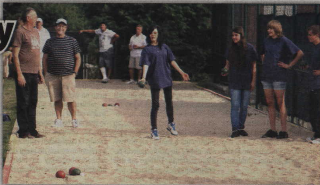
Mistrzostwa Polski w bocce na piasku odbędą się już po raz 21.