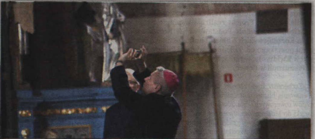
Zdjęcia wnętrza kwidzyńskiej Katedry trafiły do smartfona ks. biskupa.