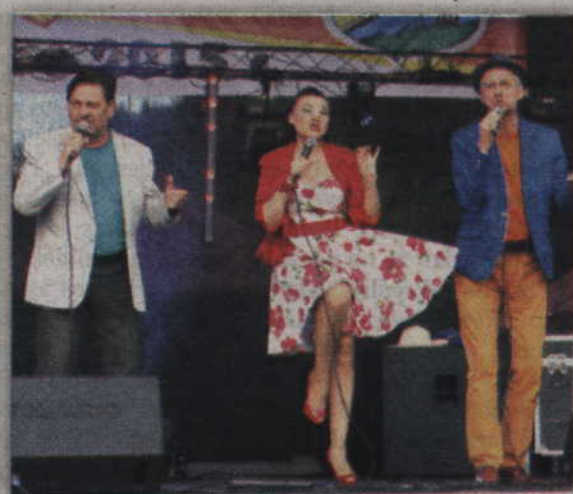
Solisci Teatru Muzycznego z Gdyni zaskoczyli wszystkich zarówno strojem, jak i energią sceniczną.