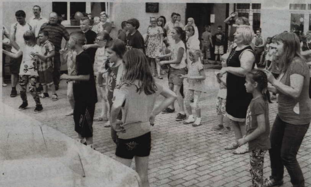
Podczas imprezy doskonale bawili się zarówno młodszy jak i nieco starsi.