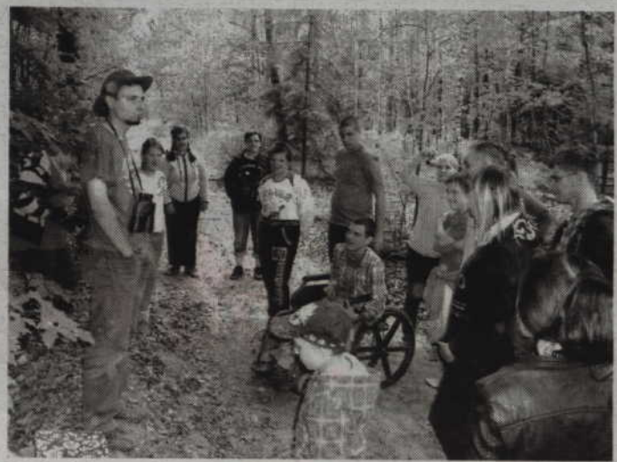
Uczniowie ZSS w Kwidzynie uczestniczyli także w spacerach po okolicznym lesie.

Kolejną atrakcją dla uczniów były przejażdżki rowerowe po okolicy, podczas których fotografowano ciekawe miejsca i zjawiska przyrodnicze. W trakcie zajęć