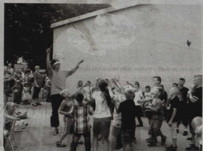
Pokaz dużych baniek mydlanych zawsze wzbudza wiele radości wśród najmłodszych.