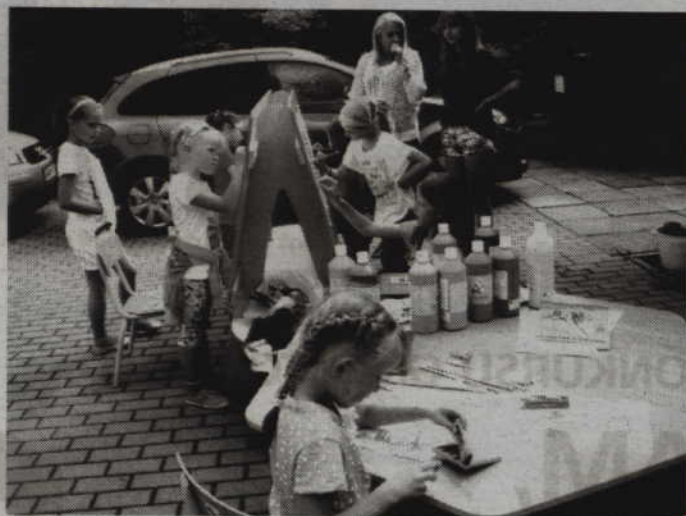
Maluchy mogły wykazać się również swoimi zdolnościami plastycznymi.