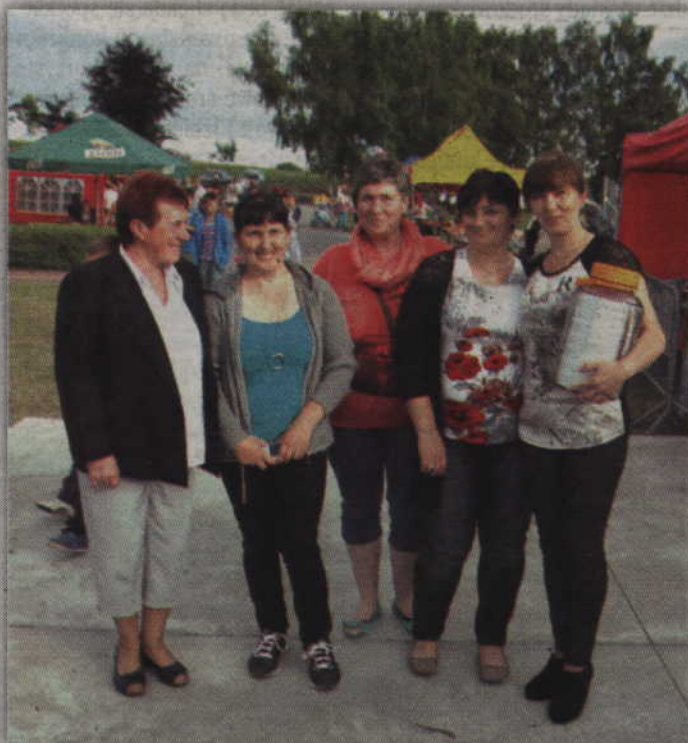
W tym roku najładniejszy wianek świętojański zdaniem Jurorów wykonały panie z KGW w Czarnem Małym 1.