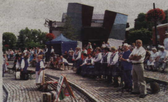
Plac Jana Pawła II ponownie wypełni się uczestnikami kwidzińskiego przeglądu.

Tegoroczne kwidzińskie spotkania kapel i zespołów ludowych rozpoczną się o godz. 9.30 od przemarszu uczestników imprezy. Wesoły orszak wyruszy sprzed budynku KCK przy ul. 11 Listopada, aby następnie przejść ulicami: Grunwaldzką, Piłsudskiego, Braterstwa Narodów i