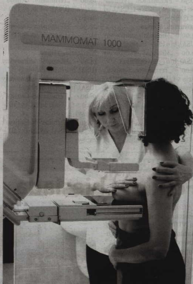
Badanie polega na zrobieniu czterech zdjęć rentgenowskich.

Populacyjny Program Wczesnego Wykrywania Raka Piersi skierowany jest do kobiet zdrowych, które nie chorowały wcześniej na raka piersi. Otrzymywany wynik badania przesiewowego to ocenione przez dwóch lekarzy specjalistów zdjęcia rentgenowskie piersi, z krótką adnotacją - czy w piersiach występują nieprawidłowości wymagające dal-