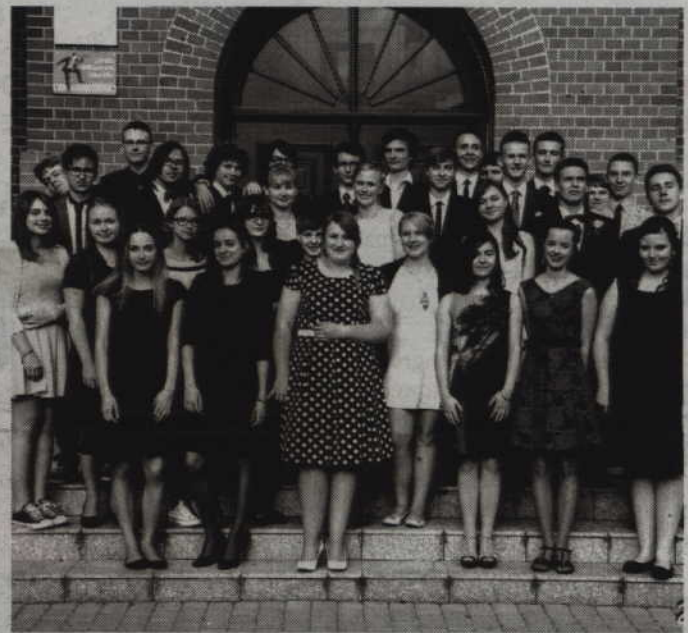
(f) Uczniowie Społecznego Gimnazjum przed budynkiem szkoły.