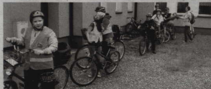
W ramach projektu zorganizowano rajd rowerowy z Korzeniewa do Biblioteki Publicznej Gminy Kwidzyn w Marezie.