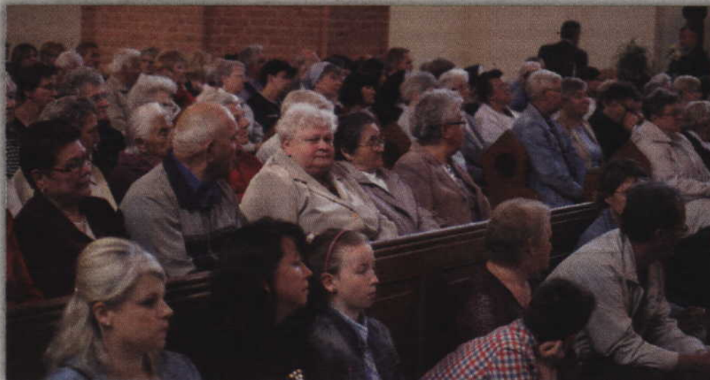
Mieszkańcy Kwidzyna licznie powitali nowego biskupa w kwidzyńskiej Katedrze.