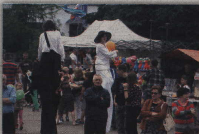
Razem z mieszkańcami bawili się również szrudlarze.