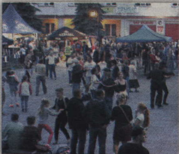
Mieszkańcy doskonale bawili się przy muzyce disco-polo.

siadny, nie zabrakło również smacznych potraw czy też atrakcji dla najmłodszych. Maluchy zabawiali m.in. szrudlarze z Dzierżonia, a także członkowie Zaciężnej Chorągwi Rycerskiej „Apis” z Gniewa. Na koniec ponownie zabrzmiały natomiast dźwięki disco-polo, a publiczność do wspólnej zabawy zachęcał zespół „Diadem”. (fox)