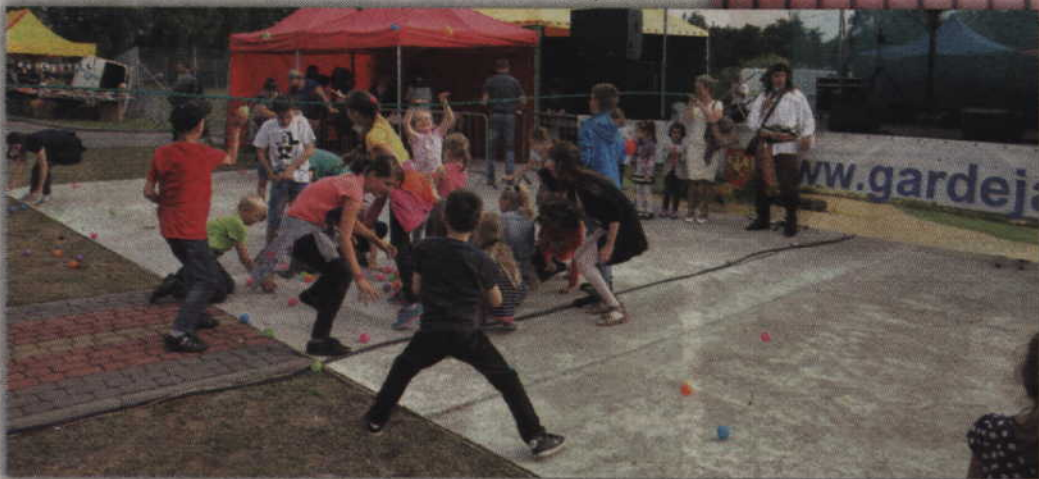
Wyprawa po skarb z teatrem Qufer zakończyła się bitwą na plastikowe kulki.