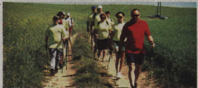
Stowarzyszenie „Zakątek Dankowo” zaprasza na 6-km marsz doliną Wisły.

trasy organizatorzy zaplanowali na godzinę 11.00. Dla każdego uczestnika marszu przewidziano również pamiątkową koszulkę plebiscytową, wodę, ciepły posiłek oraz niespodziankę.