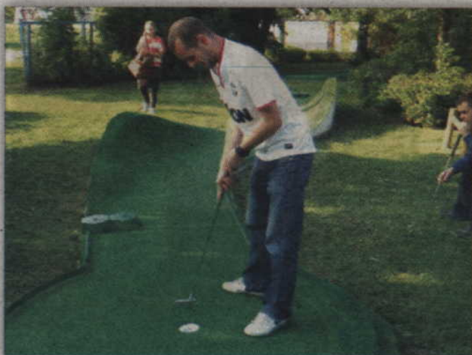
Podczas weekendu z minigolfem rozegrane zostaną trzy turnieje.

Kwidzyński weekend z minigolfem to impreza, która od dawna przyciąga sympatyków minigolfa nie tylko z grodu nad Liwą. Stalymi gośćmi Mistrzostw Kwidzyna są bowiem gracze z Warszawy oraz