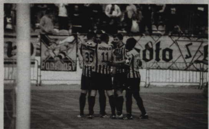
Kwidzyńskie Rodło rozpocznie gry towarzyskie od pojedynku z Gryfem Słupsk.

11 lipca - Gryf Słupsk (III liga) 15 lipca - Wda Świecie (III liga) 18 lipca - GKS Włocławek (III liga) 22 lipca - Olimpia Grudziądz (I liga) 25 lipca - Olimpia Grudziądz (mecz Pucharu Polski) 29 lipca - Start Warlubie (III liga) 1 sierpnia - Wierza Pelplin (III liga)