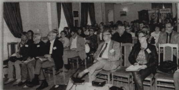
Specjaliści z niemieckiego powiatu Osterholz oraz powiatu kwidzyńskiego dyskutowali w zabytkowym dworku w Górkach (gmina Kwidzyn) na temat aktywności osób starszych.