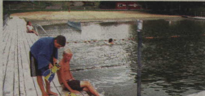
Plaża miejska w Julianowie czeka na mieszkańców powiatu kwidzyńskiego.

-Kąpielisko usytuowane na Plaży Miejskiej w Julianowie przeszło wszelkie akredytacje i jest w pełni bezpieczne dla osób chcących skorzystać z wodnych kąpiel. Każdego dnia nad bezpieczeństwem plażowiczów będzie czuwał 2 ratowników. Plażowicze mają do swojej dyspozycji piaszczystą plażę oraz pomost. Wzorem ubiegłego roku przygotowujemy również dla dzieci specjalne zajęcia, które będą prowadzić animatorzy.