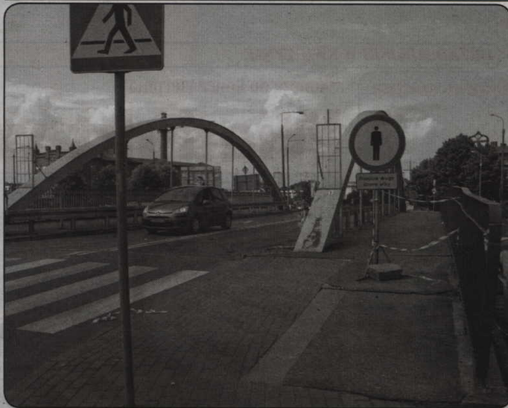
Trwa remont wiaduktu łączącego ulice Grunwaldzką i 3 Maja. To trzeci i ostatni remont wiaduktu drogowego w mieście.

Trwa remont mostu łączącego ulice Grunwaldzką i 3 Maja. To trzeci i ostatni remont wiaduktu drogowego w mieście. Prace mają zakończyć się do końca sierpnia. Z wiaduktu przez najbliższe tygodnie będą mogli korzystać jedynie piesi, gdyż remont obejmuje także wymianę nawierzchni jezdni.