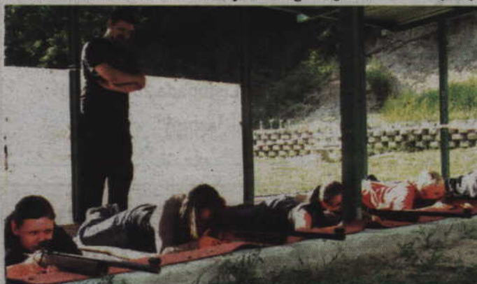
W każdą środę na strzelnicy przy ul. Strumykowej będzie można postrzelać z broni pneumatycznej.

KWIDZYN. Urząd Miejski w Kwidzynie oraz Stowarzyszenie „Bezpieczny Kwidzyn” i Zarząd Powiatowy Ligi Obrony Kraju zapraszają na strzeleckie wakacje. Zajęcia strzeleckie z broni pneumatycznej, organizowane dla dzieci i młodzieży, odbywać się będą w każdą środę w godzinach 10.30-13.00 na strzelnicy miejskiej przy ul. Strumykowej. Na zakończenie cyklu - 26 sierpnia, odbędzie się natomiast strzelanie z broni małokalibrowej na odległość 50 m. (fox)