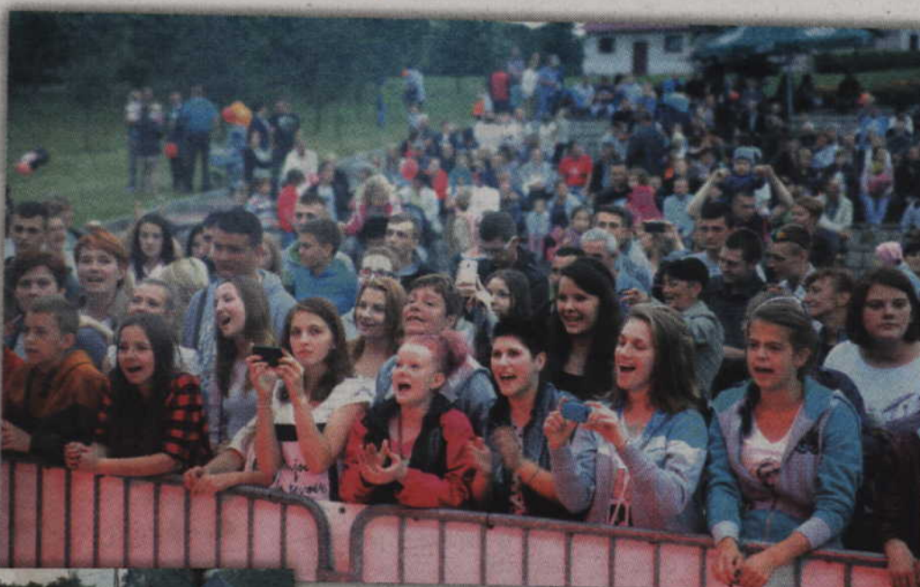
Pogoda dopisała publiczność doskonale się bawiła.