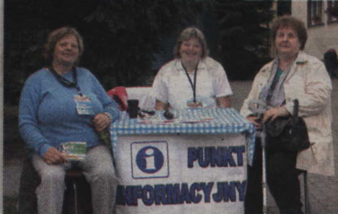
Punkt informacyjny to stały element Dni Ryjewa.

świętowanie rozpoczęło się jednak już od 6 rano od zawodów wędkarskich. Choć do udziału zgłosiło się 19 wędkarzy to jednak tym razem nie sprzyjało im szczęście. Jedynie pięcioro z nich zdołało bowiem coś złowić na haczyk.