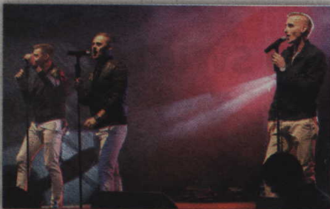
Dni Ryjewa zakończył występ grupy „Diadem”.