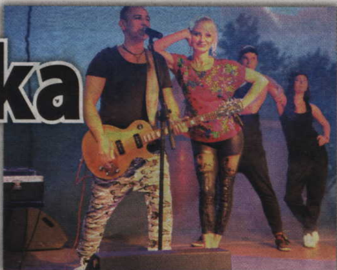
Zespół „Mejk” - tegoroczna gwiazda gardejskiej nocy świętojańskiej.