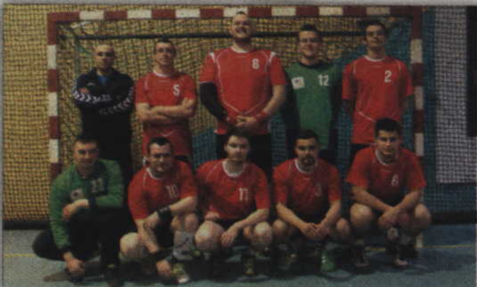
Bellator Ryjewe wywalczył historyczny awans, ale na grę w II lidze będzie musiał jeszcze poczekać.