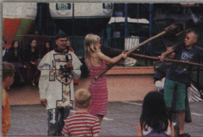
Dzieci chętnie brały udział w zabawach prowadzonych przez Zaciężną Chorągiew Rycerską „Apis” z Gniewa.

Drugi dzień Dni Ryjewa miał już typowo biesiadny charakter. Ze sceny płynęły piosenki z lat 40-80 wykonywane przez wokalistów z Grupy Wokalnej Jerzego Majdy oraz solistów Teatru Muzycznego z Gdyni. Niedzielne