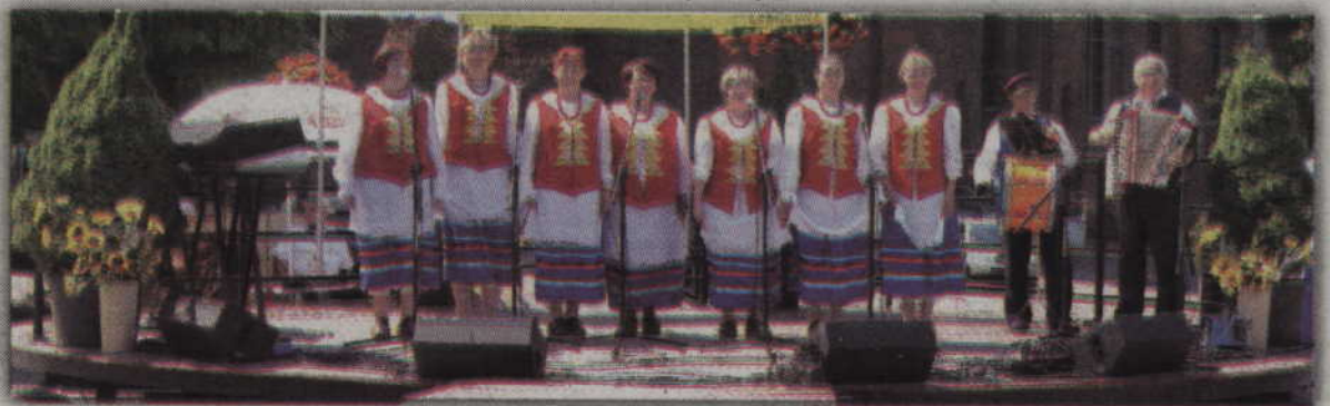
Jednym z uczestników tegorocznego przeglądu był zespół „Oj-toto” z Pelplina.