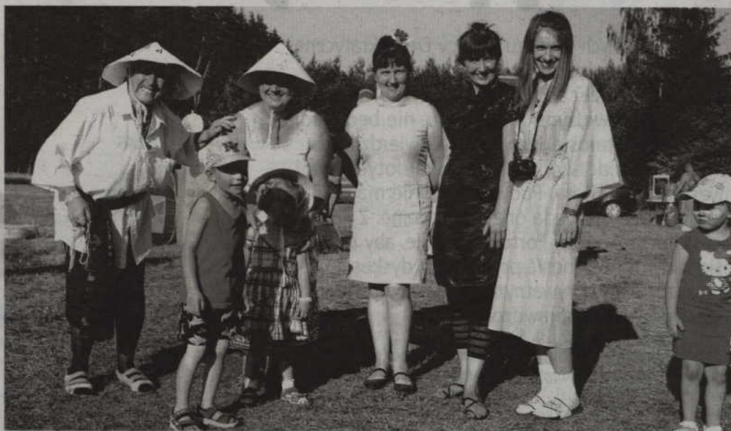
Tegoroczny festyn odbywał się w stylu orientalnym.