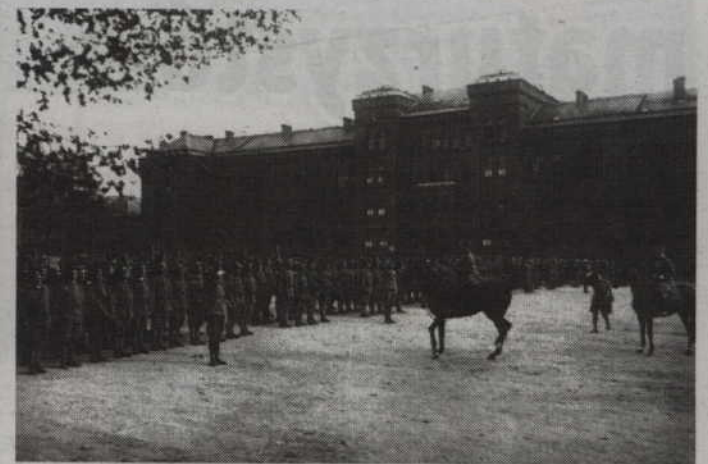
Odprawa wojsk włoskich i francuskich na kwidzińskim placu koszarowym (dziś teren pomiędzy Kwidzińskim Centrum Kultury, a Powiślańską Szkołą Wyższą).

Wizyta nuncjusza apostolskiego na Powiślu w niewielki stopniu pomogła naszym rodakom w wygraniu plebiscytu, ale trudno się temu dziwić. W starciu z potężną niemiecką machiną urzędniczą i propagandową Polacy nie mieli szans. Niemcy nie tracili czasu na zbędne gadanie i rozpoczęli przygotowania do plebiscytu z pełną parą. Jeszcze przed przybyciem Komisji Międzysojuszniczej, która w okresie poprzedzającym głosowanie i w trakcie jego trwania miała pełnić rolę administratora terenów objętych plebiscytem, niemieckie przygotowania do plebiscytu były na ukończeniu. Ponadto, w Niemczech plebiscyt podniesiono do rangi sprawy ogólnonarodowej jednoczącej wszystkich ponad politycznymi podziałami, a wygrana w plebiscytwie „bitwie” powetować miała Niemcom upokorzenia traktatu wersalskiego. Już w marcu 1919 roku powołano do życia Wschodniemiecką Służbę Ojczyźnianą. Organizacja ta, posiadająca struktury szczebla powiatowego i gminnego, z mężami zaufania w każdej większej miejscowości, miała przejąć główny ciężar akcji plebiscytowej po przybyciu aliantów. Powstał także Związek Mazurów i Warmiaków skupiający ponad 200000 członków. Jak grzyby po deszczu wyrastały zaczęły najróżniejsze organizacje o charakterze paramilitar-