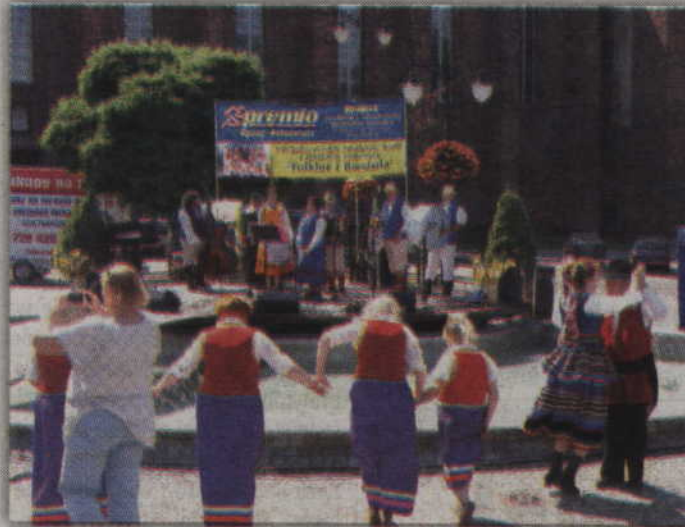
Mimo potwornego upału członkowie zespołów ludowych doskonale bawili się przy muzyce swoich kolegów i koleżanek.

Niestety panujący w sobotę upał doskwierał zarówno występującym, jak i przysłuchującym się poszczególnym występom. Wszyscy szukali na placu jak