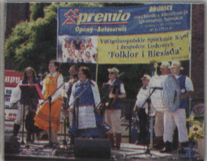
Na scenie prezentuje się zespół ludowy z Ostródy.