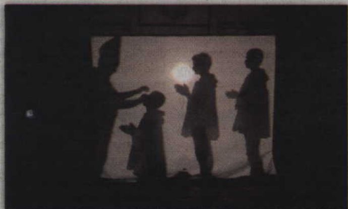
Podczas podsumowania projektu zaprezentowano m.in. teatr cieni zatytułowany „Od Syberii do kapłaństwa”.