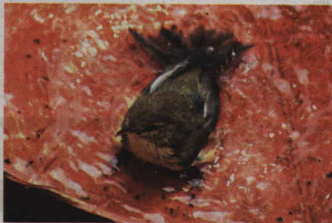
Z ptasiego kąpieliska w dużej podstawie pod doniczkę ustawionej na stoliku ogrodowym chętnie korzystają m.in. piecuszki

- Ptakom można pomóc wystawiając tzw. poidelko. Powinno być nim płaskie naczynie z wodą, na środku którego możemy umieścić kamień jako dodatkową pomoc dla korzystających z poidła ptasich gości. Na poidelko nadaje się np. gliniana podstawa pod doniczkę czy odwrócona do góry dnem pokrywa od kosza na śmieci. W przypadku śliskich powierzchni dno poidła należy wysypać drobnym żwirem, aby