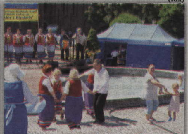
Przy muzyce ludowej bawili się zarówno członkowie zespołów, jak i mieszkańcy Kwidzyna.