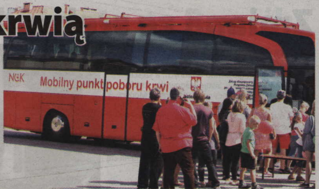
Ambulans Regionalnego Centrum Krwiodawstwa i Krwiolecznictwa pojawi się w Kwidzynie w najbliższą sobotę, 11 lipca.

Warto dodać, że każdy Krwiodawca otrzyma w tym roku breloczek ratunkowy, zawierający maseczkę do sztucznego oddychania i jednorazowe rękawiczki. Jest to nowość, wprowadzona w ramach propagowania idei pierwszej pomocy. Wśród Krwiodawców rozlosowane zostaną również profesjonalne ap-