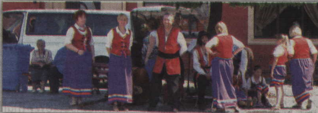
Każdy, kto tego dnia pojawił się na placu Jana Pawła II, szukał choć odrobiny cienia.