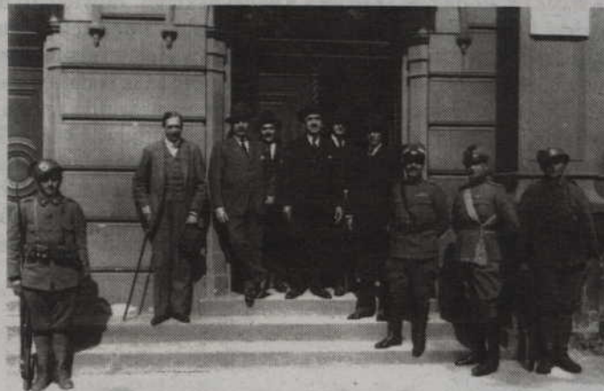
Międzysojusznicza komisja plebiscytowa przed drzwiami do siedziby komisji (obecnie siedziba Sądu Rejonowego).

POWIAT. Każdego roku, na początku wakacji, przypominamy wydarzenia sprzed kilkudziesięciu lat. 11 lipca 1920 roku mieszkańcy ówczesnych południowych i zachodnich części Prus Wschodnich wypowiedzieli się bowiem w głosowaniu za przynależnością państwową tych ziem. Jaki był rezultat głosowania, wiemy doskonale. Polska strona sromotnie go przegrała, a Niemcy święcili ogromny triumf. W tym roku obchodzimy 95 rocznicę tamtych wydarzeń.