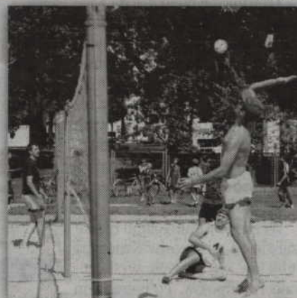
Wakacyjne rozgrywki siatkarskie rozpoczną się o godzinie 18.00.