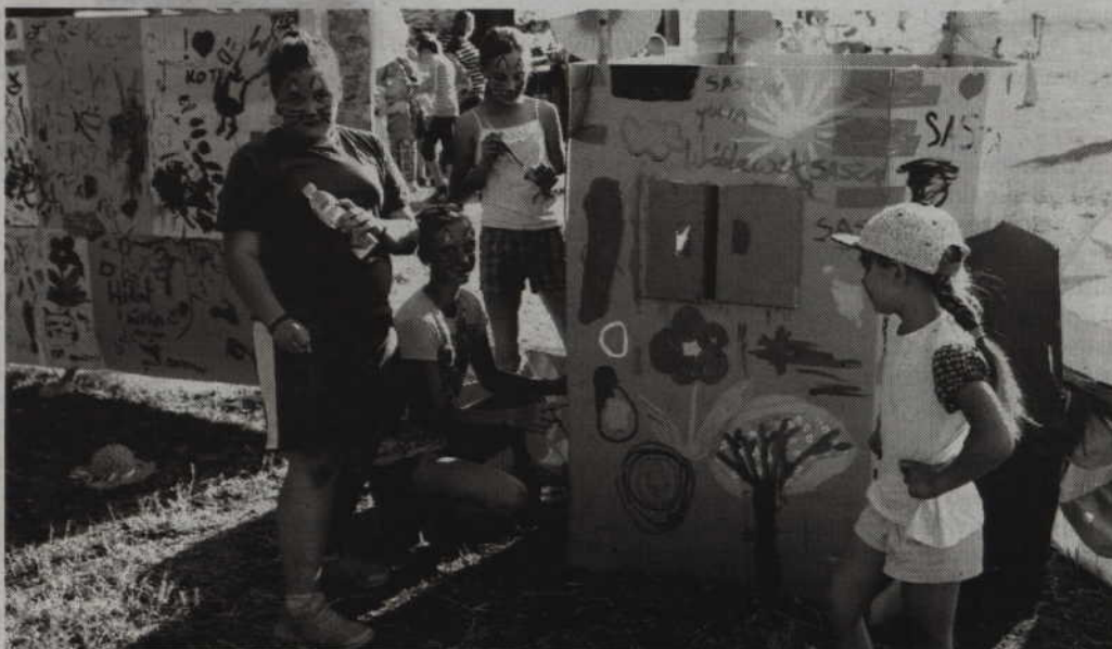
Podczas imprezy można było na chwilę zamienić się w artystę tworzącego graffiti.