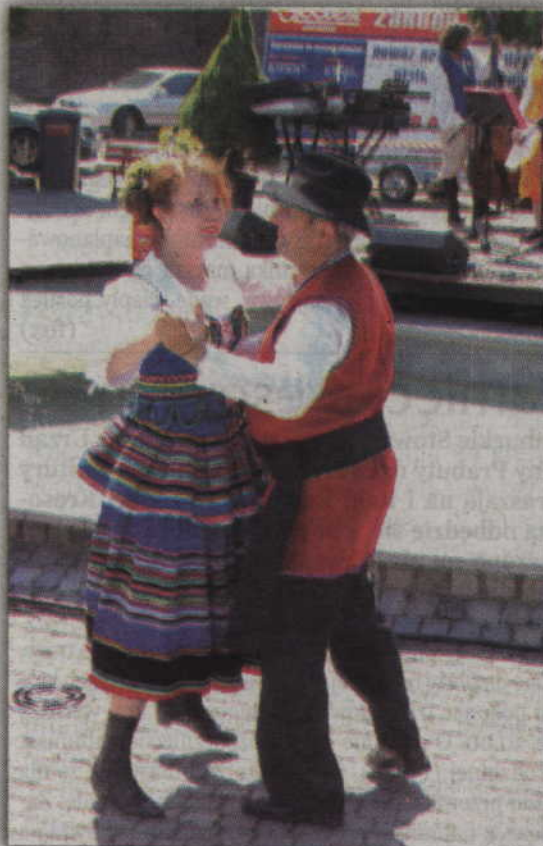
We wspólnej zabawie łączyły się nie tylko zespoły, ale i pokolenia.