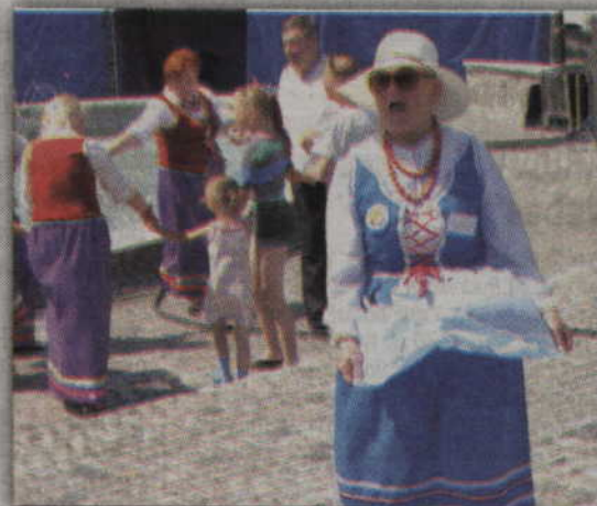
Czasem do dobrej zabawy nie potrzeba partnera.