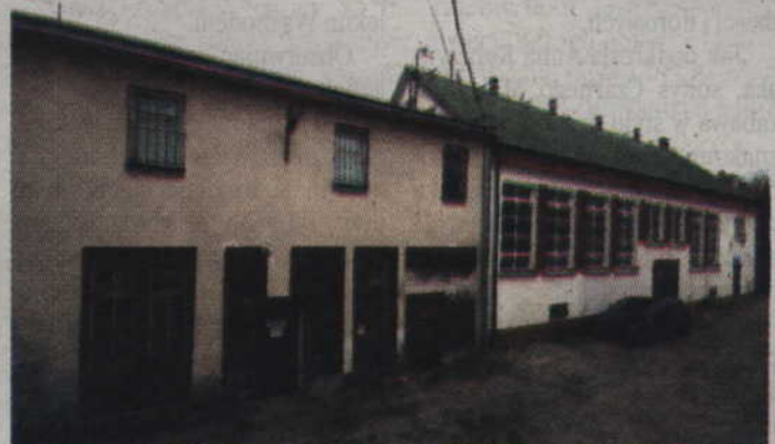
Ten szpitalny budynek, według zapewnień spółki EMC Instytut Medyczny, ma zmienić się w przychodnię specjalistyczną.

– Wydaje mi się, że było to później niż w marcu. W maju nie było mnie na posiedzeniu komisji, gdyż byłam oddelegowana do innych obowiązków służbowych poza Kwidzynem. Sprawdziłam procedurę jaka obowiązuje w tej kwestii i mam opinię prawną. Jeśli radny potrzebuje jakieś informacje, to przysługuje mu prawo do informacji publicznej i na zasadach ogólnych, wynikających z ustawy o dostępie do informacji publicznej. Może złożyć wniosek o udostępnienie interesujących go informacji. Wydawanie dokumentów, które są w naszych zbiorach, musi być rejestrowane. Po posiedzeniu komisji zdrowia poprosiłam o przekazanie radnemu wniosku z informacją, że radni są zwolnieni z takiej opłaty. Radny nie mógł być potraktowany