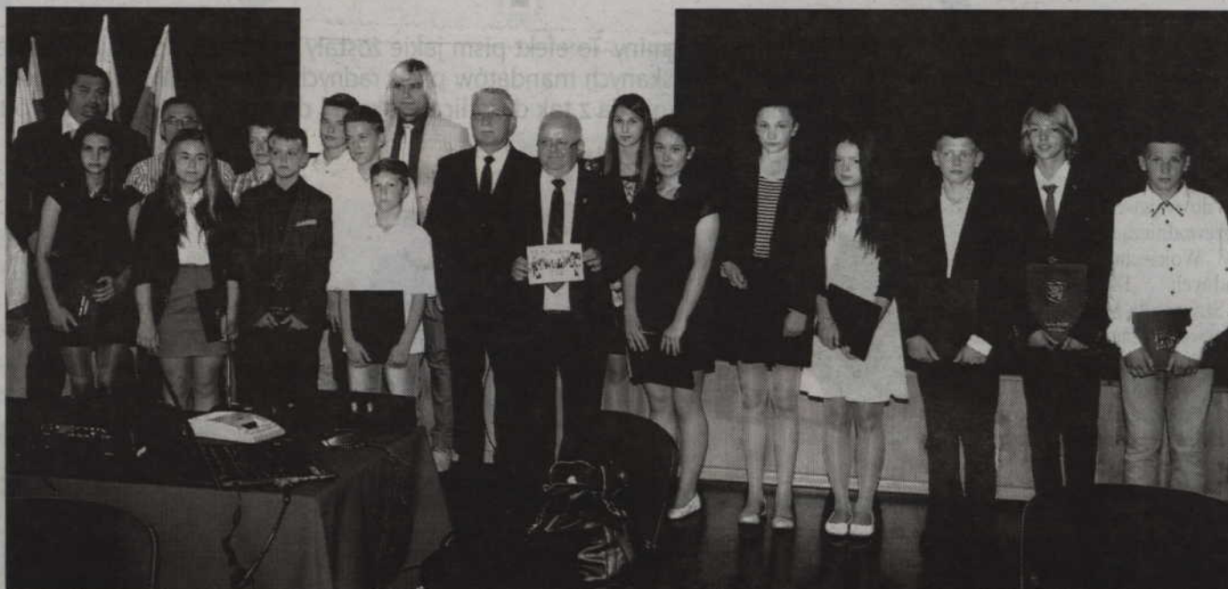
Wyróżnione Mistrzyni Polski w piłce ręcznej oraz wicemistrzowie Polski w unihokeju.

Od kilkunastu lat w Zespole Szkół w Gardeji funkcjonują klasy sportowe. Efekty ich działań widoczne są w postaci sukcesów odnoszonych zarówno na szczeblu powiatowym, wojewódzkim czy też ogólnokrajowym. Na ostatnią, przed wakacyjną przerwą, sesję rady gminy zaproszono gardejskie piłkarki ręczne, unihokeistów oraz ich trenerów. W listach gratulacyjnych, wręczonych wyróżnionym zawodnikom nie mogło zabraknąć słów odnoszących się do tego czym jest sport. Podkreślano, że uprawianie najróżniejszych dyscyplin sportowych kształtuje charakter, uczy wytrwałości, konsekwencji, a także odwagi.