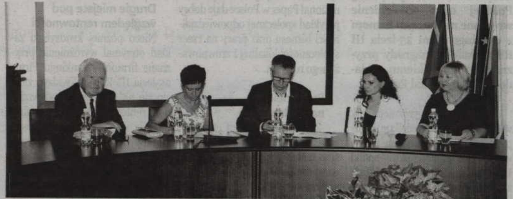
Podpisana umowa ma obowiązywać do końca sierpnia 2018 roku i będzie można ją przedłużyć.

-Jako firma technologiczna, która zatrudnia ok. trzystu inżynierów i techników różnej specjalności, jesteśmy jak najbardziej zainteresowani pozyskiwaniem absolwentów. Funkcjonujemy na rynku już 25 lat i aby robić kolejne kroki potrzebna jest nam mieszkanka młodości z doświadczeniem. Świat bardzo szybko się zmienia i musimy za nim nadążyć. Łatwiej jest to robić z ludźmi młodszymi,