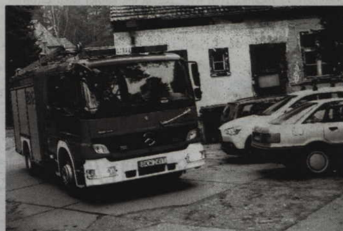
W ubiegłym roku ochotnicy reagowali 130 razy, wyjeżdżając do pożarów, wypadków drogowych, zawałów serca, a także dwóch porodów.