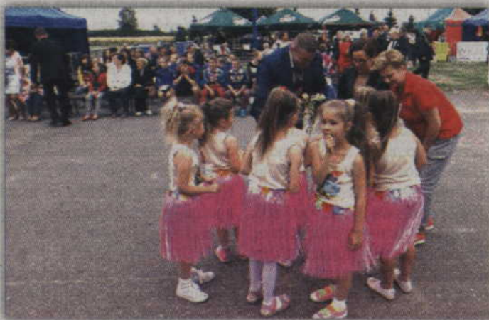
Swoje 5 minut miały również grupy taneczne z GOK Kwidzyn. Fot. Czesław Czyżewski red tech. BR