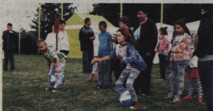
Najmłodsi chętnie uczestniczyli w przygotowanych konkurencjach.