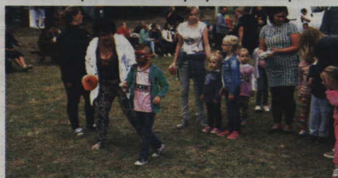
W poszczególnych konkurencjach dzieci były dopingowane przez dorosłych.