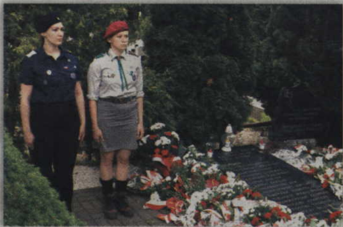
Uczestnicy uroczystości uczcili m.in. pamięć Janowiaków zamordowanych podczas II wojny światowej.