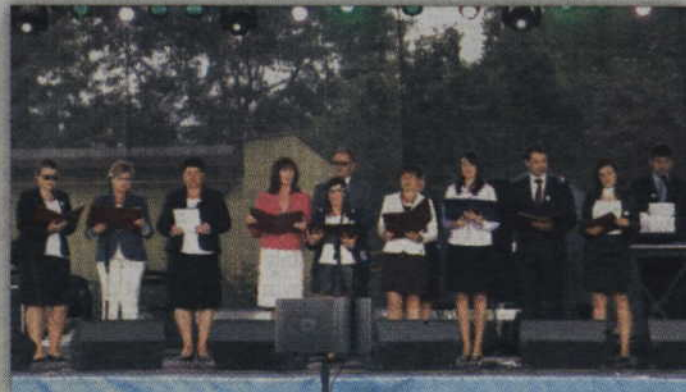
95-lecie Plebiscytu uczczono m.in. montażem słowno-muzycznym przygotowanym przez mieszkańców Janowa.

o randze wojewódzkiej, krajowej. Szkoda jednak, że tak niewielu parlamentarzystów chce z nami ten patriotyczny dzień, tą pamiątkę świętować.