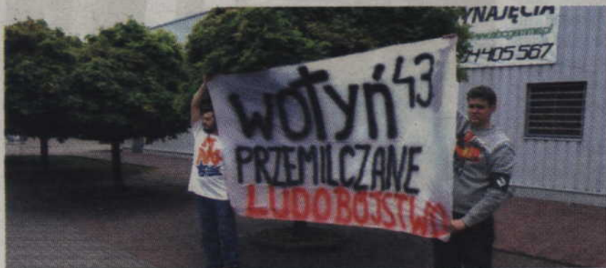
Członkowie ONR Kwidzyna przypominali mieszkańcom o tragedii sprzed lat.