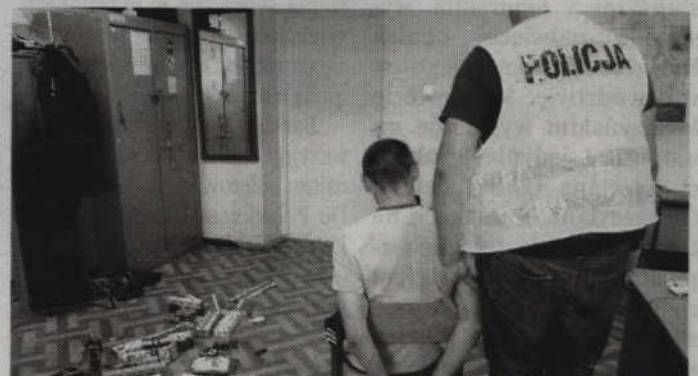
Dwaj sprawcy to mieszkańcy Kwidzyna w wieku 20 i 24 lat.

Zatrzymani mężczyźni to mieszkańcy Kwidzyna w wieku 20 i 24 lat. Obaj, w miniony wtorek (7 lipca), włamali się do kiosku znajdującego się przy ul. Słowackiego. Po wybiciu otworu w tylnej ścianie kiosku ukradli z niego papierosy, tytoń, zapalniczki, napoje w puszkach i pieniądze, o łącznej wartości około 6 tys. zł.