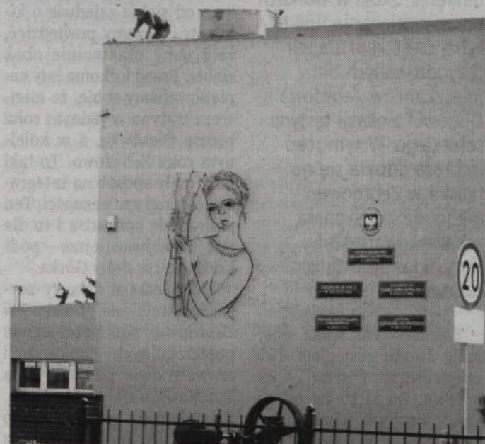
W budynku CKZiU wykonana zostanie pełna termomodernizacja oraz wymiana pokrycia dachowego.

Kolejną oświatową inwestycją dotyczy budynku Centrum Kształcenia Zawodowego i Ustawicznego przy ul. Staszica w Kwidzynie. Chodzi o budynek dawnego Zespołu Szkół Technicznych, a jeszcze wcześniej Technikum Mechanizacji Rolnictwa.