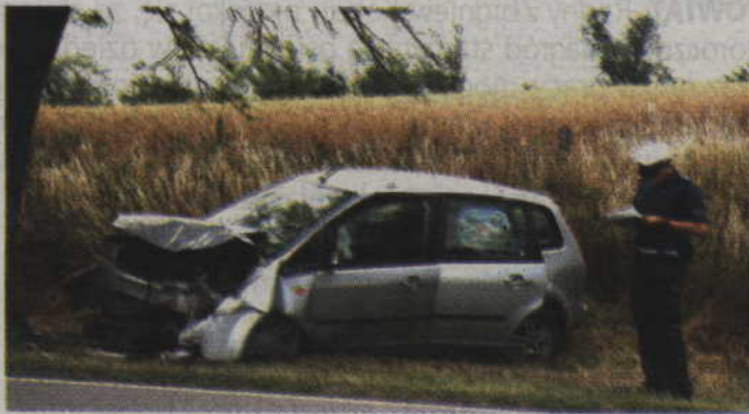
Do wypadku doszło na trasie pomiędzy Czachówkiem, a Ottówkiem.

Barszcz Sosnowskiego to inwazyjny chwast należący do rodziny selerowatych (Apiaceae). Do Polski został sprowadzony z Kaukazu pod koniec lat 50. XX wieku. W czasach stalinowskich rozpoczęto jego uprawę na wielką skalę, ponieważ miał służyć jako pasza dla bydła, jednak niedługo potem zaprzestano jego uprawy. Bardzo często rośnie w tych samych skupiskach, co barszcz olbrzymi (mantegazyj-