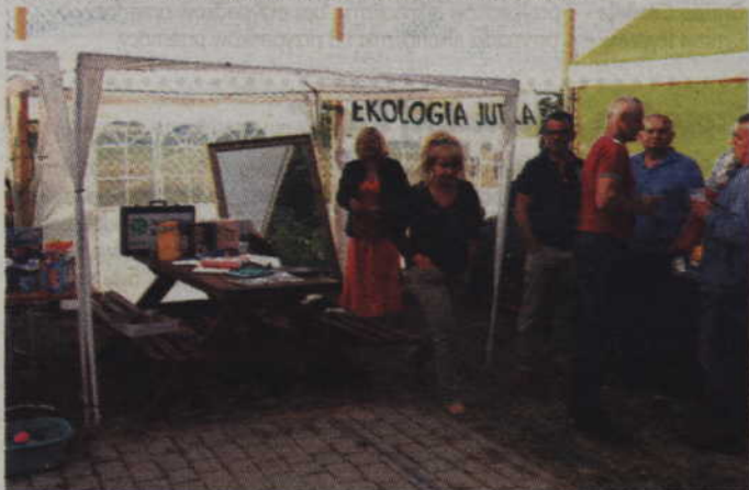
Impreza w Czarnem Dolnym była również okazją do zapoznania się z Ekologią Jutra.