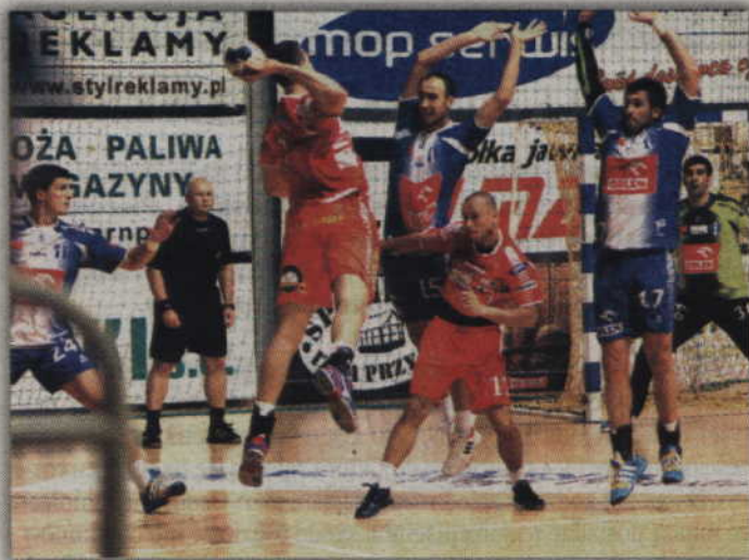
Gracze MMTS Kwidzyn rozpoczną swoje ligowe zmagania od pojedynku z Orlen Wisłą Płock.

PIŁKA RĘCZNA. Szczyptorniści MMTS Kwidzyn rozpoczęli przygotowania do nowego sezonu PGNiG Superligi Mężczyzn. Po-