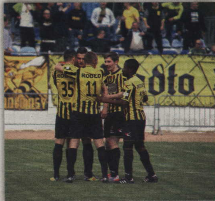
Pierwszy mecz sparingowy Rodła zakończył się pewną wygraną 3:0.