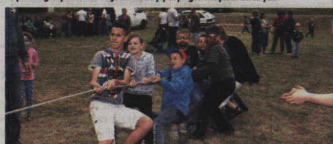
(RB) Przeciąganie liny wymagało od uczestników dużego wysiłku.