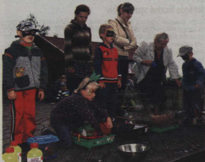
Podczas festynu można było m.in. pochwalić się swoimi pupilkami.