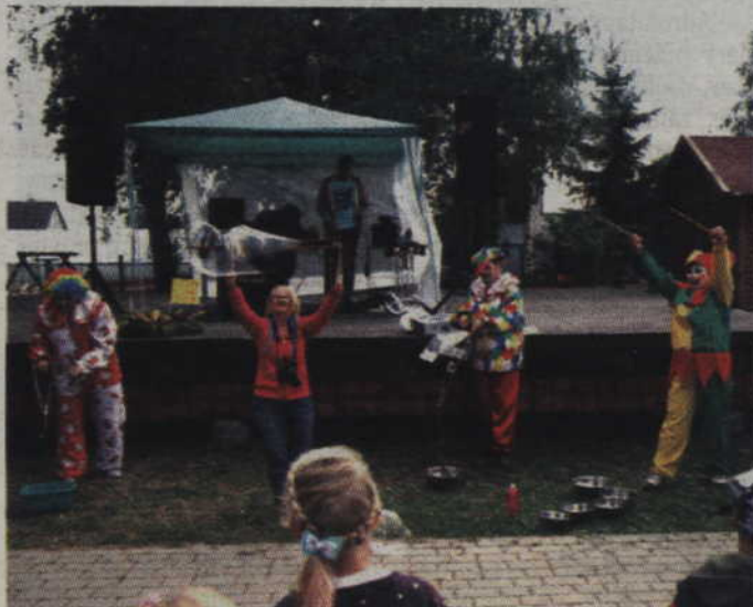
Zabawa z bańkami mydlanymi wzbudziła zainteresowanie nie tylko dzieci.