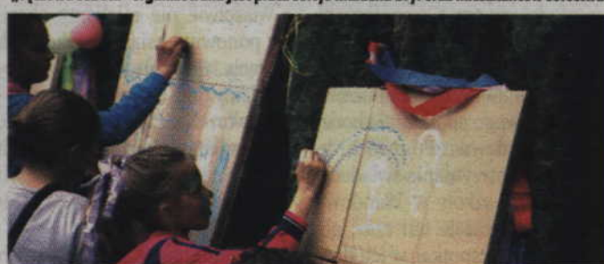
(RB) Najmłodsi mogli wykazać się m.in. swoimi plastycznymi zdolnościami.