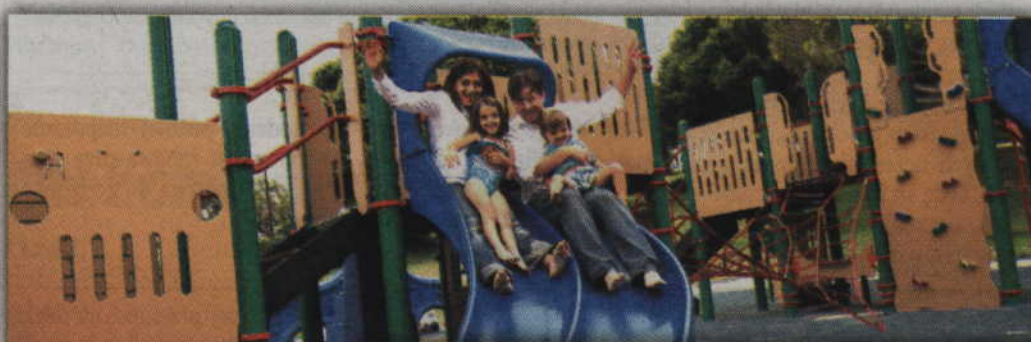
M.in. takie nowoczesne place zabaw pojawiają się w wielu polskich miasteczkach dzięki grantom przyznawanym w I edycji konkursu „TU MIESZKAM, TU ZMIENIAM”.

Wnioski o można składać przez internet do 26 lipca. Jednym kryterium dla składającego wniosek jest posiadanie osobowości prawnej, czyli i mogą składać je np.: fundacje, stowarzyszenia, biblioteki, domy kultury, parafie, muzea, kluby sportowe czy nawet Ochotnicza