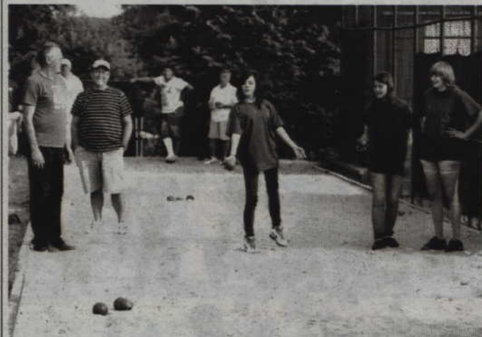
XXI Mistrzostwa Polski w bocce na piasku odbędą się 5 września.