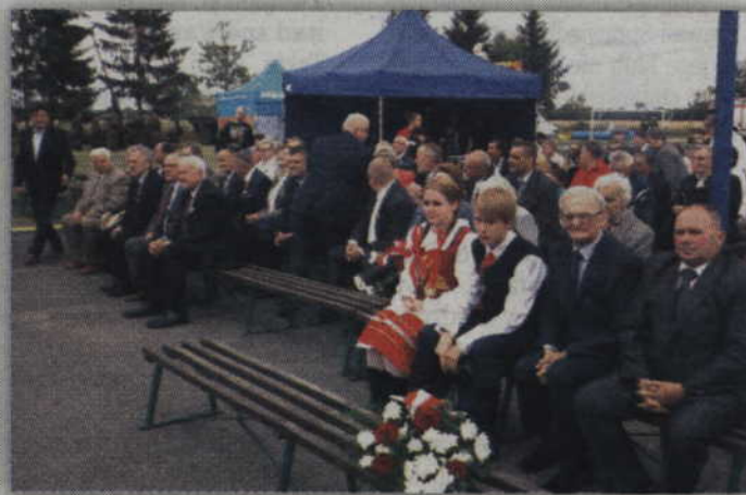
Do Janowa przyjechały delegacje z całego powiatu kwidzyńskiego.

- To nie tylko 95-rocznica rocznica i kolejne obchody, ale też wielkie znaczenie dla naszej małej lokalnej społeczności. Co 5 lat organizujemy uroczystości