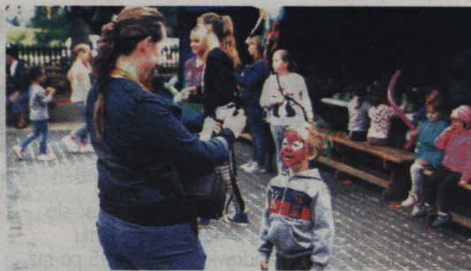
Efektownie pomalowaną twarz trzeba również uwiecznić na fotografii.

Chociaż rodzice, babcie i dziadkowie włożyli w organizację „Tęczowej soboty” mnóstwo energii i serca, nie byłoby jednak tego sukcesu gdyby nie dofinansowania z innych źródeł. W tym roku organizację festynu dziecięcego w Glinie wsparła fundacja „Działaj lokalnie”.