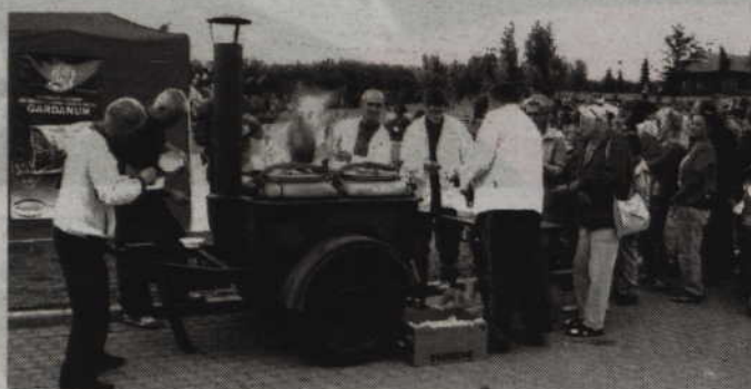
„Grochobiesiada” odbędzie się nad jeziorem „Kamień” w Gardai.

GARDEJA. Stowarzyszenie Miłośnicy Ziemi Gardejskiej „Gardanum” oraz Gminny Ośrodek Kultury w Gardai zapraszają na kolejną „Grochobiesiadę”. Impreza organizowana pod hasłem „Obudźmy moc gardejskiego kotła” odbędzie się nad jeziorem „Kamień” już w najbliższą sobotę, 18 lipca. Wstęp wolny. Patronatem medialnym tegorocznej imprezy jest „Kurier Kwidzyński”.