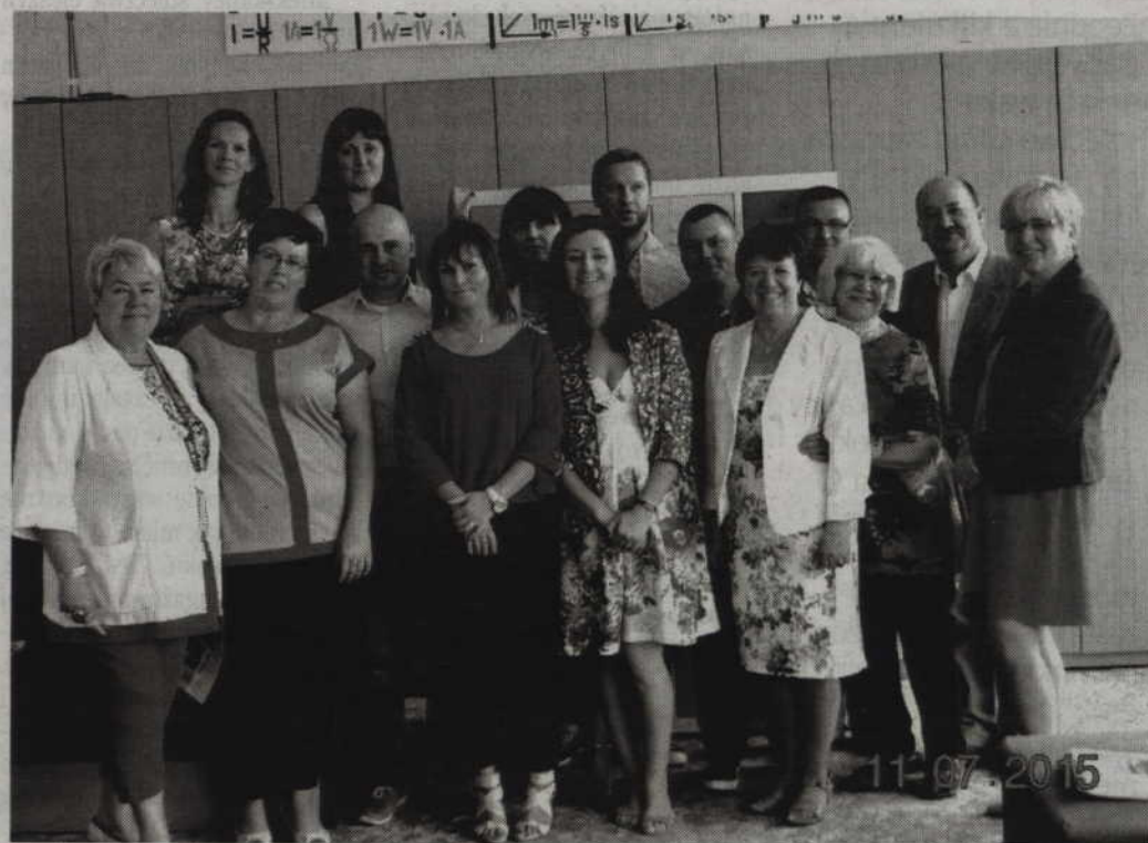
Wspólne zdjęcie absolwentów i nauczycieli szkoły w Wandowie.

Szkolne spotkanie po latach było okazją do zwiedzenia szko-