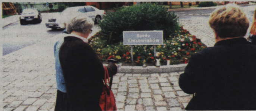
Członkowie kwidzyńskiego stowarzyszenia zapalili również znicze na Rondzie Kresowiaków.

PAMIĘĆ O TRAGICZNYCH LOSACH NASZYCH RODAKÓW NA KRESACH WSCHODNICH