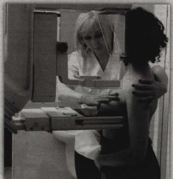
Badanie mammograficzne trwa kilka minut i polega na zrobieniu 4 zdjęć rentgenowskich.

Jak podkreśla firma LUX MED Diagnostyka z badań mammograficznych mogą również skorzystać panie z grup wiekowych: 40-49 lat oraz 70-75 lat. Badania te wykonywane są w ramach Projektu „Poprawa dostępności i jakości usług medycznych w ramach Populacyjnego Programu Wczesnego Wykrywania Raka Piersi” współfinansowanego z funduszy EOG i Norweskiego Mechanizmu Finansowego. W tym przypadku wymagane jest