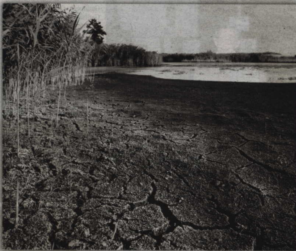
W dużym zbiorniku wody w pobliżu Szczepkowa (gm. Gardeja) woda praktycznie wyschła.

- Na szczęście nie ma zagrożenia w dostarczaniu wody do odbiorców. Pojawiające się