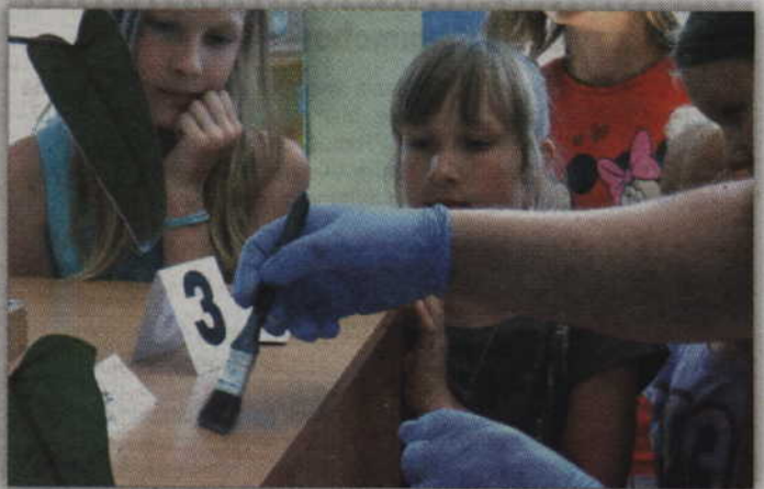
Odkrywanie śladów budziło zainteresowanie małych detektywów.