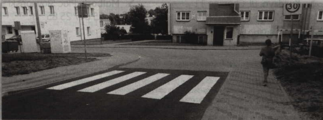
Ulica Ogrodowa została już wyremontowana.