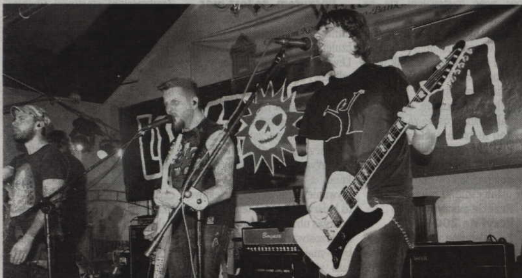
Jedną z gwiazd tegorocznego festiwalu będzie zespół Luxtorpeda.

GNIEW. Wielkimi krokami zbliża się XIX Międzynarodowy Festiwal Muzyki Chrześcijańskiej Gospel Camp Meeting Gniew 2015. Na muzycznej scenie, obok gospelowych wykonawców wystąpią w tym roku Bajm i Luxtorpeda. Wstęp wolny.