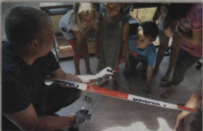
Podczas zajęć maluchy dowiedziały się jak zabezpieczyć znalezione ślady.

Niestety dzieciom nie udało się wykryć sprawców.