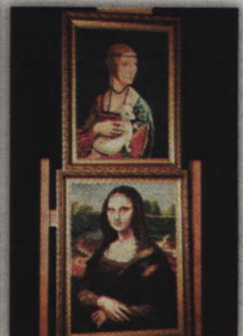
Jedne z prezentowanych dzieł.