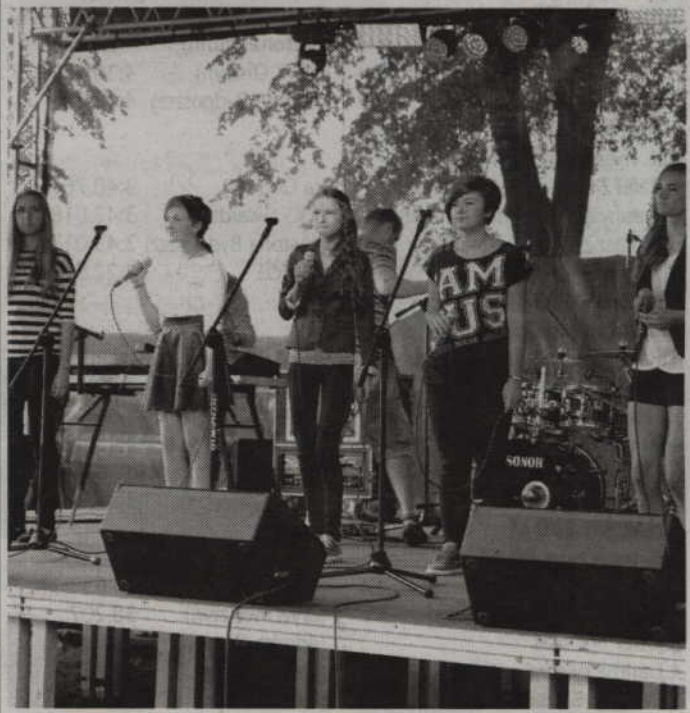
Podczas imprezy w Korzeniewie wystąpi m.in. grupa „Pas de Nom” - zespół wokalny z GOK Kwidzyn.

Organizatorzy przygotowali wiele atrakcji i niespodzianek, jak np.: koncert pieśni patriotycznych i wojskowych czy Motorowodne Mistrzostwa Okręgu Północno-Wschodniego. Z myślą o dzieciach wystąpią natomiast aktorzy Teatru „Barnaby” z Gdańska, którzy prezentują znaną i lubianą bajkę o Czerwonym Kapturku. Dla nieco starszych na scenie wystąpią natomiast gwiazdy wieczoru: zespół „Verdis” (disco-polo) oraz Eleni.