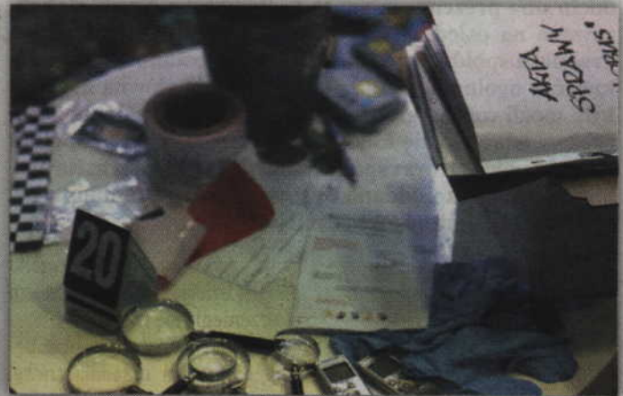
Akcesoria detektywistyczno-policyjne wykorzystywane przez uczestników zajęć.