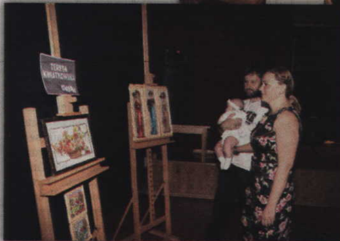
Wystawa intrygowała zarówno starszych, jak i tych całkiem młodych.