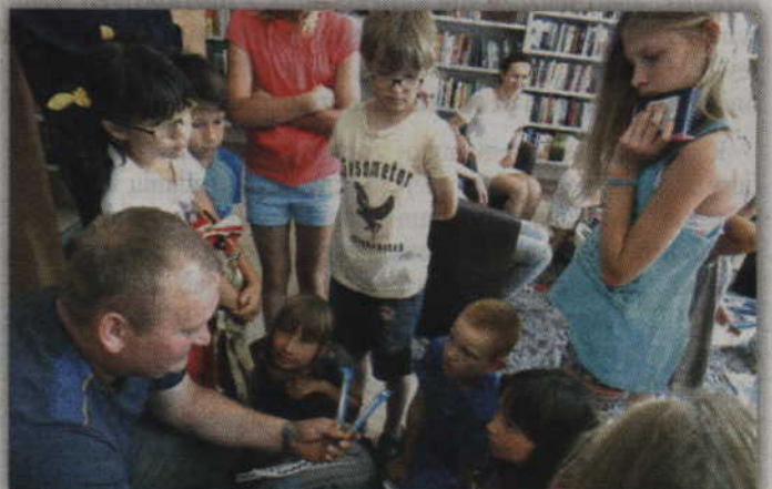
Dzieci podczas zajęć z technikiem kryminalistyki.

sywali zarówno to co działo się w obydwu grupach, jak i relacjono-