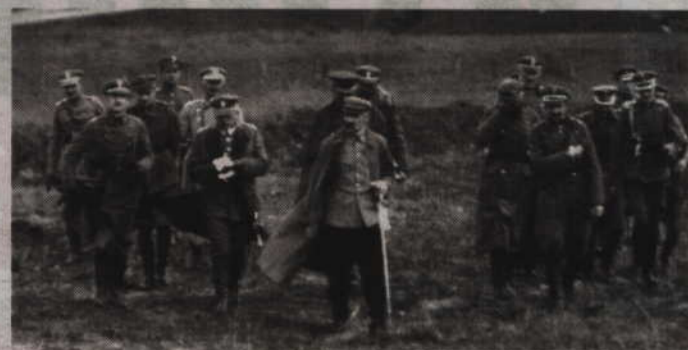
Historycy wymieniają Józefa Piłsudskiego wśród zwycięzców 27 największych bitew w dziejach świata.