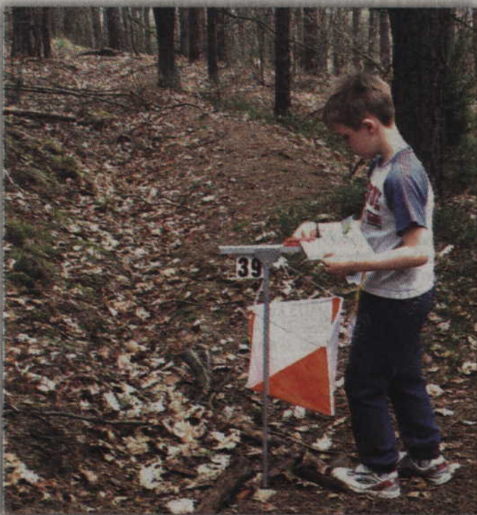
Trzydniowe zawody będą wyzwaniem zarówno dla profesjonalistów jak i amatorów biegania z mapą.