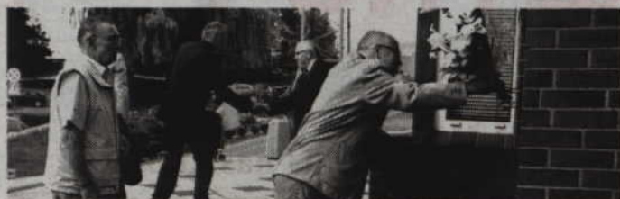
Złożenie kwiatów pod tablicą pamiątkową przypomni ofiary pobicie internowanych, do której doszło w kwidzyńskim Zakładzie Karnym.

KWIDZYN. W najbliższy piątek, 14 sierpnia, przypada XXXIII rocznica pobicie internowanych w kwidzyńskim Zakładzie Karnym. Tego dnia odbędzie się też uroczystość upamiętniająca ofiary pacyfikacji. O godzinie 12.00 nastąpi złożenie kwiatów pod tablicą pamiątkową znajdującą się przy Zakładzie Karnym, przy ul. Lotniczej. Zachęcamy mieszkańców do wspólnego uczczenia tego wydarzenia. (fóx)