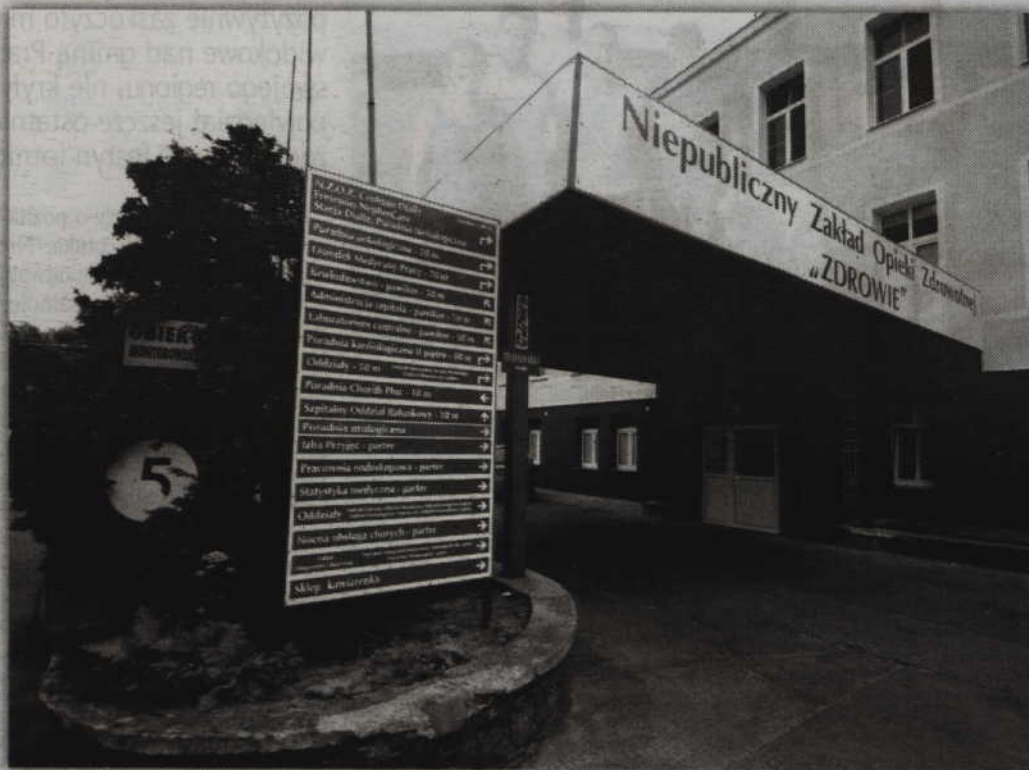
Spółka EMC Instytut Medyczny zapewnia, że wszystkie plany, przedstawione kilka miesięcy temu, będą realizowane.

- Jest ono zainteresowane utrzymaniem oddziału terenowego w Kwidzynie. Chce partycypować w kosztach budowy i ma na to środki. Nie wiadomo jednak jeszcze kiedy barak przy szpitalu zostanie wyburzony, gdyż budowa nowej przychodni zależeć będzie od zapewnienia kontraktów związanych ze