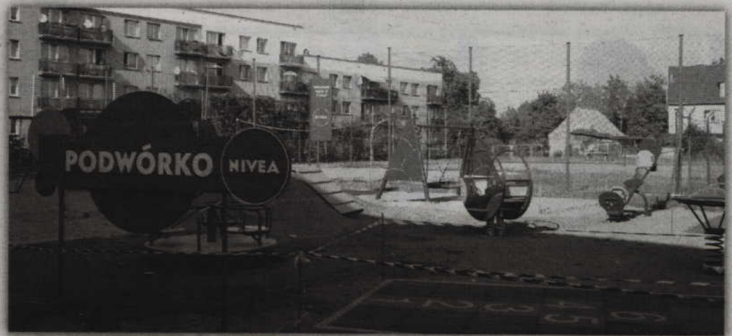
Plac zabaw zostanie otwarty już za kilkanaście dni.

Jak podkreśla nasza rozmówczyni, powstający w Prabutach plac zabaw będzie inny niż dotychczas budowane. Będzie