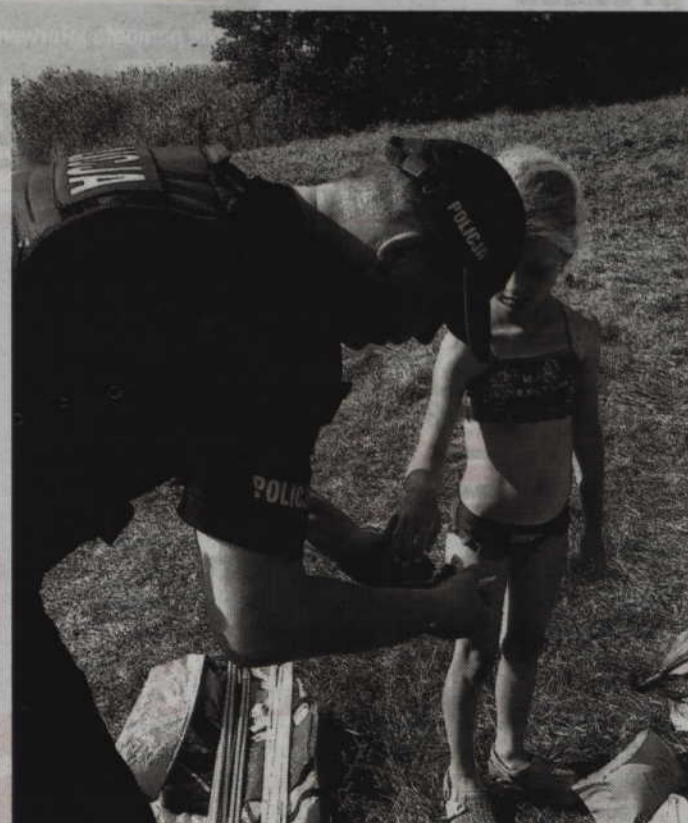
Funkcjonariusze rozdali dzieciom opaski, które pozwolą na szybkie dotarcie do ich opiekunów. (f)

W ramach prowadzonych działań, prabucy policjanci rozdają opaski na ręce – identyfikatory, które w przypadku zagubienia się dziecka umożliwią szybkie dotarcie opiekunów.