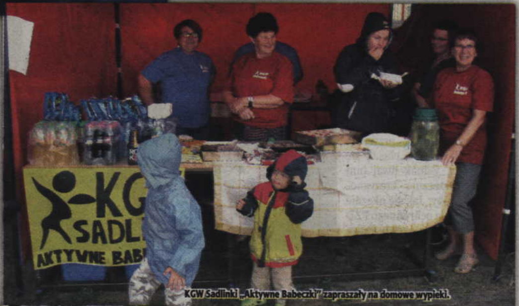
KGW Sadlinki „Aktywne Babeczki” zapraszały na domowe wypieki.