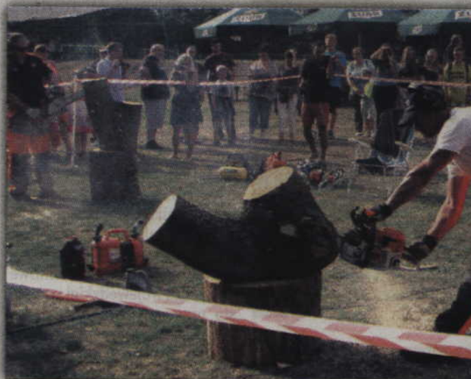
Speed carving to widowiskowa praca z drewnem.