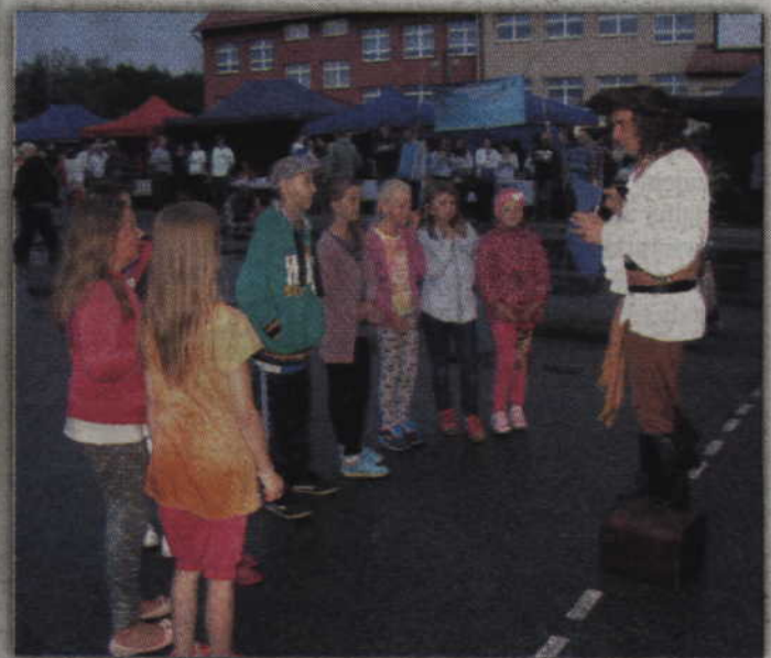
Jak pirat to i zagadki związane z morzem.