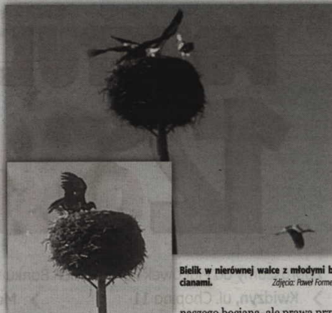
Bielik w nierównej walce z młodymi bocianami.

Jak nas informuje mieszkaniec Gliny, wizyty orłów bielików w tej wsi nie były rzadkością. Już wcześniej widywano te potężne ptaki jak siedziały na drzewach w niewielkim zagajniku, który przez mieszkańców jest nazywany Małpim Gajem. W tym miejscu bieliki widywał również bohater naszej opowieści.