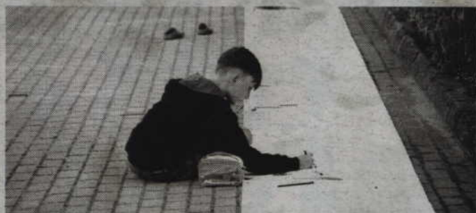
Podczas imprezy pomyślano również o najmłodszych uczestnikach zabawy.