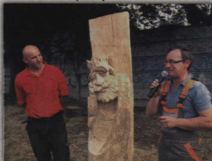
Michał Grzymalski wyrzeźbił postać dobrotliwego króla.

- Tematem przewodnim tegorocznego pleneru był świat baśni,