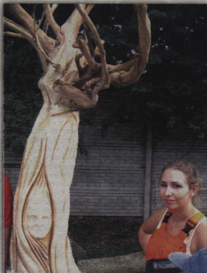
Matka Wierzb autorstwa Ewy Łozińskiej.