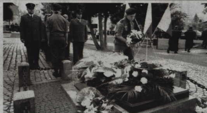
Kwidzyńskie uroczystości odbędą się na Skwerze Komatantów przy ul. Warszawskiej.