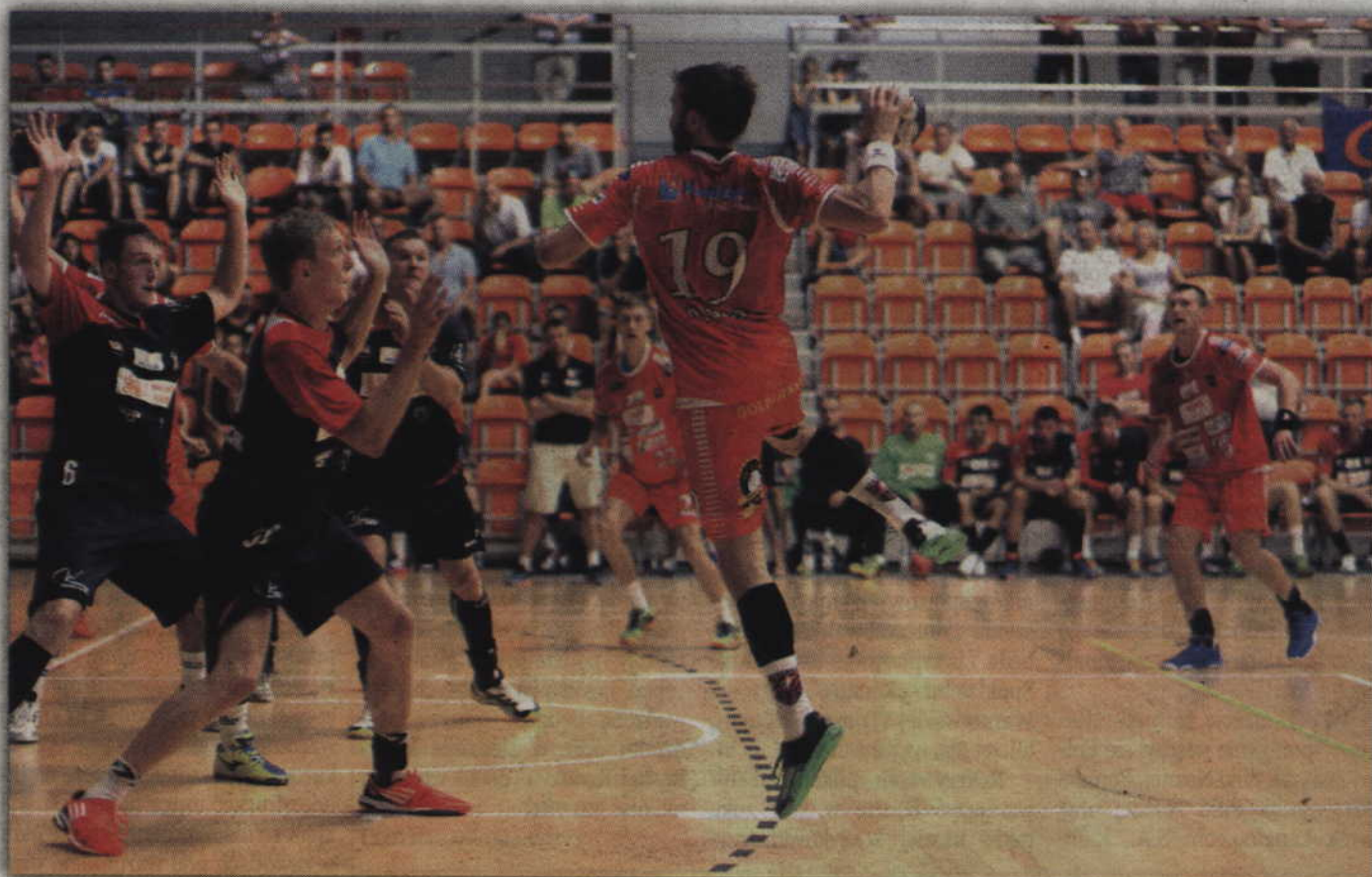
W walce o finał kwidzynianie ulegli I-ligowcom z gdańskiego Wybrzeża 18:16.