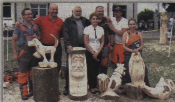
Wspólne pamiątkowe zdjęcie na zakończenie pleneru.