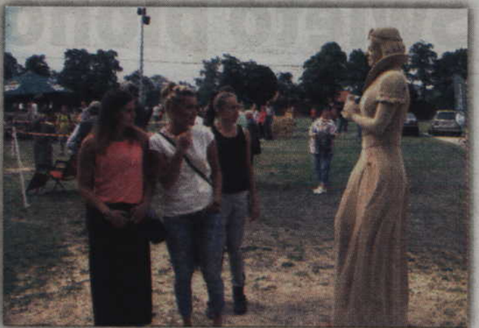
Królowa Śnieżka wzbudziła zainteresowanie publiczności.