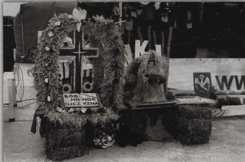
Podczas imprezy nie zabraknie oczywiście konkursu na najpiękniejszy wieniec dożynkowy.

GARDEJA. Wójt gminy Gardeja oraz Gminny Ośrodek Kultury zapraszają na Dożynki Gminne czyli tradycyjne święto plonów. Impreza odbędzie się w najbliższą niedzielę - 30 sierpnia, w amfiteatrze nad jeziorem Kamień. Wstęp wolny.