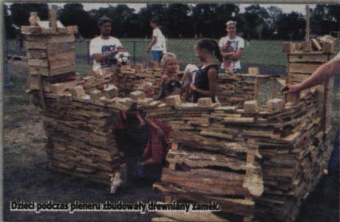
Dzieci podczas pleneru zbudowały drewniany zamek.