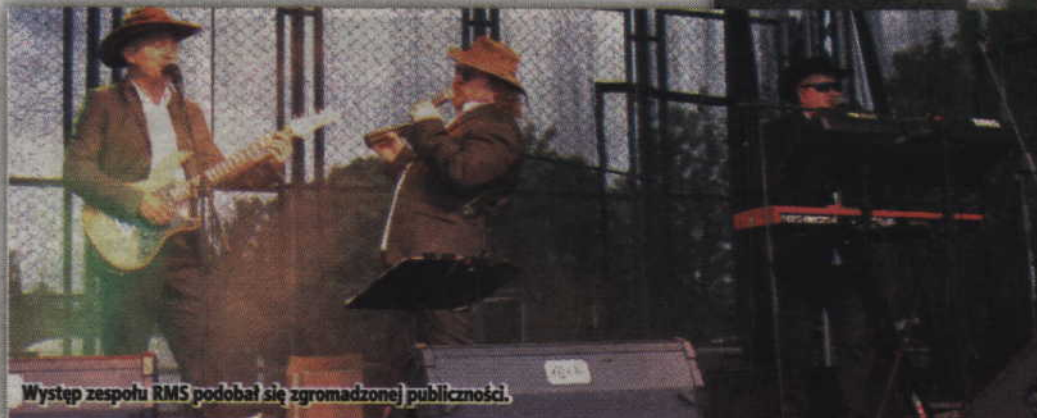
Występ zespołu RMS podobał się zgromadzonej publiczności.