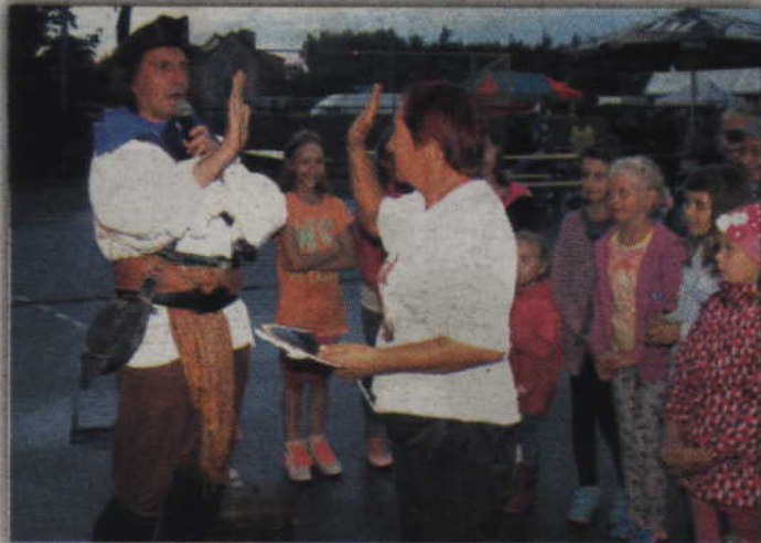
Pirat z teatru Qufer bawił nie tylko dziecięcą publiczność.