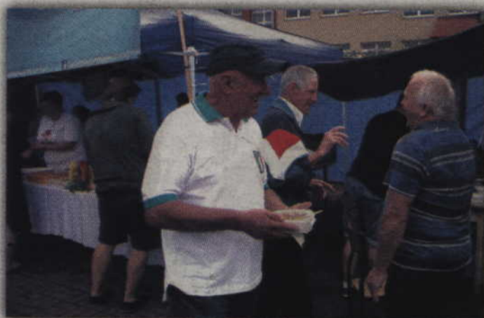
Grochówka smakowała w wymienicie.