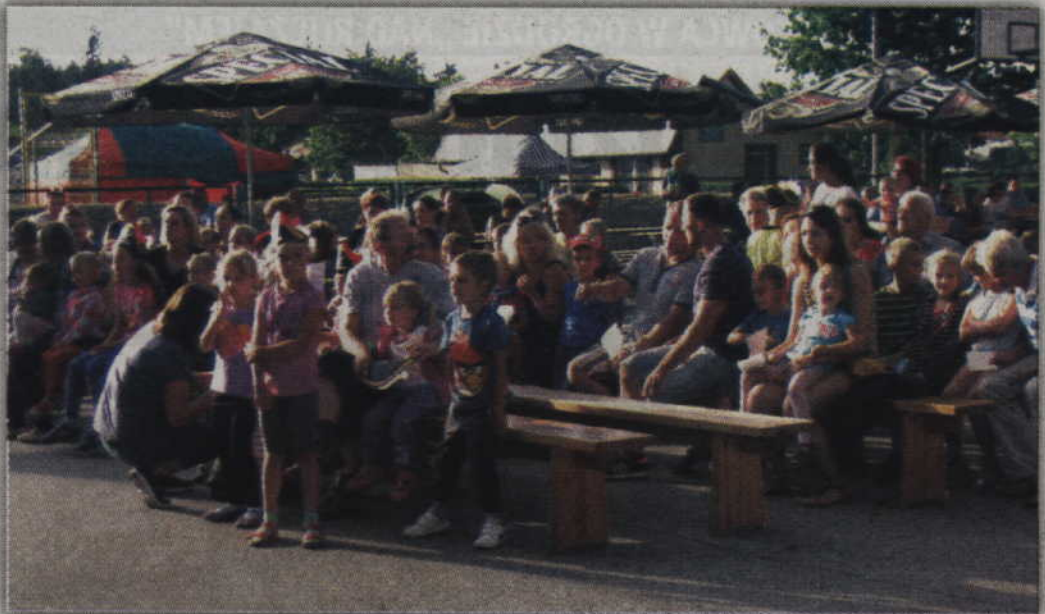
Początkowo festynowi towarzyszyła słoneczna aura.