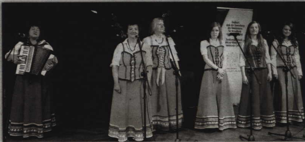
O dobrą zabawę na dożynkach zadbają m.in. panie z zespołu „Cyganeczki”.

Święto plonów w gminie Ryjewo tym razem odbywać się będzie na terenie sołectwa Rudniki. Uroczystości rozpoczną się jednak w Jarzębinie, gdzie o godzinie 14.00 w tamtejszej kaplicy