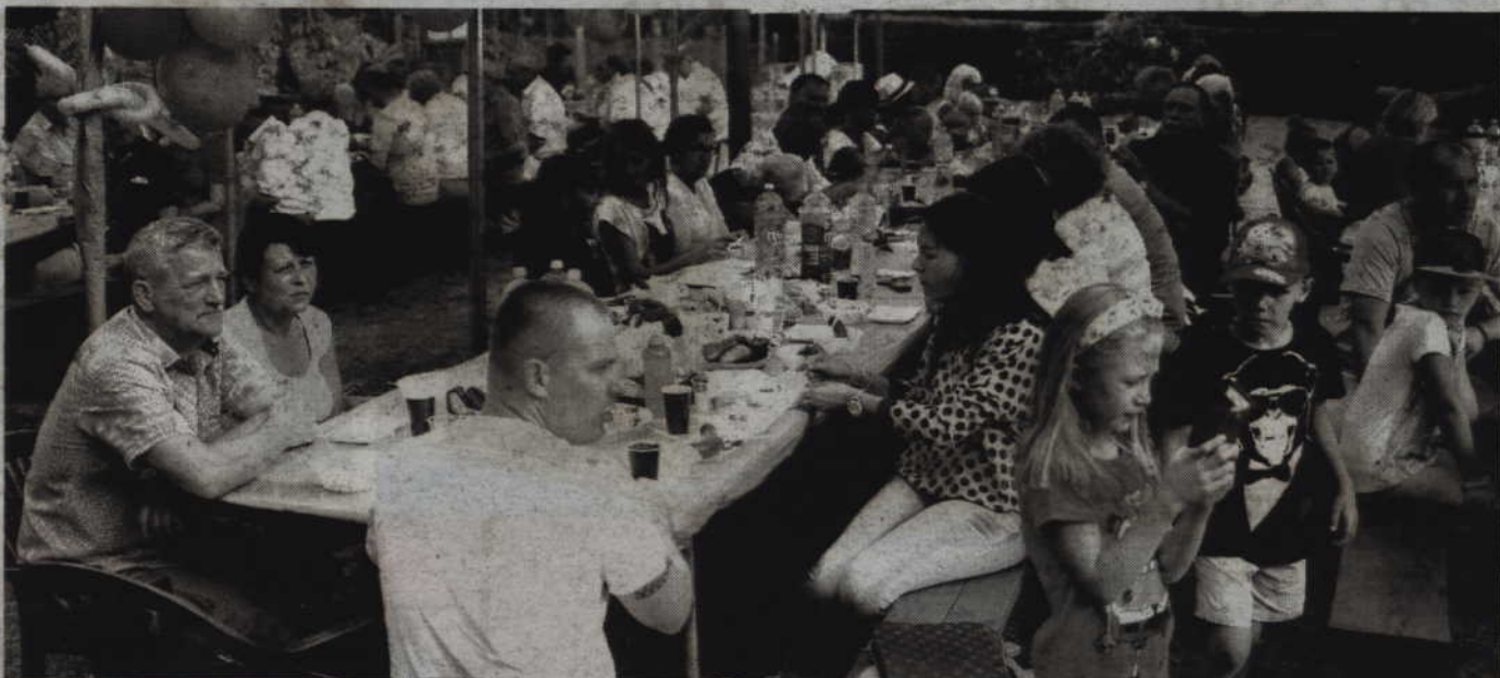
Dzień Działkowca to znakomita okazja do wspólnej zabawy i integracji z innymi właścicielami działek.