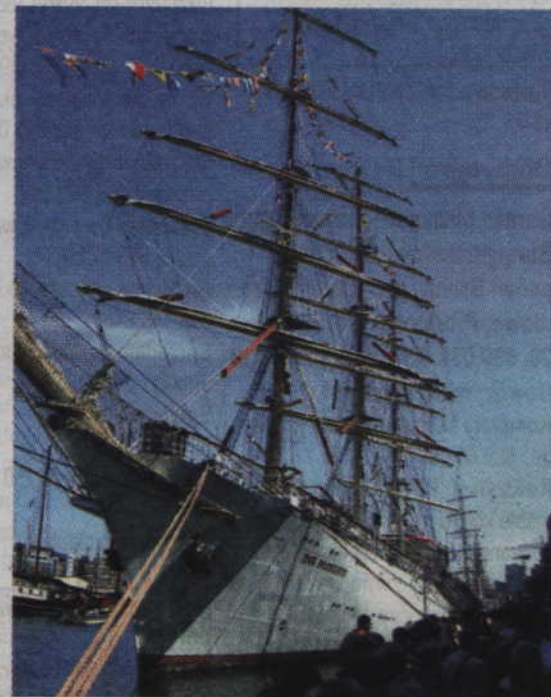
Dar Młodzieży w Sail Amsterdam.

Sail Amsterdam trwała od 19 sierpnia do 23 sierpnia. Rozpoczynając imprezę parada statków i żaglowców Sail-in Parade była w tym roku dwa razy dłuższa niż w trakcie poprzedniej edycji w 2010 r. Wielkie morskie święto Amsterdam organizuje co 5 lat. Pierwszy zlot w 1975 roku, uświetniał obchody 700-lecia miasta. W tegorocznej, 9 edycji, wzięła udział imponująca flotyła żaglowców, z największymi na świecie, rosyjskimi „Sedowem” i „Kruzenszternem”, wielką chilijską barkentyną „Esmeralda”, egzotycznymi „Tarangini” z Indii czy „Guayas” z Ekwadoru, kilkoma replikami historycznych żaglowców od średniowiecznej kogi po XVIII wieczną fregatę - w sumie pojawiły się żaglowce reprezentujące 5 kontynentów.