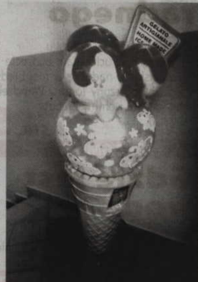
Skradzony automat policjanci odnaleźli w mieszkaniu jednej z kobiet.