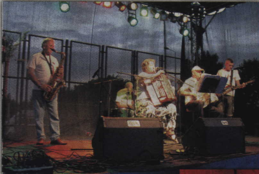
Na scenie „Sami Swol” z Rypina.