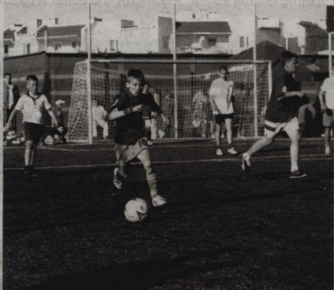
Osiedlowy turniej „Renawy” odbędzie się już po raz 21.

W organizację turnieju „Renawy” ponownie włączył się Polski Związek Piłki Nożnej, Pomorski Związek Piłki Nożnej oraz firma Langloo.com S.A., które