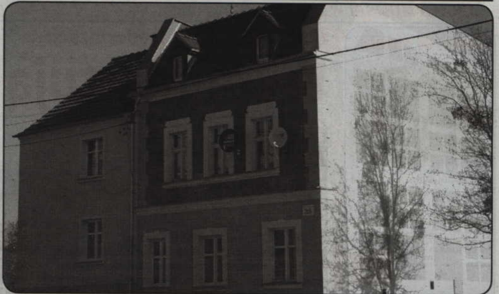
Jedna z kamienic wyremontowana przez samorząd miasta.

Trwają remonty kamienic należących do wspólnot, w których miasto jest w części właścicielem. Kilka budynków zostanie podłączonych do miejskiej sieci ciepłowniczej. W pozostałych wykonane zostaną remonty dachów i elewacji. W tegorocznym budżecie znajduje się 800 tys. zł jako udział miasta w remontach zaplanowanych przez wspólnoty mieszkaniowe. Remonty obejmą także budynki w całości należące do miasta.