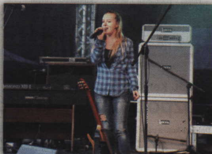
Na scenie wystąpiła uczestniczka polsatowskiego programu Tylko Muzyka.