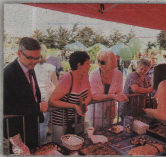
Na dożynkach nie zabrakło domowych wypieków.