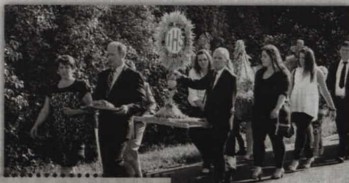
Podczas dożynek nie zabraknie oczywiście konkursu na najpiękniejszy wieniec dożynkowy.

Podczas imprezy odbędzie się wystawa prac artystów, rzemieślników i rękodzielników z Powiśla, natomiast w miejscowych pracowniach trwać będą pokazy i warsztaty wiejskich rzemiosł, sztuki ludowej i rękodzieła (warsztaty hafciarskie, warsztaty rzeźbiarskie, warsztaty garncarskie oraz warsztaty wikliniarskie). Uczestnicy dożynek