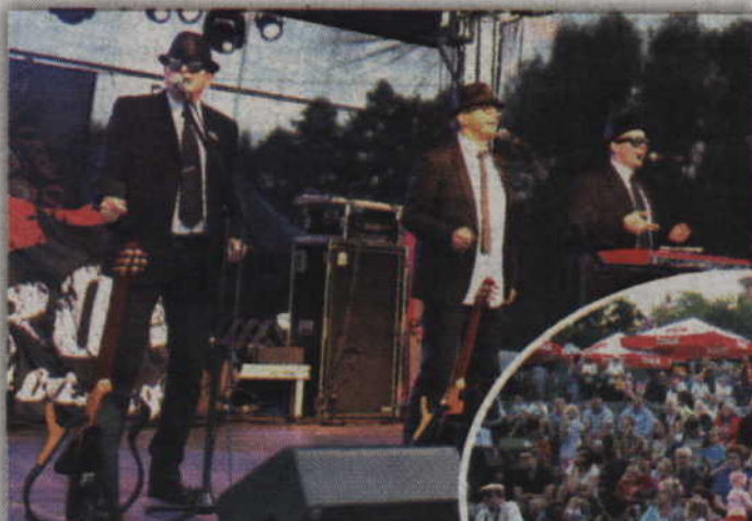
Kabaret OT.TO rozbawił kwidzyńską publiczność.