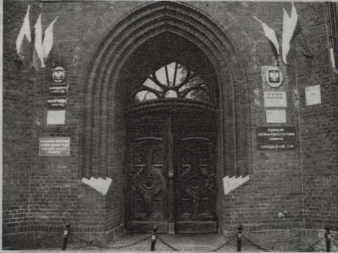
Zabytkowe drzwi odzyskują dawny blask

POWIAT. Samorząd powiatu zamierza dofinansować odnowę zabytkowych drzwi w budynku przy ul. Grudziądzkiej w Kwidzynie. W gmachu po dawnej jednostce wojskowej swoje siedziby mają Urząd Gminy Kwidzyn, Powiatowy Urząd Pracy i Powiatowe Centrum Pomocy Rodzinie.