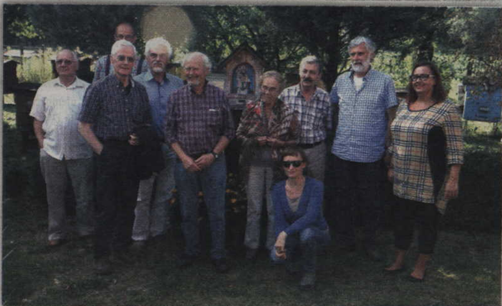
Wspólne pamiątkowe zdjęcie na zakończenie wizyty w pasiece w Rozpędzinach.

nawiązania szerszej współpracy z kolegami zza Odry. Ponadto, goście z Niemiec urzekła gościnność i bardzo sympatyczna atmosfera towarzysząca ich pierwszej wizycie. (RB)