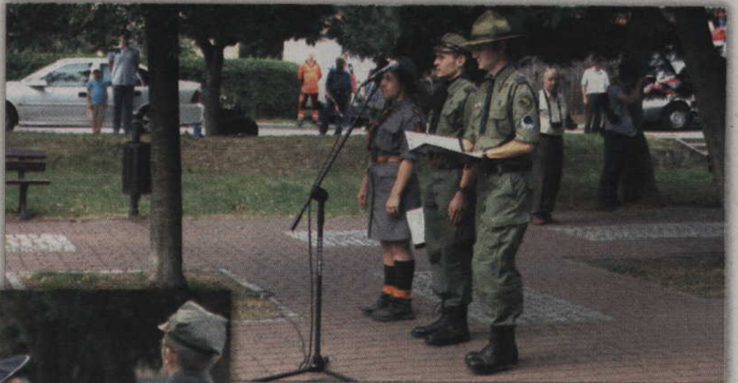
Uroczystości przy Skwerze Kombatantów poprowadzili kwidzyńscy harcerze.