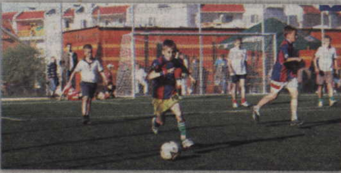
Osiedlowy turniej „Renawy” odbędzie się już po raz 21.

Rozgrywkom piłkarskim towarzyszyć będzie w tym roku także turniej koszykówki trzyosobowej, który odbędzie się 26 września. Rywalizacja przebiegać będzie w trzech kategoriach (szkoły podstawowe, gimnazja, „open”), a zapisy chętnych prowadzone będą w biurze Spółdzielni oraz w siedzibie klubu Basket Kwidzyn (do 18 września tel. 666 321 781).