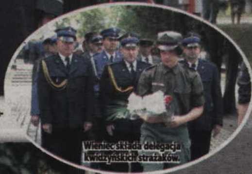
Wieniec składa delegacja kwidzyńskich strażaków.