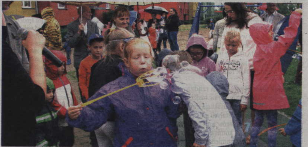
Puszczanie mydlanych baniek było fajną zabawą