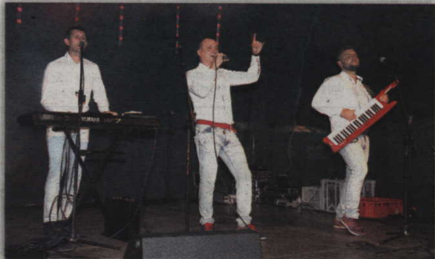
Artyści zagraли swoje największe hity.