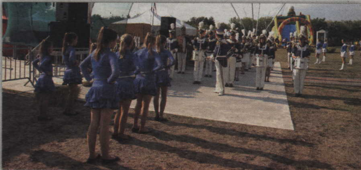
Występ orkiestry Helikon podobał się publiczności.