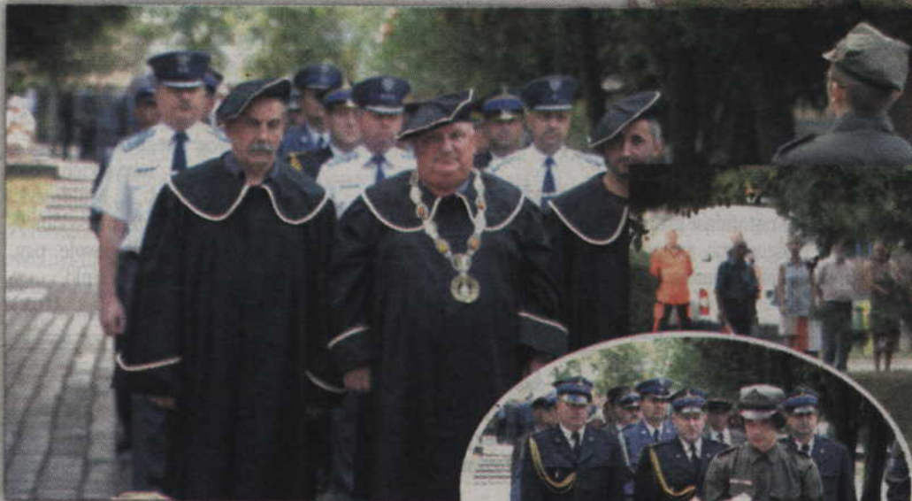
Przedstawiciele Powiślańskiej Szkoły Wyższej oddali hołd bohaterom walk o wolną Polskę.