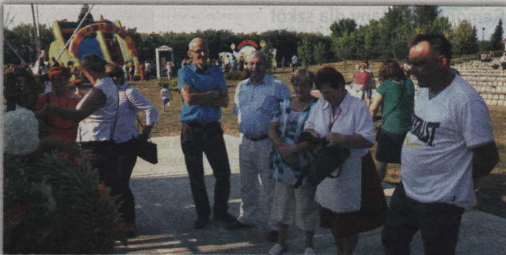
Publiczność także oceniała wieńce dożynkowe.