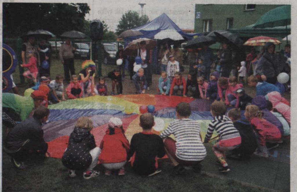
Zabawy z kolorową chustą urozmaiciły dziecięcy festyn