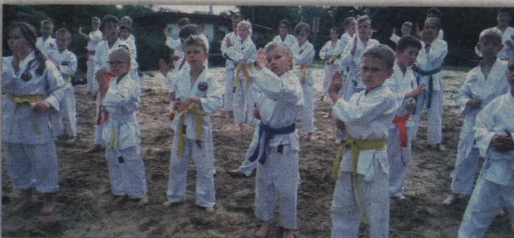
Dzieci poznawały techniki karate podczas wakacyjnego biwaku.

KARATE. Zawodnicy Kwidzyńskiego Klubu Karate i Samoobrony Jiu-Jitsu niezwykle pracowicie spędzili tegoroczne wakacje. Wzięli bowiem udział w biwaku, dojeżdżając do sali klubowej na techniki specjalistyczne organizowane pod kątem przyszłych zawodów sportowych.