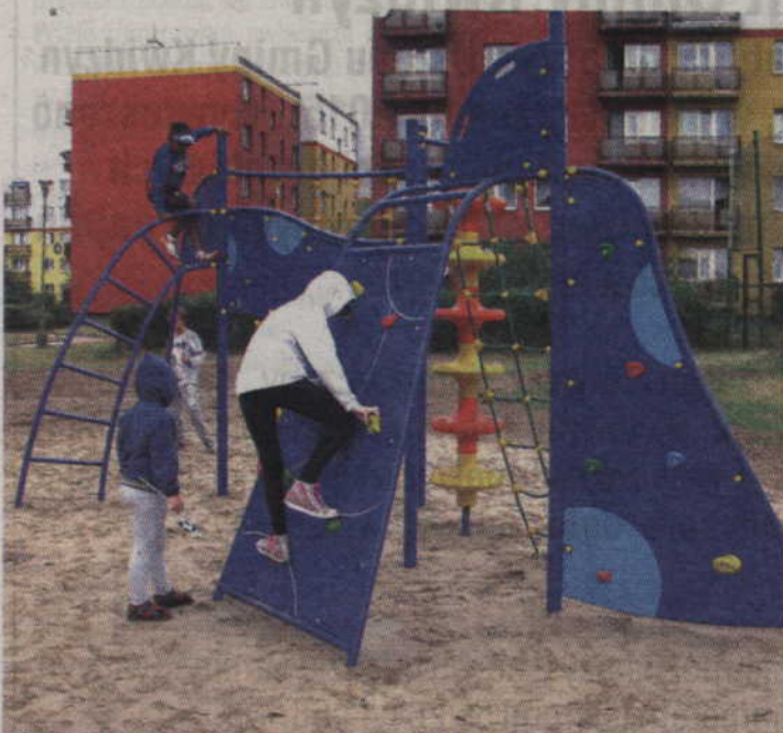
Coś dla małych alpinistów