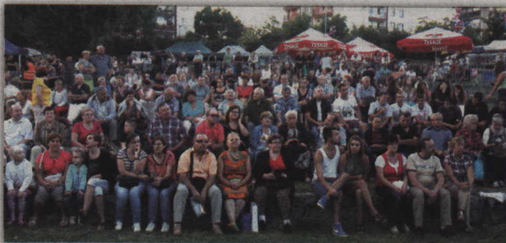
Publiczność w tym roku tłumnie pożegnała lato nad Liwą.