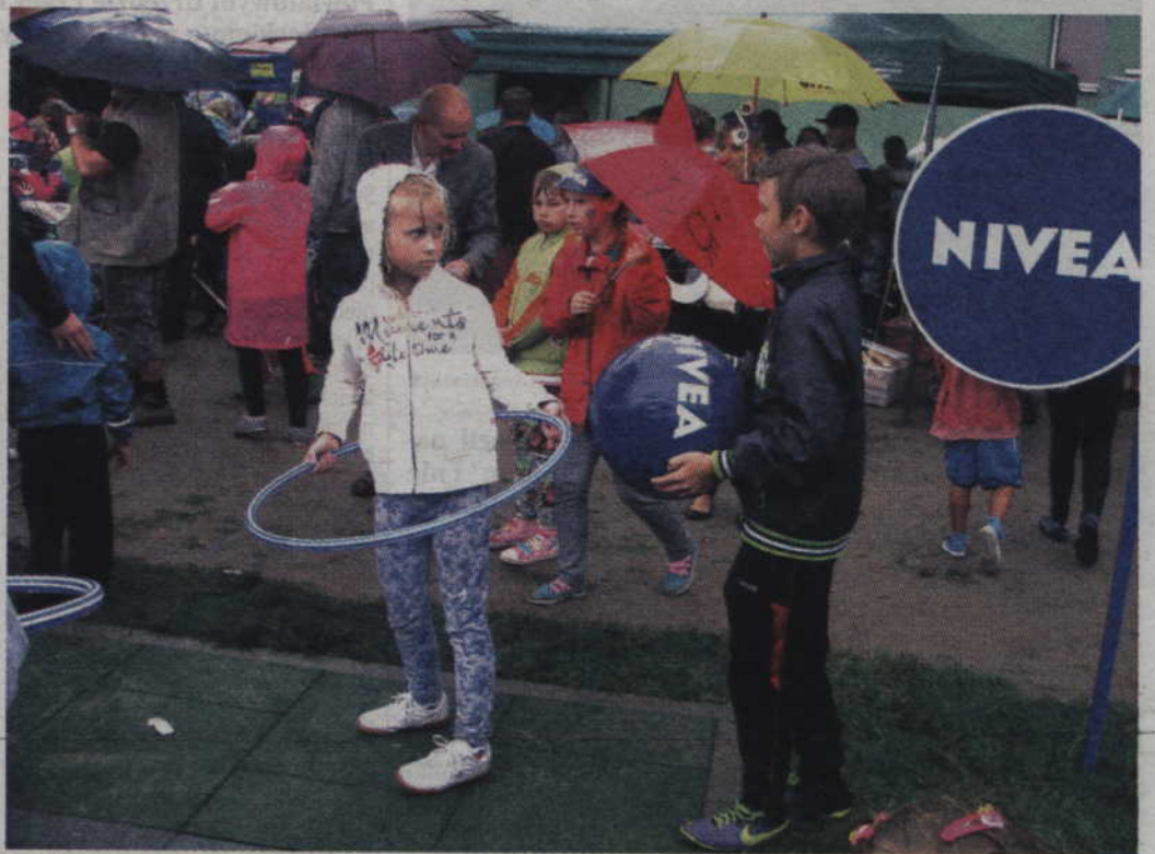
Dzieciom deszcz wcale nie przeszkadzał

(RB) Puszczanie mydlanych baniek było fajną zabawą