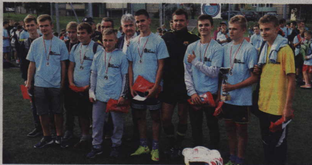
W grupie starszej zwyciężył zespół „Abdulkadziary”.

Trzy najlepsze drużyny w każdej kategorii wiekowej otrzymały pamiątkowe puchary oraz medale. Wszystkim wymienionym drużynom wręczono natomiast nagrody rzeczowe, a każdy z