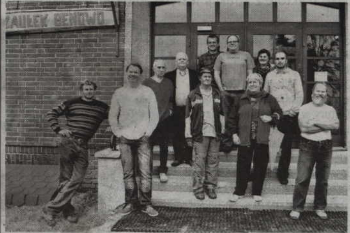
Wspólna fotografia uczestników pleneru w Benowie.

GARDEJA/BENOWO. Raz w roku gardejscy artyści ludowi, rzeźbiarze i malarze spotykają się na plenerze rzeźbiarsko-malarskim. W tym roku pasjonaci farb, sztalug i rzeźbiarskiego dłuta wyjechali do Benowa w gminie Ryjewo. Tam, przez trzy dni ciężko pracowali.