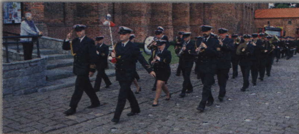
Orkiestra Morskiego Oddziału Straży Granicznej w Gdańsku.