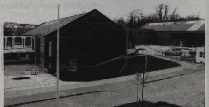
Otwarcie kwidzyńskiego Parku przewidziane jest w połowie października.

-Uchwaliliśmy też regulamin na podstawie którego będzie można sprzedać działki. Zarząd będzie mógł dokonać sprzedaży na podstawie ustawy o gospodarce nieruchomościami z 1997 roku. Wszystkie uchwały zostały podjęte jednogłośnie. Jest więc zgoda wszystkich wspólników i można się z tego cieszyć. Zarząd spółki poinformował nas, że 90 proc. Powierzchni Centrum Energii Odnawialnej jest już wynajęta, a jeśli chodzi o Inkubator Przedsiębiorczości, wynajętych zostało ok. 30 proc. Powierzchni. Powodem są inne oczekiwania niż to co początkowo zaproponowała spółka. Pomieszczenia o powierzchni ok. 60 m kw. dla