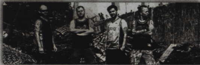
Zespół „Pampeluna” promuje obecnie swój nowy singiel zatytułowany „Siła”.

Choć „Pampeluna” powstała 07.07.07 w Krakowie to jest to dynamicznie rozwijająca się grupa muzyczna z... Koszalina. Zespół charakteryzuje natomiast aż trzech charyzmatycznych