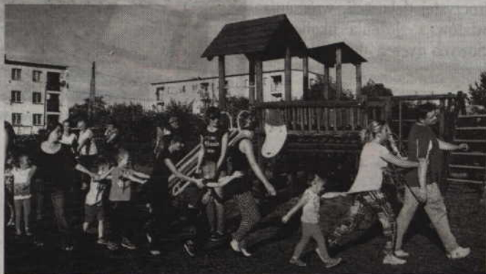
W pikniku wzięli udział także rodzice przedszkolaków.

-Wykorzystujemy różne okazje do tego, aby spotykać się z rodzicami naszych przedszkolaków. Taką okazją było m.in. święto pieczonego ziemniaka. Główny cel takiej imprezy jest zawsze ten sam, stworzenie możliwości do zacieśnienia kontak-