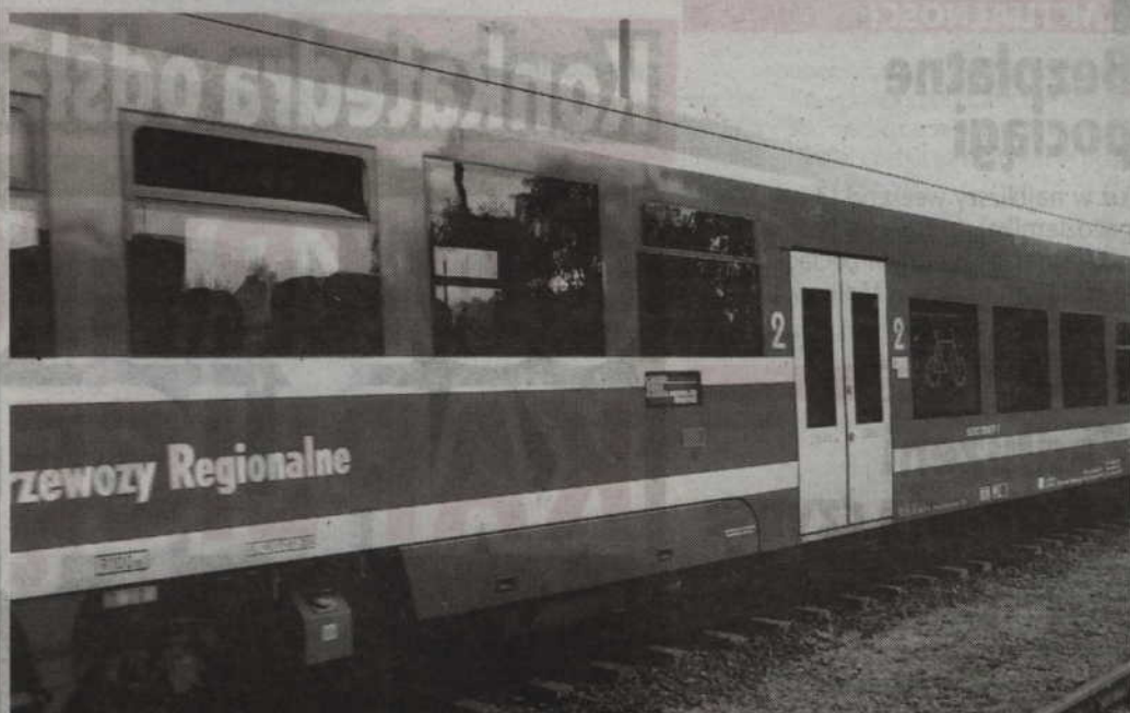
Rozkład jazdy bezpłatnych pociągów

ności lokalnego systemu transportowego w ramach Szwajcarsko - Polskiego Programu Współpracy”. Pociągi jeżdżące na tej trasie będą obsługiwane nowoczesnymi spalinowymi zespołami trakcyjnymi SA133 pozyskanymi przy współfinansowaniu z Funduszu Szwajcarsko - Polskiego. (f)