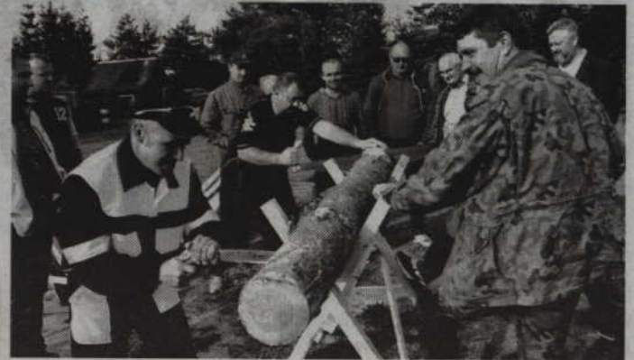
Jedna z konkurencji rywalizacji drwali, cięcie piłą typu „moja-twoja”.

-W trzeciej konkurencji początkowo uczestnicy mieli przecinać drzewo piłą ręczną. Stwierdziliśmy jednak, że nie ma już takich typowych pił ręcznych, które dobrze by cięły. Zakupiliśmy więc zwykłe piły typu moja-twoja i zrobiliśmy konkurencję zespołową. Trzy dwuosobowe