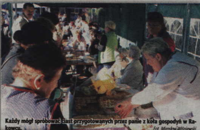
Każdy mógł spróbować ciast przygotowanych przez panie z koła gospodyń w Rakowcu.

Na scenie wysłuchać można było Ludowego Zespołu „Psio-