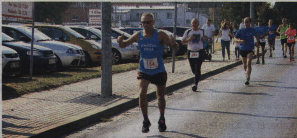
Jeszcze parę kilometrów i już będzie metal

Podczas maratonu we Wrocławiu miał jedną ciekawą przygodę. Po ukończeniu trasy wręczono mu medal, ale po chwili organizatorzy poprosili go, aby otrzymany przed chwilą medal zdjąć. Jego medalem nagrodzono przebiegającą obok niego pewną panią. Po przebiegnięciu mety okazało się, że ta zawodniczka