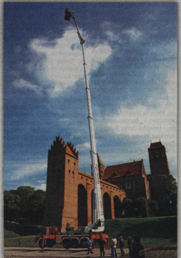
Pokaz działania strażackiego wysięgnika.