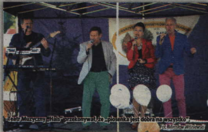
Teatr Muzyczny „Hals” przekonywał, że „piosenka jest dobra na wszystko”.