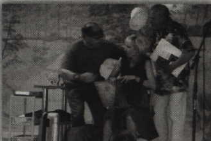
Spektakl zobaczyć będzie można w sali PCKiS przy ul. Łąkowej.

PRABUTY. Prabuckie Centrum Kultury i Sportu zaprasza na kolejny spektakl Grupy Teatralnej Jerzego Majdy. Tym razem mieszkańcy przeniosą się do „Sanatorium pod Amorkiem”, gdzie poznają uzdrowiskowe perypetie głównych bohaterów, przeplatane światowymi szlagierami muzyki rozrywkowej. Spektakl zobaczycie będzie można w najbliższy piątek - 2 października, w sali PCKiS przy ul. Łąkowej. Wstęp wolny.