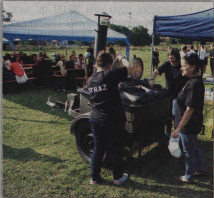
Podczas pikniku nie mogło oczywiście zabraknąć strażackiej grochówki.