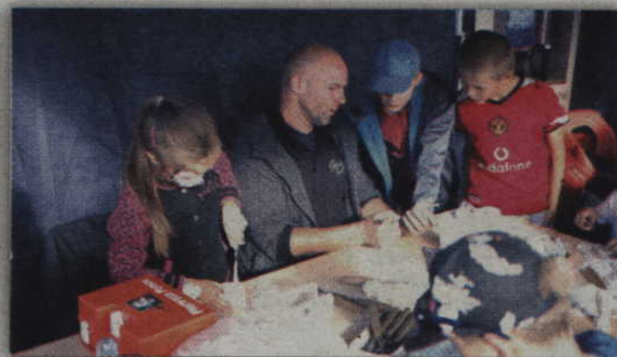
Na jednym ze stoisk można było m.in. spróbować swych sił w rzeźbie.