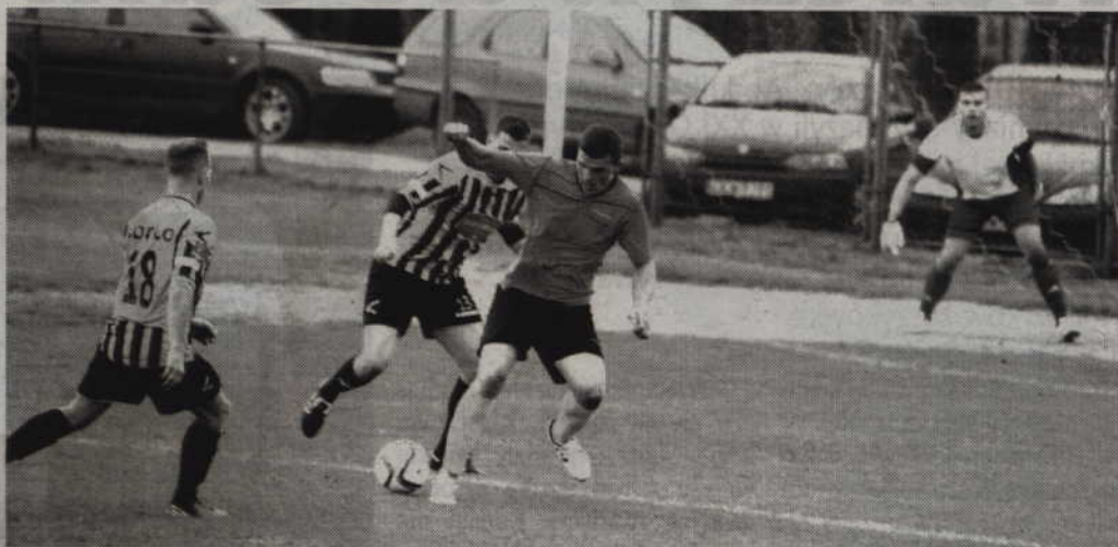
Kibice oglądający pucharowe starcie Wisły Korzeniewo z kwidzyńskim Rodłem doczekali się aż 10 bramek.