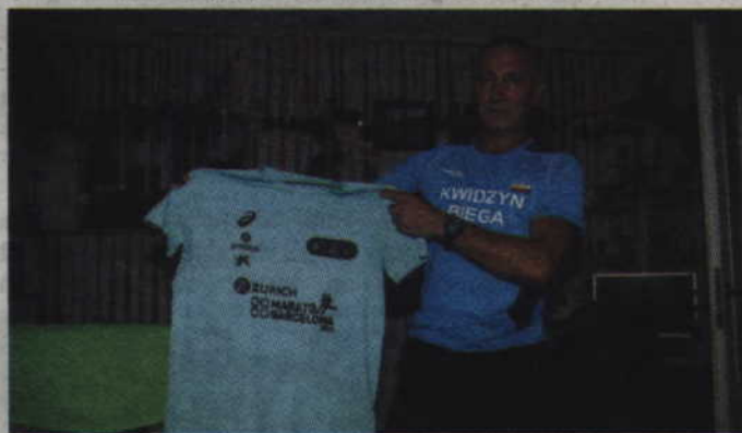
Z każdego biegu przywozi najróżniejsze gadzety, na zdjęciu koszulka z tegorocznego maratonu w Barcelonie

ślynniejszych maratonów świata – maratonie w Nowym Jorku. W tym roku to jego marzenie się spełni. Pod koniec października leci do Stanów Zjednoczonych i na początku listopada jako jeden z kilkudziesięciu tysięcy zawodników wystartuje w tym jednym z najbardziej prestiżowych biegów świata.