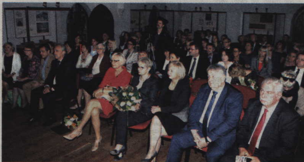
Z okazji 50 lat działalności pracownicy Poradni Psychologiczno-Pedagogicznej w Kwidzynie, postanowili zaprosić do kwidzyńskiego zamku wszystkich, którym poradnia była i jest bliska.

-To program doskonalący percepcję słuchową i rozwijający słownictwo dla dzieci 6 i 7 letnich oraz grupa wsparcia dla dzieci z Zespołem Aspergera i autyzmem. Następną formą pomocy jest grupa wsparcia dla dzieci z zaburzeniami rozwojowymi w wieku przedszkolnym. W swoich działaniach obejmujemy nie tylko dzieci młodsze, ale i starsze. Zaistniała też potrzeba pomocy dziadkom, którzy mieli proble-