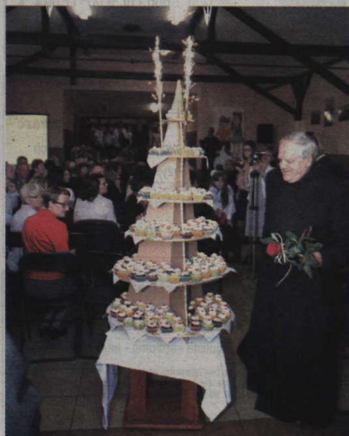
Na uczestników szkolnego święta czekały specjalnie upieczone babeczki.