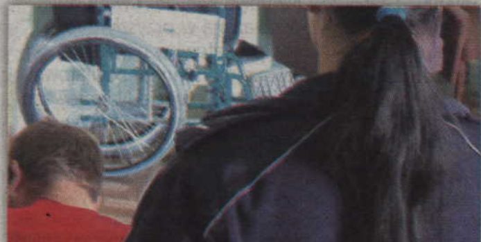
Policjanci odzyskali skradziony wózek i metalowe kosze, które wróciły do prawowitych właścicieli.

KWIDZYN. Kwidzyńscy kryminalni ujęli sprawców kradzieży wózka inwalidzkiego oraz metalowych koszy. Okazali się nimi dwaj mieszkańcy Kwidzyna w wieku 22 i 34 lat. Policjanci odzyskali skradzione mienie, a sprawcy przyznali się do kradzieży. Grozi im 5 lat więzienia.