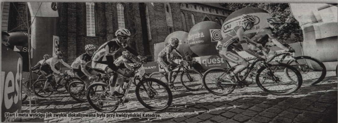
Start i meta wyścigu jak zwykle zlokalizowana była przy kwidzyńskiej Katedrze.