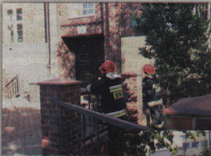
Strażacy dokładnie sprawdzali teren wokół budynku szkoły.

Informacja o ładunku podłożonym w Szkole Podstawowej nr 2 (w budynku „pod zegarem”) pojawiła się w piątek, 2 października. Dyżurny kwidzyńskiej Komendy otrzymał ją telefonicznie o godzinie 13.00.