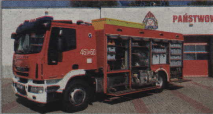
Ma 329 KM i aż 113 pozycje sprzętu, który ma służyć do ratownictwa chemicznego. Nowy, średni samochód będzie wykorzystywała specjalistyczna grupa ratownictwa chemiczno-ekologicznego „Kwidzyn”, która powstaje na bazie kwidzyńskiej jednostki.

Zakup pojazdu został dofinansowany przez Unię Europejską ze środków Funduszu Spójności, w ramach projektu „Zwiększenie skuteczności prowadzenia długotrwałych akcji ratowniczych”. Projekt był realizowany w ramach programu Infrastruktura i Środowisko przez komendanta głównego PSP. Koszt zakupu nowego pojazdu wraz z wyposażeniem to ponad 1,6 mln zł. (jk)