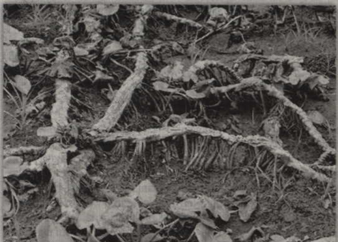
Susza odstoniła korzenie grzebienia białego znajdującego się na terenie Leśnictwa Trzciano.