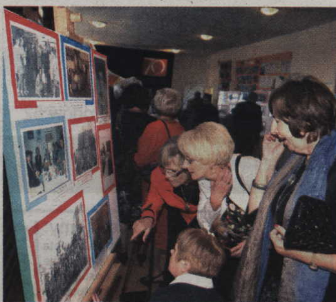
Stare, szkolne fotografie potrafią wywołać wzruszenia i radość.