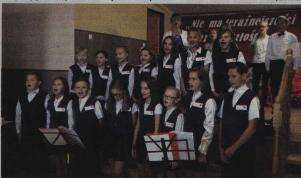
Jubileuszowe uroczystości uświetniły występy uczniów szacownej jubilatki.