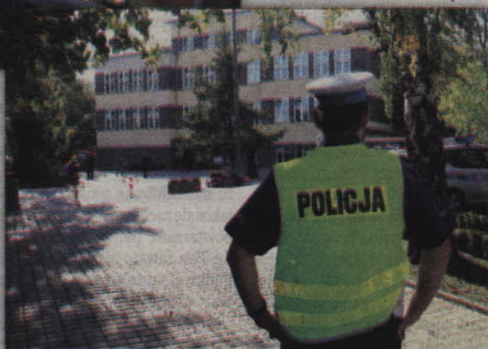
Ze szkolnego budynku ewakuowano łącznie 129 osób.