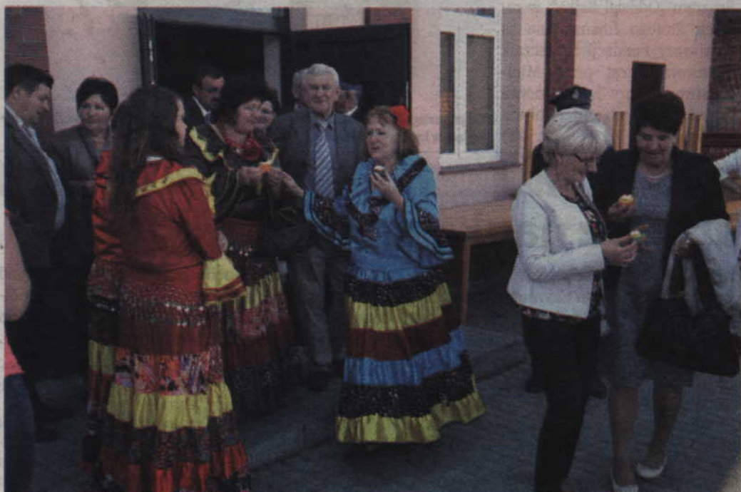
Podczas święta szkoły nie mogło zabraknąć pań z zespołu Cyganeczki.