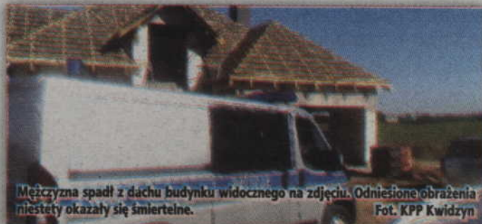
Mężczyzna spadł z dachu budynku widocznego na zdjęciu. Odniesione obrażenia niestety okazały się śmiertelne.

-Ze wstępnych ustaleń policjantów skierowanych na miejsce zdarzenia wynikało, że mężczyzna pracował na dachu budynku (na wysokości ok. 4 metrów), a następnie, z niewiadomych przyczyn, spadł na ziemię - wyjaśnia Anna Filar, rzecznik prasowy Komendy Powiatowej Policji w Kwidzynie. - Obrażenia jakich doznał po upadku okazały się śmier-