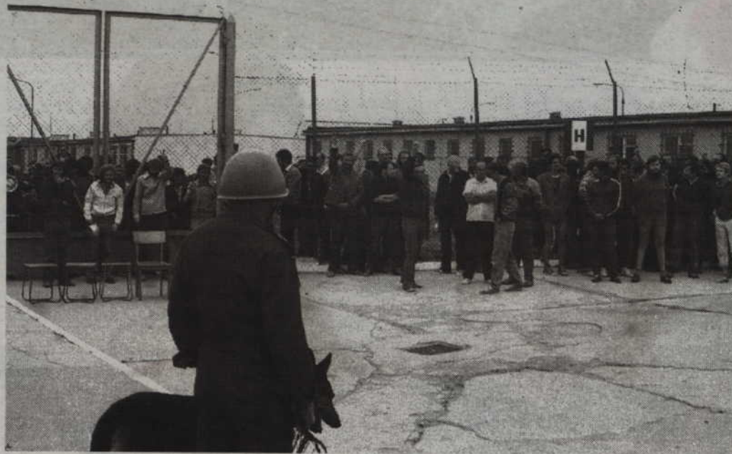
Internowanych osadzono również w kwidzyńskim zakładzie karnym.