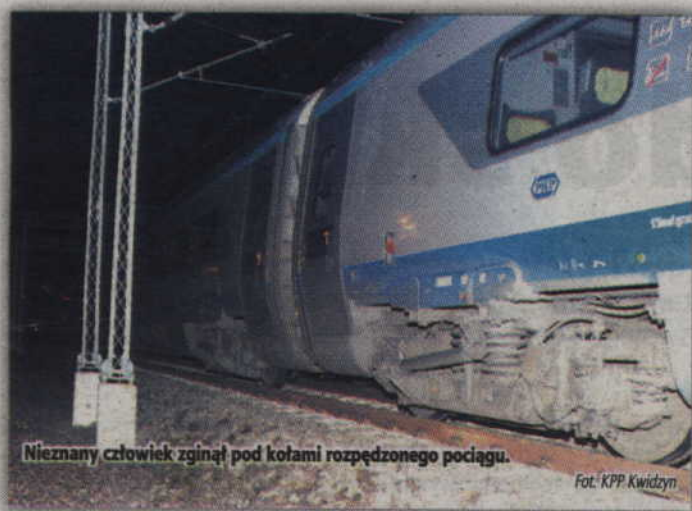
Nieznanego człowieka zginął pod kołami rozjeżdżonego pociągu.