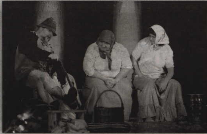
Fragment spektaklu przygotowanego przez aktorów grupy „Super Nova”.

- Graliśmy tę sztukę już kilka lat temu, ale w nieco innej obsa-