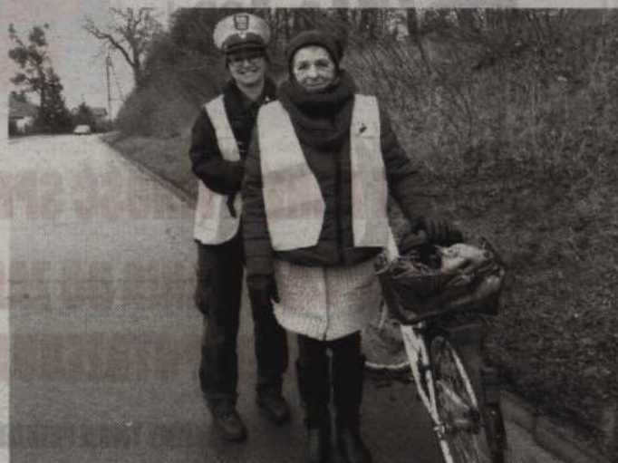
Kamizelki trafią do tych, którzy poruszają się na drodze bez widocznych elementów odblaskowych.

początek gmina zakupiła 500 kamizelek. Część z nich przekazana została dla policji, jednak chętni będą mogli również otrzymać kamizelki w budynku urzędu