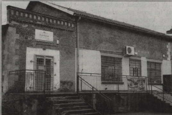
Punkt kasowy PBS w Czarnym Dolnym mieści się w pomieszczeniach należących do GS Gardeja. Po likwidacji rachunki opłacać będzie można w sklepach gminnej spółdzielni. Ryszard Bartosiak

- Jesteśmy bankiem spółdzielczym, działamy na rynku lokalnym, a naszymi klientami są mieszkańcy. Musimy jednak pamiętać, że banki muszą zarabiać na siebie. W całym sektorze bankowym zyski spadają, marże się kurczą i banki starają się szukać oszczędności po stronie kosztów. W Wandowie roczny czynsz wynosił 6,8 tys. zł., a w Czarnem Dolnym 6,1 tys. zł. Przychody roczne, a nie zyski, w Wandowie wyniosły 10 tys. zł, a