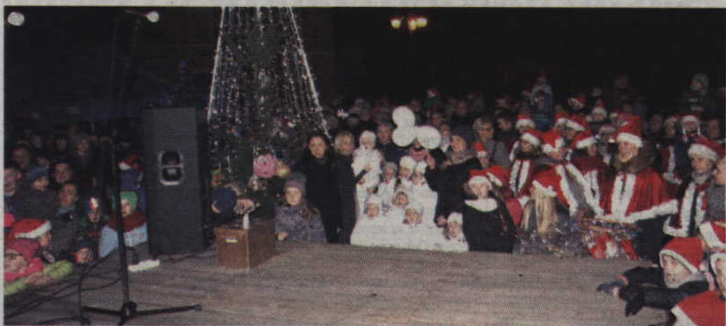
Ponieważ nie było śniegu św. Mikołaj przyjechał do Prabut bryczką.

PRABUTY. Mieszkańcy wspólnie uczcili rozświetlenie prabuckiej choinki. W spotkaniu zorganizowanym przez Przedszkole „Bratek” oraz Prabuckie Centrum Kultury i Sportu nie zabrakło także świętego Mikołaja i jego pomocników, którzy pamiętali o najmłodszych i obdarowywali ich słodyczkami.