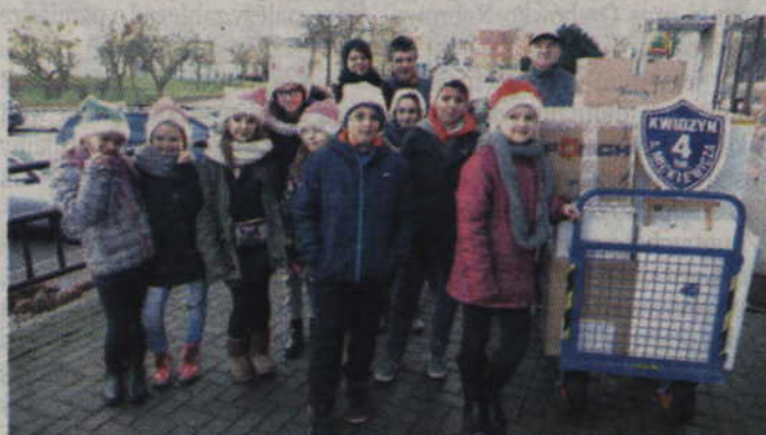
Uczniowie kwidzyńskiej „czwórki” przywieźli paczki przebrani za śnieżynki.