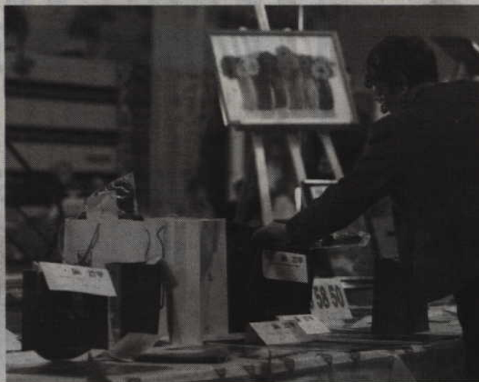
Podczas licytacji będzie można jak zwykle zakupić wiele atrakcyjnych przedmiotów.