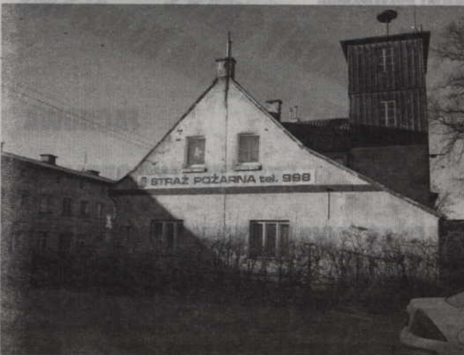
Mieszkańcy chcą przeniesienia strażackiej remizy w inne miejsce.