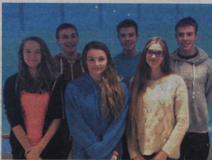
W zawodach w Lublinie wzięła udział sześciuosobowa reprezentacja MTS Kwidzyna.