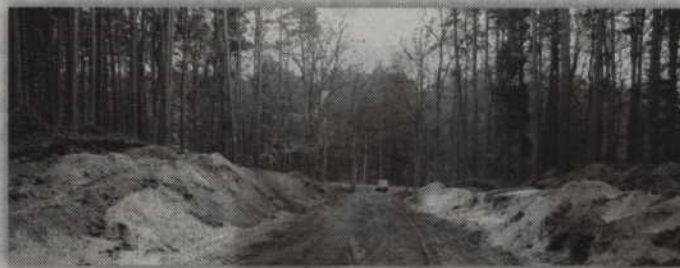
Nowa droga umożliwi nie tylko dojazd do ewentualnego pożaru, ale będzie także wykorzystywana w gospodarce leśnej.

-W kompleksie leśnym nie było do tej pory drogi, która udostępniaby jednostkom straży pożarnej ten obszar. Jeśli wybuchnie pożar, nowa droga umożliwi sprawne pro-