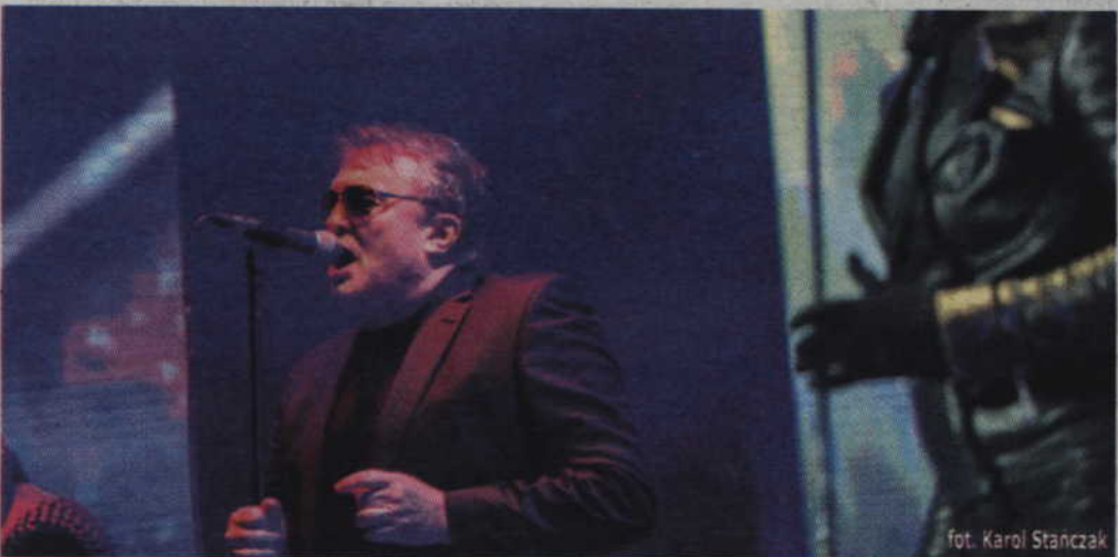
fol. Karol Stanczak

Kilkunastominutowy pokaz fajerwerków gdynianie podziwiali nie tylko ze Skweru Kościuszki, ale też z Mola Południowego oraz Kamiennej Góry.