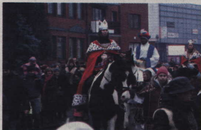
Wspólne świętowanie Objawienia Pańskiego stało się już tradycją parafii pw. Św. Trójcy i Św. Jana Ewangelisty.