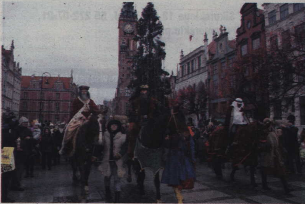
Orszak Trzech Króli w Gdańsku.