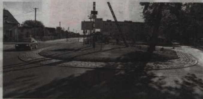
Rondo u zbiegu ulic Kuracyjnej, Chodkiewicza i Brzozowej otrzymało imię generała Władysława Andersa.