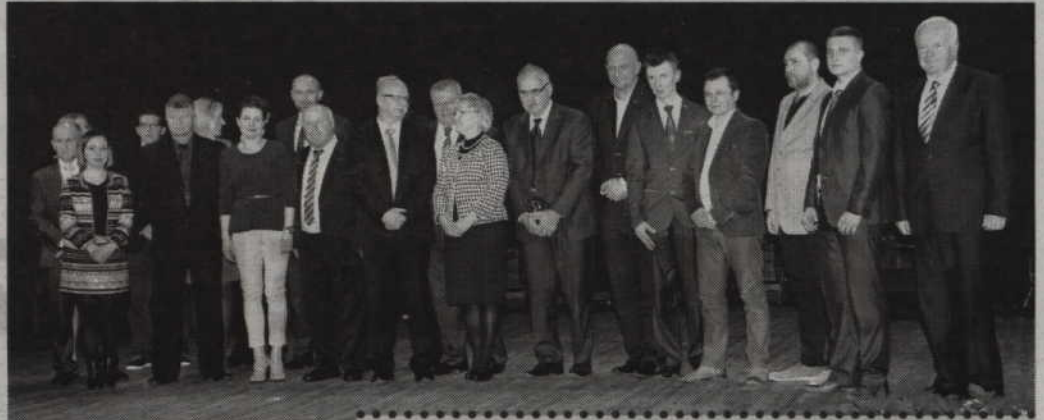
Starosta kwidzyński przyznał nagrody za osiągnięcia w dziedzinach przedsiębiorczości oraz rynku pracy.

- Chcieliśmy podziękować przedsiębiorcom za dotychczasową działalność, ale także podkreślić, że gdyby nie mikro, małe