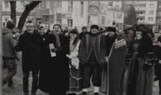
W Prabutach ponownie było barwnie i kolorowo.