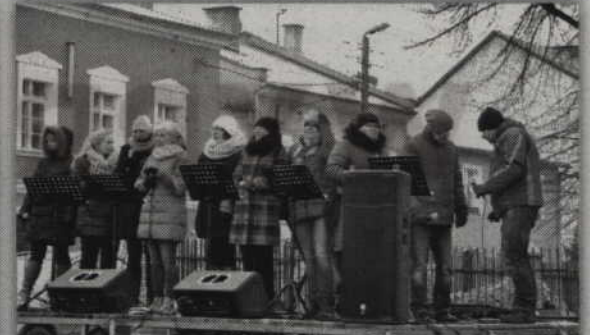
Grupa Jędrzeja zaśpiewała kilka kolęd i pastorałek.