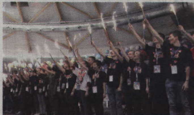
„Świątelko do nieba” w wykonaniu wolontariuszy Orkiestry.