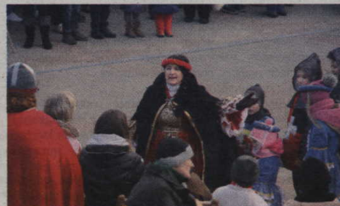
Dobrawa zwróciła się do księcia słowami wyśpiewanymi na melodię „Dumki na dwa serca”.