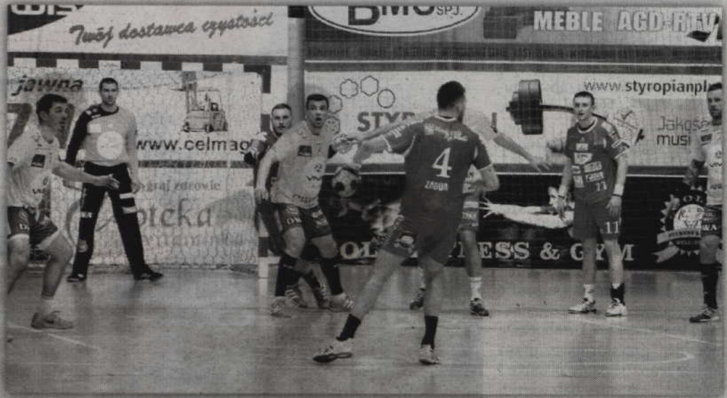
Kwidzynianie stają przed niezwykle trudnym zadaniem, bowiem ich rywalem w pucharze będzie zespół Vive Tauron Kielce.