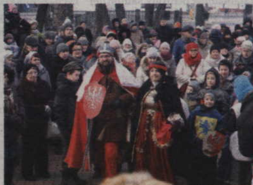
Księżna para złożyła w symbolicznym darze złożyła natomiast godło z wizerunkiem białego orła na czerwonym tle.