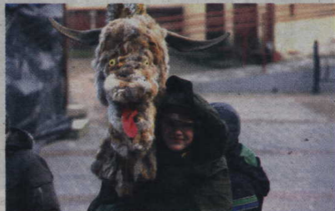
Podczas przemarszu nie mogło zabraknąć m.in. turonia.