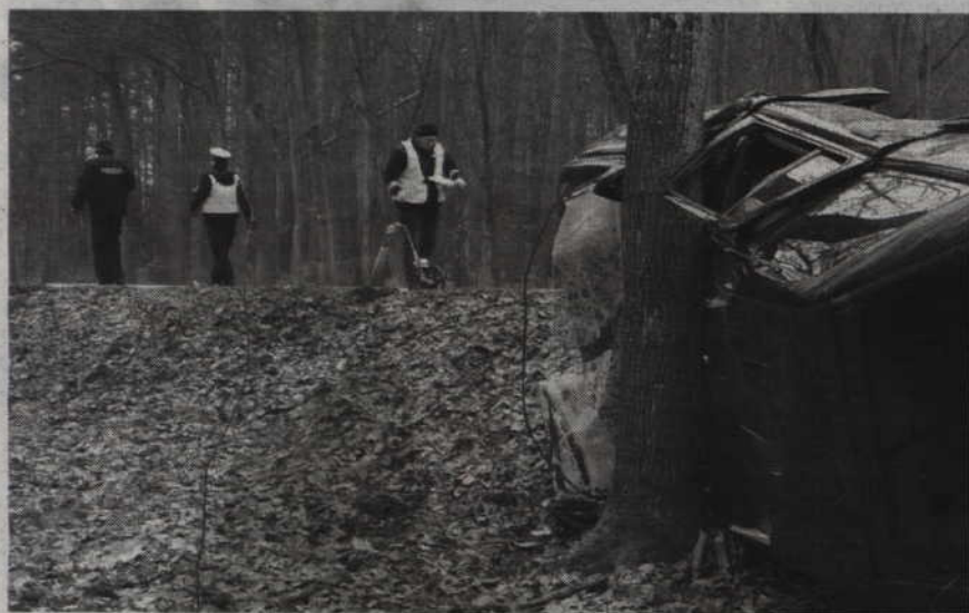
Kierowca landrovera stracił panowanie nad autem, po czym dachował i uderzył w przydrożne drzewo.