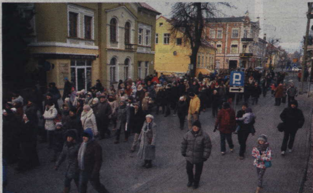
Wierni w drodze do stajenki umiejscowionej przed kościołem św. Trójcy.