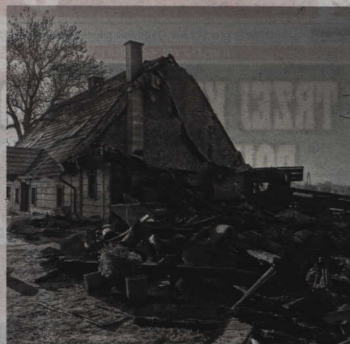
Na ok. 1,1 mln zł szacowano straty jakie spowodował pożar kompleksu budynków mieszkalno-magazynowych w Małowskich Pastwiskach.

Po ugaszeniu ognia strażacy rozebrali elementy budynków. Sprawdzeni pomieszczenia objęte pożarem przy pomocy kamery termowizyjnej. W akcji gasze-