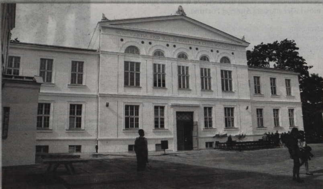
Renowacja zabytkowego gmachu ZSP nr 1 została wysoko oceniona przez Narodowy Instytut Dziedzictwa. Budynek znalazł się w grupie 30 obiektów z całej Polski zakwalifikowanych do konkursu Generalnego Konserwatora Zabytków.

- To obszerny materiał, w którym mogą występować braki. Według mojego rozpoznania na terenie powiatu jest ok. 130 cmentarzy. W gminnych ewidencjach zabytków jest ich ok. 80. To materiał nad którym będziemy pracowali cały czas. Ewidencje gminne są bardzo zróżnicowane. Gmina Sadlinki ma więcej zabytkowych obiektów niż mia-