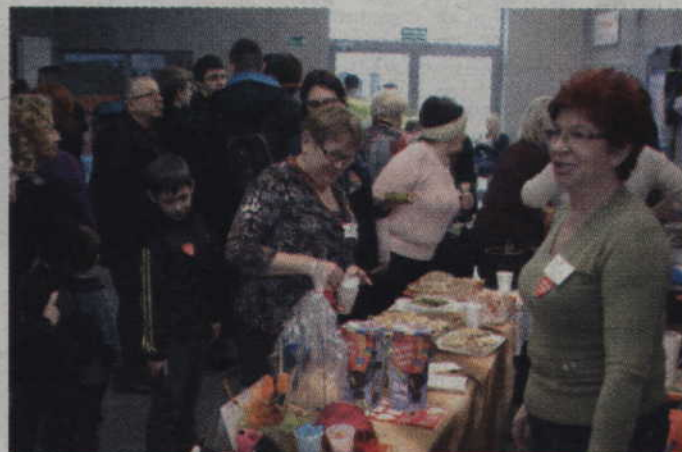
Gofry okazały się hitem stoiska Stowarzyszenia „Seniorzy 50+”.