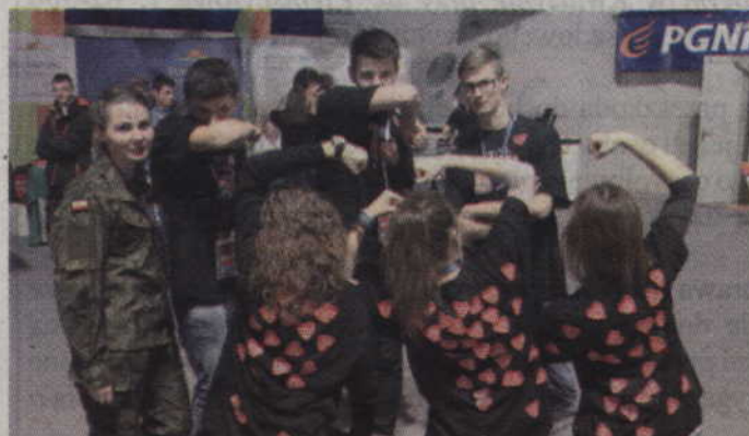
Podczas finału spotkaliśmy również wolontariuszy z II klasy II LO w Kwidzynie.

Nie zabrakło również stałych punktów Orkiestrowego grania. W południe już po raz szósty odbył się bowiem Bieg „Policz się z cukrzycą”.