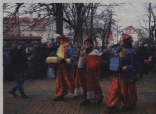
Trzej Królowie złożyli Dzieciąciu w darze złoto, mirrę oraz kadzidło.