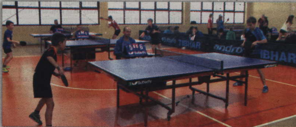
Finałowe rozgrywki Igrzysk oraz Gimnazjady odbywały się w Gdyni.