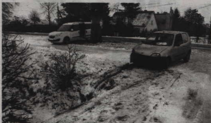
Kierująca seicento straciła panowanie nad autem i wjechała do przydrożnego rowu.