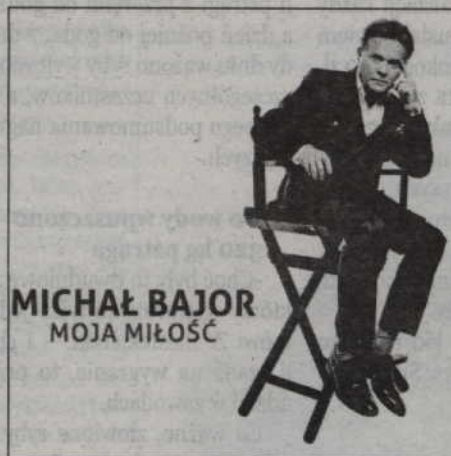
MICHAŁ BAJOR MOJA MIŁOŚĆ

Choć trudno w to uwierzyć, Michał Bajor śpiewa już od ponad 40 lat, jak nikt inny łącząc oryginalny styl z najwyższą jakością. „Moja miłość” to 19. płyta w jego dyskografii i zarazem trzecie spotkanie mistrza interpretacji z mistrzem słowa - Wojciechem Młynarskim. Po albumach „Od Piaf do Garou” i „Moje podróże” przyszedł czas na zbiór 17 najpiękniejszych piosenek o miłości. Większość z nich to wielkie przeboje, trwale zapisane w historii polskiej muzyki rozrywkowej i sercach kilku pokoleń słuchaczy, jak np. „Prześlizna wiolonczelistka”, „Odkryjemy miłość nieznaną”, „Och, życie kocham cię nad życie” czy „Nie ma jak u mamy”. Na płycie pojawiły się także dwie piosenki premierowe, napisane przez Wojciecha Młynarskiego specjalnie dla Michała Bajora, a zaśpiewane w duetach z Alicją Majewską („Miłość jest tylko jedna”) i Anną Wyszkonii („Ja kocham, Ty kochasz”). (fox)