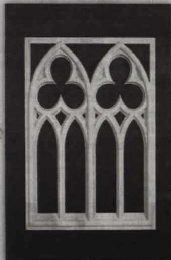
W warsztacie stolarskim wykonano okna gotyckie wyrzeźbione w drewnie dębowym.

KWIDZYN. Trwają prace nad dwoma obszarami wystroju i wyposażenia kaplicy Najświętszego Serca Pana Jezusa w Kwidzynie, działającej przy klasztorze Sióstr Benedyktynek Misjonarek. Kaplica ma być w całości dostosowana do celebracji Mszy Trydenckich.