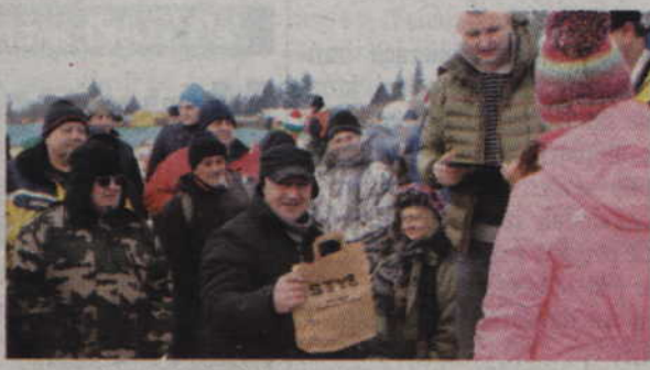
Po wręczeniu nagród dla pięciu najlepszych wędkarzy odbyło się także losowanie nagród rzeczowych.

Praca dodatkowa, atrakcyjna prowizja, również dla emerytów, doświadczenie nie jest wymagane, ale będzie dodatkowym atutem. Tel. 58 554 80 80/ 801 800 200