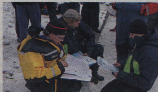
Po dwudniowej rywalizacji organizatorzy zsumowali wyniki poszczególnych zawodników.