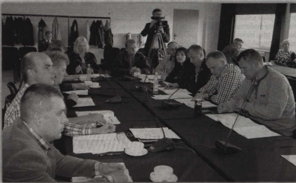
Projekt budżetu na rok 2016 poparło 14 radnych, przy jednym głosie przeciwnym.

Opracowany budżet na rok 2016 jest budżetem stabilnym i prorozwojowym, pozwalającym wykonać zaplanowane inwestycje. Chcemy zrealizować takie zadania, które poprawią jakość życia naszych mieszkańców – poinformo-