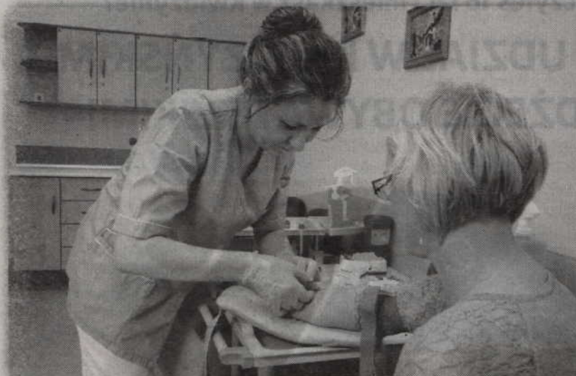
Przypominamy, że darmowe skierowania na badania ważne są jedynie do 29 lutego.

Stosowne skierowania na bezpłatne badanie przesiewowe nerek można otrzymać również w redakcji „Kuriera Kwidzińskiego”. Wystarczy odwiedzić naszą redakcję (ul. Chopina 26, I piętro) we środę, czwartek lub piątek, w godzinach 12.00-14.00.