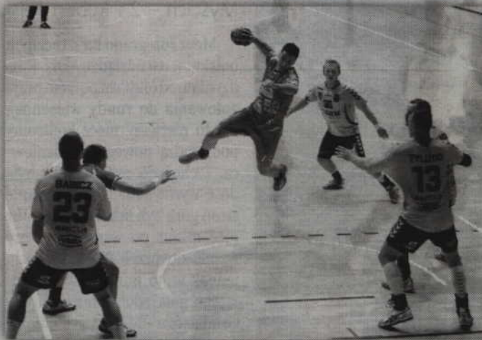
Graczy MMTS czeka m.in. sparingowe starcie z Chrobrym Głogów.

Zawodnicy MMTS Kwidzyn stów siłowych. Przez pierwsze przygotowania do rundy wiosennej rozpoczęli 4 stycznia od testów wydolnościowych i te-