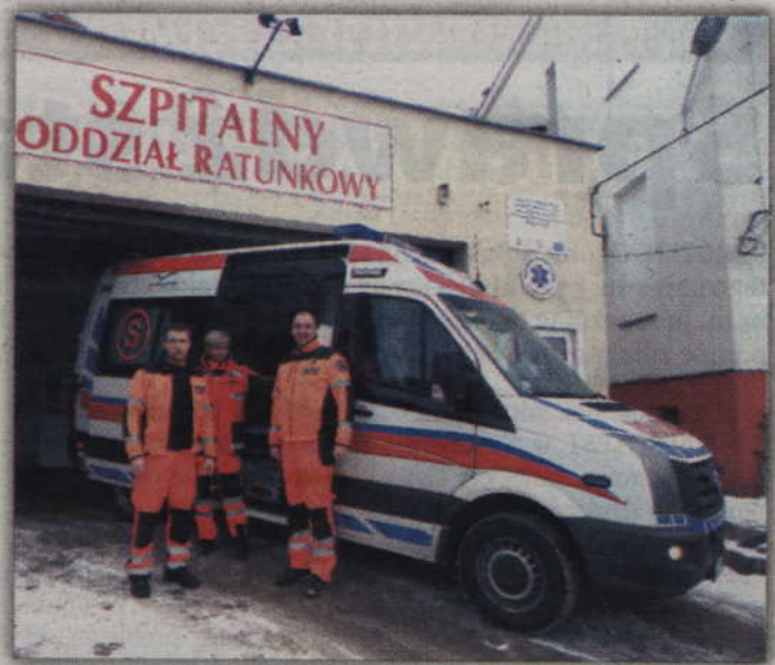
Nowa karetka to nowoczesnie wyposażony Volkswagen Crafter 35.

-Realizując usługi w ramach systemu publicznego, EMC buduje przyjazny model leczenia, dostosowany do potrzeb każdego pacjenta - od lekarza POZ, poprzez porady specjalistyczne, pełną diagnostykę, leczenie szpitalne, do opieki nad ludźmi