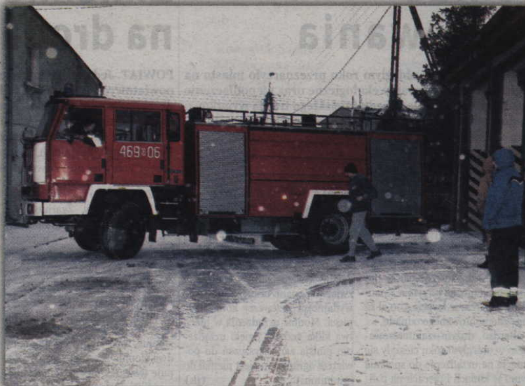
Wjazd do garażu, przy oblodzonej ulicy, wymaga sporych umiejętności.

dobytek i ludzkie życie. Jest nas około 30 strażaków, którzy niosą pomoc. Do poważnych zdarzeń wyjeżdżają zawsze dwa zastępy liczące łącznie 12 strażaków.