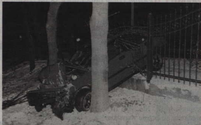
Prowadzący hondę civic 21-latek miał prawie 2 promile alkoholu w wydychanym powietrzu.

Kierowca oraz dwaj 20 - letni pasażerowie pozostali w szpitalu na obserwacji. Funkcjonariusze odholowali natomiast samochód na policyjny parking. Teraz sprawą nietrzeźwego kierującego zajmie się prokurator.