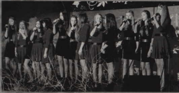
W tegorocznym konkursie rywalizowało 9 zespołów wokalnych.

Sadliński festiwal kolęd i pastorałek to już prawdziwa kulturalna marka, ciesząca się zasłużonym uznaniem wśród miłośników śpiewu. Nie inaczej było również w tym roku. Do Zespołu Szkół w Sadlinkach zjechało bowiem 31 solistów oraz 9 zespołów wokalnych, z 17 szkół województwa pomorskiego. Łącznie na konkursowej scenie wystąpiło 180 wykonawców.