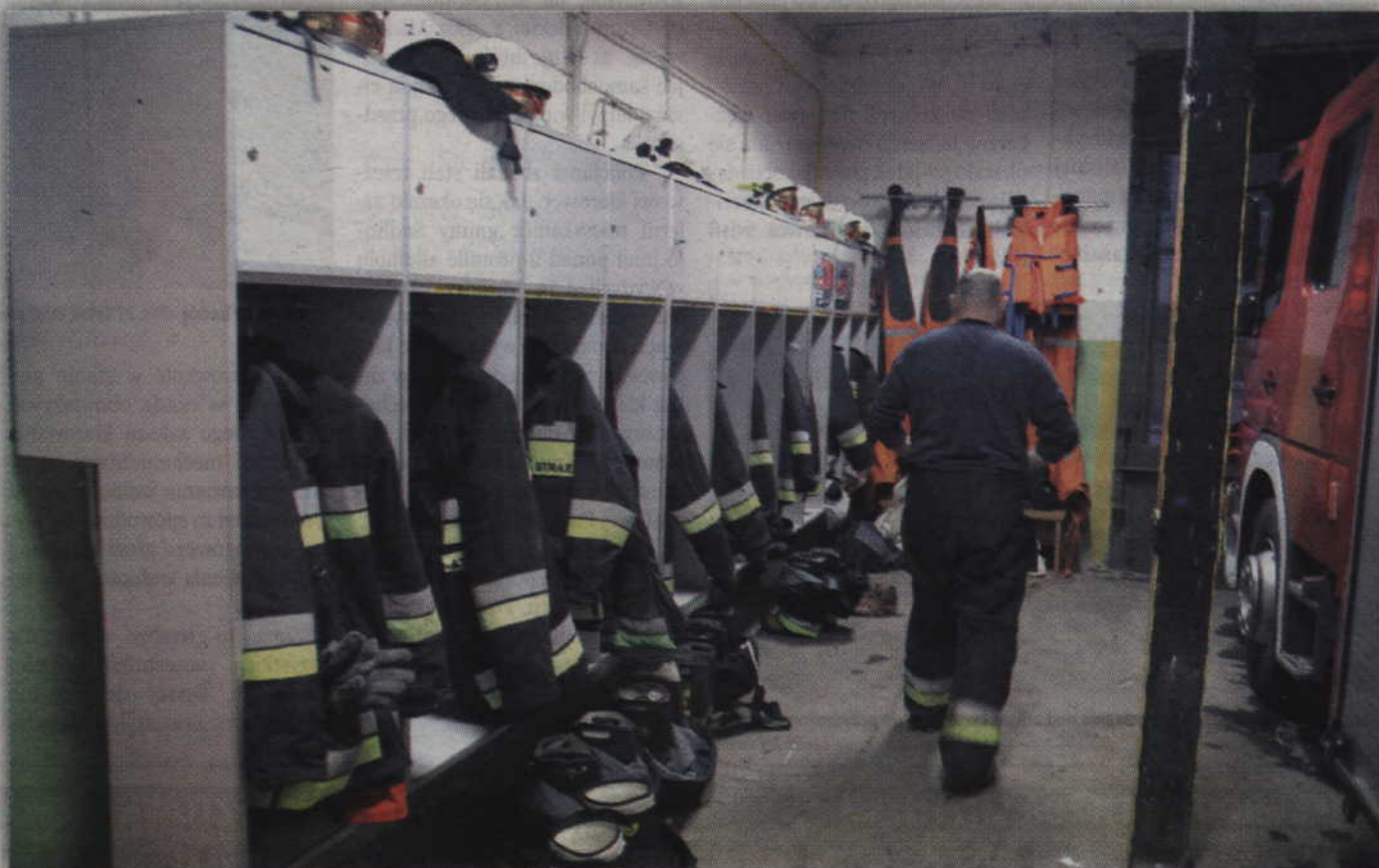
Strażacy nie mają szatni - przebierają się w garażu remizy.

- Jesteśmy jednostką wchodzącą w skład krajowego systemu ratowniczo-gaśniczego. Każdego dnia i nocy ratujemy ludzki