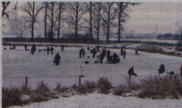
Zawody podlodowe odbywały się na zamrożonej „Przystani Batorego”.