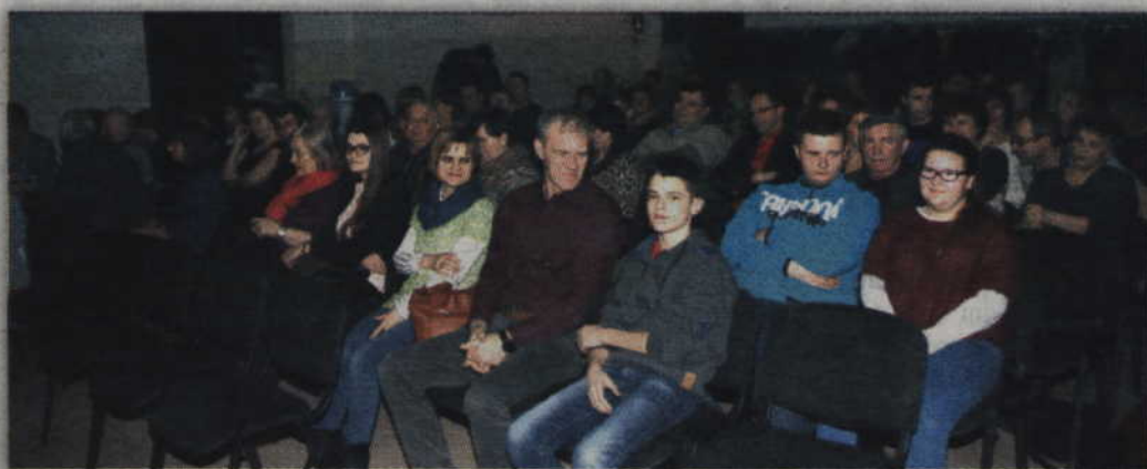
Gardejska publiczność doskonale bawiła się podczas występu kabaretu.

samym początku nie zapytali publiczności o to z czym kojarzy im się Polska. Odpowiedzi publiczności nie zaskakiwały. Pierwszą odpowiedzią jaką usłyszeli było... narzekanie. Podobno jesteśmy w tym prawdziwymi mistrzami świata. Z widowni padały jednak także inne przykłady, w tym dania kulinarne, które choć nawiązują do kuchni naszych sąsiadów, tam zazwyczaj nie są znane.