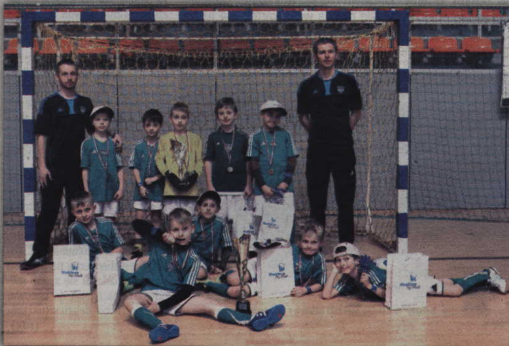
Gospodarze turnieju – zespół DSPN Kwidzyn zajęli ostatecznie drugie miejsce.