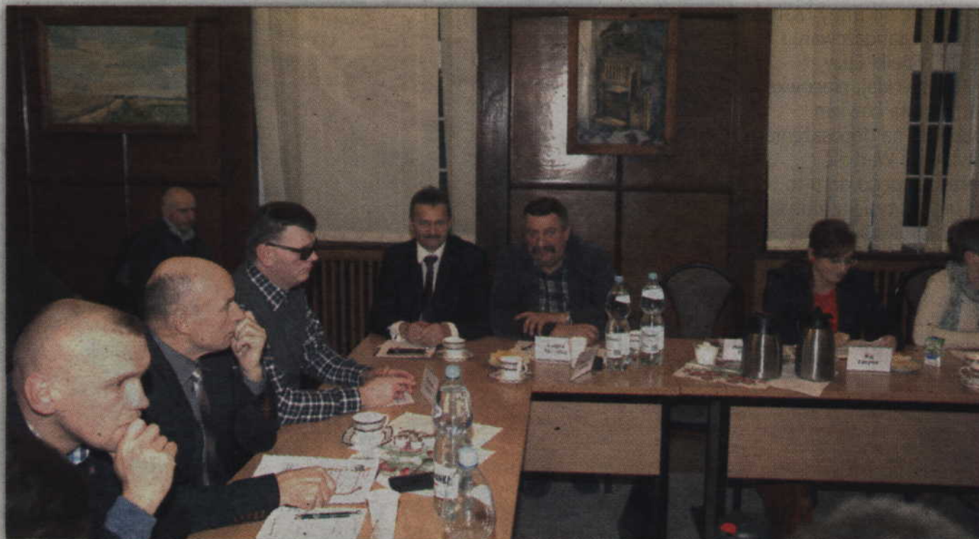
Prabucy radni przyjęli budżet na 2016 rok przy 10 głosach za i 4 przeciw.

-Szanuję ciężką pracę osób, które pracowały nad budżetem. Wiem, że budżet zostanie prze-