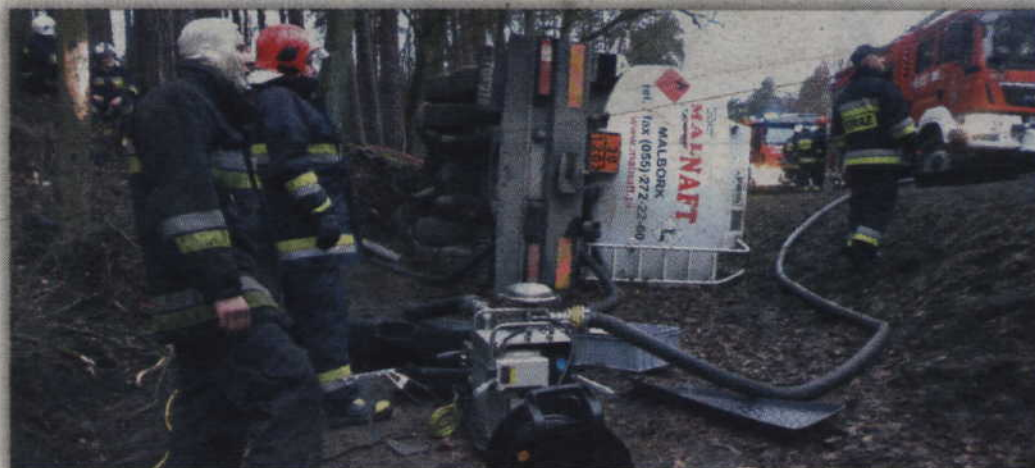
Paliwo z uszkodzonej cysterny zostało przepompowane do autocysterny podstawionej przez właściciela.