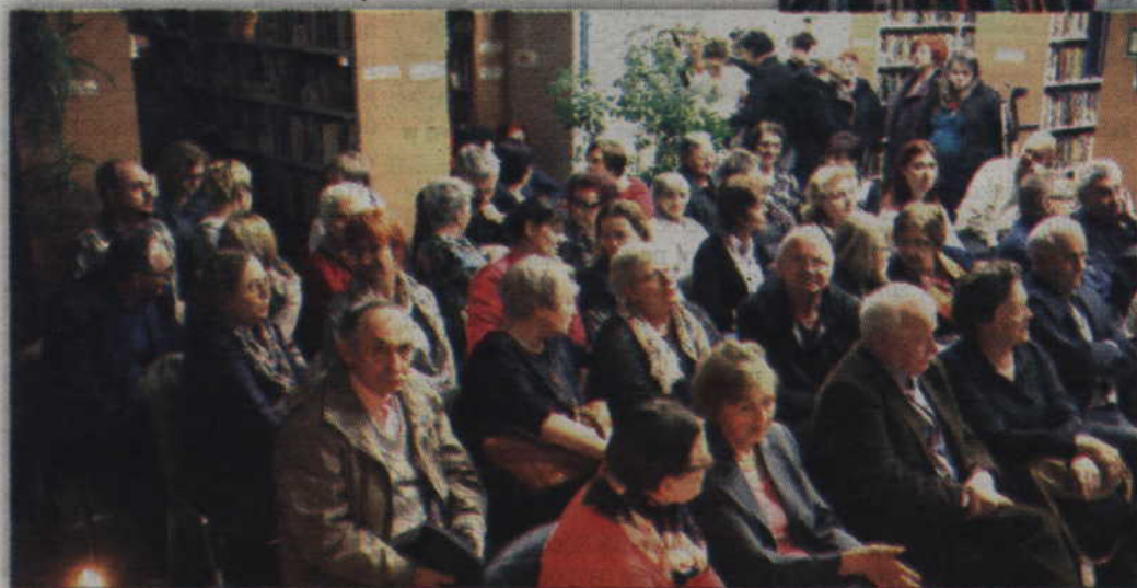
Chcąc zająć dogodne miejsce na widowni trzeba było pojawić się w bibliotece grubo wcześniej.