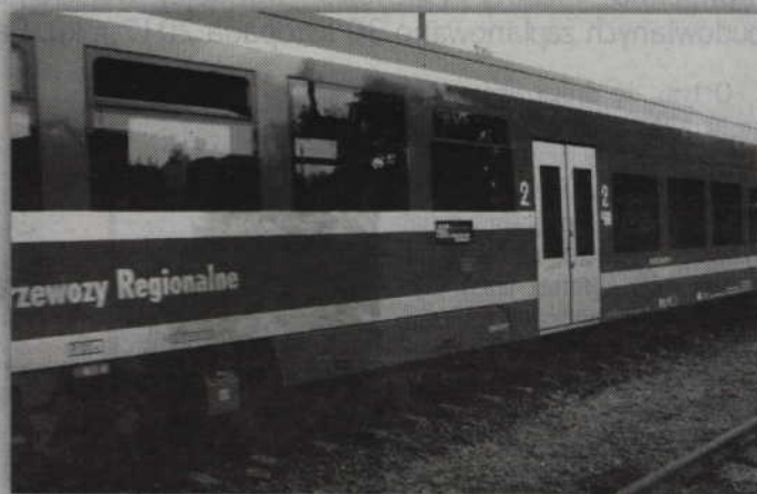
Modernizacja torów sprawi, że pociągi będą mogły poruszać się z prędkością do 150 km/h.

- Zwrócono uwagę, że trzeba wydać bardzo dużo pieniędzy nie na naprawę, ale modernizację torów. Docelowo pociągi będą mogły się poruszać z prędkością do 150 km na godzinę. Mają być położone nowe szyny bezстыkowe. Nie będziemy słyszeli tego charakterystycznego stukotu.