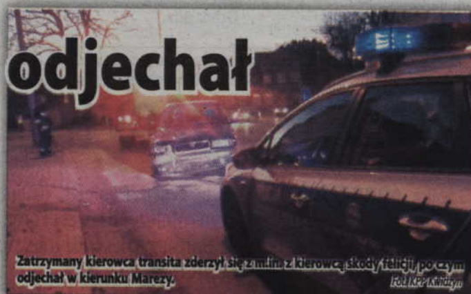
Zatrzymany kierowca transita zderzył się z mł. z kierowcą skody felicia, po czym odjechał w kierunku Marezy.

- Mężczyzna został przebadany alkomatem i wydmuchał