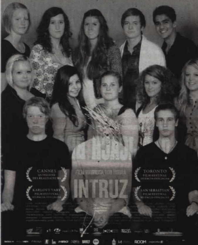
Jednym z filmów prezentowanych na tegorocznym przeglądzie będzie debiut fabularny Magnusa von Horna „Intruz” obsypany nagrodami na festiwalu filmowym w Gdyni.