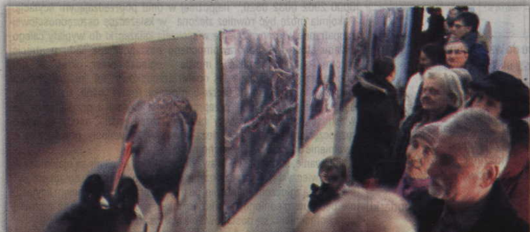
Wystawa fotograficzna znajduje się w dziale przyrodniczym kwidzyńskiego muzeum.