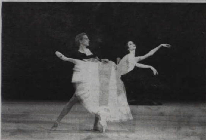
Widowisko Teatru „Bolszoi” to kolejny spektakl baletowy przedstawiony na kinowym ekranie.

KWIDZYN. Kwidzyńskie Centrum Kultury zaprasza na retransmisję baletu Teatru Bolszoi z Moskwy. Tym razem na dużym ekranie kinowym zobaczymy balet „Giselle”. Widowisko obejrzyć będzie można we czwartek - 4 lutego o godz. 19.30. Bilety, w cenach: 28 zł - normalny i 24 zł - ulgowy, nabywać można w kasie kina.