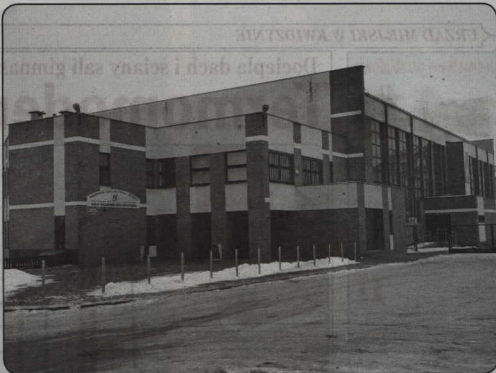
Hala sportowa przy Gimnazjum nr 2 zostanie w tym roku zmodernizowana. Inwestycja ma przede wszystkim rozwiązać problem słabej izolacji cieplnej i niedogrzanania obiektu w okresie zimowym.

Hala sportowa przy Gimnazjum nr 2 zostanie w tym roku zmodernizowana. Inwestycja ma przede wszystkim rozwiązać problem słabej izolacji cieplnej i niedogrzanania obiektu w okresie zimowym. Bywa, że z powodu niskiej temperatury trzeba było odwoływać zajęcia.