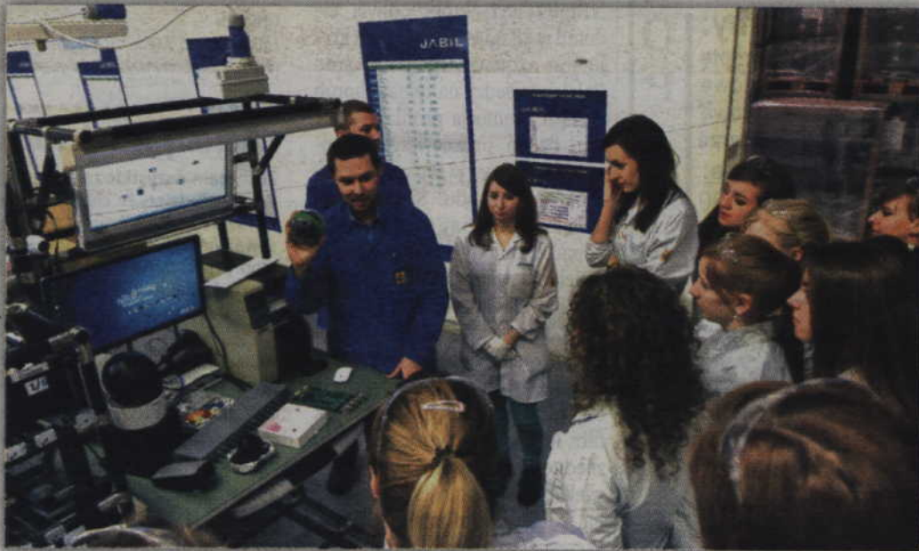
Studenci są stałymi gośćmi kwidzyńskiego zakładu. Podczas jednej z takich wizyt Jabil odwiedziło 93 studentów Politechniki Gdańskiej i Politechniki Lubelskiej.