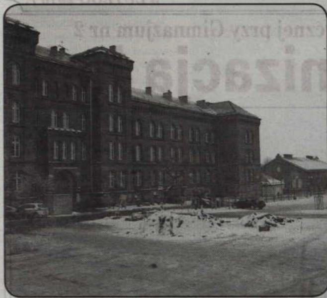
W tym roku dokończona zostanie przebudowa terenu po byłej jednostce wojskowej przy ulicach 11 Listopada i Grudziądzkiej.

W tym roku dokończona zostanie przebudowa terenu po byłej jednostce wojskowej przy ulicach 11 Listopada i Grudziądzkiej. Ostatni etap inwestycji został rozpoczęty w ubiegłym roku. Wcześniej wykonano już wszystkie prace związane z rozdziałem kanalizacji sanitarnej. Wykonane zostało też oświetlenie.