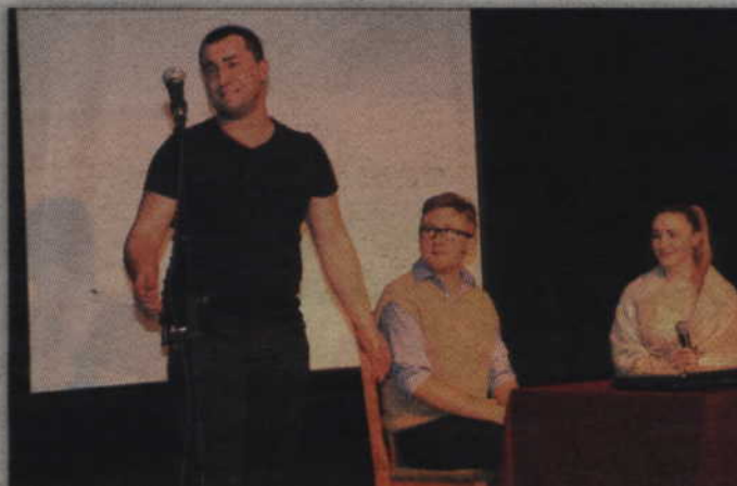
Kieleccy satyrycy do wspólnej zabawy zaprosili także osobę z publiczności.