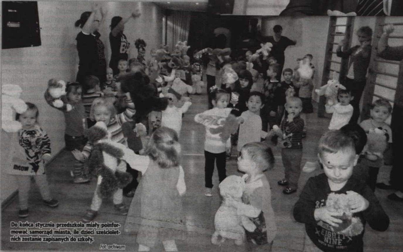
Do końca stycznia przedszkola miały poinformować samorząd miasta, ile dzieci sześciolatków zostanie zapisanych do szkoły.