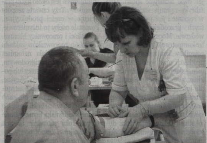
W 2013 roku Kampania NEFROTEST gościła również w Kwidzynie.

Stosowne skierowania na bezpłatne badanie przesiewowe nerek można otrzymać również w redakcji „Kuriera Kwidzyńskiego”. Wystarczy odwiedzić naszą redakcję (ul. Chopina 26, I piętro) w czwartek lub piątek w godzinach 12.00-14.00.