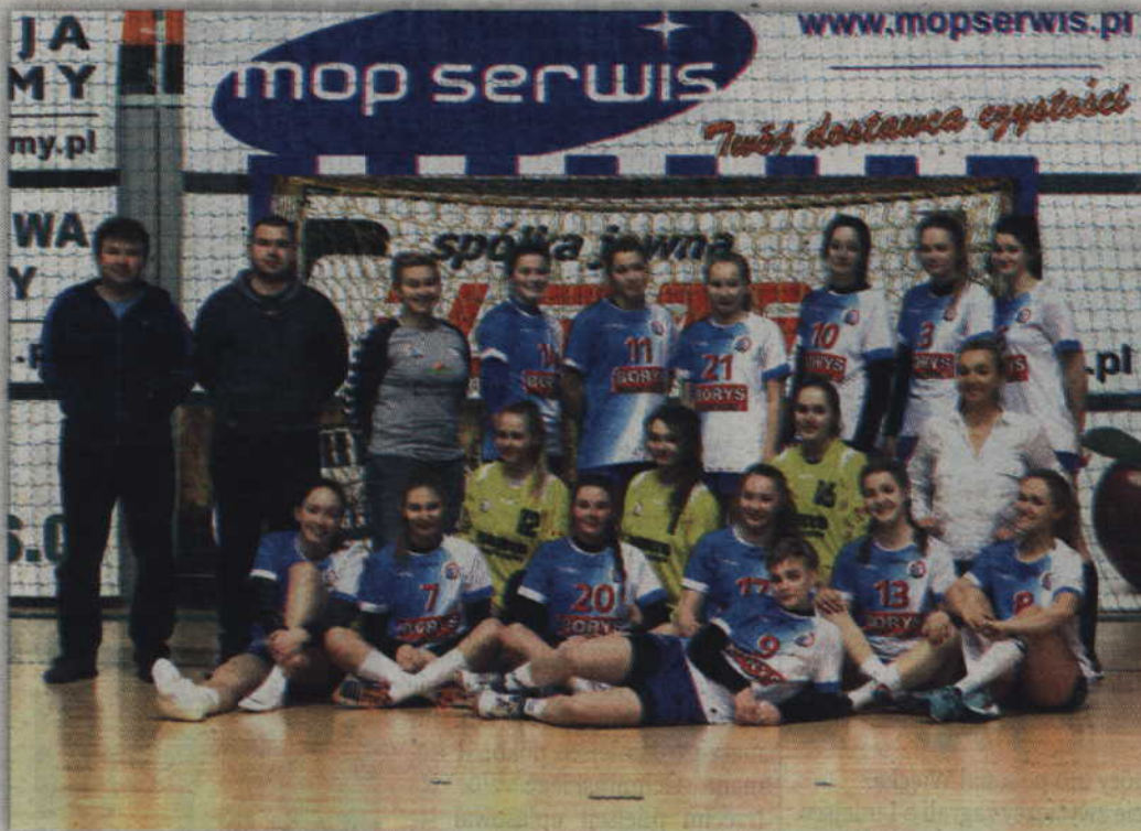
Juniorki MTS Kwidzyn powalczą o awans do półfinału Mistrzostw Polski.