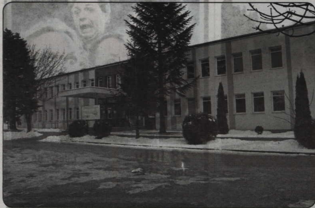
Dobiega końca modernizacja Ośrodka Terapii i Rehabilitacji dla Dzieci. Placówka zajmuje się likwidacją barier w komunikowaniu się dzieci niepełnosprawnych lub zagrożonych niepełnosprawnością.

Dobiega końca modernizacja Ośrodka Terapii i Rehabilitacji dla Dzieci. Placówka zajmuje się likwidacją barier w komunikowaniu się dzieci niepełnosprawnych lub zagrożonych niepełnosprawnością. Znana jest nie tylko w Kwidzynie, ale także w kraju między innymi z nowatorskich metod terapii.