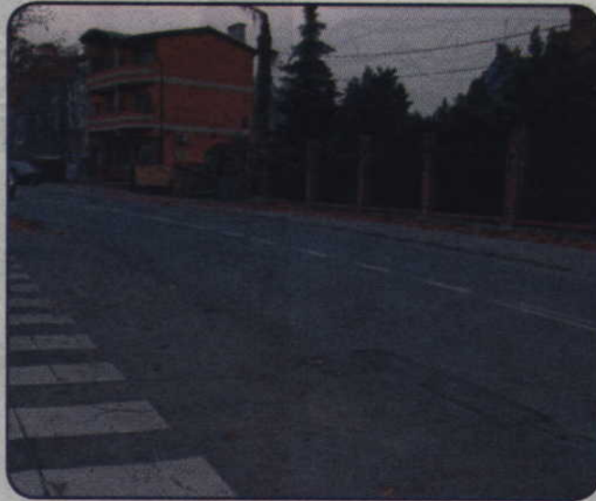
Samorząd miasta we współpracy z Zarządem Dróg Wojewódzkich w Gdańsku wyremontuje w tym roku ulicę Hallera. To odcinek drogi wojewódzkiej. Prace zostaną wykonane na odcinku od skrzyżowania z ulicą Batalionów Chłopskich do skrzyżowania z ul. Łużycką.

Wojewódzki Zarząd Dróg zajmie się budową nowej nawierzchni ulicy Hallera. Po zakończeniu prac samorząd miasta chciałby przekwalifikować drogę wojewódzką na gminną, na odcinku od Batalionów Chłopskich do granicy miasta. W tegorocznym budżecie samorząd miasta zaplanował na realizację inwestycji ponad 1,4 mln zł.