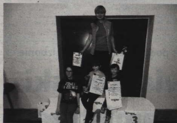
Wspólne zdjęcie rywalizujących w kategorii pań i kategorii młodzieżowej.