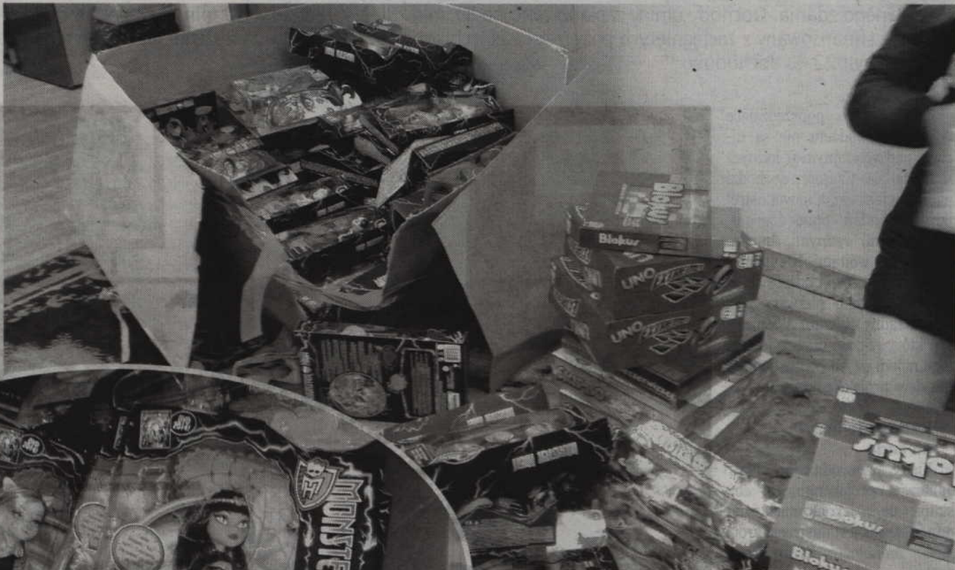
Wartość przekazanych szkole zabawek to około 22 tysięcy złotych.

- W większości są to lalki Monster High, ale jest także sporo fantastycznych