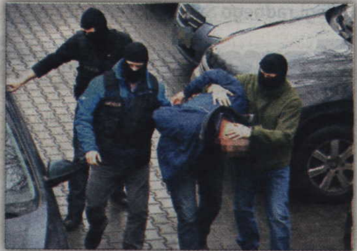
W tej ogólnopolskiej akcji funkcjonariusze zatrzymali 34 osoby oraz zabezpieczyli 106 kg dopalaczy.

Policjanci zabezpieczyli też 80 litrów substancji psychotropowych, z których możliwe jest wyprodukowanie tzw. pigułki gwałtu. W domach