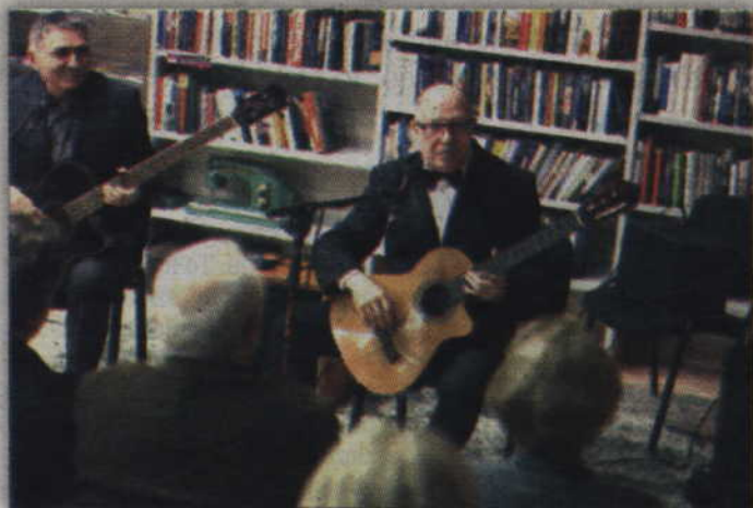
Podczas koncertu Alosza Awdiejew raczył widzów zarówno muzyką, jak i licznymi anegdotami.

RYJEW. Alosza Awdiejew, choć ma już 76 lat, nadal gromadzi tłumy wiernych słuchaczy. Przekonać się mogli o tym uczestnicy jego koncertu, który odbył się w Gminnej Bibliotece Publicznej w Ryjewie. Miłośnicy jego twórczości wykorzystali dosłownie każdy wolny kąt, aby móc delektować się muzyką i humorem tego artysty.