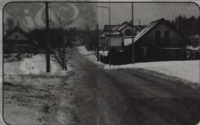
W tym roku zostanie rozpoczęta budowa ul. Chmielnej. Realizację inwestycji zaplanowano na dwa lata.

- W tym roku zaplanowaliśmy w budżecie 900 tys. zł. Być może przyspieszymy jednak wykonanie tego zadania, gdyż nie otrzymamy dofinansowania z tzw. schetynówki na przebudowę ulicy Żwirowej oraz skrzyżowania ulic Żwirowa i Lotnicza. Przy najmniej takie mamy na razie wstępne informacje. To kosztowna inwestycja. Szacunkowy koszt to ok. 7 mln zł. Jeśli nie rozpoczniemy tej inwestycji, to wówczas skoncentrujemy się na budowie ul. Chmielnej - twierdzi Piotr Halagiera.